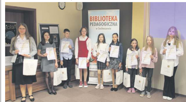
Laureaci konkursu „Wydajemy własną książkę”

Pod takim hasłem odbyły się tegoroczne obchody Ogólnopolskiego Tygodnia Bibliotek. Swoje propozycje w dniach 8-15 maja realizowały dwie sochaczewskie książnice - Miejska Biblioteka Publiczna oraz filia Wojewódzkiej Biblioteki Pedagogicznej.