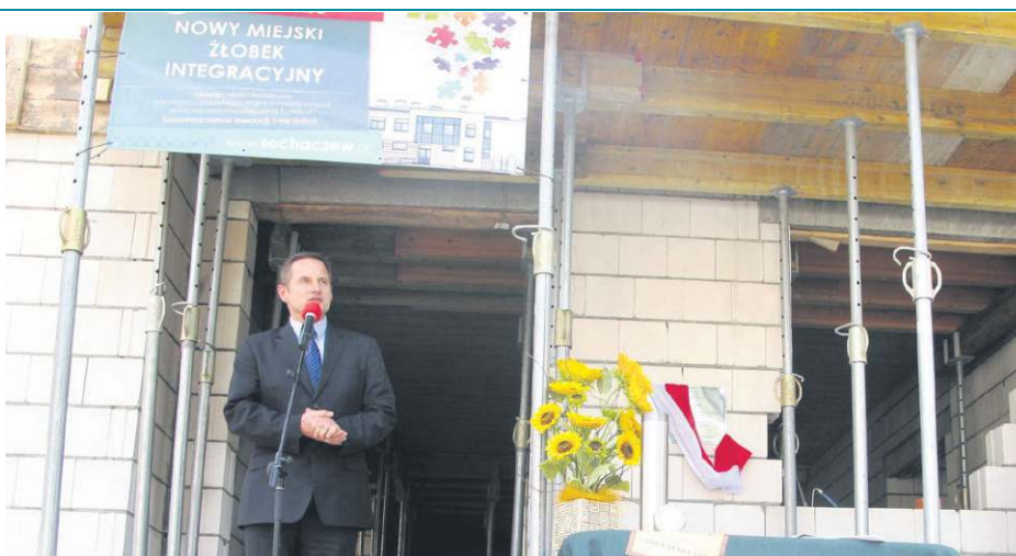
Budowa żłobka przy ul. Kaczorowskiego ruszyła latem 2012 roku i trwała półtora roku

- Tak naprawę przedszkole przejdzie generalny remont, bo zadania, jakie ma wypełniać, wiąże się z przebudową kuchni, wykonaniem nowych łazienek i szatni. Obecnie w budynku znajduje się osiem oddziałów przedszkolnych, ale liczymy, że projektantom uda się wskazać miejsce dla dziewiętego. Planowana przez nas inwestycja obejmie też remont stropu w piwnicy nad pomieszczeniem byłej wózkowni, wykonanie podjazdu