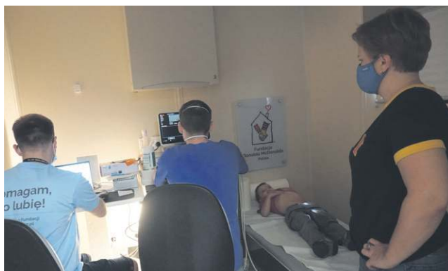
W ambulansie Fundacji Ronald McDonalda przebadano przeszło 120 dzieci w wieku do 6 lat