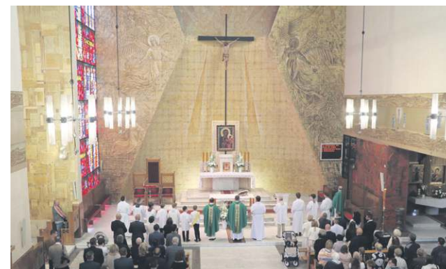
W niedzielę 13 czerwca mieszkańcy oraz władze miasta uczestniczyli w mszy św. w intencji sochaczewian