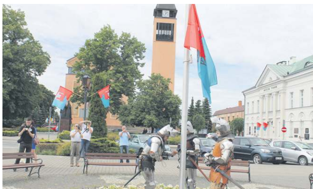
Rozpoczęcie Dni Sochaczewa. Flagę na maszt podnieśli rycerze z Poczty Rycerskiego Herbu Sobol, a później salwa armatnia