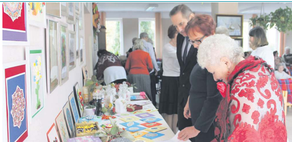
Od stycznia seniorzy będą mieli nowe miejsce spotkań

- W wyniku prowadzonych przez nas badań okazało się, że na ponad 34 tys. mieszkańców miasta (stan na 31.12.2020) aż 26 proc., czyli ponad dziewięć tysięcy, to osoby po 60. roku życia. Niezbędne okazało się więc przygotowanie oferty usług mającej na celu ich aktywne włączenie w życie społeczności lokalnej oraz wspieranie ich w utrzymywaniu jak najdłuższej samodzielności - mówi nam Zofia Berent, dyrektor CUS. - W ramach przeprowadzonego badania seniorzy zgłaszały duże zapotrzebowanie na usługi w zakresie kompleksowej profilaktyki prozdrowotnej oraz zajęć ukierunkowanych na zwiększenie integracji międzypokoleniowej. Istnieje także zainteresowanie profesjonalną pomocą w zakresie wsparcia psychologicznego, prawnego, korzystania z dóbr kultury. Ponadto seniorzy de-