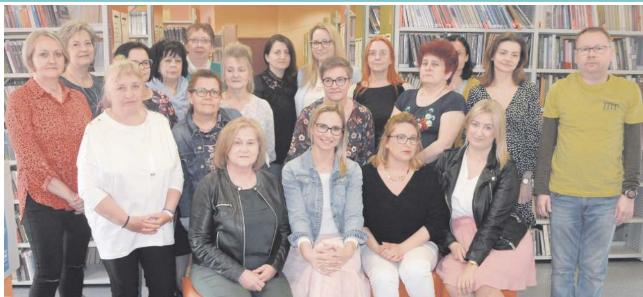
Obecna kadra Miejskiej Biblioteki Publicznej w Sochaczewie

Z dniem 1 stycznia 1955 r., zgodnie z Zarządzeniem Ministra Kultury i Sztuki z września 1953 r. nastąpiło połączenie Po-