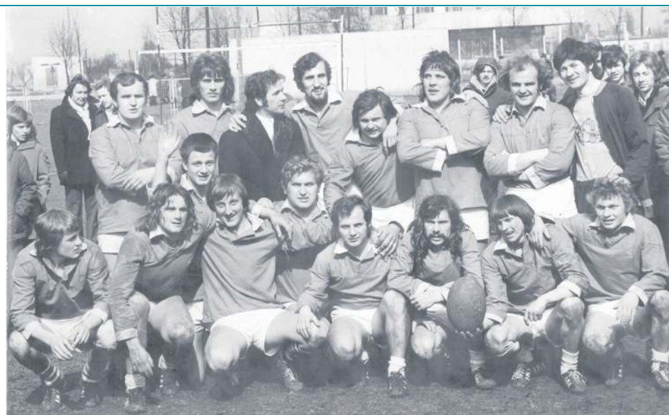
Zdjęcie wykonane 23 marca 1976 roku – na początku pierwszego sezonu Orkana Sochaczew w I lidze rugby, w dużym formacie (A2) wisiało wówczas w witrynach sochaczewskich sklepów. Podpis pod fotografią głosił „To oni wywalczyli awans”.

Na każdych zajęciach zjawiało się ok. 18 osób. To byli koledzy ze szkoły, z podwórka. Chłopaki z Warszawskiej, Wąskiej, Reymonta. Jeden namawiał drugiego. Miałem wtedy 18 lat i byłem jednym z najmłodszych w tej grupie.