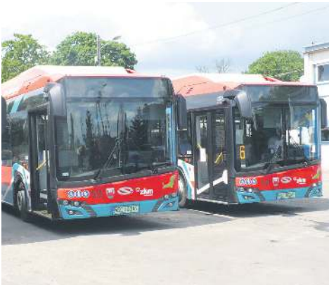
10,4 mln zł ratusz przeznaczył na zakup nowych autobusów elektrycznych oraz kompleksową przebudowę pierwszego miejskiego odcinka ul. 15 Sierpnia