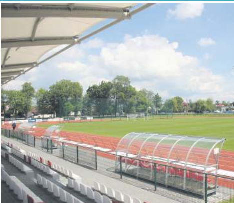
Środowisko sportowe zyskało nowoczesne boisko z syntetyczną bieżnią, a ludzie kultury piękny amfiteatr. Inwestycje kosztowały 12,4 mln zł

Przede wszystkim drogi. W 2020 pieniądze odłożone na „Drogi zamiast błota” pochłonął covid, a rok wcześniej środki na ten cel musieliśmy przesunąć na dopłatę do śmieci. W tym roku uznaliśmy, że, bez względu na wszystko, wracamy do programu i na najbliższej sesji proponuję radnym przeznaczenie kilku milionów na układanie asfaltu, chodników i budowę oświetlenia. Jak wspominałem, nie mamy 9 milionów, które moglibyśmy dziś mieć na koncie, gdyby nie dopłata do śmieci i covid, dlatego proponuję radzie, by projekty drogowe sfinansować z obligacji, z ich emisji na kwotę 2,6 mln zł. Po prostu uważam, że przedsiębiorcy z ulic Gwardyjskiej i Spartańskiej