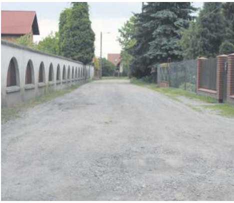
Czy radni zagłosują „za” asfaltem na Tuwima i nowym chodnikiem przy ul. Lotników, przekonamy się w połowie czerwca