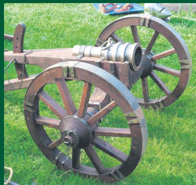
Replika hufnicy z połowy XV w., którą zobaczymy na placu Kościuszki