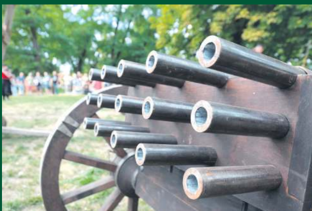
Piętnastolufowe działo nazywane „organkami” uczci salwą 800 lat kasztelanii sochaczewskiej