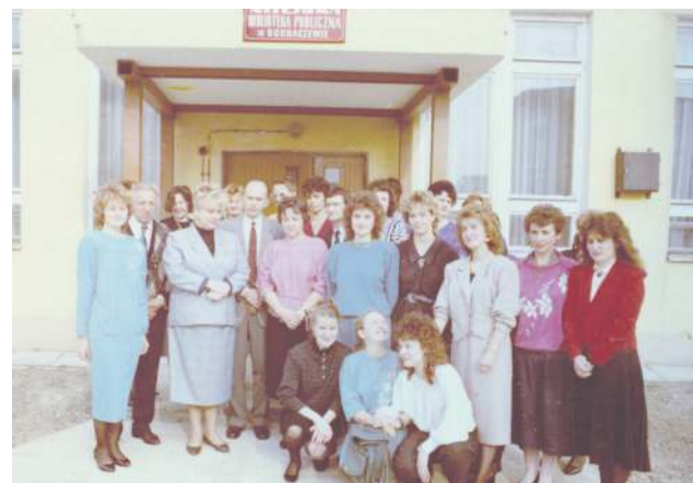
Otwarcie biblioteki w „Łączniku” - rok 1989

Reforma administracyjna kraju z 1975 r. przynosi zmiany w sieci bibliotek publicznych. W związku z likwidacją powiatów biblioteka przyjmuje nazwę Miejskiej Biblioteki Publicznej w Sochaczewie, która obowiązuje po dzień dzisiejszy. W tym samym roku powstaje filia nr 3 obsługująca mieszkańców osiedla Malesin, w 1978 r. oddział dla osiedla Rozłazłów, a