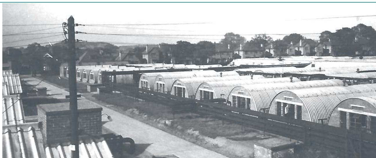
W beczkach, jak nazywali je lokatorzy osiedla, przez lata żyło, uczyło się, zawierało małżeństwa kilkuset naszych rodaków

Po wojnie w Melton mieszkali niewiele ponad 10 tysięcy ludzi, w tym około 200 polskich rodzin. To im zawdzięczamy powstanie Polskiego Klubu i budowę kościoła. W 1961 polska społeczność kupiła pod świątynię działkę przy ulicy Sandy Lane. Powstała dzięki ofiarności i pracy rąk samych parafian. Nasi rodacy finansowali zakup materiałów, pożyczali od pracodawców betoniarki i łopaty, by wieczorem pomóc na budowie. Żony wspierały swych mężów cie-