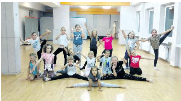
Tak zapowiada swój występ dziecięca grupa Abstraktu