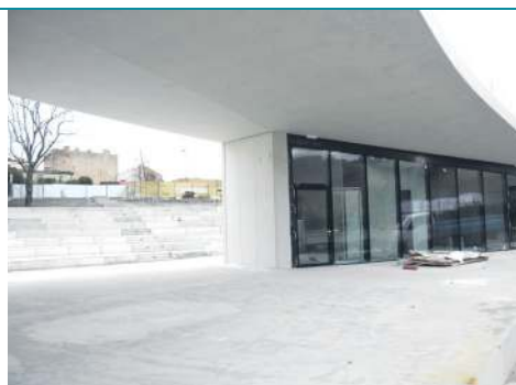
Widok ze sceny amfiteatru