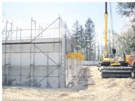
Budowa sali gimnastycznej przy „dwójce”

środków zewnętrznych. Samorząd zdobył prawie 7,6 mln zł różnych dotacji, w tym 4,5 mln z Funduszu Inwestycji Lokalnych. Rządowe wsparcie burmistrz przeznaczył na II etap remontu ul. 15 Sierpnia oraz budowę sieci sanitarnej i zbiornika retencyjnego w rejonie ulicy Płockiej. Do prowadzonego w tym roku remontu ul. 15