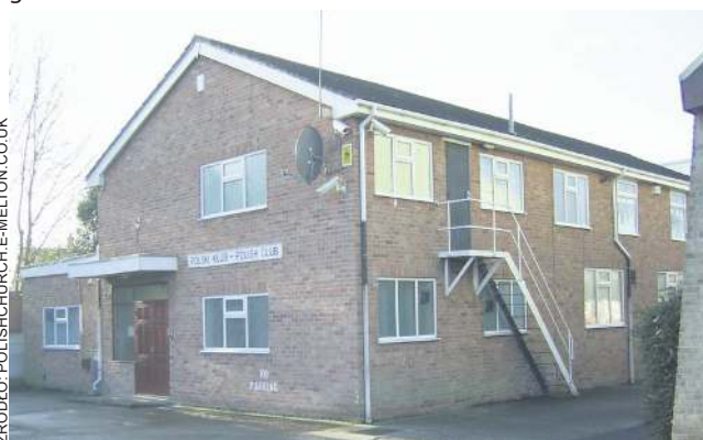
Polski Klub wybudowali emigranci z naszego kraju

płymi posiłkami i ciastem. Rekordzista spędził na placu budowy 700 godzin. Lokalizacja świątyni nie jest przypadkowa, gdyż od lat 50. w tym rejonie zaczyna się osiedlać coraz więcej Polaków. Ich domy wyrastają przy ulicach Sandy Lane, Oxford, Sussex i Cambridge, ledwie kilka kroków od świątyni.