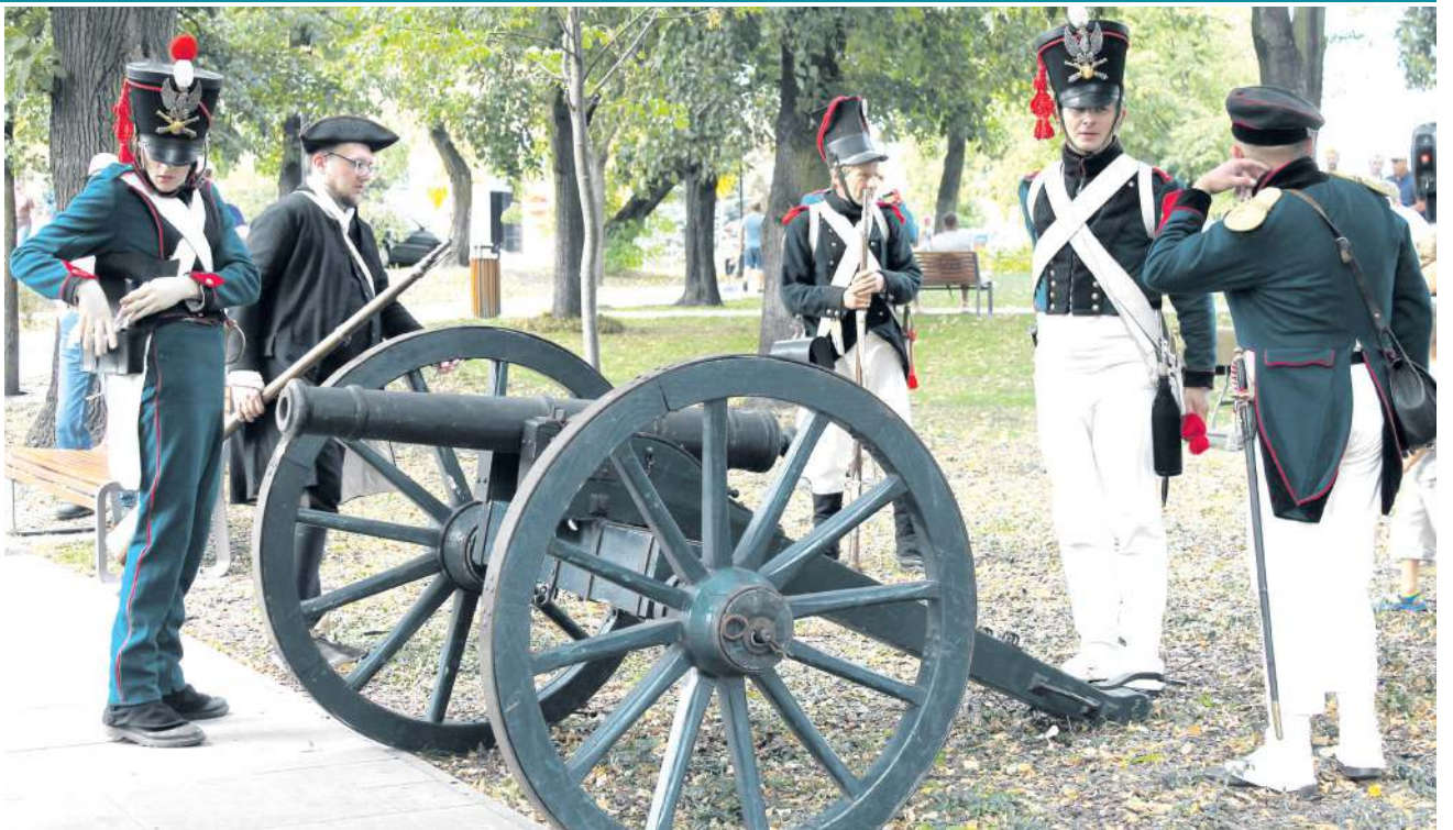
Historyczna armata odda salwę z okazji 800-lecia kasztelanii sochaczewskiej