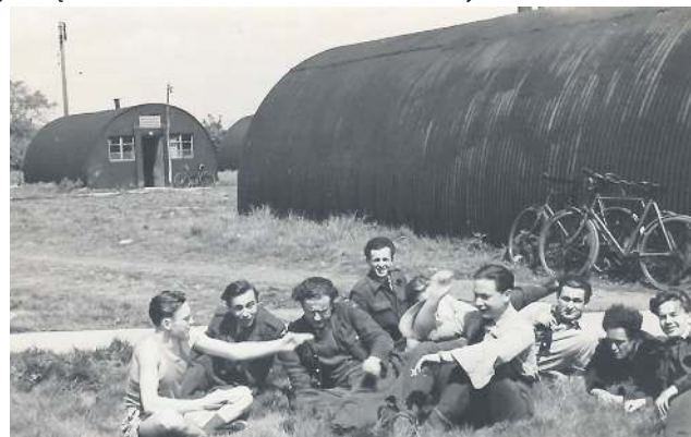
Rok 1946. Jednymi z pierwszych lokatorów obozu byli polscy lotnicy