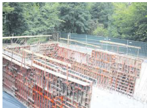
Zbiornik retencyjny w Chodakowie