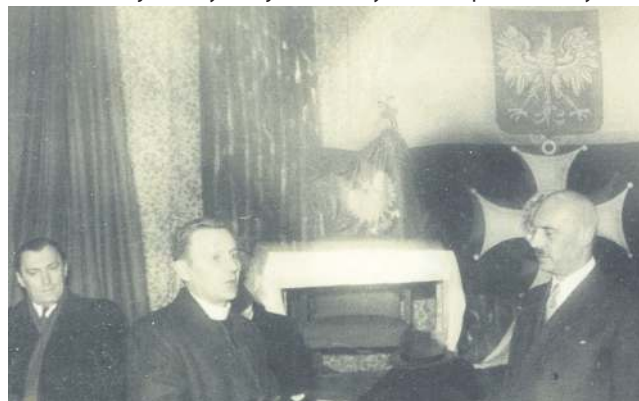
W 1951 roku Polaków mieszkających w Melton odwiedził generał Anders