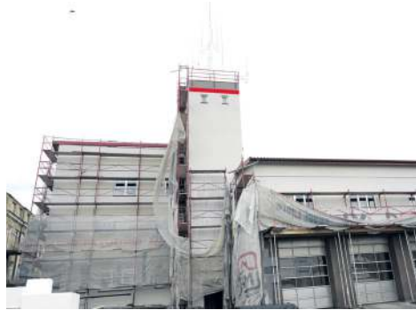
Miasto pomogło w rozbudowie komendy PSP