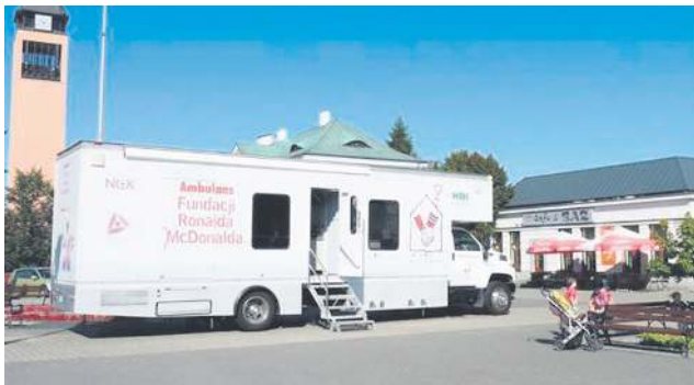
Jak co roku do Sochaczewa przyjedzie ambulans Fundacji Ronald McDonalda