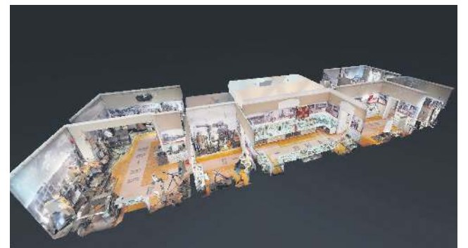
Wirtualny spacer po muzeum zagości na stałe na muzealnej stronie internetowej

rami Chopina. Podczas Dni Sochaczewa odbędzie się premiera wydawnictwa i projektu.