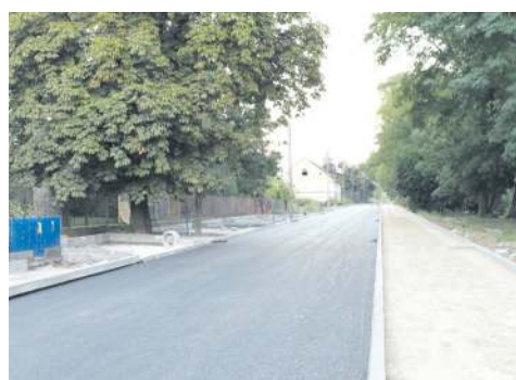
Głowackiego i Trojanowska to ulice powiatowe, w których remoncie partycypowało miasto