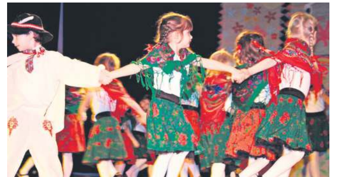
Ludowy zespół Folklorek jak zawsze budzi uznanie