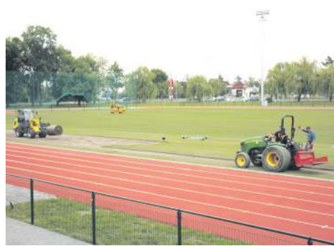
Układanie trawy na przebudowanym stadionie