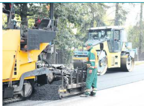
Układanie asfaltu na ul. 15 Sierpnia

To był także dobry rok, jeśli chodzi o pozyskiwanie