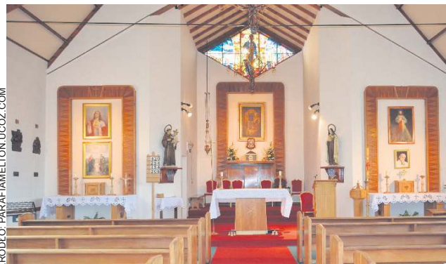
Polska społeczność w Melton to kilkaset osób. Jej znaczącą część stanowią rodacy przybyli na Wyspy po naszym wejściu do UE

Rusza także Polska Sobotnia Szkoła, w której dzieci uczą się języka, historii i zwyczajów swoich rodziców i dziadków.