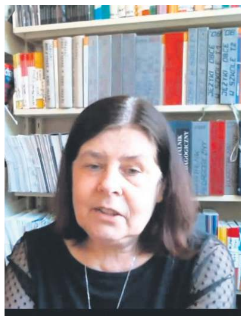
Dziennikarka „ZS” podczas wirtualnego spotkania z czytelnikami