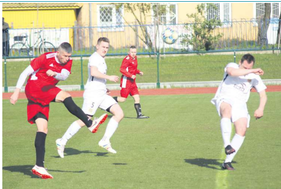
Po katastrofalnej końcówce Orkan przegrał ze Skrą Drobin 3:4