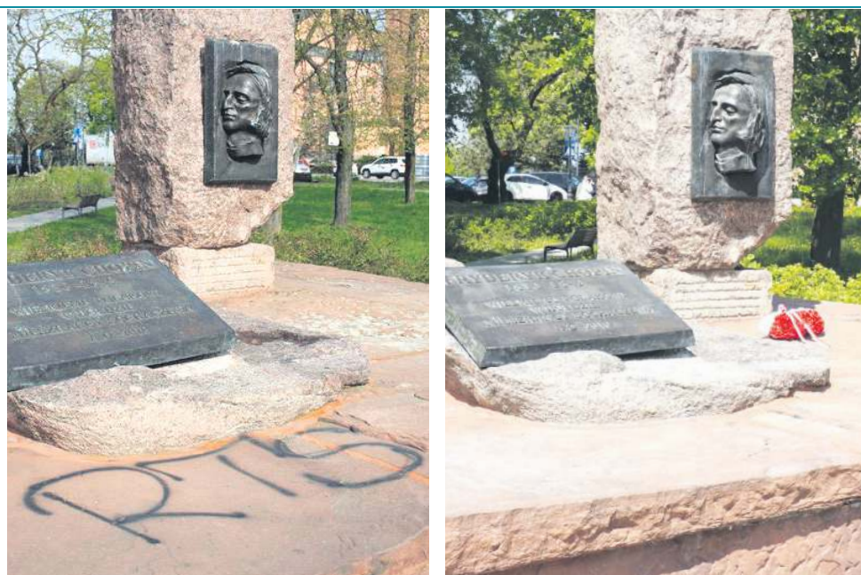
Po oczyszczeniu przeprowadzonym przez pracowników ZGK szpecący napis właściwie zniknął. Usunięcie napisu kosztowało mieszkańców miasta około 1.000 zł

- Policjanci ustalili czterech sprawców nanoszenia napisów na murach i elewacjach budynków w centrum Sochaczewa - poinformowała oficer prasowy KPP w Sochaczewie mł. asp. Agnieszka Dzik. - Trzech z nich zostało rozliczonych jako sprawcy wykroczenia, a jeden usłyszał zarzuty z kodeksu karnego. Trwają czynności zmierzające do ustalenia pozostałych sprawców obraźliwych napisów na budynkach.