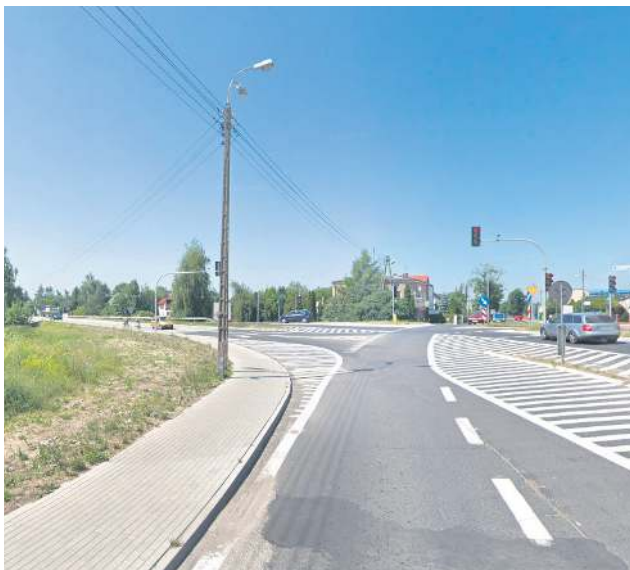
Przy ul. Płockiej powstanie zbiornik retencyjny o pojemności 334 metrów sześciennych

- Na zagospodarowanie wód opadowych nasz samorząd zdobył niemal 10 mln zł dofinansowania z Narodowego Funduszu Ochrony Środowiska i Gospodarki Wodnej. Mocno w staraniach o dotację wspierał nas poseł Maciej Małecki. Wierzę, że nadal możemy na niego li-