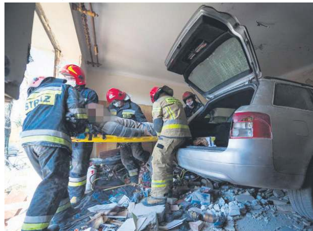
Kilka dni wcześniej rozpedzone audi wjechało do pokoju budynku znajdującego się na wprost ulicy Batalionów Chłopskich