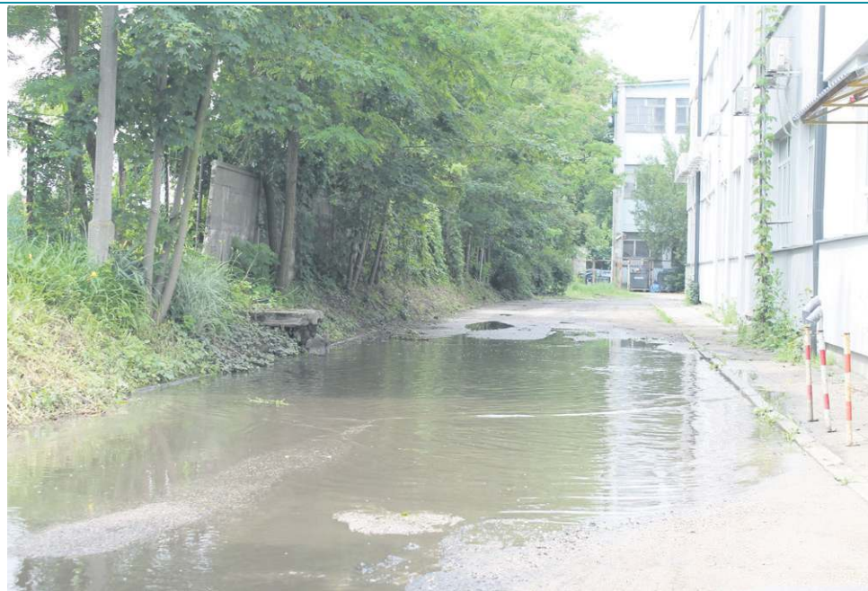
Wystarczy lekki deszcz, by ulica Włókiennicza na terenie Chemitexu zmieniła się w rozlewisko. Jesienią nie zobaczymy już takich kałuż

Zwieńczeniem prac byłaby wymiana asfaltu i budowa ścieżki rowerowej w ulicy Płockiej, ale w tej chwili w budżecie miasta nie znajdziemy takiej pozycji. Starania o pieniądze ratusz kolejny raz podjął latem ubiegłego roku, gdy wojewoda ogłosił