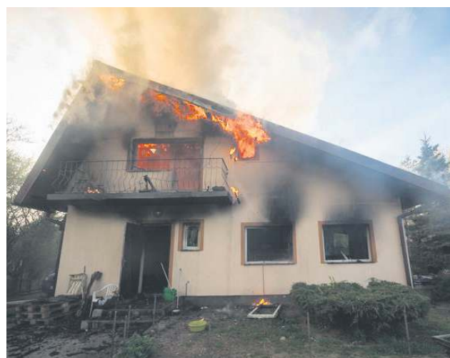
Pożar, który miał miejsce 16 kwietnia 2020 w Kuznocinie, kosztował życie jedną osobę