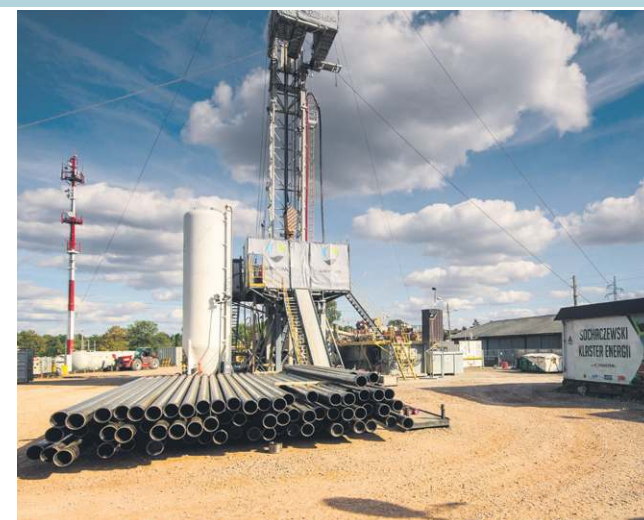
Odwiert geotermalny wykazał, że pod Sochaczewem płynie słodka i ciepła woda