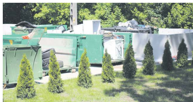
Zanim odpady trafią do utylizacji, są dokładnie segregowane

czony w niewielkim stopniu, a nawet farby i materiały budowlane.