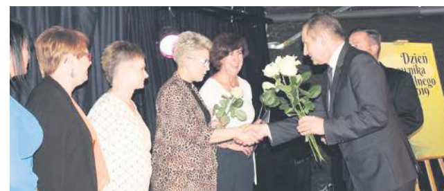
W zeszłym roku nic nie przeszkodziło w zorganizowaniu uroczystości

W uzasadnieniu uchwały przyjętej na sesji 27 listopada czytamy, że „dorobek lokalnej pomocy społecznej będzie wykorzystywany w utworzonych działach pomocy społecznej tak, aby rozwijać nowe formy profesjonalnego pomagania, w tym pracę środowiskową i nowoczesne formy zarządzania usługami społecznymi”. Pracownicy MOPS oraz DDPS staną się automatycznie pracownikami powołanego centrum. Również majątek tych instytucji w całości ma przejść do nowej placówki. (daw)