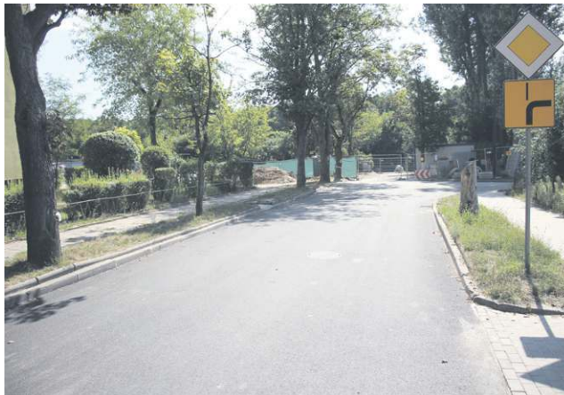
Ulica Parkowa już w asfalcie. Pod drogą ułożono kanalizację deszczową, a na jej końcu zbudowano zbiornik retencyjny jest zjawiskiem powszechnym. Przeciwnie, utrzymujemy wysoki poziom inwestycji i dodatkowo, jak nigdy wcześniej,

funkcjonowanie miasta, nawet w tak trudnych czasach. I to bez podnoszenia podatków. Jeśli moi najgorętsi krytycy zajrzą do Wieloletniej Prognozy Finansowej, to zobaczą, że w tabeli pokazującej łączne zobowiązania miasta na koniec 2020 i 2021 roku wpisana jest ta sama kwota. Oznacza to, że nie zwiększamy długu. Co więcej, w 2022 roku spadnie on o ponad 5 mln i ostatecznie w 2030 osiągnie wartość zero. Wiele miast i gmin marzy o takiej sytuacji. Nie proponuję, jak wielu innych samorządowców, zaciągania dużych kredytów, by