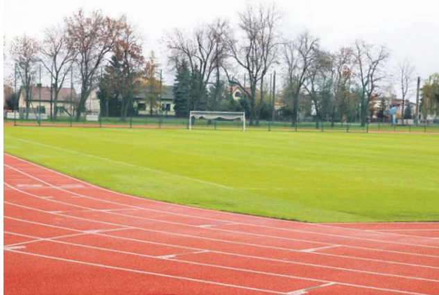
Stadion przy Warszawskiej to jedna z największych inwestycji prowadzonych przez miasto w 2020 roku