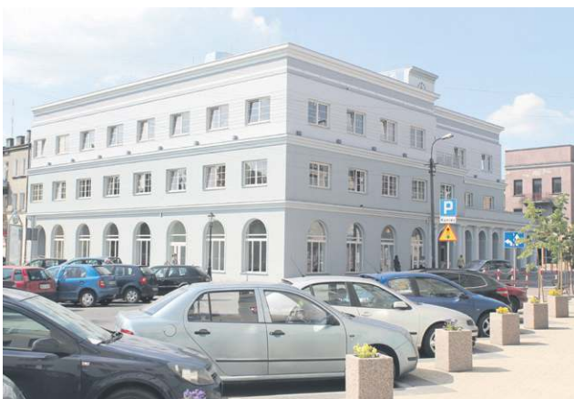
Nadbudowane o dodatkowe piętro kramnice mieszczą dziś m.in. Miejską Bibliotekę Publiczną

W VI kadencji przeprowadzono wart ponad 100 mln zł projekt skanalizowania miasta. Ruszył sztandarowy program nowego burmistrza „Drogi zamiast błota”, którym do 2014 roku objęto niemal 150 ulic o długości 40 km. Zbudowano lub przebudowano ponad ćwierć tysiąca miejsc parkingowych – przy PKP powstał plac na 95 samochodów, w rejonie placu Obrońców Sochaczewa przygotowano ok. 150 miejsc, nowe stanowiska do parkowania znalazły się przy ul. 1 Maja i Żeromskiego. Przeprowadzono remont pasaży Duplickiego, trybun na stadionie Bzury, a wspólnie z powiatem skrzyżowania ul. Płockiej i Gawłowskiej. Wzmocniono skarpe zamkową oraz na nowo zagospodarowano historyczne wzgórze, które szybko stało się dla sochaczewian ulubionym miejscem spacerów. Zbudowano salę gimnastyczną przy SP nr 4, przy „siódemce” zespół boisk (piłkarskie i wielofunkcyjne), a przy boryszewskiej „dwójce” boisko ze sztuczną nawierzchnią. Do użytku oddano nowy żłobek. Miejska Biblioteka Publiczna przeniosła się do nowej siedziby w zabytkowych kramnicach, wyremontowanych i nadbudowanych kosztem ponad 8 mln zł. Ustanowiono program stypendialny dla wyróżniających się sportowców i drugi dla uczniów. Organizacjom pozarządowym i klubom sportowym dano prawo do bezpłatnego