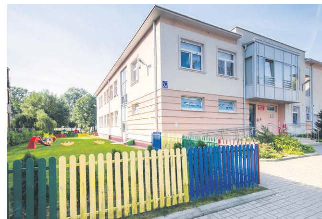
Nowy żłobek na ponad sto miejsc to placówka integracyjna, dostosowana do potrzeb dzieci niepełnosprawnych

korzystania ze wszystkich obiektów publicznych, w tym hal MOSiR, boisk i sal gimnastycznych. Wdrożono program Sochaczewska Karta Mieszkańca, w ramach którego z pakietu ulg i zniżek mogą korzystać m.in. seniorzy, weterani, honorowi dawcy krwi i duże rodziny. Na terenie miasta powstało kilka placów zabaw przy szkołach oraz na osiedlach przy Korczaka, Fabrycznej i al. 600-lecia. So-