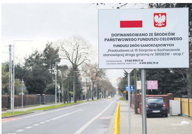
W przyszłym roku ulica 15 Sierpnia zostanie przebudowana na ostatnim fragmencie, sięgającym do obwodnicy

dochodów z powodu pandemii i wzrostu wydatków - nie gasimy światła, jak robią to niektórzy samorządy, nie rezygnujemy z inwestycji, co w tej chwili