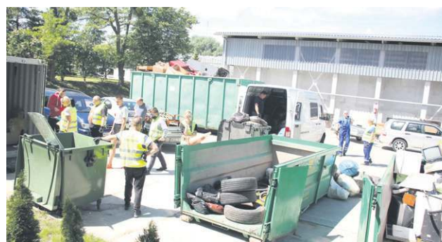
Początek działalności. PSZOK przechodził prawdziwe oblężenie

Do PSZOK trafia nie tylko elektronika. Poza wspomnianymi drzwiami, przywożone są meble znisz-