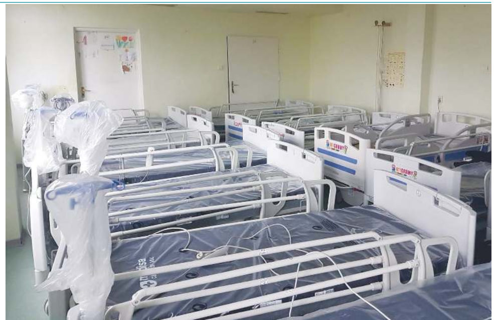
Na początku listopada WOŚP przekazał oddziałowi covidowemu sochaczewskiego szpitala osiemnaście specjalistycznych łóżek