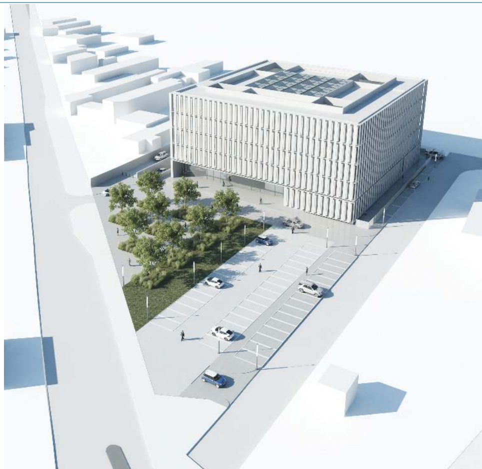
Wizualizacja sądu rejonowego w Częstochowie opracowana przez firmę Heinle, Wischer und Partner

Pierwsze konkretne deklaracje w tej sprawie padły w 2015 roku, gdy ówczesny prezes sądu uzyskał od swych zwierzchników zapewnienie, że jest szansa na umieszczenie Sochaczewa w ministerialnych planach, a wskazanie konkretnego terenu stanowiłoby poważny argument w dalszych rozmowach. Pomoc zadeklarowało miasto. Burmistrz zaproponował radnym zamianę działek ze skarbem państwa i w kwietniu 2015 roku rada miasta jednogłośnie wyraziła na to zgodę. Ustalono, że samorząd przekaze skarbowi państwa hektar pól czerwonkowskich (narożna działka