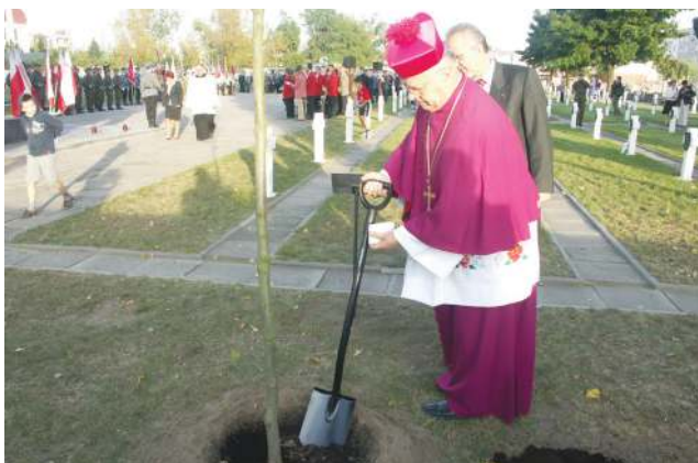
W 70 rocznicę sowieckiej napaści na Polskę na trojanowskiej nekropolii, obok żołnierskich kwater, posadzono cztery Dęby Pamięci pomniał, że z rozkazu Stalina masowo mordowano kwiata polskiej inteligencji, bo Polska i Polacy mieli zniknąć z mapy świata.

17 września 2013 roku odbyły się miejskie obchody rocznicy wybuchu II wojny światowej. Ich kulminacyjnym momentem było odsłonięcie pomnika poległych na cmentarzu wojennym w al. 600-lecia, pomnika który poddany został renowacji. Obchody rozpoczęły się w kościele Narodzenia N.M.P. mszą w intencji ofiar