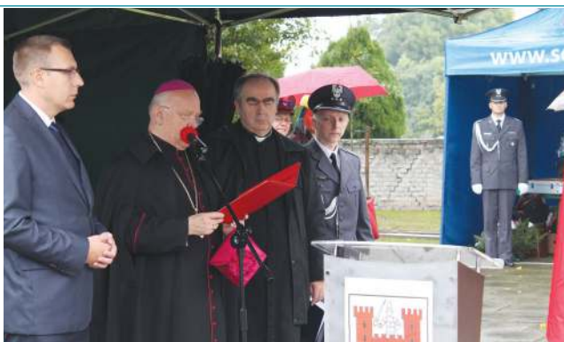
W 2013 roku pomnik na cmentarzu wojennym w Trojanowie został gruntownie odnowiony. Obelisk wraz z nową tablicą poświęcił biskup Zawitkowski

Niespełna rok później, w kwietniu 2012, przyjechał uczcić pamięć wszystkich ofiar sowieckich obozów. Zwracając się wprost do młodzieży przy-