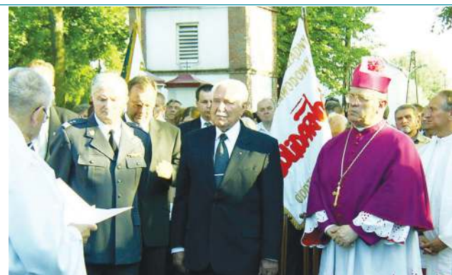
W czerwcu 2003 roku biskup wraz z prezydentem Kaczorowskim wzięli udział w złożeniu w Pomniku Pamięci ziemi pobranej z cmentarza lotników polskich w Newark

- Kochani, Sochaczew potrafi świętować, potrafi przypominać swoim dzieciom i swoim obywatelom o tym, że Ojczyzna jest matką, którą trzeba kochać jak matkę rodzoną (...). Cieszą się dzieci, gdy matka jest szczęśliwa, płaczą dzieci, gdy matka cierpi. Myśmy przeżyli to 74 lata temu. Wtedy trzeba było nam stanąć w obronie Ojczyzny. Dzieci nie wiedzą, co to znaczy bronić ojczyzny. Trzeba stanąć i