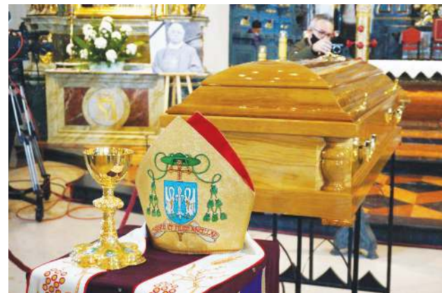
Po pożegnaniu z wiernymi w łowickiej katedrze, ciało biskupa spoczęło na cmentarzu w Żdżarach

tak mocno - albo z karabinem, albo z sercem powiedzieć - nie, dalej ani kroku! - podkreślał w homilii Józef Zawitkowski.