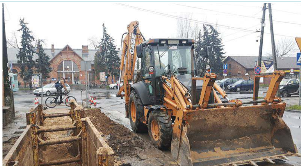
W 2018 roku za ponad 700 tys. zł powstała nowa sieć kanalizacji sanitarnej w ulicach Załamanej, Księcia Janusza i Towarowej

- Podstawowe zadania ZWiK to dostarczenie dobrej jakości wody a także odbiór ścieków, ich bezpieczne i zgodne z przepisami oczyszczanie, co spółka sprawnie wykonuje od lat. Nad jakością wody czuwa jej własne, certyfikowane laboratorium. Przedkładany radnym plan opisuje kierunek działania w najbliższych latach, ale nie zobowiązuje do sztywnego trzymania się dat i kwot – mówi wiceburmistrz Dariusz Dobrowolski.