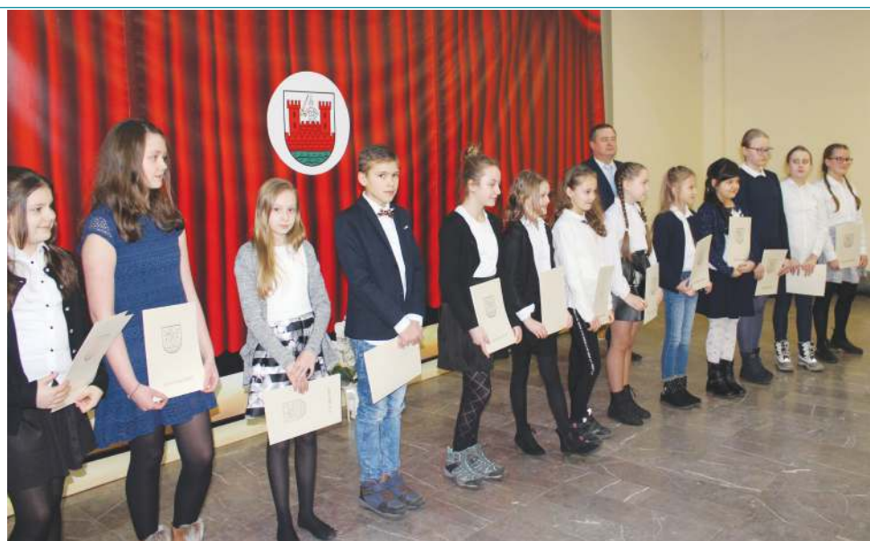
W ostatnich latach stypendia najlepszym uczniom wręczano, w obecności ich rodziców, w kramnicach miejskich. W tym roku, z oczywistych względów, nie było to możliwe.

- Wspólnie z przewodniczącym Sylwestrem Kaczmarciem i radnymi, z okazji Dnia