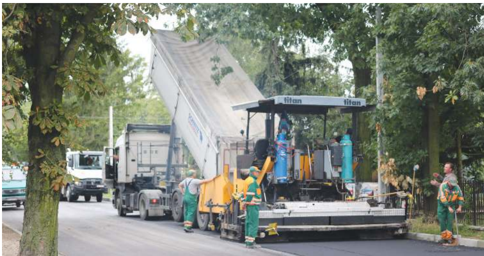
Na pierwszym odcinku 15 Sierpnia prace są już niemal na ukończeniu. Drugi etap ruszy wiosną 2021 roku

W czwartek 15 października miały miejsce ostatnie odbiory techniczne połączone z symbolicznym otwarciem czterech odcinków powiatowych dróg