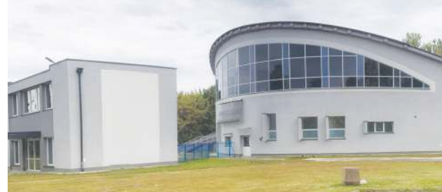
Jeden z największych projektów termomodernizacyjnych ostatnich lat miasto przeprowadziło w 2017 roku. Kosztem 4,4 mln ocieplono budynek SCK w Chodakowie oraz sąsiednią halę sportową. W tej drugiej wymieniono m.in. całą instalację C.O.

trzeba przeliczyć i zrobić to maksymalnie precyzyjnie. Pieniądze na ich inwentaryzację pochodzą z programu „Mazowiecki Instrument Wsparcia Ochrony Powietrza Mazowsze 2020”.