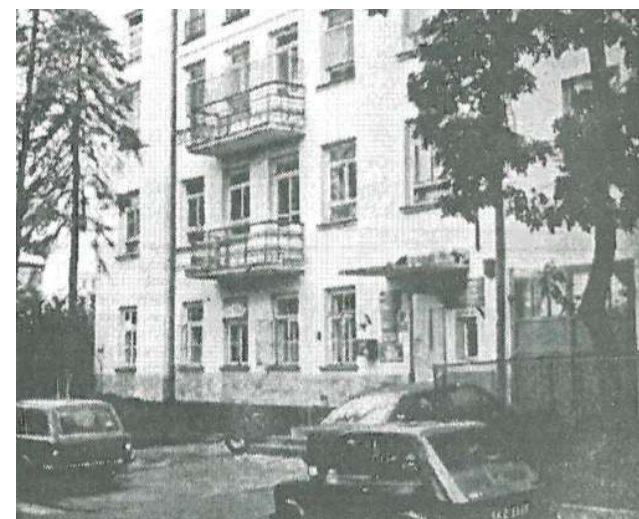
W 1992 roku szpital mieścił się w budynku przy ul. Staszica. Na nową siedzibę przyszło poczekać jeszcze trzy lata