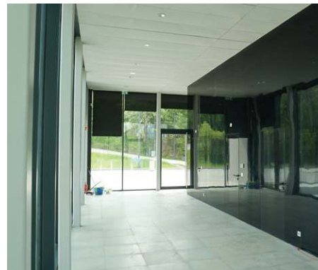
Hol nowej kawiarni już teraz robi wrażenie