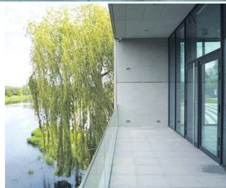
Taras widokowy wychodzi wprost nad Bzurę