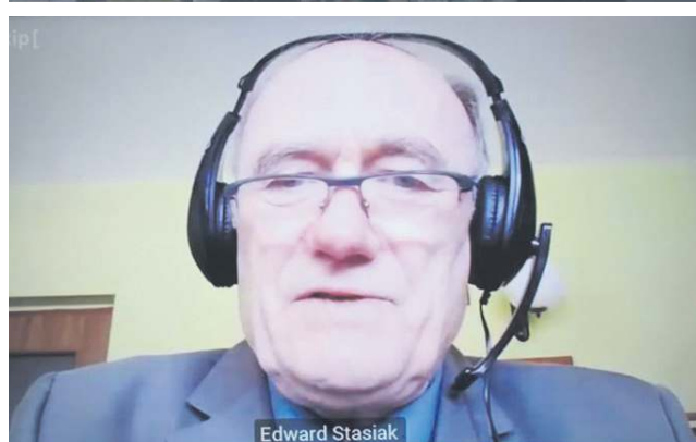
Sochaczewską Tarczę poparli radni wszystkich klubów. Sesja odbyła się zdalnie 8 maja

Pierwsza propozycja to umorzenie podatku od nieruchomości za kwiecień, maj i czerwiec tym firmom, które w wyniku decyzji władz centralnych, głównie rozporządzenia Rady Ministrów z 31 marca, musiały z dnia na dzień zaprzestać działalności.