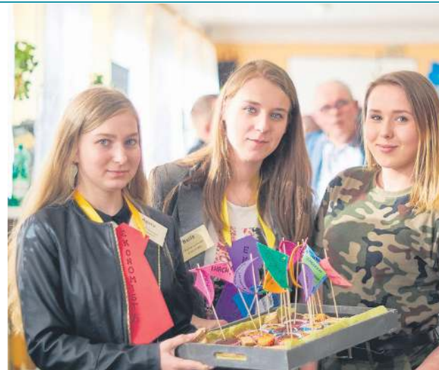
ZS im. Iwaszkiewicza od lat pracuje na swoje wyniki

Analizując wyniki rankingu warto zwrócić uwagę na zasady przyznawania punktów poszczególnym szkołom. Bardzo dobrze w rankingu wypa-