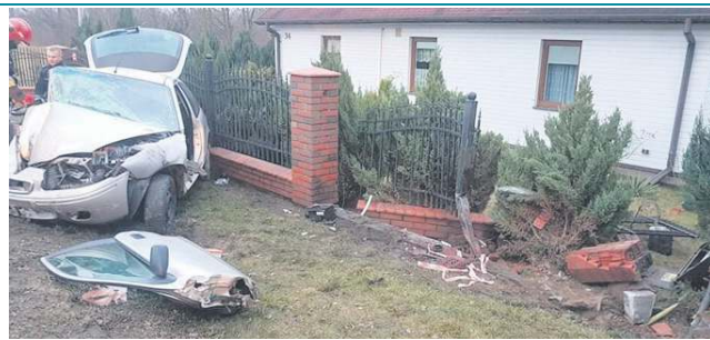
Kierujący roverem ściał latarnię, skrzynkę przyłącza gazowego i zatrzymał się dopiero na ogrodzeniu prywatnej posesji

Do tragicznego w skutkach wypadku doszło dzień później. 21 grudnia po godzinie 14:00 w Pawłowicach (gmina Teresin) samochód osobowy marki rover wypadł z drogi i uderzył w latarnię, skrzynkę przyłącza gazowego, a następnie w przydrożne ogrodzenie. W pojeździe pozostawał nieprzytomny kie-