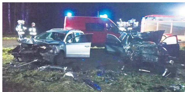
Audi oraz volkswagen po czołowym zderzeniu z 26 grudnia ub.r.