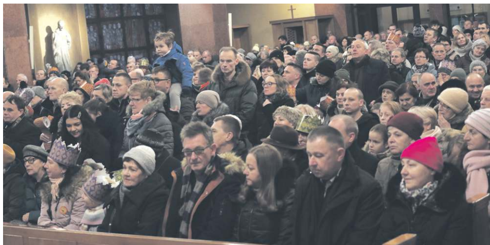
Koncert w Sochaczewie przyciągnął ogromną widownię