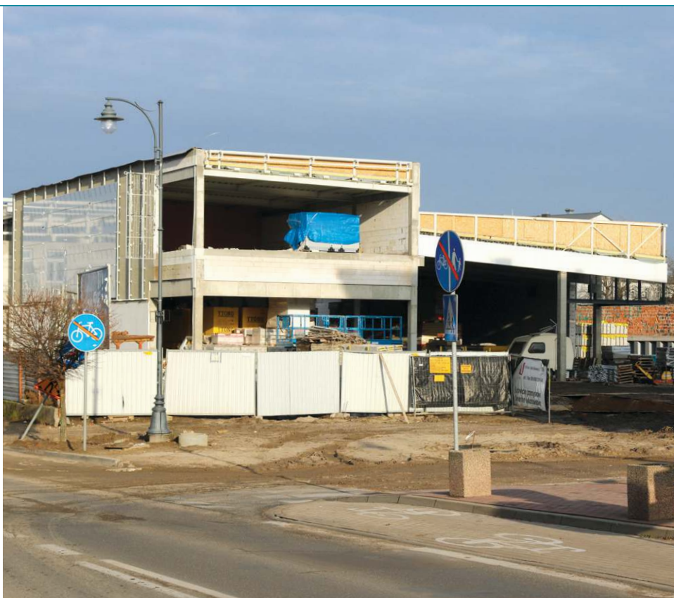
Prawdopodobny termin uruchomienia marketu to wiosna przyszłego roku

Sporo czasu ekipom zajęła także przebudowa kanalizacji deszczowej w okolicach planowanego wjazdu na po-