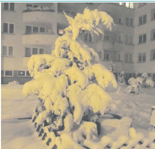
Tak obfite opady śniegu wystąpiły w Sochaczewie ostatni raz w 2013 roku. Drogowcy deklarują, że są gotowi nawet na taki scenariusz

Na terenie miasta znajdują się drogi krajowe, wojewódzkie, powiatowe i miejskie, dlatego uwagi dotyczące zimowe-