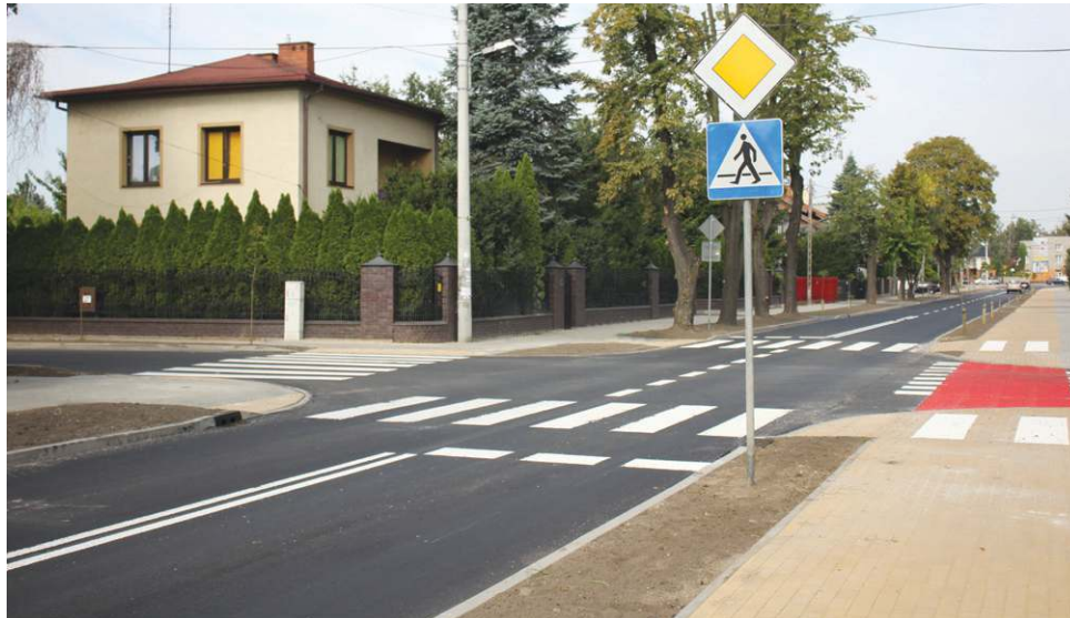
Ulicę Licealną otwarto dla ruchu przed oficjalnym odbiorem. Drobne prace porządkowe nadal trwają

Na czasowe zamknięcie Towarowej zareagował ZKM, ogłaszając, że od 8 września autobusy ZKM