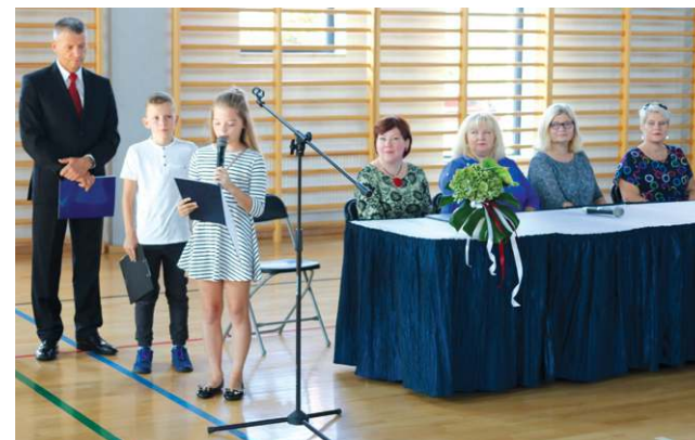
W SP 4 starsi uczniowie powitali swoich młodszych kolegów

kadre PSM i przypomniała, że w tym roku placówka będzie kształciła 300 uczniów.