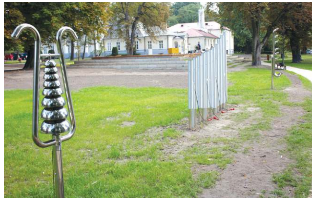
Nowym elementem parku jest ogród muzyczny