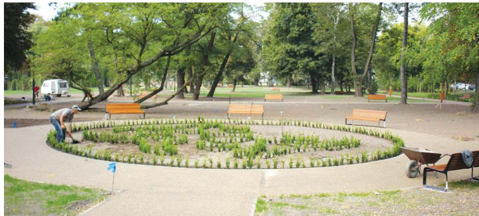
W parku Garbolewskiego odtworzono okrągły kwiatnik widoczny na zdjęciach sprzed stu lat

Przed dawnym dworem rodziny Garbolewskich od-