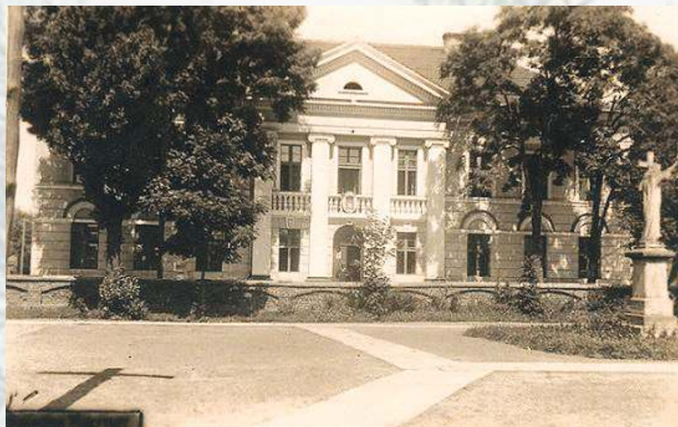
Sesje Rady Miejskiej w okresie dwudziestolecia międzywojennego odbywały się w ratuszu, obecnie to budynek muzeum ziemi sochaczewskiej. Co ciekawe tam też zazwyczaj mieszkał burmistrz ze swoją rodziną, czasem z kilkorgiem dzieci.

Niemieckie władze okupacyjne, chcąc pozyskać społeczeństwo polskie, zdecydowały się na organizację samorządu miejskiego, później również powiatowego. Oczyszczając