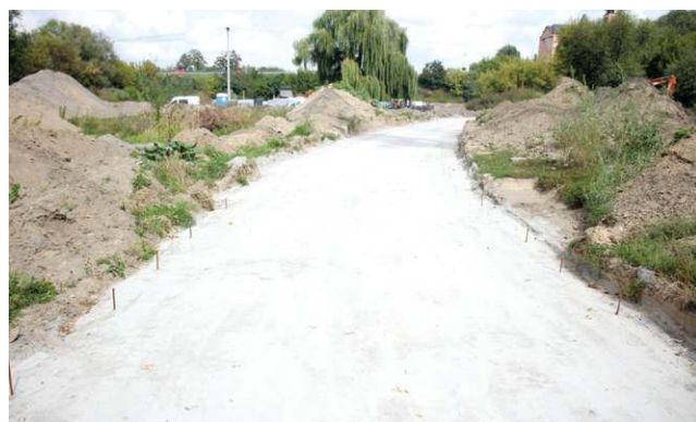
Z zamku do nowej kawiarni nad Bzurą dojdziemy bulwarami przeznaczonymi dla pieszych i rowerzystów

tworzono historyczny przebieg alejek oraz okrągły, ozdobny kwiatnik. Projektując te zmiany ratusz sięgnął m.in. do zdjęć z 1915 roku oraz inwentaryzacji parku wykonanej w 1956 r.