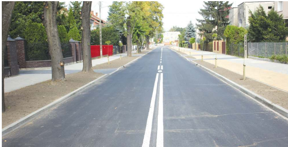
Kompleksowa przebudowa Licealnej wraz ze skrzyżowaniem z Traugutta kosztowała ponad dwa mln zł

będą dojeżdżały pod dworzec PKP - i z powrotem - ulicą Botaniczną, bezpośrednio z Licealnej. Tego dnia przystanki z ul. Łuszczewskich przeniesiono na 15 Sierpnia, w rejon ulicy Pionierów.