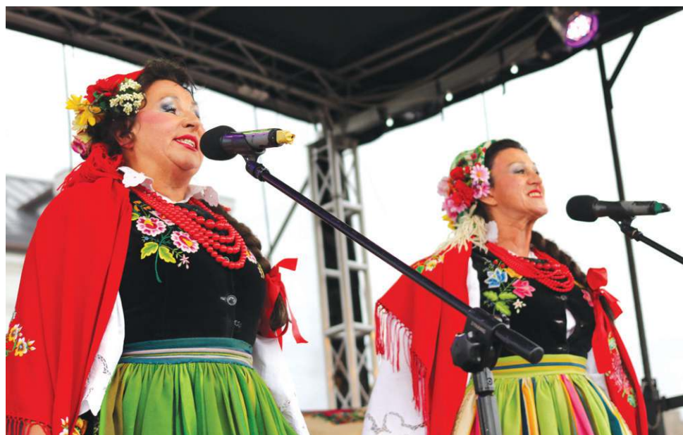
Siostry Bryńskie są filarem Kapeli Mazowieckiej