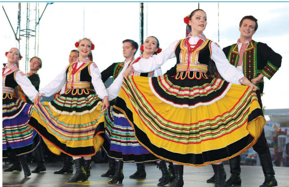
„Warszawianka” zaprezentowała tańce ludowe z całej Polski

Przypominamy, że koncerty w ramach I Sochaczewskiego Festiwalu Folklorystycznego odbywają się w kolejne niedziele lipca o godz. 19. W przypadku złej pogody przeniesione zostaną do kramnic (ul. 1 Maja 21). 8 lipca wystąpi Kapela Góralska Hora. Cykl imprez, 15 lipca, zamknie występ Zespołu Pieśni i Tańca Blichowiaczy.