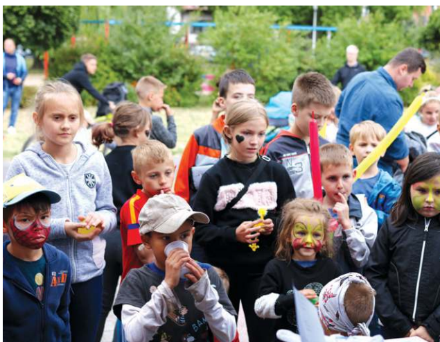
Chwila nerwowego oczekiwania przed ogłoszeniem wyników i rozdaniem nagród

Uczestnicy zgodnie stwierdzili, że było świetnie, szczególnie, że ostatecznie nie padało. (seb)