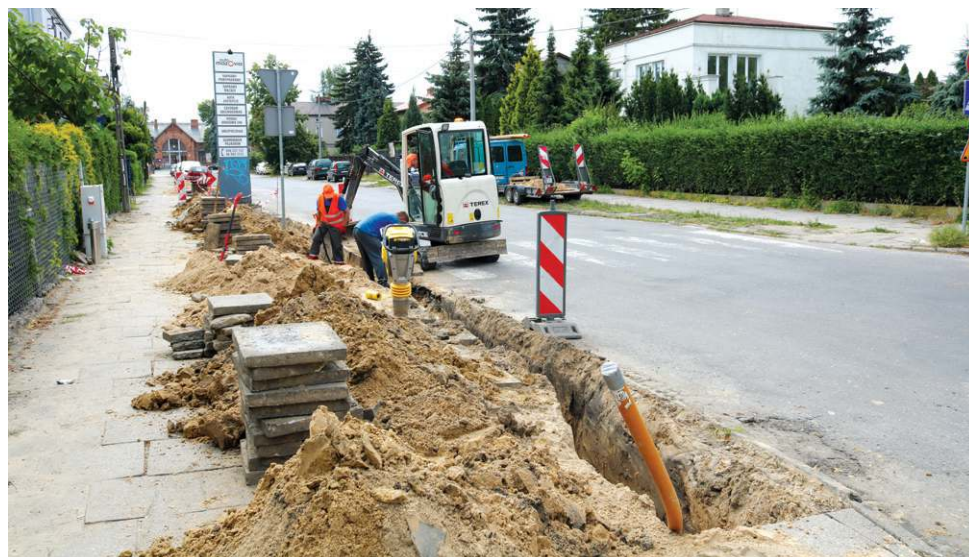
Pierwsze ekipy budowlane pojawiły się jeszcze przed zamknięciem ulic na czas remontu

wania i zjazdy do posesji. Powstaną jednostronne ścieżki pieszo-rowerowe, siedem znak postojowych, w tym jedna dla autokarów. Na koniec firma wykona oznakowanie pionowe i poziome oraz elementy bezpieczeństwa.