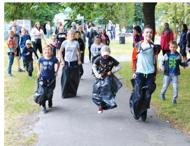
Uczestnicy wyścigu w workach dali z siebie wszystko