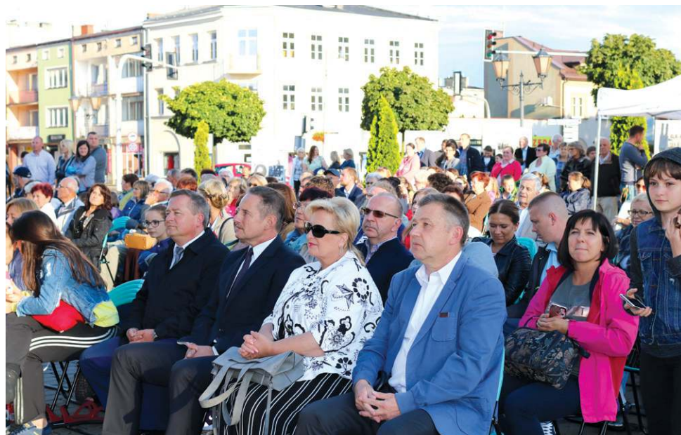
Festiwal cieszy się olbrzymią popularnością