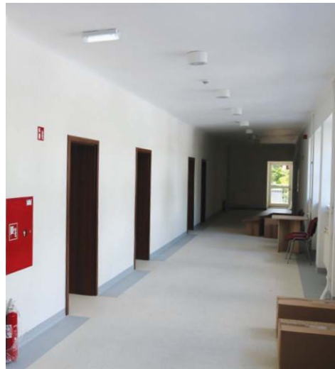
Korytarze w nowej prokuraturze są bardziej przestronne niż biura w jej poprzedniej siedzibie