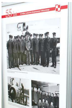
Wystawę opowiadającą historię pułku można oglądać na placu Kościuszki

Od władz samorządowych miasta i powiatu byli dowódcy pułku otrzymali pamiątki