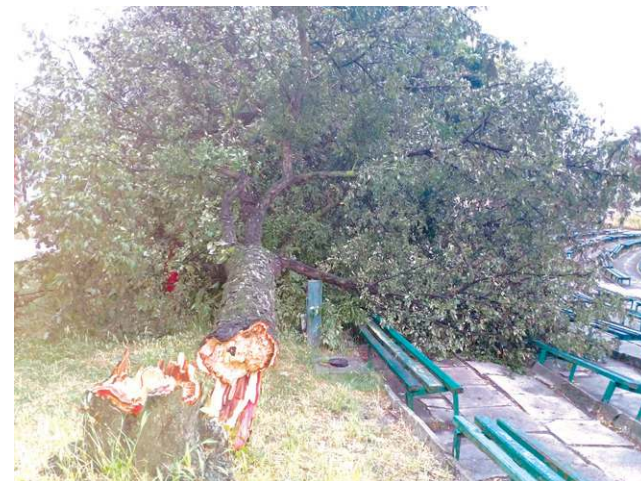
„Szkoda tego drzewa na Podzamczu. Zawsze tam stało i niejedno widziało” - napisał jeden z naszych internautów