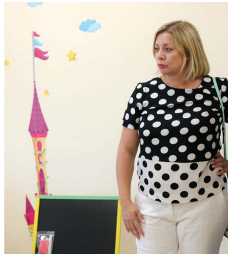
„Błękitny” pokój zrobił bardzo pozytywne wrażenie m.in. na prezes sochaczewskiego sądu