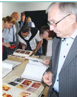
Wspomnień czar przywołały pułkowe kroniki

W imieniu współorganizatorów spotkania, władz mia-