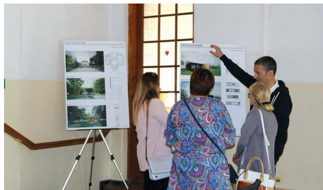
Wewnątrz pałacu można było zobaczyć m.in. projekty modernizacji

no plansze pokazujące projekt przebudowy obiektu i jego otoczenia.