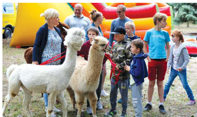
Szczególnie dużo atrakcji czekało na najmłodszych