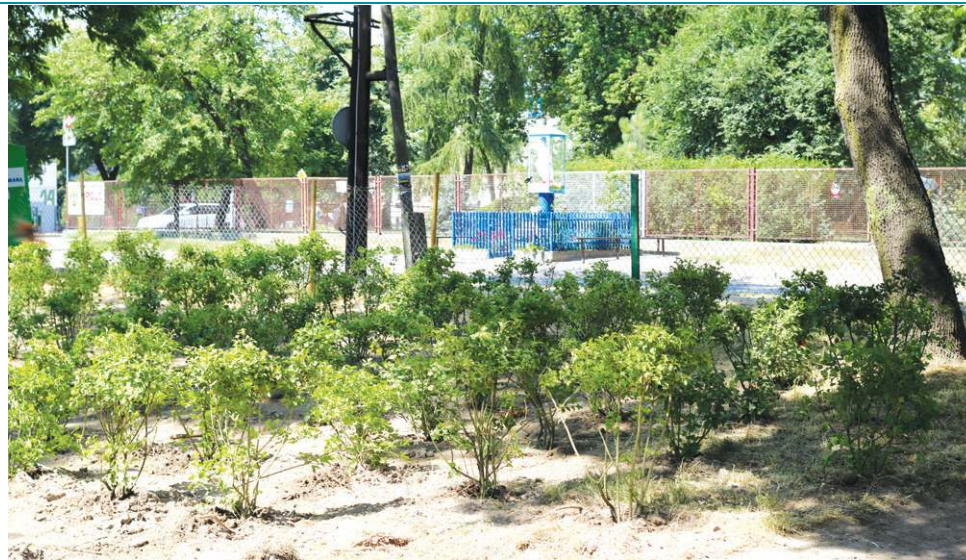
W parku Garbolewskiego pojawiły się już pierwsze nowe nasadzenia

- Blisko szkoły muzycznej powstaje scena plenerowa. Konstrukcja żelbetowa jest na ukończeniu i zostały tylko prace wykończeniowe, czyli montaż podestów i okładziny schodów. Wykonane są wszystkie prace instalacyjne, w tym odprowadzenie wód deszczowych. Budowlan-