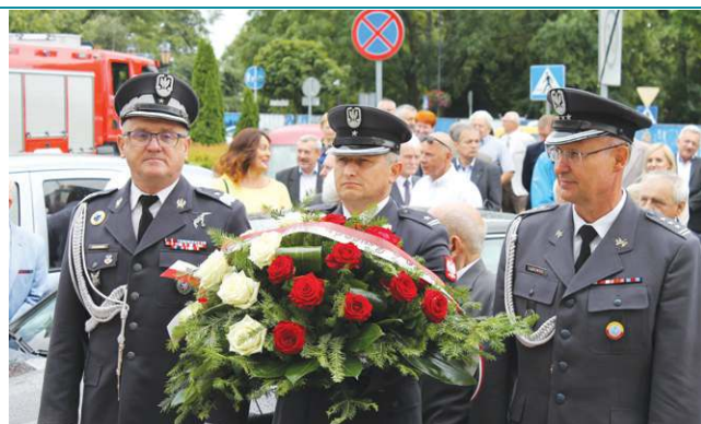
Kwiaty pod tablicą pamiątkową złożył m.in. wychowanek pułku, gen. Sławomir Żakowski

Druga część jubileuszowej gali odbyła się w SCK w Boryszewie. W sali koncertowej SCK można było kupić książkę Krzysztofa Kwiatkowskiego „Lotnicze tradycje Sochaczewa”, otwarto też okolicznościową wystawę przygotowaną przez muzeum ziemi