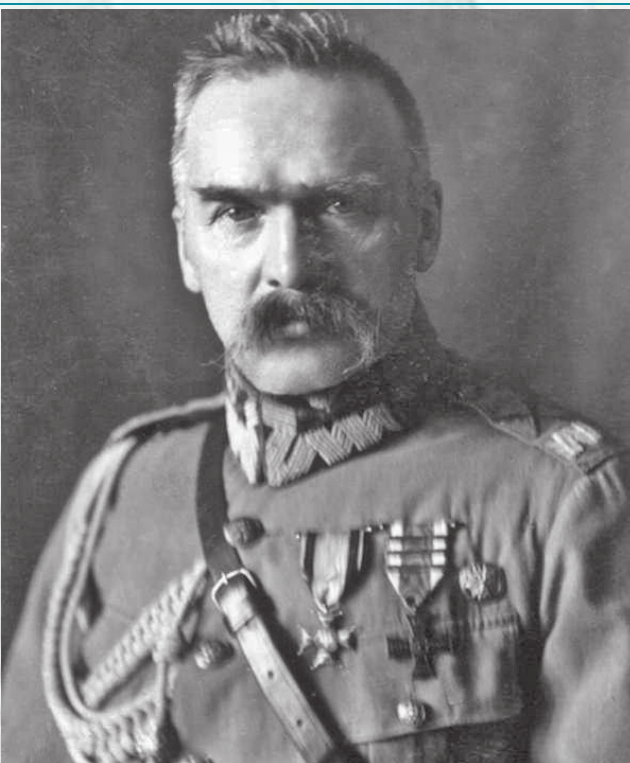
Przedstawioną fotografię marszałka Józefa Piłsudskiego wykonano najprawdopodobniej w 1928 r. W tym samym roku Rada Miejska w Sochaczewie nadała marszałkowi Piłsudskiemu tytuł „Pierwszego Honorowego Obywatela Miasta Sochaczew”. Na fotografii portretowej widzimy marszałka w mundurze wzór 1927, na piersi widoczne odznaczenia Krzyż Orderu Wojskowego Virtuti Militari, Krzyż Walecznych (z oznaczeniem nadania trzykrotnego) oraz charakterystyczny dla legionistów Znak oficerski tzw. „Parasol”

Istotnym impulsem do szczególnego upamiętnienia zasług Józefa Piłsudskiego była niezwykle uroczyste obchody w Sochaczewie w 1928 roku dziesiąta rocznica odzyskania niepodległości. Sochaczewska uchwała była wówczas jedną z najczęstszych form honorowania Józefa Piłsudskiego. Wiele rad miast i gmin oraz inne gremia nadawały mu honorowe obywatelstwa lub okolicznościowe tytuły. Szczególnie po zamachu majowym zjawisko przybrało charakter masowy, a sam marszałek z wieloma nagradzającymi go w ten sposób miejscowościami nie był w jakikolwiek sposób związany. Tego samego dnia co w Sochaczewie, Piłsudski otrzymał honorowe obywatelstwo w Skierniewicach.