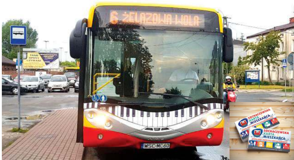
Do skorzystania z bezpłatnych przejazdów konieczne będzie posiadanie Sochaczewskiej Karty Mieszkańca