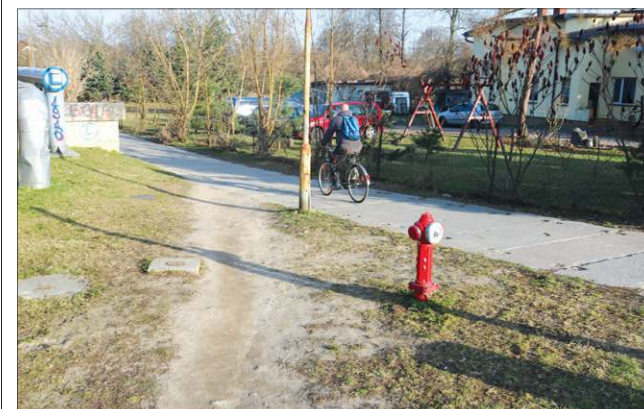
W miejsce nierównych betonowych płyt pojawi się chodnik z kostki brukowej