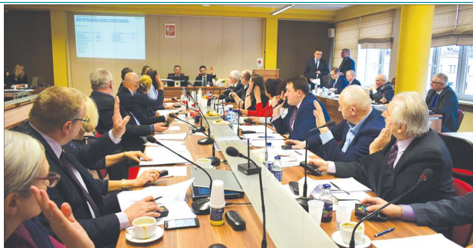
Tuż przed świętami radni podjęli kilka ważnych decyzji