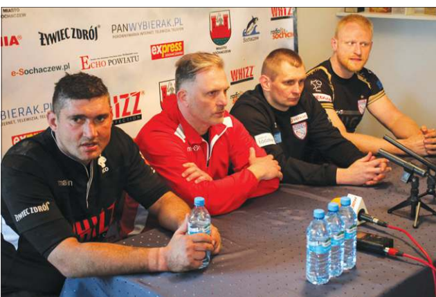
Konferencje prasowe stały się standardem w Orkanie