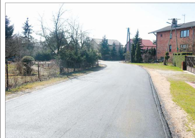
Nawierzchnię asfaltową zyskała w tym roku ulica Żeglarska