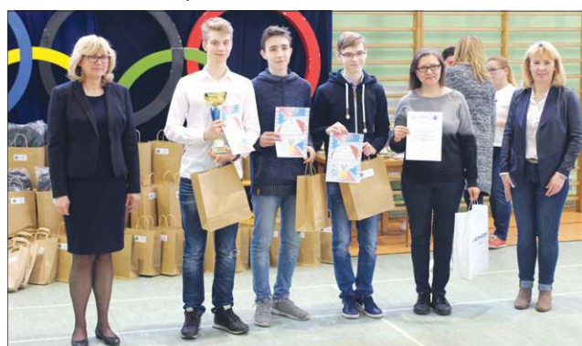
Zwycięskie reprezentacje Gimnazjum Powiatowego w Sochaczewie i Szkoły Podstawowej nr 4

W rywalizacji wzięło udział 13 szkół: siedem podstawówek (SP 1, SP 2, SP 4, SP 6, SP 7, SP w Brochowie, SP w Kozłowie Szlacheckim) i sześć gimnazjów (Gimnazjum Powiatowe, Gim. 2, Gim. Iłów, Gim. Teresin, Gim 3, Gim. Kozłów Szlachecki). Uczniowie starto-