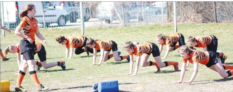
Mecz z mistrzami Polski poprzedził pokazowy trening żeńskiej drużyny Tygrysic

udział kapitanowie i trenerzy obydwu zespołów.