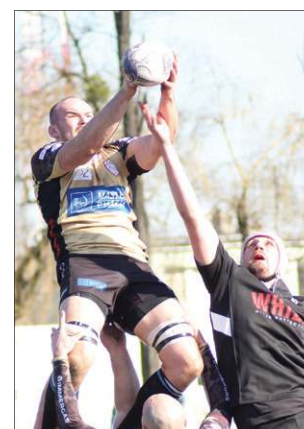
Whizz przegrywał auty