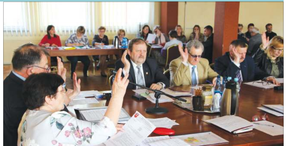
Radni powiatowi byli jednomyślni w kwestii podejmowanych uchwał

Rada określiła szczegółowe warunki umarzania w całości lub w części, odraczania terminu płatności, rozkładania na raty lub odstępowania od ustalenia opłaty za pobyt dziecka w pieczy zastępczej.