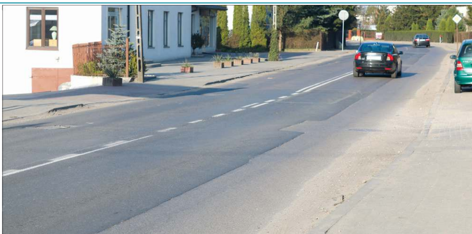
W tym roku na remont ulicy Chopina województwo przeznaczyło 5 mln zł

Samorząd Mazowsza przysięga się też do remontu alei 600-lecia. Za wykonanie do-