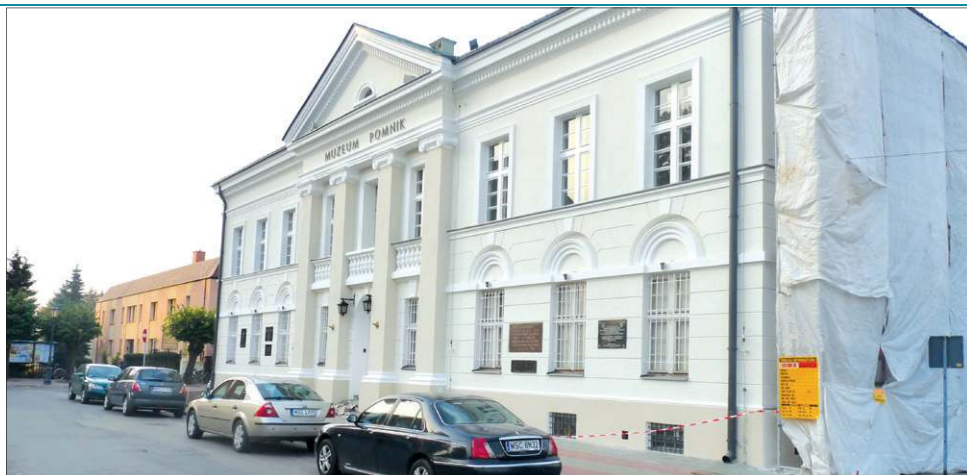
W budynku muzeum sukcesywnie od kilku lat prowadzone są prace modernizacyjne

- Ogłosiliśmy przetarg na termomodernizację muzeum i będziemy ją prowadzić w ramach większego projektu pod nazwą „Sochaczew (od) Nowa”, na który udało się zdobyć poważne dofinansowanie unijne i rządowe. Planowane prace mają się zakończyć przed pierwszymi jesiennymi chłodami, do 28 września - mówi burmistrz Piotr Osiecki.