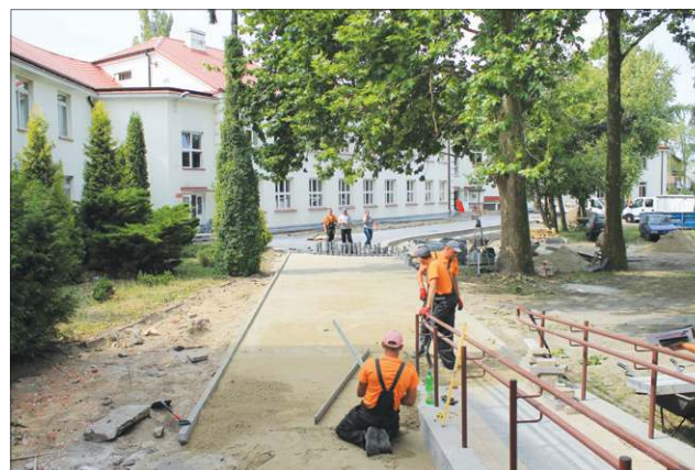
To dzięki SBO Szkoła Podstawowa nr 7 zyskała nowy parking

Głosowanie potrwa od 1 do 19 października. Podobnie jak w poprzednich latach przebiegnie dwutorowo. Wy-