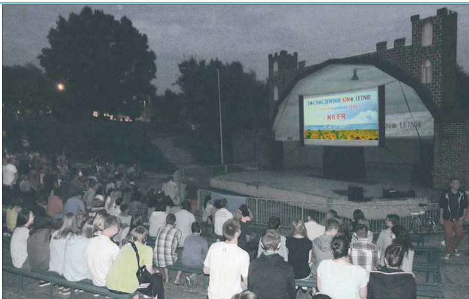
W pierwszej edycji SBO wygrało m.in. kino letnie. Od tamtej pory miasto organizuje seanse w każde wakacje

Pomysły na konkretne projekty można będzie składać od 15 czerwca do 15 sierpnia. Mają do tego prawo wszyscy mieszkańcy Sochaczewa w wieku powyżej 16 lat oraz organizacje pozarządowe działające na terenie miasta. Następnie propozycje projektów trafią do właściwych wydziałów urzędu miejskiego, a ich pracownicy zweryfikują je pod względem merytorycznym. Kluczowe kryteria, które będą brane pod uwagę na