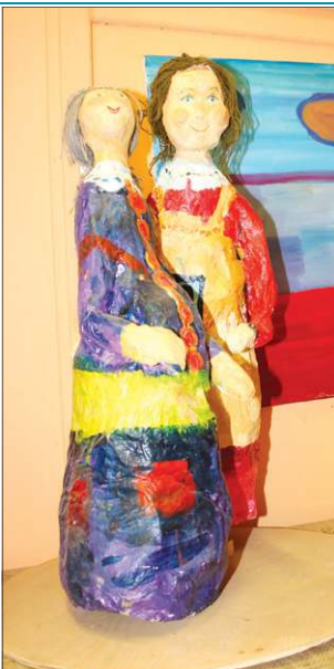
Jedna z prac pt. „Rodzina”