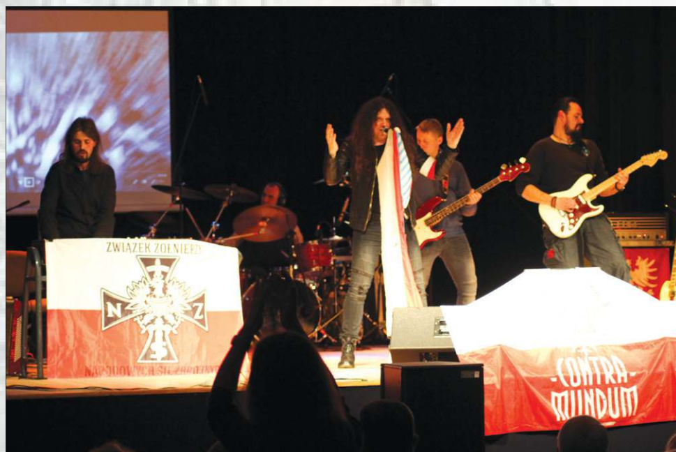
Contra Mundum to mocny patriotyczny przekaz

Zespół zagrał m.in. takie utwory jak: „Pieśń Konfederatów Barskich” do słów Juliusza Słowackiego,