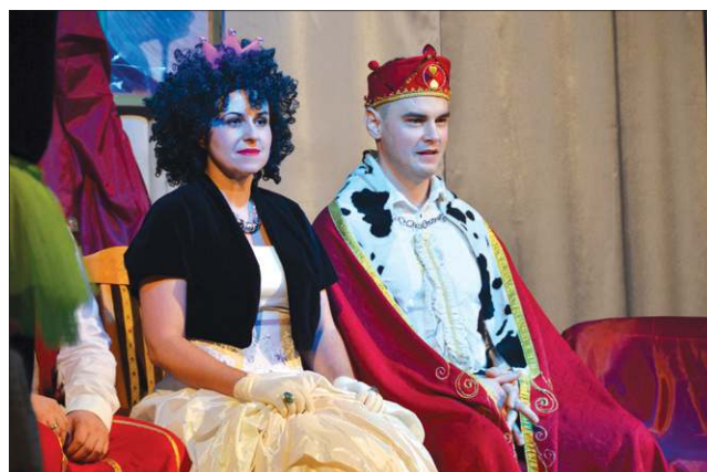
Z okazji tygodnia integracji nauczyciele przygotowali spektakl pt. „Kopciuszek”

ga on na tym, że przybliżają wszystkim uczniom szkoły jedną niepełnosprawność. Zapraszają gości, przygotowują informacje, a nawet spektakle. Jednym słowem uwrażliwiają młodych ludzi na różne schorzenia i problemy zdrowotne ich kolegów.