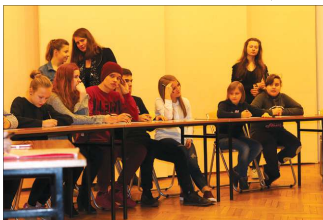
Uczestnicy quizu musieli odgadnąć, gdzie nagrano puszczone z głośników dźwięki

To święto patrona szkoły, Fryderyka Chopina, organizowane przez uczniów i dla uczniów. Klasy młodzieżo-