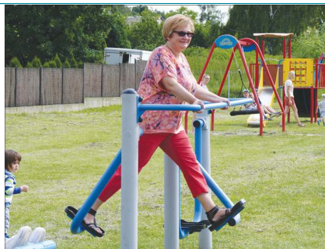
Podobny plac, jak przy Kochanowskiego, jest przy Kozubowskiego. Tam też obok urządzeń zabawowych stoi siłownia.