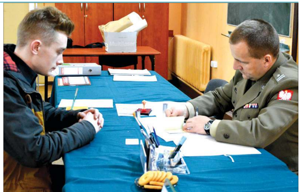
Kwalifikacja wojskowa nie oznacza poboru do wojska, ale przed komisją stawić się trzeba

Kwalifikacji nie należy mylić z poborem do wojska. Jej celem jest tylko określenie fizycznej i psychicznej zdolności do czynnej służby, założenie ewidencji wojskowej osobom podlegającym temu obowiązkowi oraz osobom zgłaszającym się na ochotnika.