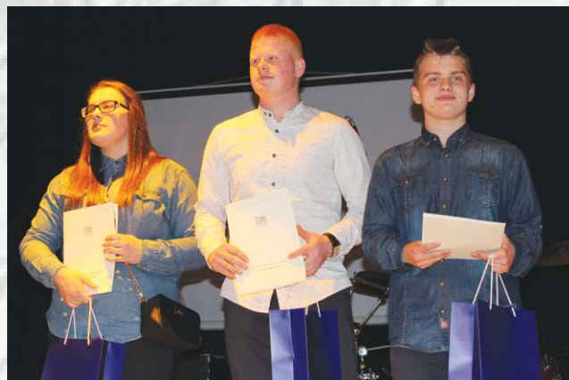
Laureaci VI Konkursu Wiedzy o Żołnierzach Wyklętych

„I znów tupot nóg żołdakich” (sł. Władysław Sebyła), „Hymn V Brygady Wileńskiej AK”, kompozycję „Już dopala się ogień biwaku” będącą ścieżką dźwiękową do filmu „Wyklęty”. Wspólnie z zaproszonymi na scenę gośćmi, z flagami Polski, wykonali utwór „Chłopcy silni jak stal” do słów Józefa Szczepańskiego ps. Ziutek i muzyki Dmitrija Pokrassa. Na bis zegrali z mocno antykomunistycznym akcentem „Czer-