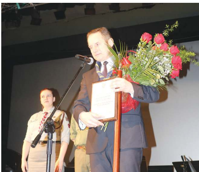
Burmistrz Osiecki nie krył wzruszenia po otrzymaniu tytułu