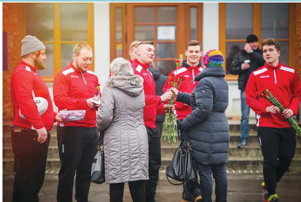
Sochaczewscy rugbyści pamiętali o mieszkankach miasta w dniu ich święta

Rugbiści na swój pierwszy mecz zapraszali już w Dzień Kobiet 8 marca, gdy pojawili się z kwiatami pod dworcem PKP i pod Urzędem Miasta. Każda z pań z życzeniami od zawodników dostawała goździka oraz zaproszenie na mecz z Budowlanymi. Akcja została przyjęta z ogromną sympatią. Na miejskim profilu na Facebooku galeria zdjęć z tego wydarzenia ma ponad 260 „lajków”, co jest jednym z najlepszych wyników w historii portalu.