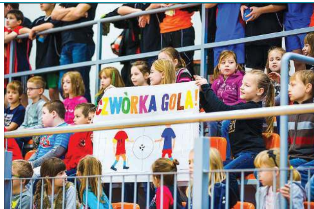
Dzieci mają do dyspozycji nowoczesną halę z trybunami