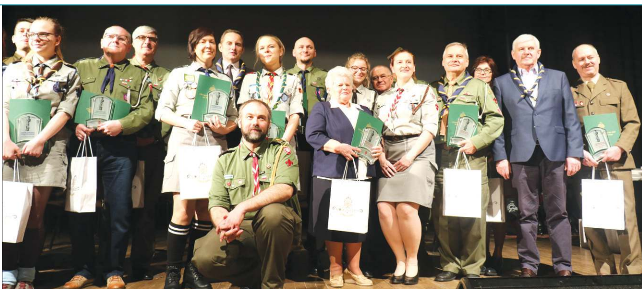
Do Sochaczewa przyjechali harcerze z odległych krainów województwa