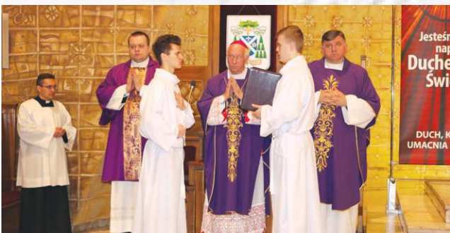
Poprzedzając koncert mszę celebrował biskup łowicki Andrzej F. Dziuba

Podobne wydarzenia - koncerty i wykłady historyczne - będą miały miejsce w kościele św. Wawrzyńca w każdy pierwszy poniedziałek miesiąca. (seb)