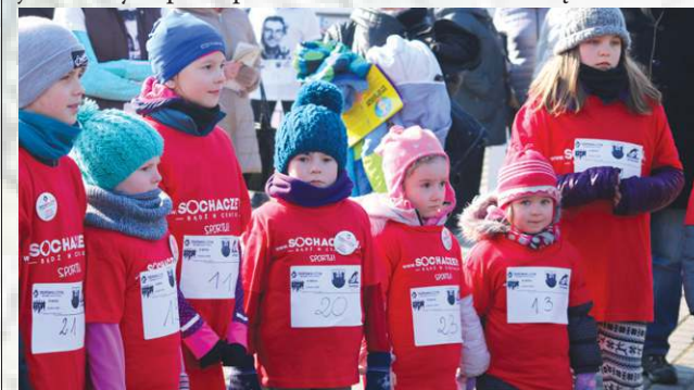
Mali uczestnicy tuż przed rozpoczęciem biegu rodzinnego