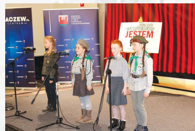
Pieśnią „W listopadzie” podopieczne GOK w Iłowie wyśpiewały sobie I miejsce w kategorii klas I-III szkół podstawowych