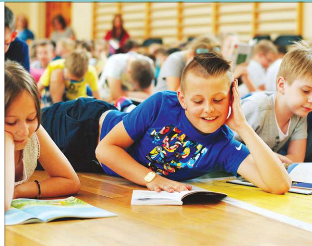
Do klas I przyjęte będą dzieci z rocznika 2011 i 2012

Do klas I szkół podstawowych przyjmowane są dzieci 7-letnie (urodzone w roku 2011) - objęte obowiązkiem szkolnym oraz dzieci 6-letnie (urodzone w roku 2012) - jeżeli rodzice wyrażą taką chęć i dziecko korzystało z wychowania przedszkolnego w poprzednim roku szkolnym albo posiada opinię poradni