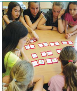
Na świetlicy szkolnej czas lubią spędzać zarówno młodszy, jak i starsi uczniowie

Na walory integracyjne zwracamy szczególną uwagę, ponieważ SP nr 4 jest jedyną w mieście podstawówką tak przystosowaną do potrzeb osób niepełnosprawnych. Nie znaczy