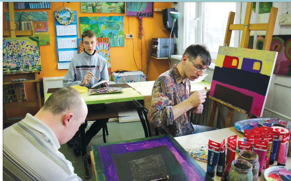
Pracownia malarska jest prawdziwą kuźnią talentów