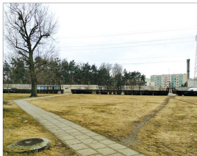
Miejsce w którym ma powstać teren rekreacyjny

Kilka dni temu burmistrz ogłosił przetarg na dostawę i montaż urządzeń zabawowych i elementów siłowni zewnętrznej. Wy-