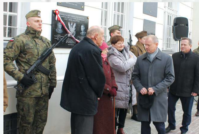
1 marca odsłonięto pamiątkową tablicę

Warto też nadmienić, że muzealne spotkania to nie tylko jeden dzień w roku poświęcony kulturowaniu pamięci o bohaterach. Wiąże się one z całoroczną pracą nad projektem badawczym „Wyklęci znad Bzury”, którego celem jest upamiętnienie i przybliżanie sylwetek żołnierzy polskiej konspiracji niepodległościowej po roku 1945. Badacze skupiają się na zasłużonych, którzy swój szlak bojowy II wojny światowej, zaczęli w rejonie Sochaczewa, podczas bitwy nad Bzurą w 1939 r. Przez 9 lat w ramach projektu udało się odnaleźć i zaprezentować biogramy wielu żołnierzy i oficerów WP. Rozpowszechniono w ten sposób wiedzę o postaciach takich jak generał Aleksander Krzyżanowski ps. Wilk czy pułkownik