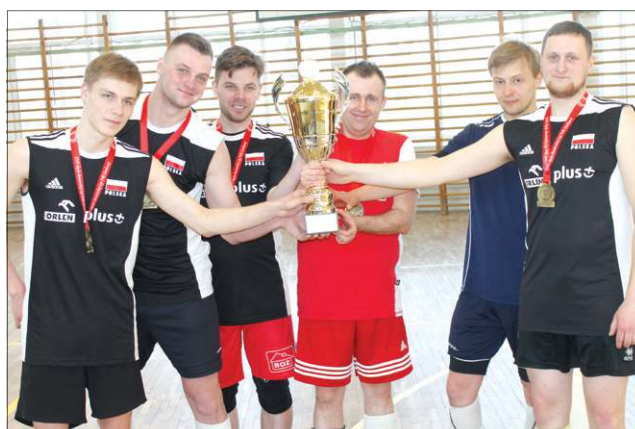
Wolne Elektry z pucharem XXIV edycji ALPS