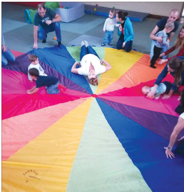
Zabawy z chustą cieszą zarówno maluchy, jak i dorosłych

zając. Podczas finałowego festynu wręczone zostaną nagrody i dyplomy uczestnikom największej liczby warsztatów.