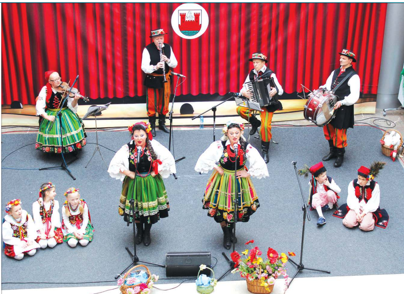
Kapela Mazowiecka podczas występu w kramnicach zachwycała dzieci i dorosłych

Niezwykle ważną postacią w historii zespołu był Wojciech Siemion.