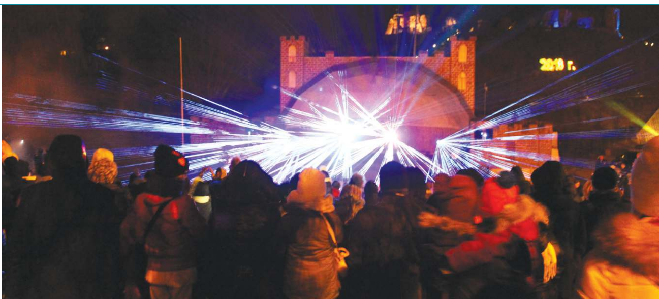
26. Finał WOŚP zakończyło laserowe „Świąteczny Finał”

Celem tegorocznego, 26 już Finału WOŚP, było pozyskanie środków „dla wyrównania szans w leczeniu noworodków”. Zebrane pieniądze wesprą działania oddziałów neonatologicznych w całej Polsce. Neonatologia była celem Finałów WOŚP już siedmiokrotnie. Dzięki Wielkiej Orkiestrze Świątecznej Pomocy na wszystkie oddziały noworodkowe w Polsce trafiły 3 844 urządzenia medyczne za łączną kwotę 121 909 333,39 zł. Rodzice najmniejszych pacjentów mogą dziś, w razie potrzeby, liczyć na gotowość do pracy 1160 inkubatorów, 367 stanowisk do resuscytacji noworodków czy 344 kardiomonitorów. Na ostateczne wyniki ogólnopolskiej zbiórki przyjdzie nam jeszcze trochę poczekać (zwykle WOŚP podaje je dopiero w marcu).