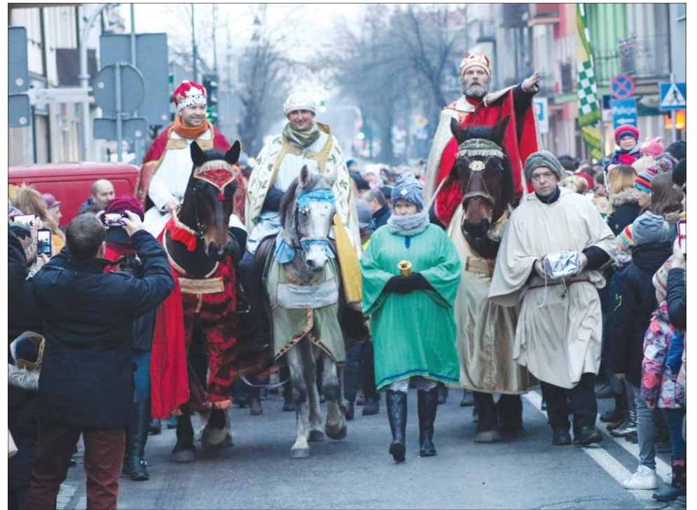
Królowie tradycyjnie przyjechali na koniach, wioząc ze sobą dary