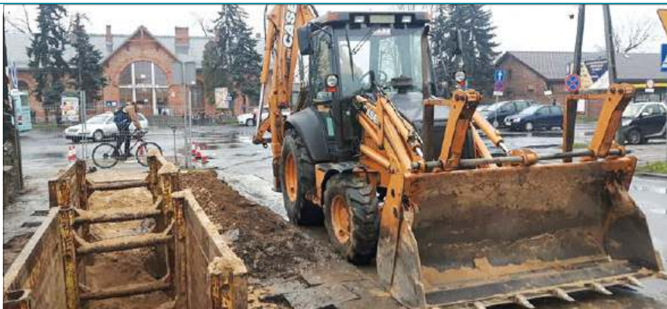
Budowa kanalizacji w rejonie dworca PKP to największe zadanie ZWiK

- Do 12 marca nasza spółka opracuje i przekaże „Wodom Polskim” wniosek o zatwierdzenie nowej taryfy. Nie przewidujemy w niej żadnych podwyżek, mimo że nadal chcemy inwestować w wodociąg i sieć sanitarną, do tego spłacamy zobowiązania zaciągnięte na budowę 96 km kanalizacji sanitarnej. Kosztowała 105 mln zł, przy czym unijne dofinansowanie sięgnęło 50,4 mln, ale resztę spółka musiała wyłożyć sama. Jestem jednak optymistą, że bez podwyżek uda się zrealizować wszystkie zamierzenia - mówi prezes ZWiK Stanisław Grażka.