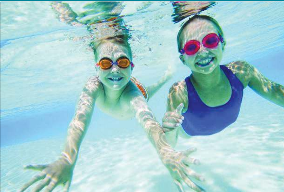
Dzięki ofercie sochaczewskich jednostek ferie nie muszą oznaczać jedynie siedzenia przed telewizorem

„W indiańskiej wiosce” - tworzymy indiańskie pióropusze, fletnie i kije deszczowe (hala MOSiR przy ul.