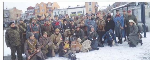
Uczestnicy jednej z poprzednich edycji rajdu

Pójdą na rajd i poczują się jak żołnierze Wielkiej Wojny