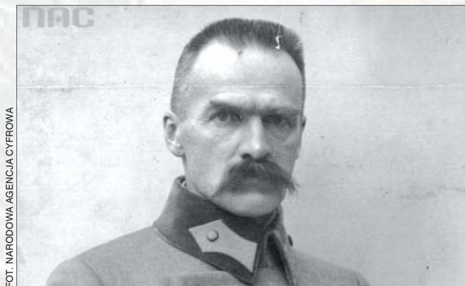
Miasto szuka takiej podobizny marszałka, która w pełni odda podobieństwo naczelnika i będzie posiadała wysokie walory artystyczne

Ponad sto punktów liczy oficjalny program obchodów 100-lecia niepodległości na ziemi sochaczewskiej. Kulminacyjnym punktem obchodów będzie odsłonięcie popiersia marszałka Józefa Piłsudskiego 11 listopada 2018.