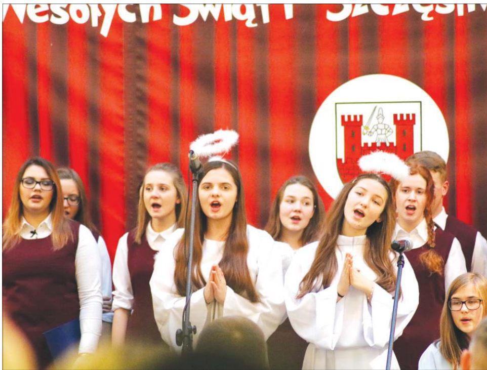
Aniołowie się radują, pod niebiosa wyśpiewują