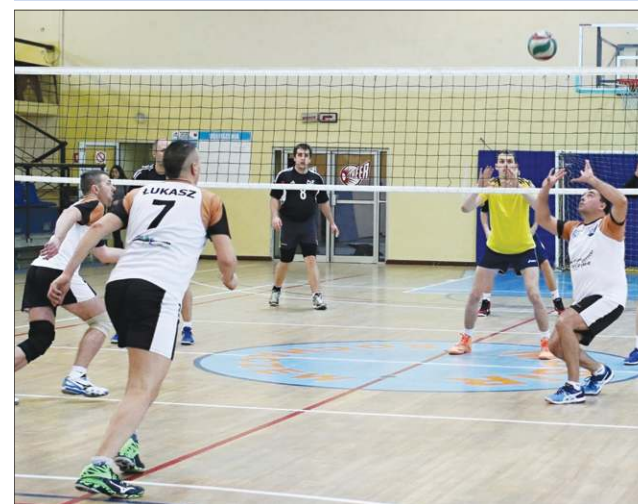
GOSiR Babice w dziesiątej kolejce pokonał w trzech setach SRS Most Wyszogród i został samodzielnym liderem w tabeli ALPS