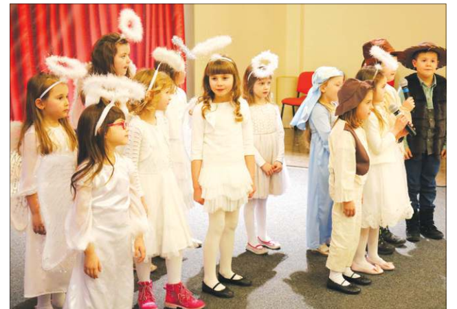
Ulubieńcy publiczności - zespół „Gwiazdeczki” z Teresina

To nie koniec sochaczewskiego kolędowania. 21 stycznia o 18.00 w kościele św. Wawrzyńca z koncertem pieśni bożonarodzeniowych wystąpi Chór Towarzystwa Śpiewaczego Ziemi Sochaczewskiej, a 26 stycznia o 11.00 w SCK w Boryszewie odbędzie się „Seniorów Kolędowanie”. Na obydwu wydarzeniach wstęp wolny.