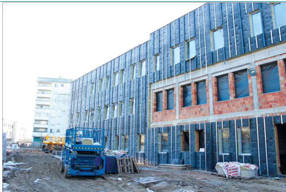
Na działce przy ul. 1 Maja stoi już budynek nowej komendy. Wygląda imponująco

Pierwsze piętro zajmą przede wszystkim pomieszczenia biurowe. Każde z nich przeznaczone zostanie dla dwóch do trzech funkcjonariuszy. Na tym piętrze swoje biura będą mieli także komendant powiatowy i jego