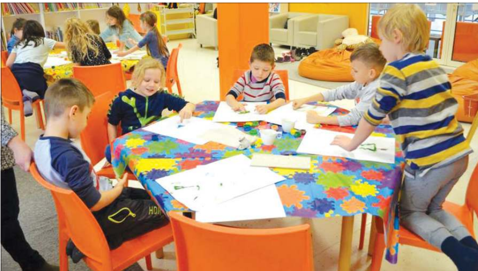
W MBP na pewno każde dziecko znajdzie dla siebie jakieś ciekawe zajęcia

Kusocińskiego 2, godz. 9:30-11:30); „To największe jest szaleństwo nie znać słowa bezpieczeństwo” - Teatr Maska (MBP Oddział dla Dzieci nr 1, ul. 1 Maja 21, kramnice miejskie); „Mózgowe sztormy ponad wszelkie normy” - quizy, krzyżówki, zabawy edukacyjne, gry planszowe, scrabble (MBP Oddział dla Dzieci nr 2, ul. Chopina 160, godz. 11:00-13:00); „Zimowe krajobrazy” - zajęcia plastyczne (MBP Filia nr 3, ul.15 Sierpnia 83, godz. 12:00-14:00); wykład „Monte Cassino i Falaise - walki na krańcach Europy” (Muzeum Ziemi Sochaczewskiej i Pola Bitwy nad Bzurą, godz. 12.00, wstęp: bilet 4 zł/ulgowy i 8 zł/normalny).