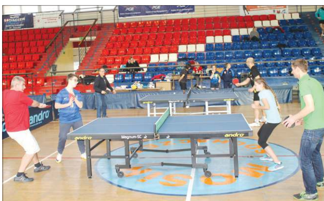
W turnieju Rodzina na Medal zagrało ponad 30 osób

jednak cieszy fakt, że w turnieju wzięły udział osoby, które po raz pierwszy miały styczność z tenisem stołowym. Każdy z uczestników otrzymał nagrody piękne statuetki i puchary.