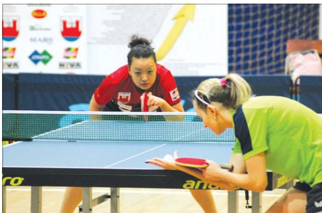
We własnej hali mecze gra się łatwiej

W niedzielę 14 stycznia Sochaczewski Klub Tenisa Stołowego zorganizował VI edycję turnieju „Rodzina na Medal”. Do rywalizacji stanęły dzieci i młodzież oraz ich rodzice. Zawody zostały rozegrane w trzech kategoriach wiekowych (ze względu na wiek dziecka): 6-10, 11-15 i 16-18 lat. Wiele gier, zwłaszcza deblowych, było bardzo zaciętych i obfitowało w przyciągającą uwagę zagrania. Najbardziej