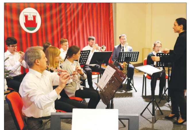
Orkiestra Dęta ma już za sobą pierwszy udany występ