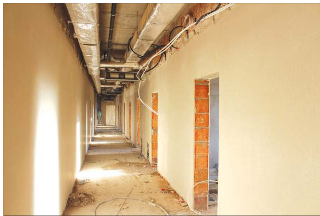
W budynku każdego dnia przybywa otynkowanych ścian

śli uda nam się utrzymać dobre tempo prac, budynek główny, garaże i kojce dla policyjnych psów oddamy do końca tego roku.