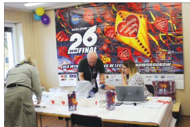
W hufcu na bieżąco liczone datki

26 finał WOŚP zakończył w Sochaczewie pokaz laserowy na podzamczu. Miał on formę projekcji „światło i dźwięk”, w którą wpleciono symbole miasta i WOŚP oraz ważne daty z historii Polski. Mimo mroźnej aury „Świąteczny Finał” przyciągnęło tłumy sochaczewian.