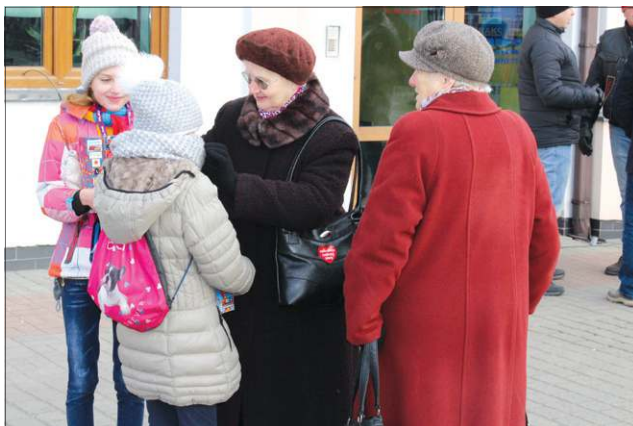
Wielką Orkiestrę wspomagali starsi...