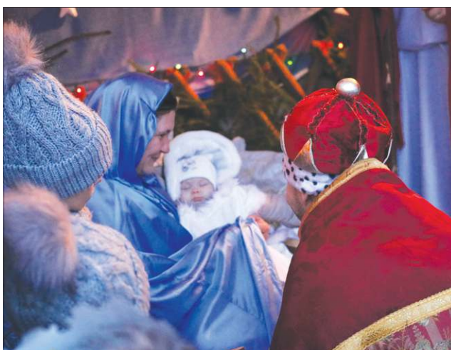
Pokłon Mędrców przed Jezusem