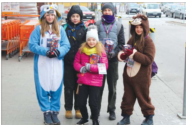
Dzieciaki z SP nr 4 podczas kwesty