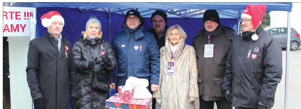
Jak co roku zbiórkę wsparła reprezentacja samorządowców

26 finał WOŚP zakończył w Sochaczewie pokaz laserowy na podzamczu. Miał on formę projekcji „światło i dźwięk”, w którą wpleciono symbole miasta i WOŚP oraz ważne daty z historii Polski. Mimo mroźnej aury „Świąteczny Finał” przyciągnęło tłumy sochaczewian.