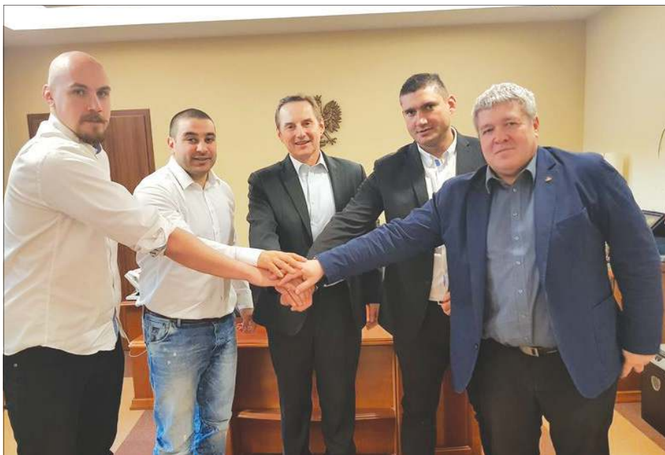
8 stycznia w ratuszu nowi zawodnicy podpisali roczne kontrakty z Orkanem

- Przyglądam się z dużą życzliwością projektowi, jaki powstaje w sekcji rugby Orkana. Widzę, że przygotowujecie wszystko z głó-