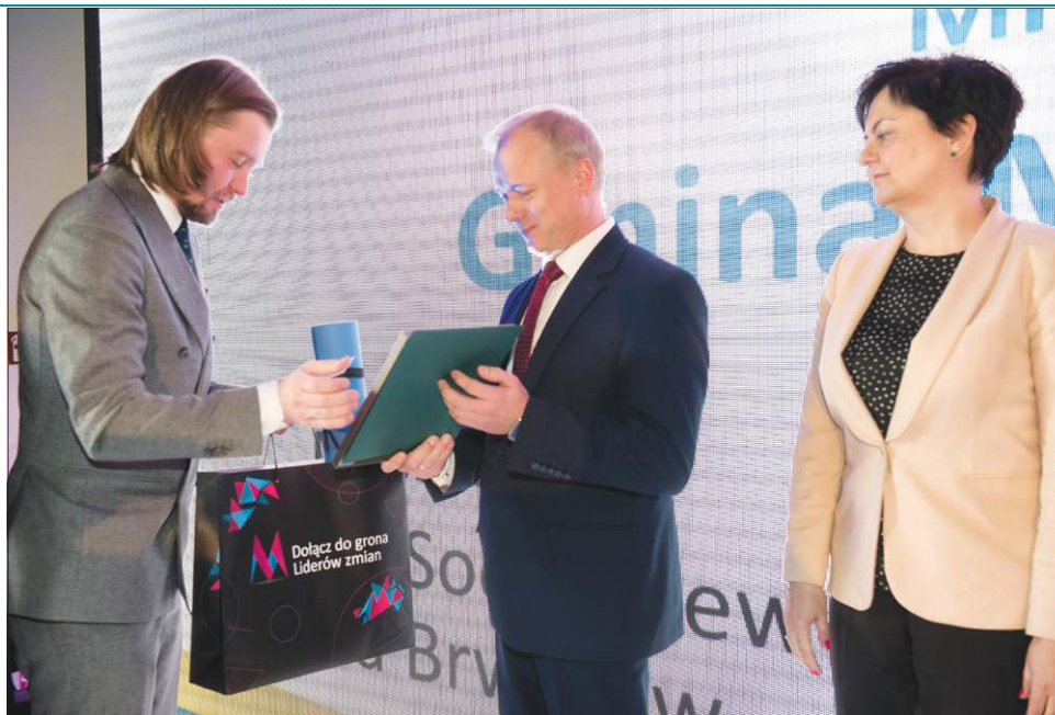
Sochaczew jest jednym z najaktywniej pozyskujących środki unijne samorządów w rejonie Warszawy

Nagradzano w dwóch kategoriach: najaktywniejszych (liczba złożonych wniosków) i najskuteczniejszych (środki pozyskane w przeliczeniu na liczbę mieszkańców). Samorządy rywalizowały w tzw. subregionach: ciechanowskim, ostrołęckim, płockim, radomskim, siedleckim, warszawskim wschodnim i warszawskim zachodnim. W każdym z nich wyłoniono po trzech zwycięzców. Nasze miasto, obok 28 innych gmin, znalazło się w subregionie warszawskim zachodnim. Tu tytuł „Lidera Zmian” otrzymał Mszczonów (12 złożonych wniosków), na drugiej