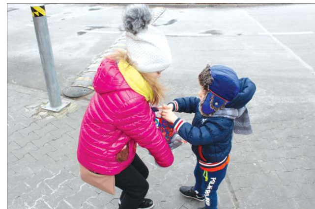
...oraz najmłodsi sochaczewianie