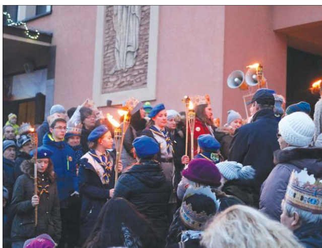
Drogę do stajenki oświetlały pochodnie