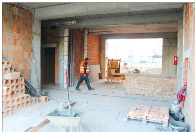
Główne wejście będzie przestronne i otoczone szklaną fasadą

- Kładziemy tynki i uzbrajamy obiekt. Instalacja wodno-kanalizacyjna położona została już w 80 proc., centralnego ogrzewania w 30 proc., elektryczna w około 25 proc. Mamy już wstawione prawie wszystkie okna. Na koniec położymy instalację lanową z bezpośrednim, zabezpieczonym w najwyższych standardach, połączeniem z innymi komendami w kraju. Je-