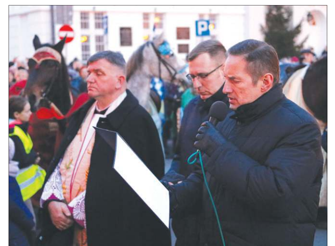
Zawierzenie kraju, miasta i parafii