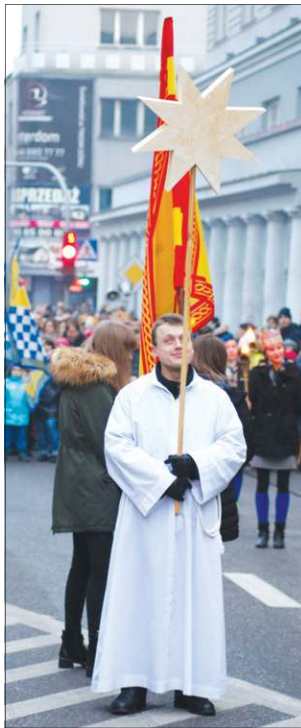
Orszak szedł za gwiazdą

Organizatorami wydarzenia, które już na stałe wpisało się w naszą tradycję, był sochaczewski ratusz oraz parafia św. Wawrzyńca.