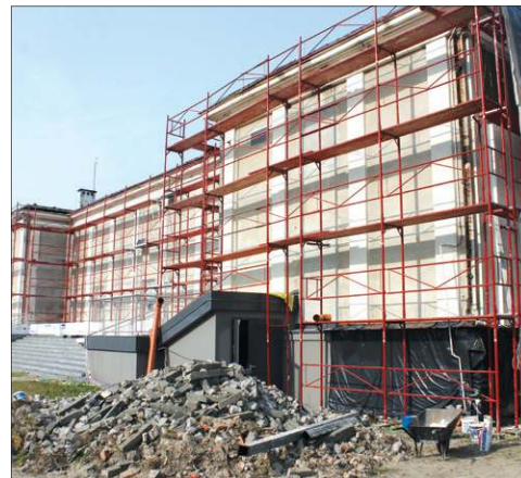
W 2017 roku w SCK w Boryszewie przeprowadzono drugi etap termomodernizacji

dionie w Chodakowie zamontowano elektroniczną tablicę wyników, a kilka tygodni temu podobną kupiono dla stadionu przy Warszawskiej, jednak ta zamontowana będzie później, w ramach plano-