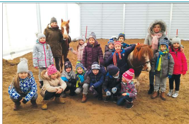
Uczniowie biorą udział w różnorodnych wycieczkach

Zapewne wielu rodziców obawiało się spotkania w jednej placówce maluchów z gimnazjalistami. Ich obawy okazały się niepotrzebne, bowiem starsza młodzież otoczyła najmłodszych troskliwą opieką. Od początku szkolnej kariery są ulubieńcami gimnazjalistów, można wręcz stwierdzić, że są ich oczkiem w głowie. Już pierwszego dnia w szkole każdy