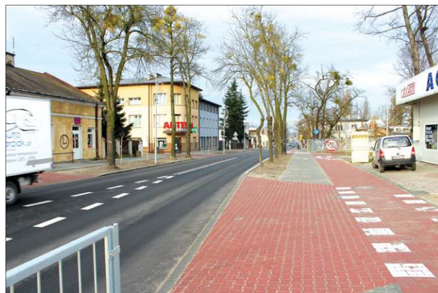
Ulica Chodakowska zyskała ścieżkę rowerową

firma budowlana. Remont Chodakowskiej to wspólny projekt MZDW, władz miasta, które wykonały i opłaciły projekt przebudowy oraz dobudowały oświetlenie, a także zakładu energetycznego. Ten ostatni przebudował podziemną sieć elektryczną wraz z przyłączami do poszczególnych posesji. Obecnie ulica została kompleksowo zmodernizowana i ma siedem metrów szerokości.