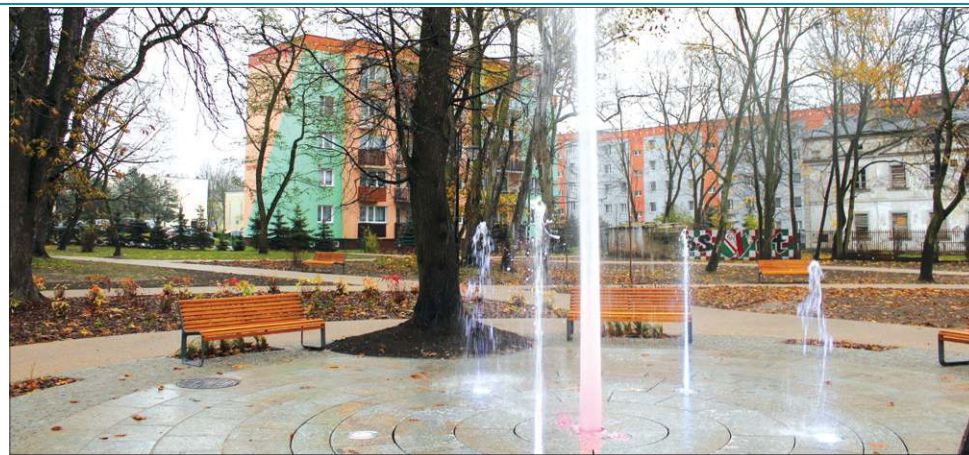
W wyremontowanym parku w Chodakowie największą atrakcją jest podświetlana fontanna

Poza wyliczonymi w tabeli obok inwestycjami, w budżecie 2017 znalazło się kilkanaście innych o łącznej wartości ponad 600 tysięcy. To m.in. doposażenie placów zabaw i siłowni zewnętrznych, wykup gruntów pod drogi, zakup nowych parkomatów i tablicy informacyjnej zawieszanej w holu UM. Środowisko sportowe zyskało nowe boisko do siatkówki plażowej przy ul. Chopina. W wakacje na sta-