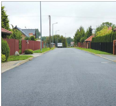
Ulica Kawalerzystów w dzielnicy Malesin. Przed asfaltem ułożono też kanalizację deszczową