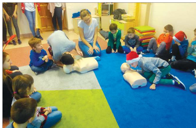
Maluchy uczyły się m.in. pierwszej pomocy

pierwszoklasista dostał opiekuna - ucznia klasy trzeciej gimnazjum. Ponadto Rada Rodziców ufundowała im różki obfitości ze słodką niespodzianką w środku.