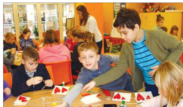
Dzieci mile spędzą czas w bibliotece

Ofertę feryjną przygotowało również Muzeum Ziemi Sochaczewskiej i Pola Bitwy nad Bzurą. Szczegółowe informacje na temat propozycji można uzyskać pod numerem: (46) 862-33-09. Obejmuje ona