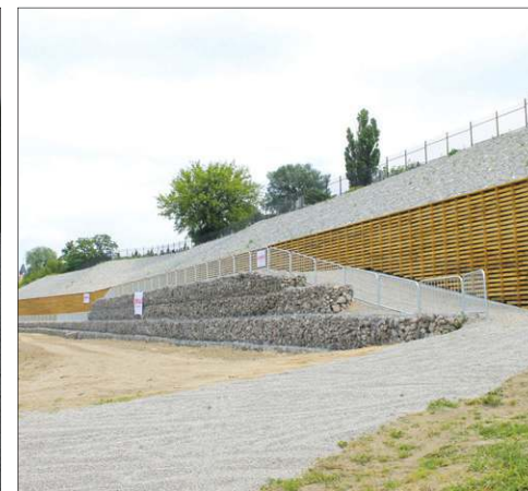
Mur oporowy umacniający skarpe Bzury