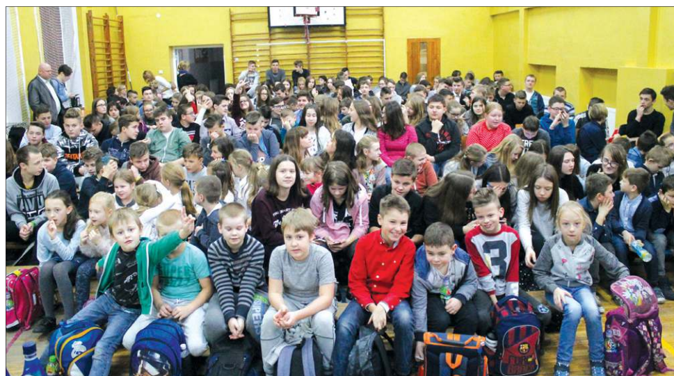
Sala gimnastyczna „siódemki” była wypełniona po brzegi

zonie Ligi Mistrzów ich dwa mecze, w których wysoko przegrali 0:4 z PSG i 0:3 z Juventusem Turyn.