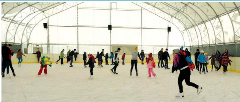
Lodowisko czeka na chętnych przez całe ferie

2 stycznia ruszyły zapisy na feryjne kursy nauki pływania. Miejsca można rezerwować osobiście w kasie basenu Orka lub pod numerem telefonu 862-77-59 wew. 127. Pod