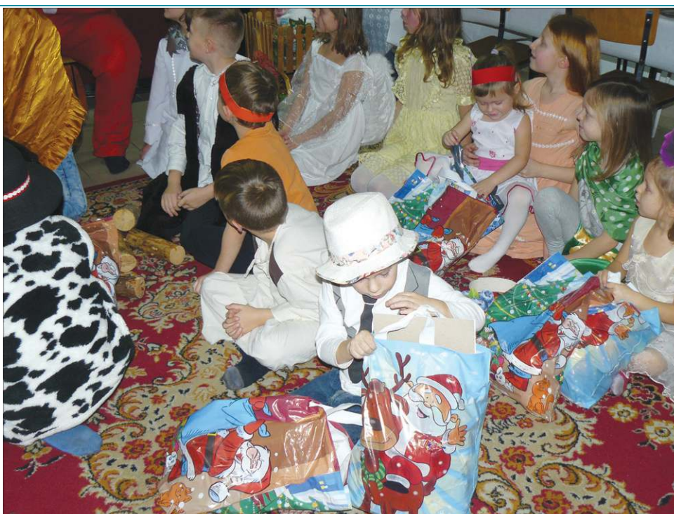
Paczki były tak ciężkie, że najmłodszy mieli problem z ich przenoszeniem

Dla rodzin w potrzebie dodatkowo staramy się przygotować wsparcie w postaci produktów spożywczych z długim terminem przydatności. Ich zbiórkę kolejny raz prowadziliśmy w sklepach sieci PSS. Klienci do specjalnych koszy wkładali zakupione w sklepie artykuły. Szereg mieszkańców indywidualnie przynosiło do nas dary. Ludzie dawali to, co mogli - kilka czekolad, puszkowane produkty, makaron, ryż lub olej. W tym miejscu chcielibyśmy jeszcze raz podziękować za wielkie serce wszystkim, którzy zdecydowali się dołączyć do „Paczki do Paczki”. Wiemy, że wielu darczyńców to osoby skromne, które nie chcą być wymieniane z imienia i nazwiska. Wielokrotnie ludzie ci sami nie mają wiele, a jednak starają się w miarę możliwości dzielić z innymi. Tradycyjnie wsparła nas społeczność Państwowej Szkoły Muzycznej, w któ-