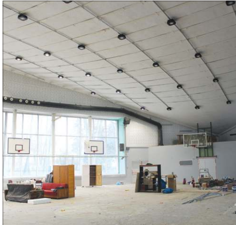
Zakres prac w chodakowskiej hali jest imponujący