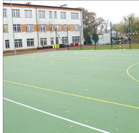
Z boiska korzystają uczniowie szkół podstawowych nr 1 i 3