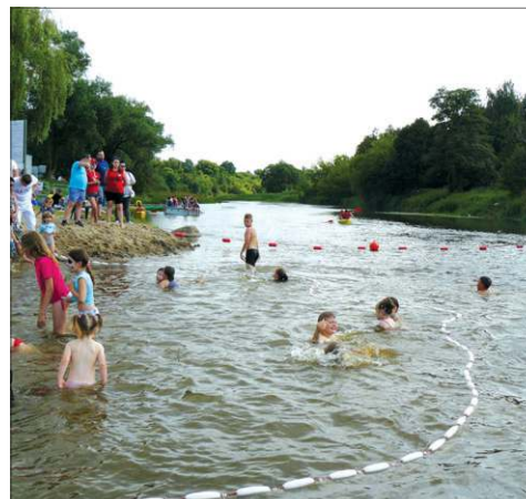
Kapielisko nad Bzurą było hitem lata