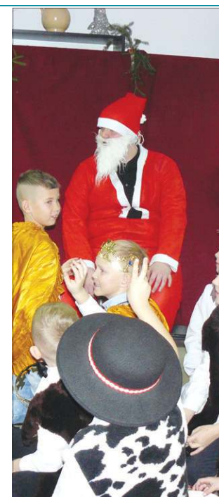
Św. Mikołaj zawsze wzbudza największe zainteresowanie