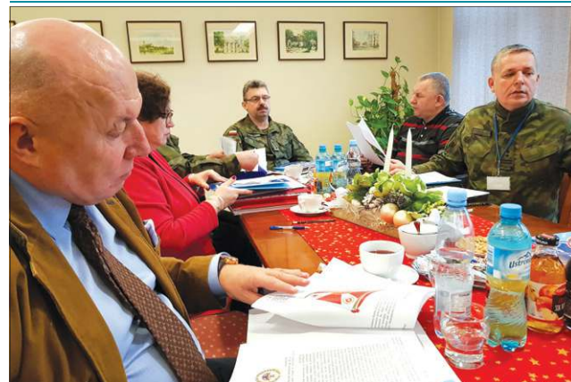
Drugie spotkanie komitetu fundatorów sztandaru odbyło się 18 grudnia w ratuszu

Minister Obrony Narodowej Antoni Macierewicz wyraził zgodę na ufundowanie sztandaru dla 37. Sochaczewskiego Dywizjonu Rakietowego Obrony Powietrznej. Na swym drugim posiedzeniu Komitet Fundatorów Sztandaru zatwierdził wzór sztandaru. Teraz do pracy mogą ruszyć wykonawcy.