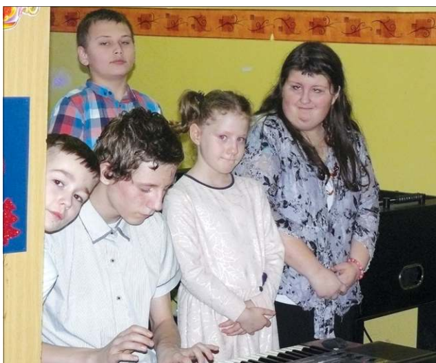
Występ podczas Wigilii to duża trema