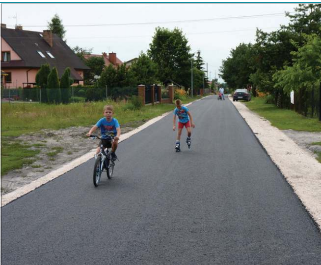
Piaszczystą utwardzono w lipcu

Jednym z największych tegorocznych projektów drogowych miasta jest budowa deszczówki i ułożenie asfaltu na ulicy Granicznej.