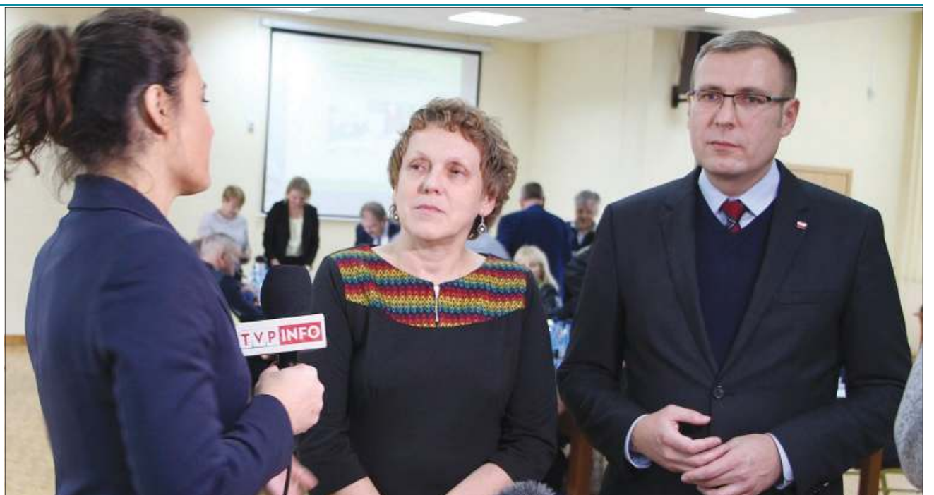
Deklaracją władz powiatu zainteresowały się ogólnopolskie media

Rada Powiatu w Sochaczewie wyraziła zdecydowany sprzeciw wobec próby rugowania symboli chrześcijańskich z przestrzeni publicznej. Nakaz francuskiej Rady Stanu o usunięciu krzyża z pomnika Papieża Polaka w Bretanii jest kolejnym przejawem walki z chrześcijaństwem i dyskryminacją ludzi wierzących, co zostało podkreślone w przyjętym stanowisku - „Święty Jan Paweł II jest symbolem zjednoczonej, chrześcijańskiej Europy. Działania podejmowane przez władze Francji wobec wspomnianego pomnika przypominają najgorsze totalitarne wzory. Polacy, w tym sam Karol Wojtyła, najboleśniej doświadczyli prześladowań katolików przez nazizm i komunizm.” Zdjęcie krzyża z pomnika to kolejny krok w degradacji chrześcijańskiego dziedzictwa. Jako katolicki kraj, z którego wywodzi się święty Jan Paweł II i którego nauczanie i myśli nam towarzyszą na każdym kroku - musimy stanowczo zareagować na to co, dzieje się we