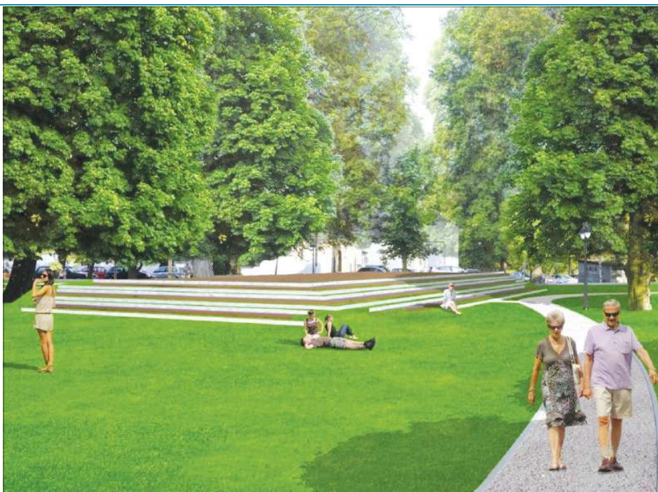
Tak będzie wyglądał park I. W. Garbolewskiego po zapowiadanej renowacji

Nie mniejszy zakres prac przewidziany jest w ramach rewitalizacji parku przy ul. Traugutta. Na 8 tys. m 2 przeprowadzone zostaną prace pielęgnacyjne drzewostanu oraz nasadzenia nowej zieleni. Projekt przewiduje wymianę 20 opraw oświetleniowych z pozostawieniem istniejących słupów. Nowe oprawy w swej formie będą nawiązywać do XIX-wiecznych latarni gazowych. Rozebrany zostanie budynek niedziałającej od lat toalety publicznej. W jej miejscu zainstalowane będą nowe toalety kontenerowe, zintegrowane z wiatą przystankową. Wewnątrz „zielonych płuc miasta” zaplanowano także renowację pomnika F. Chopina, instalację znaku przestrzennego w miejscu dawnej synagogi, budowę ścieżki rowerowej (łączącej trasę dla jednoślądów