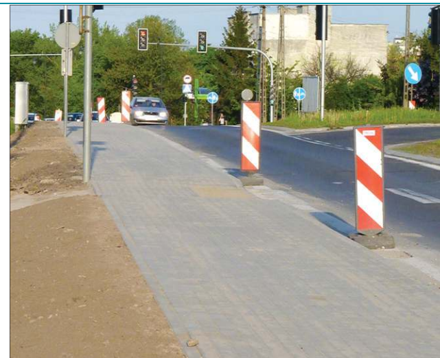
Nowy chodnik przy ul. Płockiej teraz dochodzi aż do Gawłowskiej

Wybudowano ich lub wymieniono niemal 1400 metrów, a największe dwa projekty przeprowadzono w