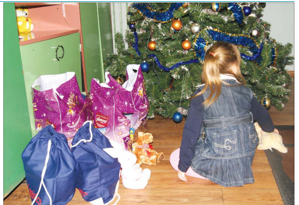
Każde dziecko marzy o tym, by znaleźć prezent pod choinką

A trafi do trzech ognisk wychowawczych Towarzystwa Przyjaciół Dzieci oraz świetlicy terapeutycznej „Kleks” w Chodakowie. To w tych placówkach spotykają się dzieci z niebogatych, wielodzietnych lub trudnych rodzin. Na co dzień przychodzą tu po szkole, odrabiają lekcje, jedzą posiłek, spotykają życzliwych sobie ludzi. Tutaj mogą porozmawiać o swoich problemach, poradzić się, otrzymać pomoc w nauce. Tutaj też, wraz z innymi, przeżywają najpiękniejsze chwile. Należą do nich wieczory wigilijne, podczas których dzieciaki prezentują jasełka, wraz z zaproszonymi gośćmi siadają do stołu, na którym króluje ryba, pierogi, no i opłatek. Tutaj poznają świąteczne rytuały, wigilijne potrawy i sens Bożego Narodzenia.