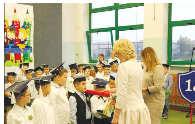
Nowi uczniowie nowo utworzonej SP nr 6 i nowa dyrektor