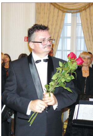
Dyrygent przyjmuje podziękowania

miasto ma najlepszego, ale Camerata Mazovia równie dobrze jak na Litwie brzmi w Sochaczewie. Zapraszamy więc do nas, do Polski.