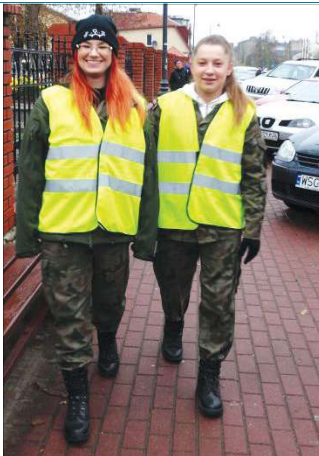
Policjantów wsparli uczniowie klasy mundurowej z ZS im. J. Iwaszkiewicza

W Brzozowcu 44-latką, kierującą pojazdem marki Volkswagen Bora, doprowadziła do zderzenia z Volkswagenem Passatem. W wyniku wypadku 18-letnia pasażerka volkswagena została przewieziona do szpitala. Także pod-