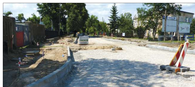
Część Licealnej przebudowano w 2016 roku przy okazji prac na rondzie

- I ja i pani starosta jesteśmy dobrej myśli, że kolejny raz sochaczewskie projekty drogowe znajdą się na ostatecznej liście rankingowej.