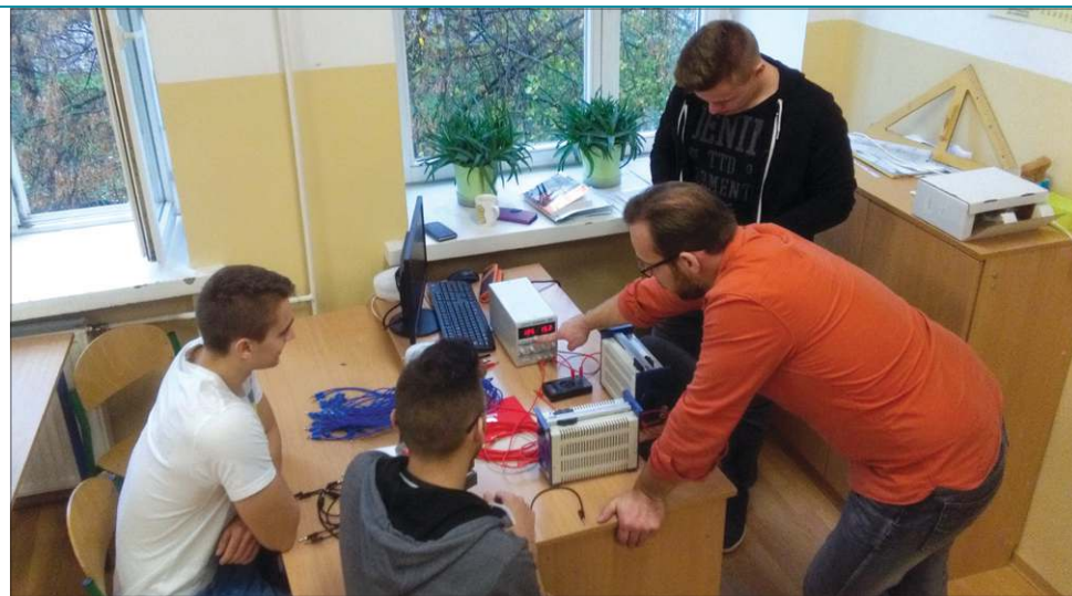
Klasa patronacka daje możliwość pracy z wysokiej klasy specjalistami

Obecnie koncern posiada fabryki i filie na wszystkich kontynentach oraz zatrudnia ponad 45.000 pracowników w ponad 1000 oddziałach. Początek działalności w Polsce datuje się na rok 1928. Ponownie, jako