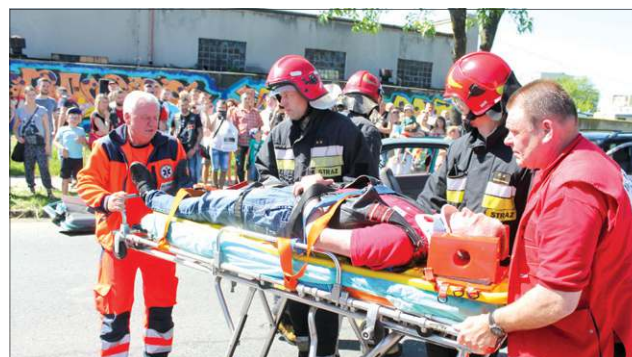
Tradycyjnie odbył się pokaz ratownictwa medycznego

Smile Crew z Sochaczewskiego Centrum Kultury.