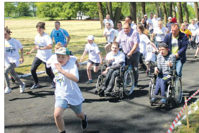
Imprezę rozpoczął start osób specjalnej troski