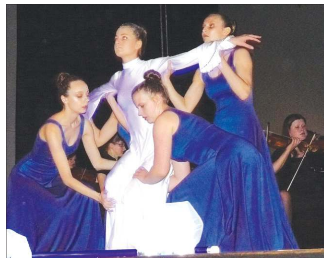
Grupa Abstrakt w choreografii przygotowanej specjalnie na ten koncert

Prawdziwą niespodzianką dla gości był jednak występ najstarszej grupy tancerek Abstraktu. Zjawiskowa choreografia uzupeł-