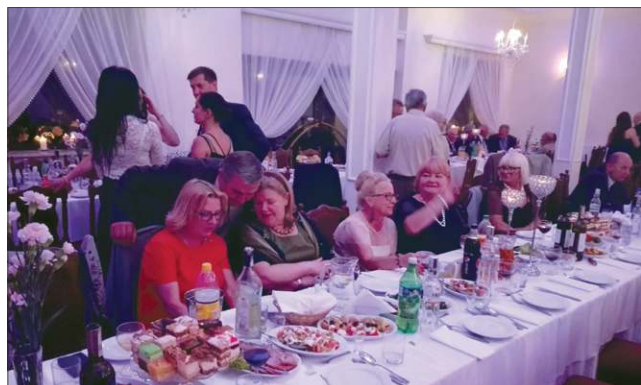
Uroczysty bal był okazją do dzielenia się wspomnieniami z czasów szkolnych