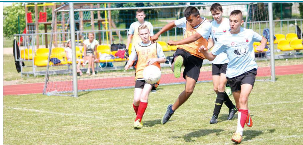
Na boiskach Zespołu Szkół grały kobiety i reprezentacje gimnazjów