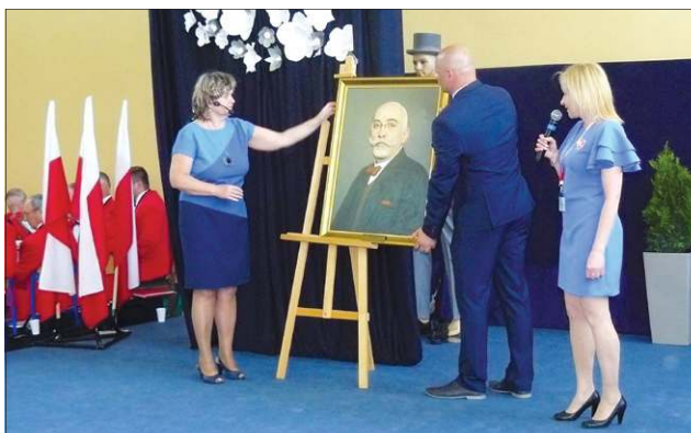
W szkole pojawił się portret nowego patrona, Ignacego Garbolewskiego