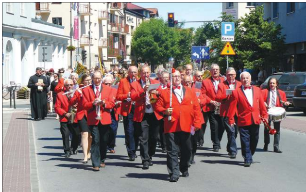
Uroczysty pochód otwierali „Czobodersi”