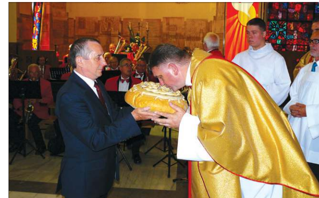
Tradycyjne przekazanie darów dziękczynnych