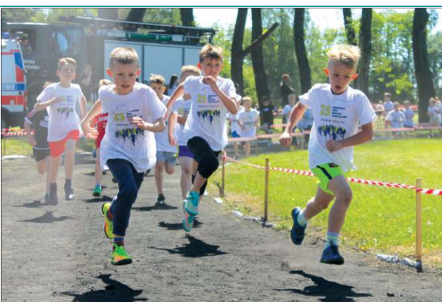
Biegi najmłodszych były najliczniej obsadzone

W ramach regularnych zawodów przeprowadzono w sumie 20 startów. Pobiegli uczniowie z 53 szkół podstawowych, reprezentacje 27 gimnazjów oraz ośmiu szkół ponadgimnazjalnych. Rywalizacja najmłodszych uczestników odbywała się na dystansie 500 m. Nastoletni lekkoatleci mieli do pokonania do 1,5 km. Pierwsze dziesięć osób przekraczających linię mety w każdym rozegrany biegu, dzięki wsparciu licznych sponsorów, otrzymywało atrakcyjne nagrody. Tradycyjnie, zwycięzcy odjeżdżali z Bielic na nowych, wysokiej klasy rowerach, ufundowanych przez firmę Bikeland.