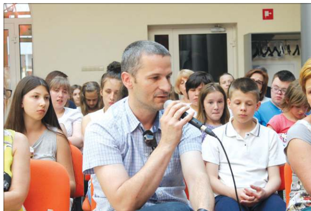
Opiekunowie szkolnych gazetek dyskutowali o ich przyszłości

nych wydawnictw. Rozmawialiśmy także o przyszłości tego typu periodyków. Nasz konkurs dawno wkroczył w wiek dorosły i chyba warto pomyśleć o unowocześnieniu jego formuły. Głównym powodem jest właśnie zmieniający się rynek mediów, co zauważalne jest od szczebla ogólnopolskiego aż po lokalny. Gazetki funkcjonują z powodzeniem na stronach internetowych i portalach społecznościowych. Rozważamy, czy w kolejnych edycjach nie nagradzać również aktywności szkolnych redakcji w sieci.