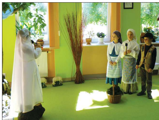
Objawienia fatimskie oczami dzieci z Przedszkola Diecezji Łowickiej

Były występy i konkursy przygotowane przez Klub Wolańtariatu, pokazy sztuk walki w wykonaniu Dragon Fight Club Sochaczew, kącik malucha zorganizowany przez fundację „Wesoła Chata”. Atrakcyjne nagrody w konkursach ufundowało Krajowe Stowarzyszenie „Z Sercem Do Wszystkich”, firma Mars Polska, sklep „Kubuś”, a kosmetyki dla mam z okazji ich święta rozdawały przedstawicielki apteki „Dar Natury” z ul. Warszawskiej.