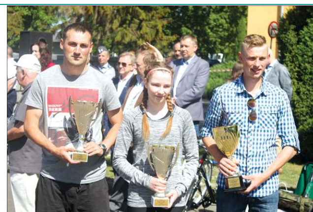
Wielokrotni zwycięzcy EBMO