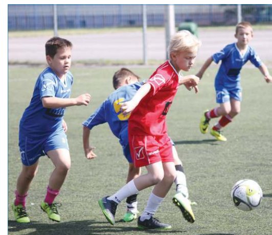
Najwięcej emocji przynosiła rywalizacja najmłodszych