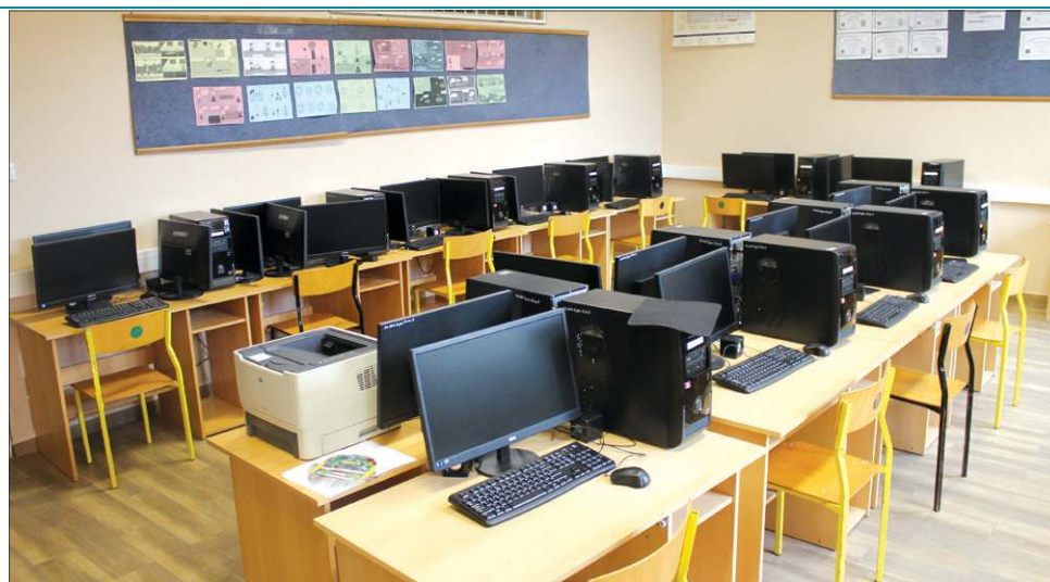
Nowa pracownia komputerowa w Zespole Szkół w Chodakowie. W kolejnej będą laptopy

206 uczniom szkoła zaproponuje dodatkowe zajęcia z matematyki, biologii, fizyki, informatyki i języka angielskiego. Wspierać ich będzie sześciu nauczycieli, którzy w ramach projektu m.in. udoskonala swoją wiedzę i umiejętności komputerowe. Szkoła otrzyma nowe