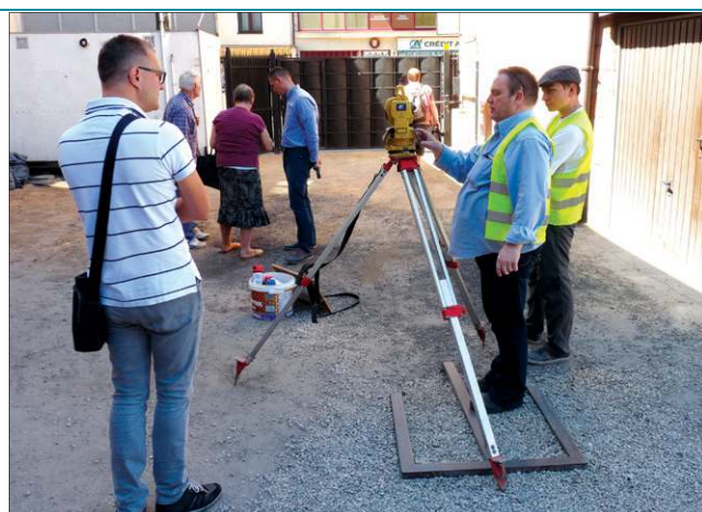
Do rozgraniczenia spornych terenów wezwany został geodeta

Jedynym dojazdem do dwóch działek na wspomnianym podwórku jest fragment należący do właścicielki nr 1. Sąd co prawda już dawno ustanowił dla niego wieczystą służebność z prawem do przejazdu do pozostałych posesji, co jest zresztą standardem w takich sytuacjach. Problem zaczął się jednak, kiedy właścicielka postanowiła potraktować orzeczenie sądu literalnie. Jako że prawo do korzystania z przejazdu mają wskazani mieszkańcy, właścicielka nr 1 odmawia korzystania z niego klientom znajdującym się w podwórku sklepu, dostawcom, a nawet rodzinom mieszkańców sąsiedniej nieruchomości. Taką postawę argumentuje troską o swoje bezpieczeństwo.