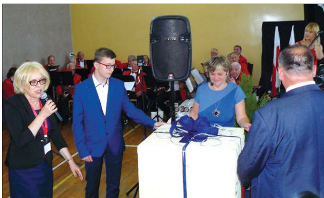
Tego dnia „80” otrzymała wiele prezentów, m.in. od zarządu powiatu...