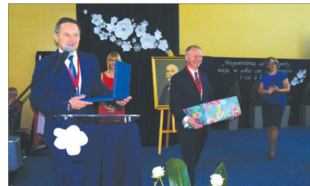
...i od władz miasta