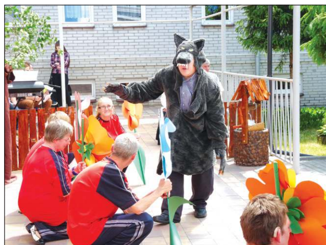
Podopieczni ŚDS w przedstawieniu „Czerwony Kapturek”