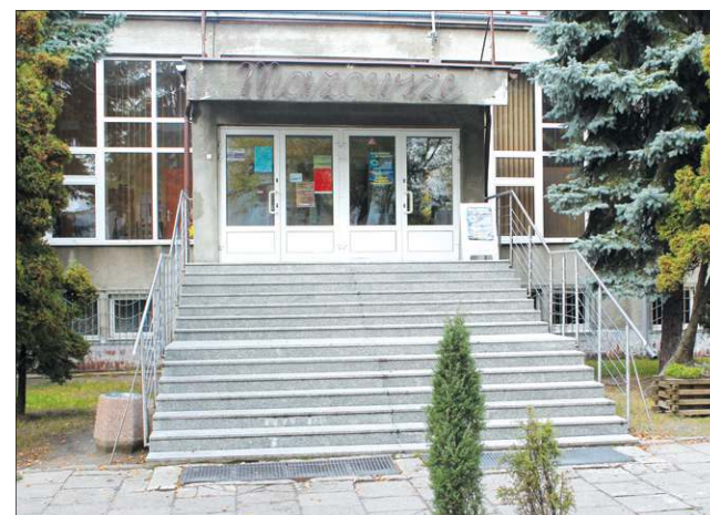
Elewacja SCK w Chodakowie zmieni się nie do poznania

Więcej na ten temat w kolejnym wydaniu „Ziemi Sochaczewskiej” (daw)