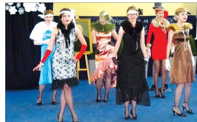
Nie zabrakło występów artystycznych