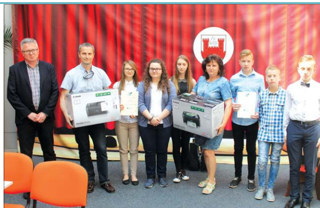
Redakcje „Zygzaka” i „Młodziesza” z nagrodami ufundowanymi przez burmistrza Piotra Osieckiego

W drugiej części zaprosiliśmy do dyskusji opiekunów gazetek szkolnych. Opowiadali oni o sposobach dystrybucji, pomysłach na znajdowanie ciekawych tematów, współpracy z uczniami nad kolejnymi numerami szkol-