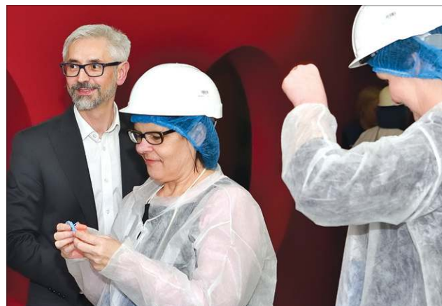
W halach produkcyjnych obowiązują wysokie standardy bhp

zł. Dzięki niej oraz dzięki wcześniejszym inwestycjom Mars zupełnie nie korzysta z wysypisk śmieci. Odpady powstające w fabrykach w 100 proc. są utylizowane lub przetwarzane w oczyszczalni. Ponadto firma o 25 proc. zmniejszyła emisję gazów cieplarnianych, a