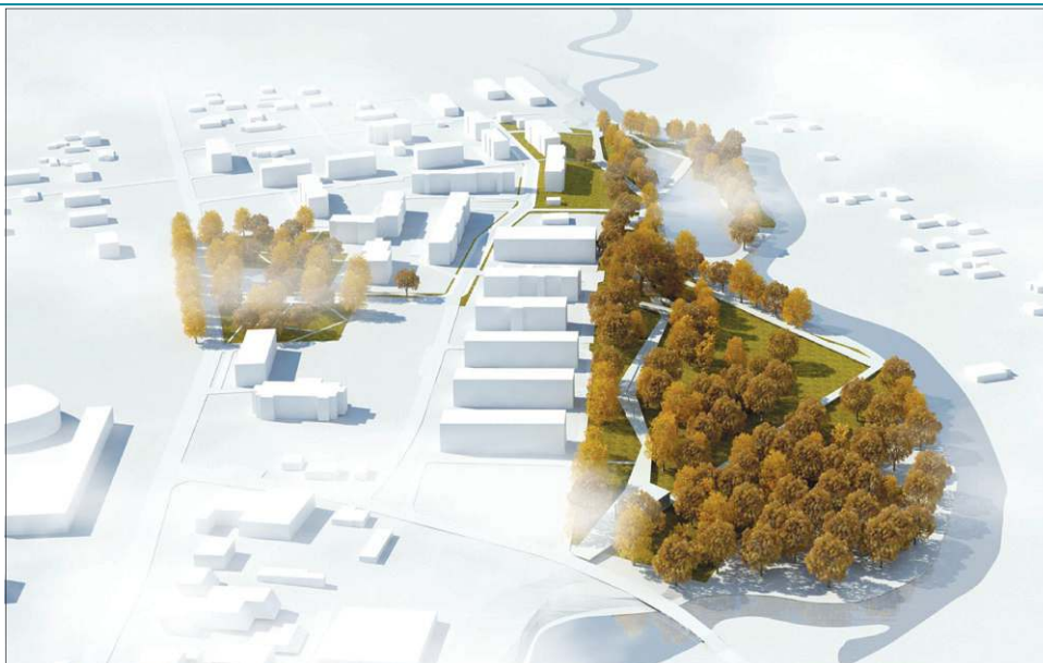
Tereny rekreacyjne nad Utratą w Chodakowie to jedno z miejsc przeznaczonych do rewitalizacji

Na terenie miasta ostatecznie udało się wskazać dwa obszary rewitalizacji. Pierwszy z nich to historyczne centrum zamieszkiwane obecnie przez 1030 osób. Zaliczono do niego ulice: Cmentarną, Farną, Wy-