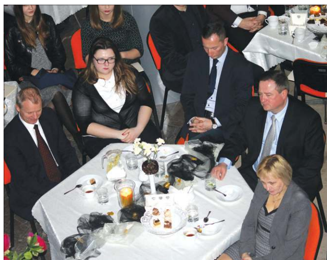
Nagrody i stypendia wręczali przedstawiciele władz miasta