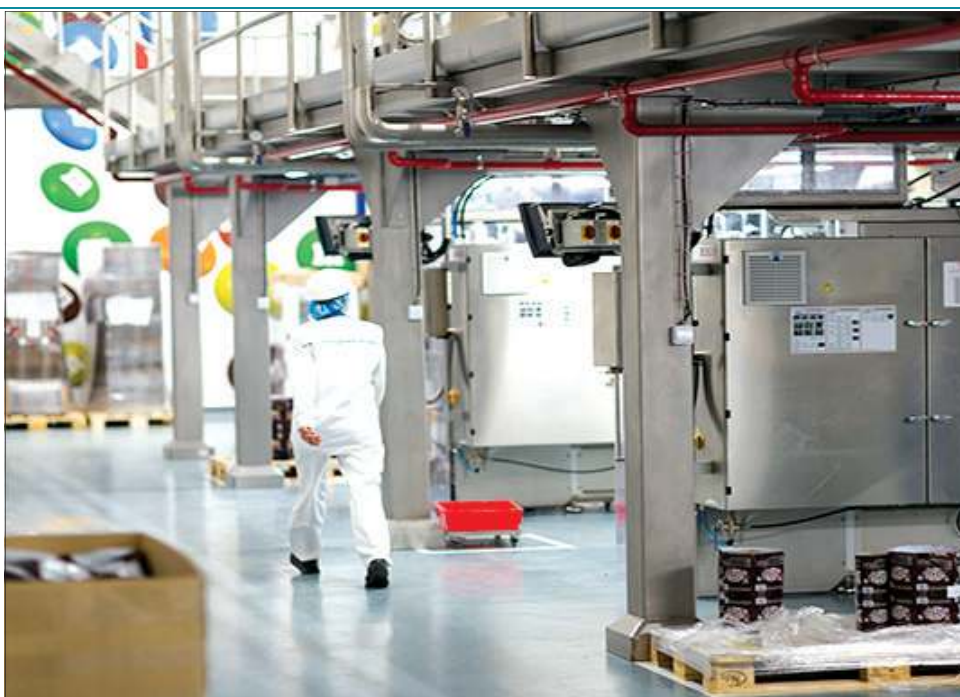
Fabryka czekolady Mars Polska produkuje 15 mln pudełek batonów rocznie

- Będąc w tym miejscu, w którym jesteśmy, często nie zdajemy sobie sprawy, jak bardzo na korzyść zmieniła się nasza okolica, jej infrastruktura, biznes, jaki do-