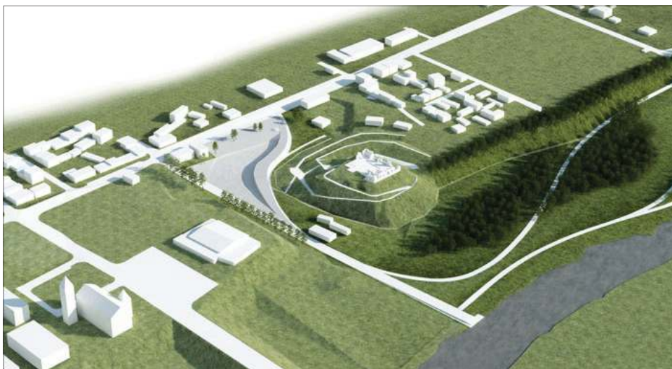
Nowa muszla koncertowa - na ten projekt miasto też chce pozyskać fundusze