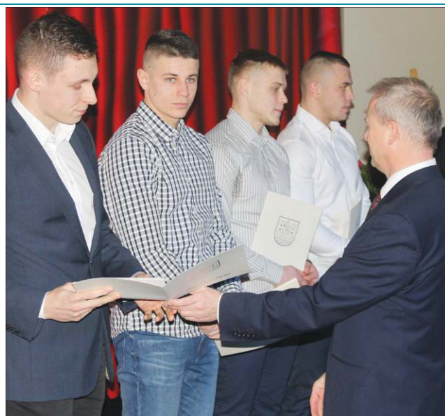
Młodzież RCO odbiera stypendia