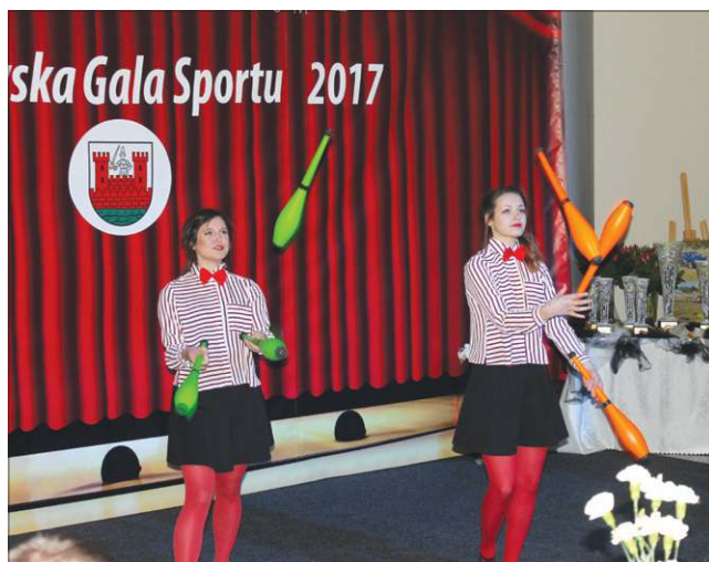
Galę uświetniły pokazy uczniów ze szkoły cyrkowej w Julinku