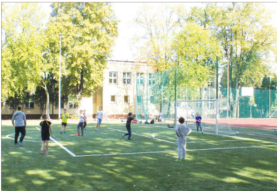
Boryszewska „dwójka” dostała nowe boisko w ubiegłym roku

• 300-metrowa, minimum trzytorowa bieżnia wokół boiska z przylegającą do niej 100-metrową bieżnią w linii prostej (nawierzchnia poliuretanowa lub tartanowa)