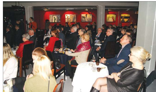
Sala nawiązuje wystrojem do lat 20. i 30. XX w.

Wydarzenie to nie doszłoby do skutku, gdyby nie prace remontowe w boryszewskim SCK rozpoczęte latem zeszłego roku. Pierwszym etapem była termomodernizacja obiektu i jego zabezpieczenie przed wodą, drugim - przekształcenie piwnic w kameralną salę koncertową. Wymieniona została instalacja centralnego ogrzewania, wyremontowane łazienki, wymienione drzwi, odnowione ściany i sufity.