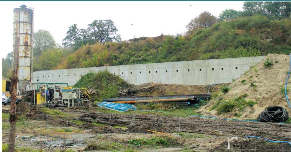
Umocnienie skarpy to przykład inwestycji wspartej zewnętrzną dotacją

- Z jednej strony zaciągamy zobowiązanie w wysokości 5,6 mln zł, ale jednocześnie spłacamy 2,1 mln zł kredytu z lat ubiegłych. Stąd można powiedzieć, że tylko o niespełna 3,5 mln wzrasta zobowiązanie naszego miasta, co jest warto-