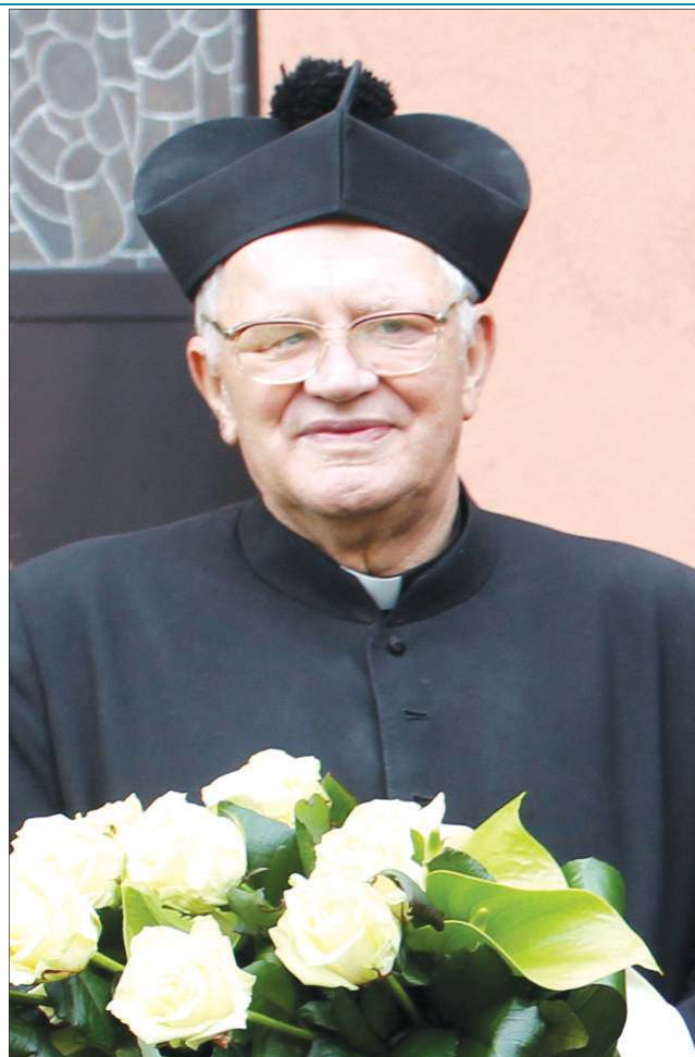
Takim go zapamiętamy - życzliwy człowiek i oddany kapłan

W lutym 1980 roku rozpoczął posługę duszpasterską w Sochaczewie-Boryszewie, gdzie został mianowany proboszczem parafii Matki Bożej Nieustającej Pomocy. Podjął bardzo trudną w tamtych czasach budowę kościoła. Mimo niesprzyjających warunków, kłód rzucanych przez władze PRL, budowa posuwała się sprawnie naprzód. 29 września 1987 roku Kardynał Józef Glemp, Prymas Polski, wmurował kamień węgielny. Po piętnastu latach świątynia została wykończona i 28 czerwca 2003 r. biskup łowicki Aloj-