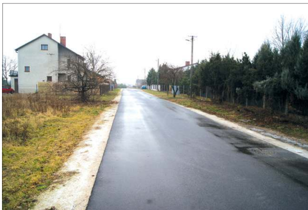
Ul. Równoległa z nowym asfaltem

py stanęły na wspomnianym już odcinku ulicy Warszawskiej, ale nie tylko. Budowa sieci i ustawienie lamp w ul. Pileckiego pochłonęły 19 tys. zł. Stanęły one również w ulicach Roweckiego i Bora Komorowskiego (24 tys. zł). To realizacja obietnicy złożonej przez burmistrza w trakcie spotkania z mieszkańca-