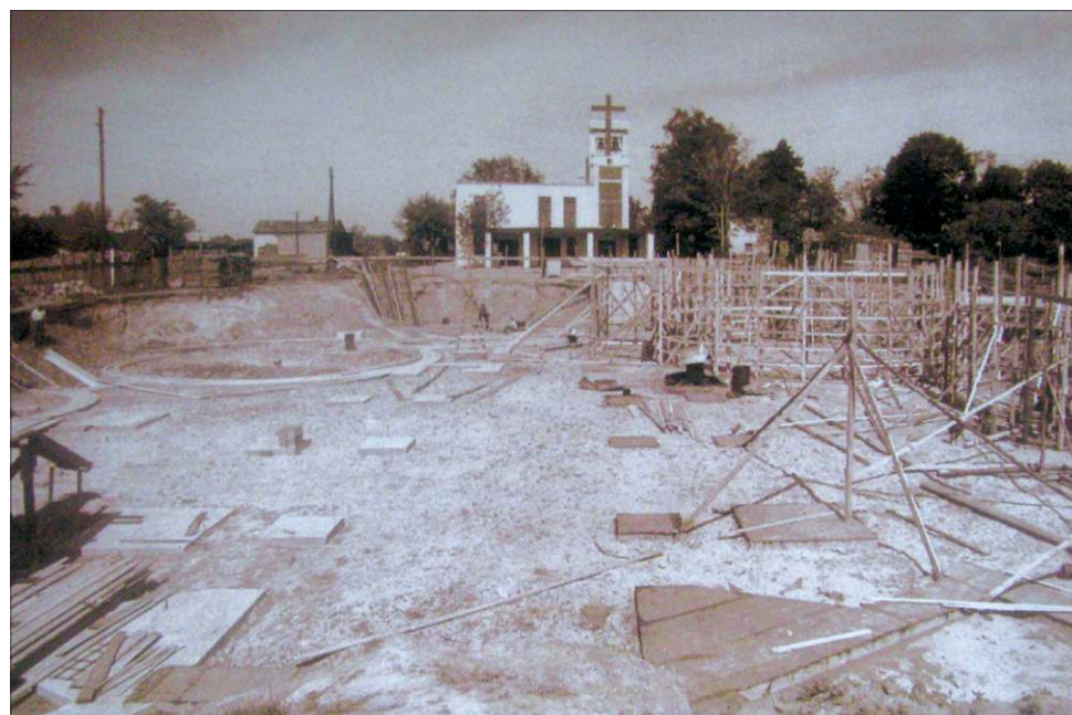
Początek długiej i trudnej budowy świątyni w Boryszewie