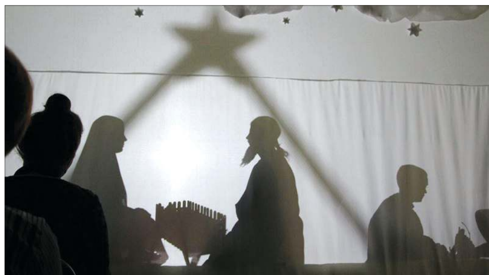
Dzieci pod kierunkiem nauczycieli z ZS w Erminowie przygotowały teatr cieni