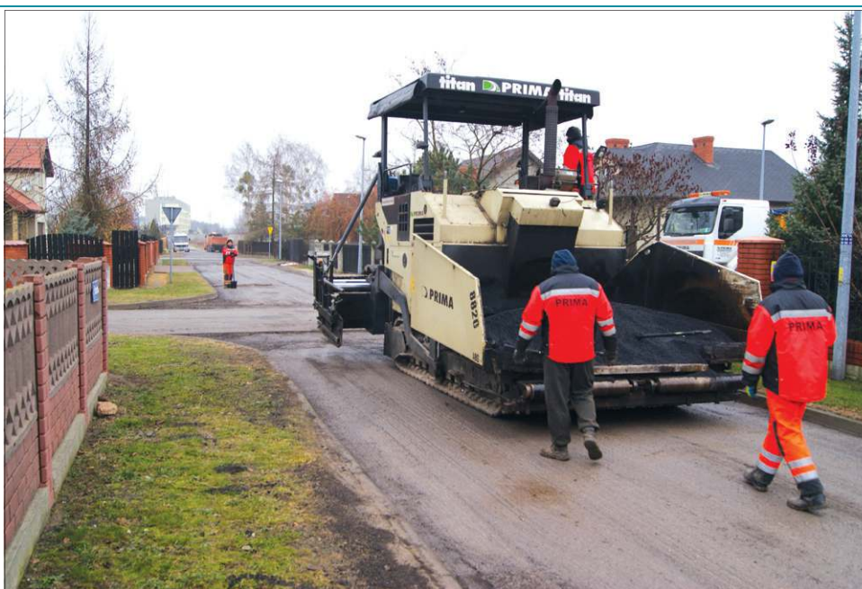
Ostatnie prace na ul. Jesionowej trwały jeszcze w grudniu zeszłego roku

Ponad 200 tys. zł ratusz przeznaczył na budowę nowych odcinków oświetlenia w kilku punktach miasta. Przetarg na wykonawstwo wygrała firma INST-EL z pobliskiego Lubiejewa. Lam-