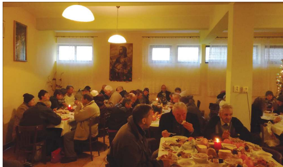
Tradycją stało się spotkanie opłatkowe w jadalni Matki Teresy z Kalkuty