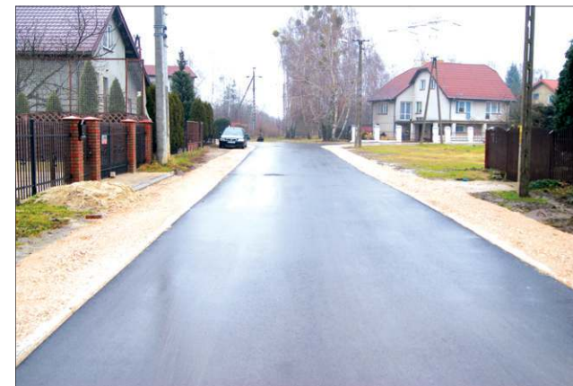
Nowa nawierzchnia ul. Wczasowej

mi Malesina. Następny duży projekt w tym pakiecie to przebudowa oświetlenia w ul. Piłsudskiego, na odcinku od ul. 1 Maja do ronda przy Licealnej, co pozwoli na doświetlenie chodnika dla pieszych przed ZS CKP i parkiem Garbolewskiego (ratusz czeka na pozwolenie na budowę).