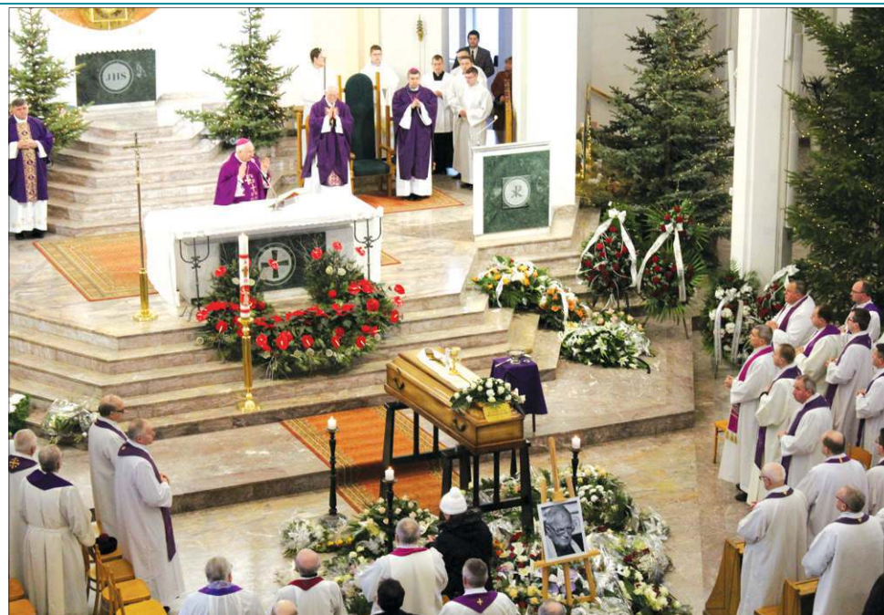
Ponad 70 duchownych, samorządowcy i parafianie 2 stycznia pożegnali swojego proboszcza