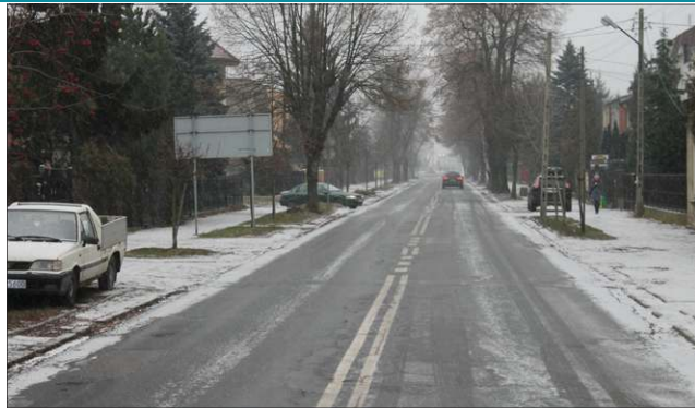
Miasto przygotowuje się do remontu ul. Licealnej

Projekt ma objąć ulicę Licealną, od ronda przy ul. Żyrardowskiej do skrzyżowania z ulicami Traugutta i 15 Sierpnia, a także zarządzany przez miasto odcinek ul. 15 Sierpnia, od skrzyżowania z ul. Licealną do obwodnicy.