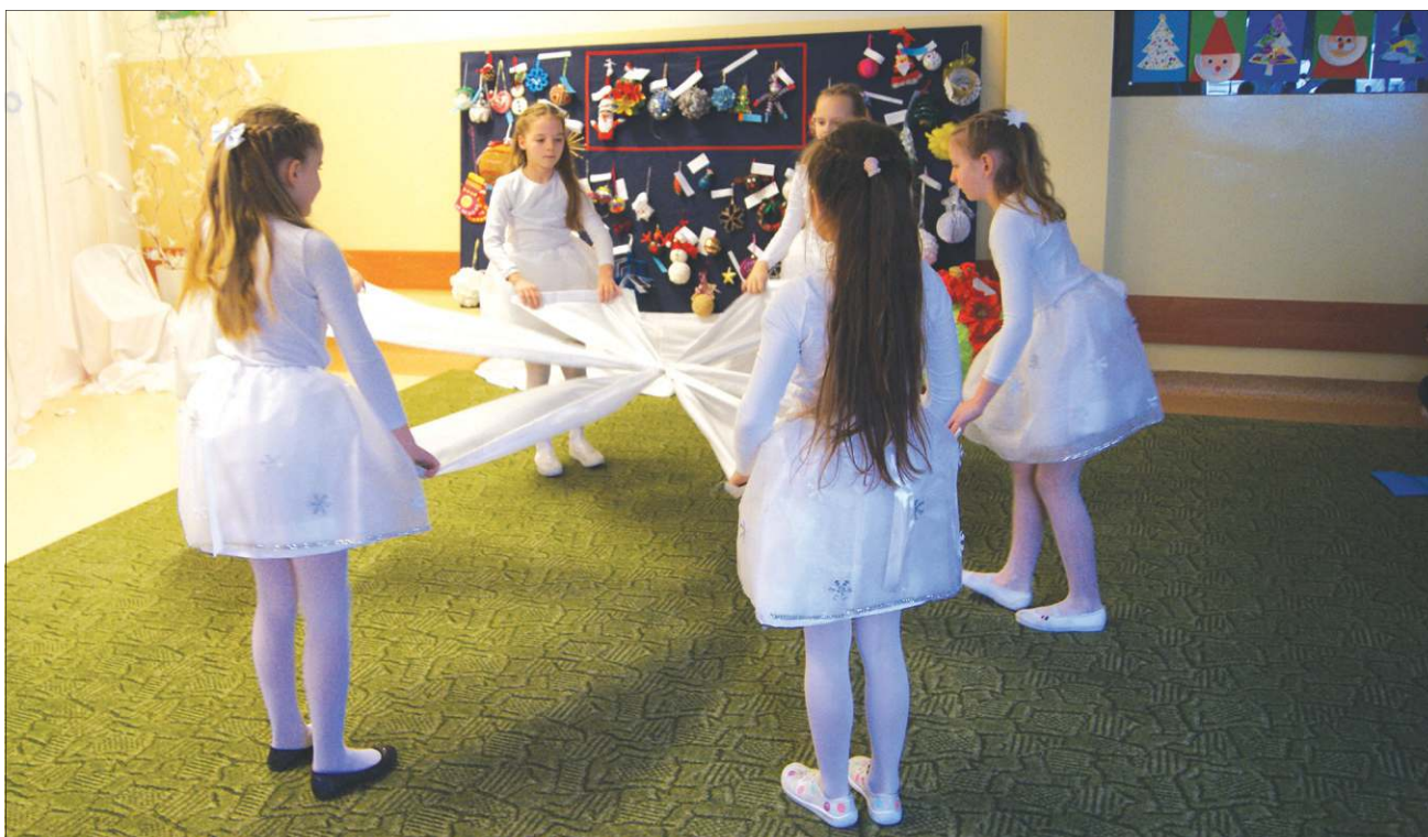
W Szkole Podstawowej nr 4 święta obchodzono na wiele sposobów. Nie zabrakło konkursów i występów artystycznych