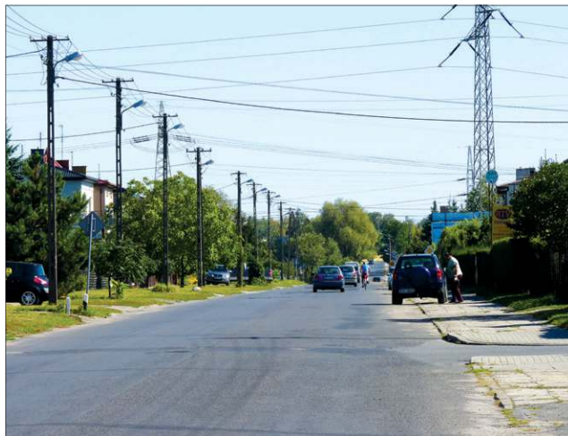
W kolejce do remontu czeka ul. Trojanowska