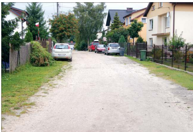
Tak ul. Profiłowia wyglądała we wrześniu...