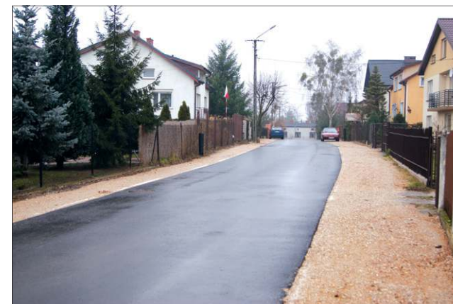
...a tak w listopadzie 2016