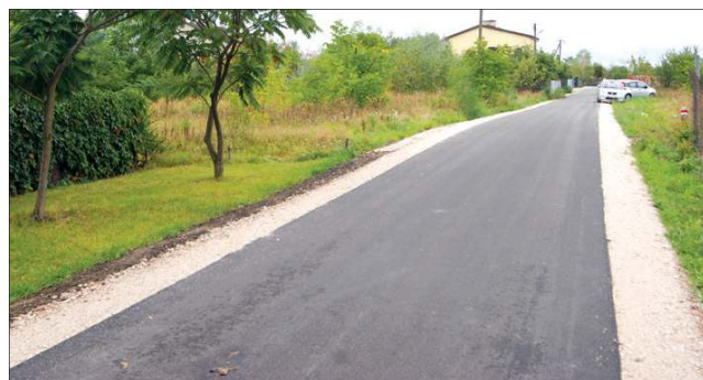
Ulica Kwiatów Polnych zyskała asfalt na całej długości

asfaltu. W praktyce, im więcej domów w danej drodze ma wykonane przyłącze do sanitarki, tym większa szansa na asfalt.