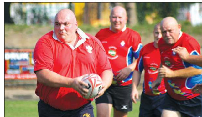
Nestorzy sochaczewskiego rugby podczas meczu