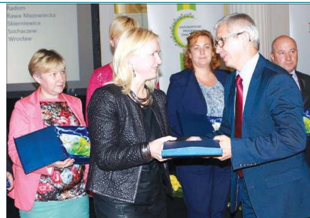
Za działania profilaktyczne w 2014 roku miasto otrzymało tytuł SUPER LIDERA

- Zapytamy w niej, czy mieszkaniec pierwszy raz bierze udział w akcji, a jeśli wcześniej się szczepił, to czy zachorował na grypę. Szczepionka nie