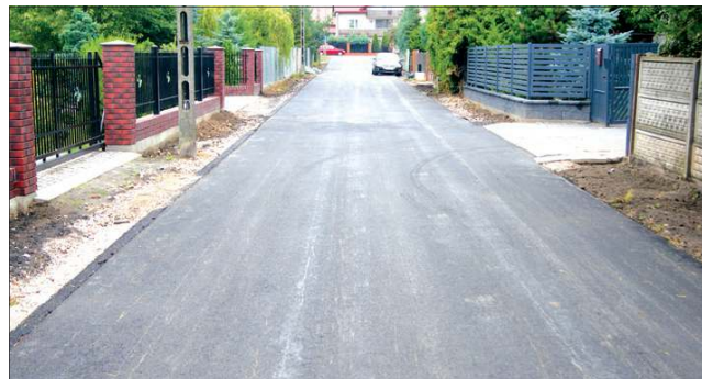
Wysafaltowana ulica Spokojna