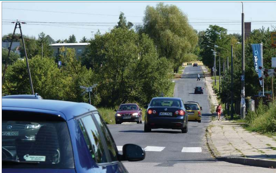
Trojanowska w przyszłym roku doczeka się remontu

To już kolejna wspólna inwestycja miasta i powia-