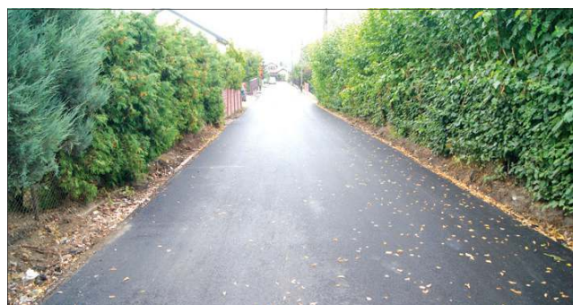
Nowa nawierzchnia na ulicy Wodnej