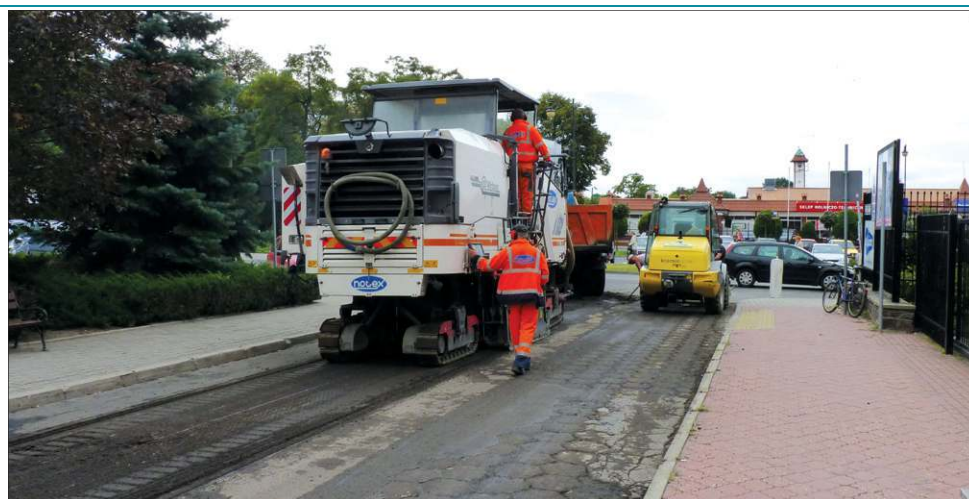
Tak wyglądały prace nad poprawieniem jakości nawierzchni ul. Stefana Kardynała Wyszyńskiego

Podobnie jak w ubiegłych latach, za realizację zadania odpowiedzialna jest podsochaczewska firma PRIMA. Program działa w oparciu o kilka założeń. Prace prowadzone są równomiernie we wszystkich dzielnicach, co pozwala uniknąć faworyzowania którejkolwiek części miasta. Na czoło listy trafiają drogi uzbrojone w sieć kanalizacyjną, dzięki czemu nie występują sytuacje zrywania niedawno położonego