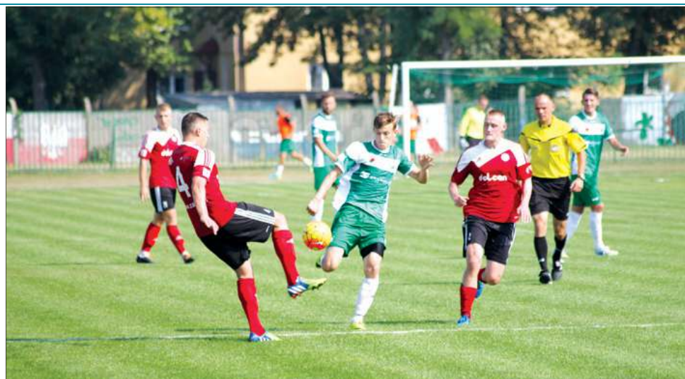
Bzura prowadziła już z Dolcanem 2:0, lecz rywal zdołał odrobić straty