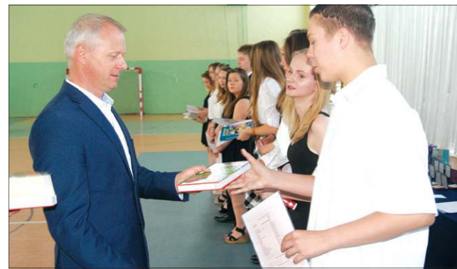
Gimnazjum nr 1 gościło zastępcę burmistrza, Marka Fergińskiego