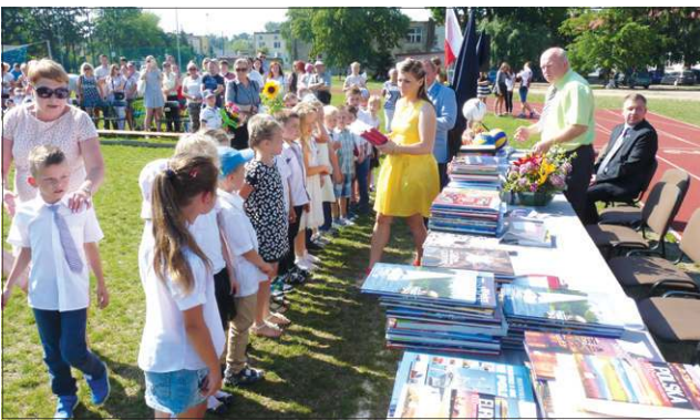
Zasłużone nagrody dla najlepszych uczniów z ZS w Chodakowie