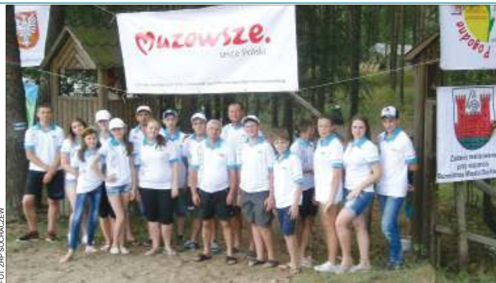
29 czerwca do stacji harcerskiej w Łąkie przyjechała grupa 20 dzieci z zaprzyjaźnionego Gródka na Ukrainie

Kolejnych 10 dzieci w wieku 7-15 lat, wytypowanych przez MOPS, pojedzie na obóz sportowo-rekreacyjny „Wakacje z Chaberkiem”. Od 28 lipca do 10 sierpnia wypoczną w ośrodku RELAX w Osiecznej, 100 metrów od strzeżonej plaży. Dzieci zamieszkają w 4-6 osobowych pokojach z łazienkami. Na terenie ośrodka znajduje się też boisko do gry w koszykówkę, piłkę siatkową oraz boisko do gry w piłkę nożną. Do dyspozycji jest świetlica, stół tenisowy, miejsce na ognisko, sprzęt sportowy, kajaki i rowery wodne. W trakcie obozu realizowa-