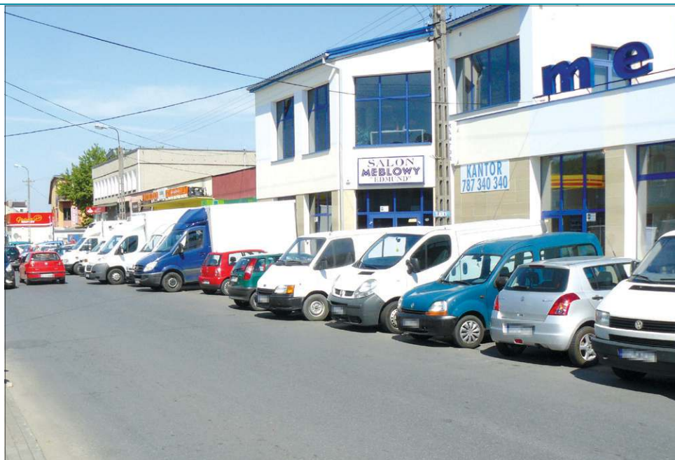
Samochody dostawcze osób handlujących na rynku często blokują miejsca parkingowe przez cały dzień

Za obsługę strefy i rozmieszczonych w nim parkometrów odpowiedzialny jest Zakład Komunikacji Miejskiej. Niezmiennie pozostają opłaty. Warto przypomnieć, że za postój nic nie zapłacą motocykliści, osoby niepełnosprawne lub kierowcy przewożący takie osoby, pod warunkiem, że zostawią pojazd na "kopercie" dla