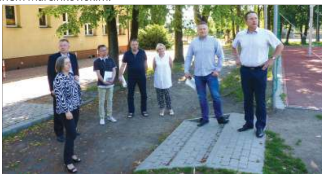
Podpisanie umowy było okazją do odwiedzenia placu budowy

Nowe boisko do piłki nożnej będzie miało wymiary 60 x 30 metrów. Jego płyta będzie wyłożona sztuczną murawą. Wokół niego ma