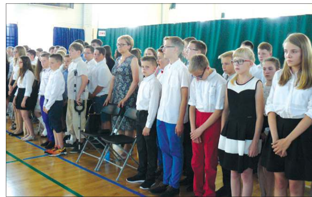
Szóstoklasiści z SP 4 tuż przed wręczeniem świadectw