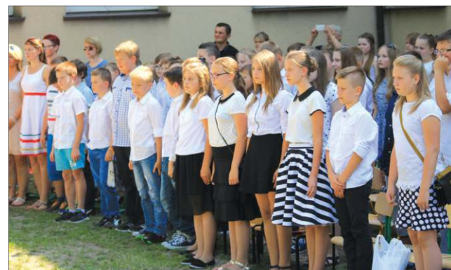
Ostatnie chwile przed wakacjami w SP nr 2