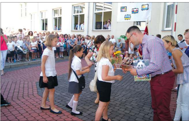
Gratulacje od rady rodziców dla prymusów z „Czwórki”