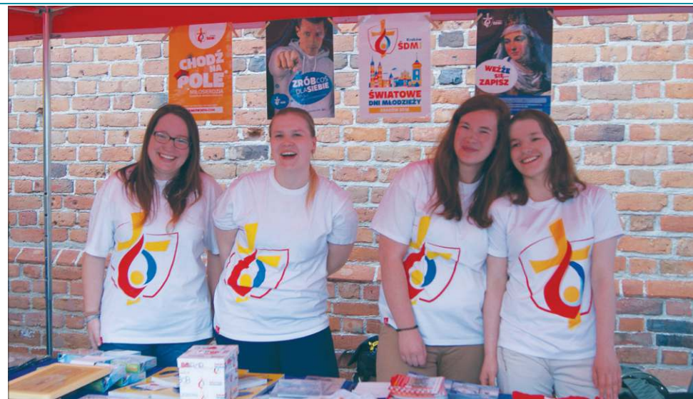
Wolontariusze z Sochaczewa wykorzystują każdą okazję, żeby promować ŚDM