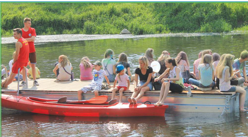
Plażowej . Obiekty sportowe przy ul. Chopina 101