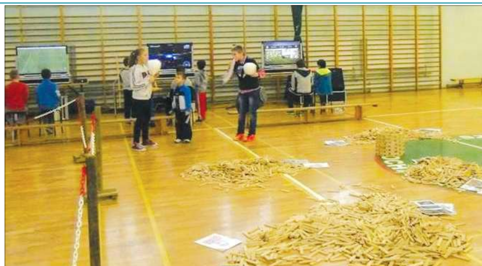
W ubiegłym roku podczas pikniku największym powodzeniem cieszyły się gry komputerowe

- KUCHNIA SMAKOSZA z naleśnikami, goframi, słodkimi lukrami, wata cukrową, popcornem dla każdego. Ponadto dzieci wraz z instruktorami tworzyć będą krajobrazy z owoców i warzyw, makaronową