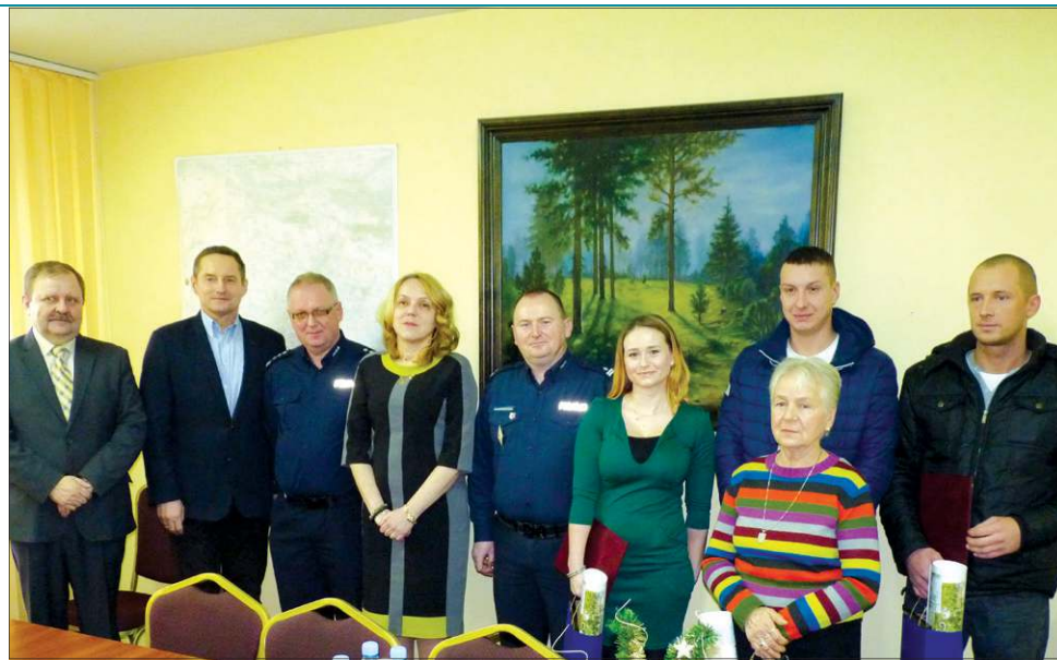
Spotkanie w starostwie było okazją do złożenia podziękowań za bohaterką postawę

Dzięki ich interwencji kobieta nie tylko nie straciła torebki z dokumentami, ale najpewniej uniknęła poważnych obrażeń. Sprawca nie zamierzał łatwo zrezygnować ze zdobyczy. Nie przeszkadzało mu, że ciągnięta przez niego starsza pani raz po raz uderza o nierówne podłogę. Złakł się dopiero nadbiegających mężczyźn. Zaczęła