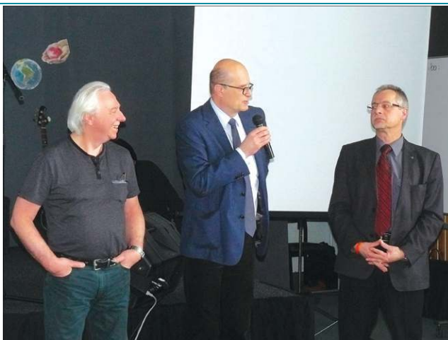
Goście spotkania cierpliwie wyjaśniali trudne zagadnienie