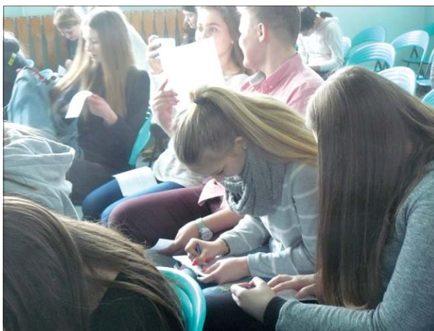
Młodzież wypełniała ankietę dotyczącą transplantologii