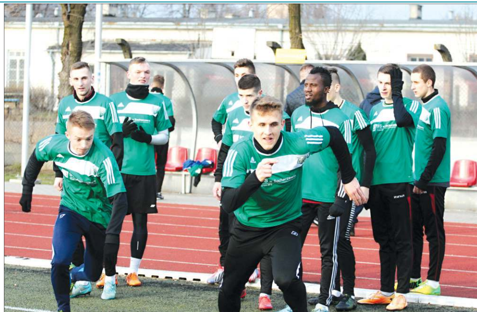
Przed rozpoczęciem rundy wiosennej Bzurę czekają jeszcze cztery sparingi

Po raz kolejny juniorzy z AP mogli się zaprezentować w minioną sobotę, 30 stycznia. W rozegranym w Łowiczu meczu Bzura wygrała z Orłem Nieborów 2:1. Bram-