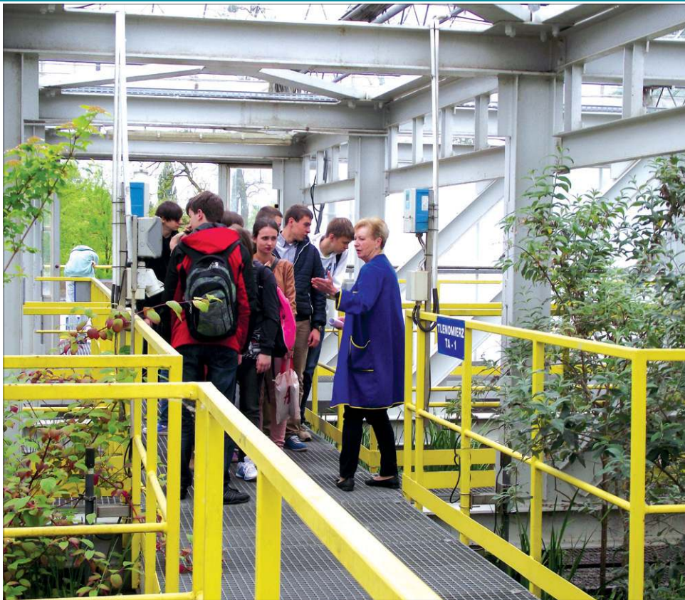
Lekcja ekologii w Miejskiej Oczyszczalni Ścieków

ZWiK ma świadomość, że jego wodę pije całe miasto, czyli ponad 35 tys. ludzi i każda zmiana stawek to dla przeciętnie zarabia-