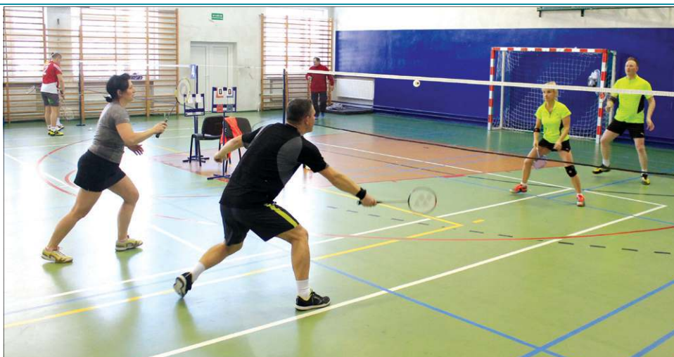
W Mistrzostwach Powiatu Sochaczewskiego wzięło udział 60 zawodników

Rywalizacja przebiegała w ośmiu kategoriach. Do turnieju zgłosili się zawodnicy z Łodzi, Warszawy, Zabrza, Ożarowa Mazowieckiego, Skierniewic, Białegostoku, Grodziska Mazowieckiego, Aleksandrowa Łódzkiego, Starych Babic oraz liczna grupa z powiatu sochaczewskiego.