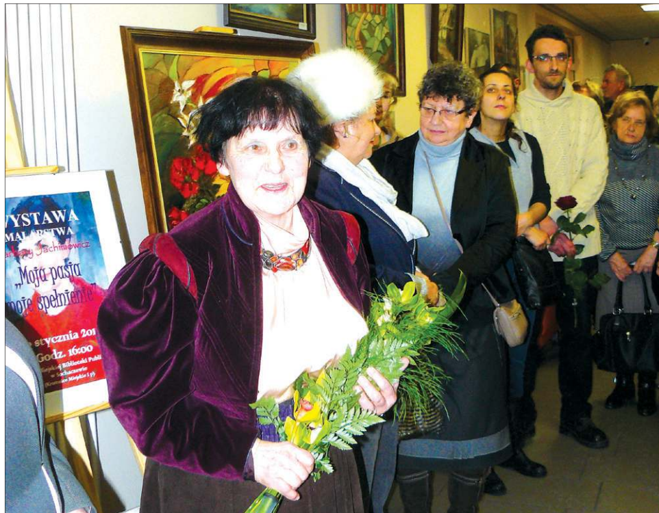
Na wernisażu pojawiły się tłumy miłośników twórczości artystki

Trudność polega na tym, że mam w swoich zbiorach