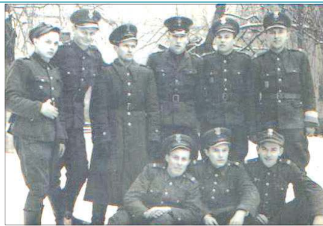
1952 r. Podczas służby w 53 Batalionie Łączności w Lublinie