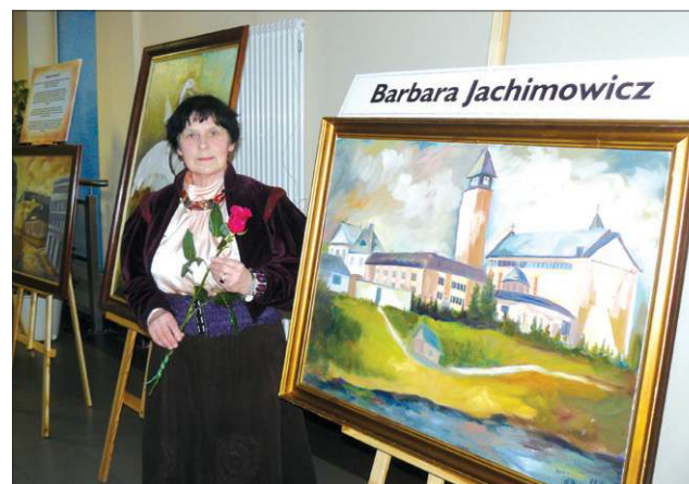
Wystawę można oglądać do końca lutego

Patrząc na tłumy, jakie pojawiły się na wernisażu, warto zapytać, gdzie tkwi