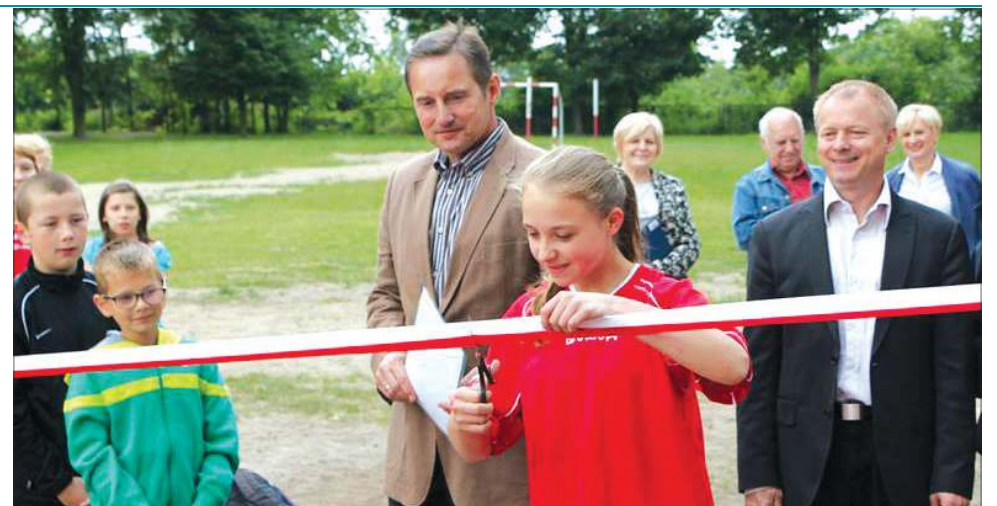
SP2 może liczyć na kolejne otwarcie boiska już w tym roku

Objęcie opieki przez miasto nad wszystkimi przystankami komunikacyjnymi znajdującymi się w jego granicach administracyjnych wynika z przepisów ustawy o publicz-