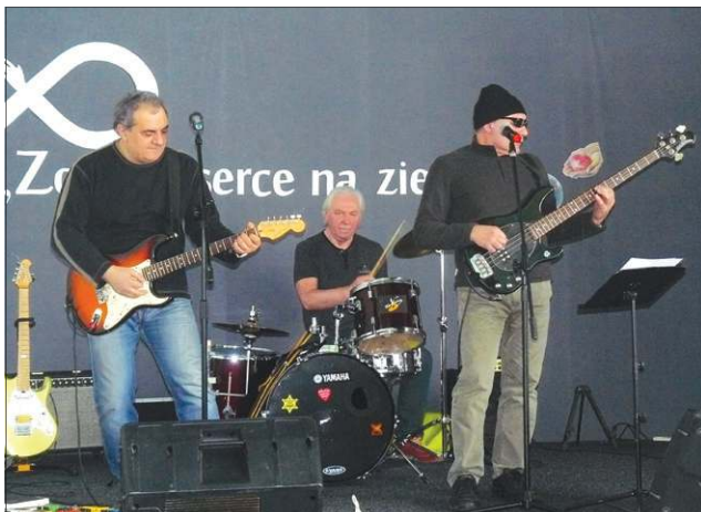
Konferencję zakończył występ zespołu HLA