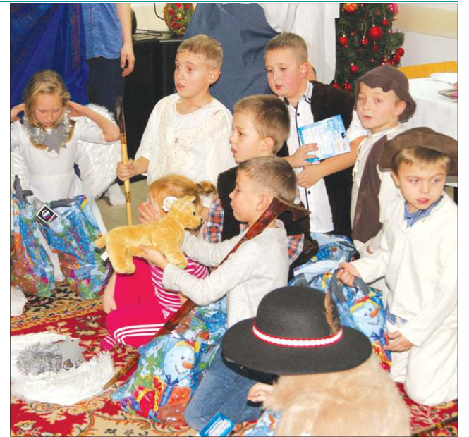
Zawartość paczek jest zawsze głośno komentowana