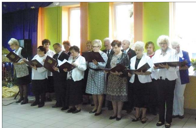
Wykonawcy bożonarodzeniowego spektaklu...