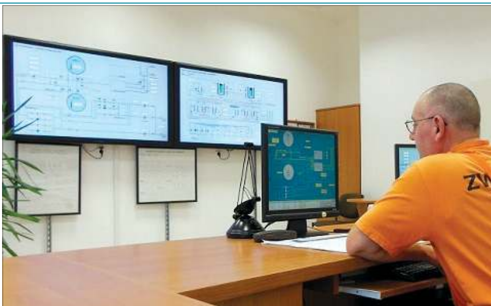
Na budowę systemu monitoringu sieci ZWiK przeznaczy 800 tys. zł z unijnej dotacji

Jak czytamy w „Wieloletnim Planie Rozwoju i Moderni- zacji Urzędów Wodociągo- wych i Kanalizacyjnych do roku 2020”, Sochaczew zaopa- trywany jest w wodę pitną z dwóch ujęć głębinowych. Jed- no znajduje się w Konarach w gminie Brochów, drugie w Ku- znocinie. W Kuznocinie woda ujmowana jest z głębokości po-