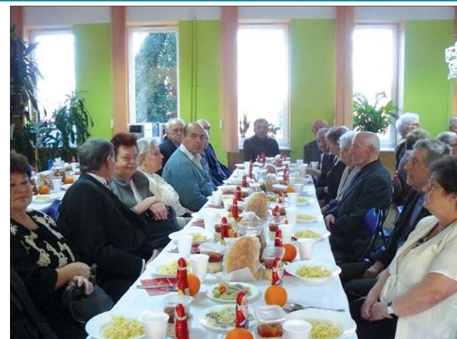
Pensjonariusze przy pięknie nakrytym stole