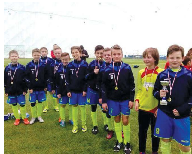
Młody zespół z Boryszewa z medalami

W niedzielę 20 grudnia w Płocku, prowadzona przez trenera Mateusza Sikorskiego, drużyna Unii Boryszew (rocznik 2004) zajęła szóste miejsce w turnieju „SSM Wisła Płock 2015”.