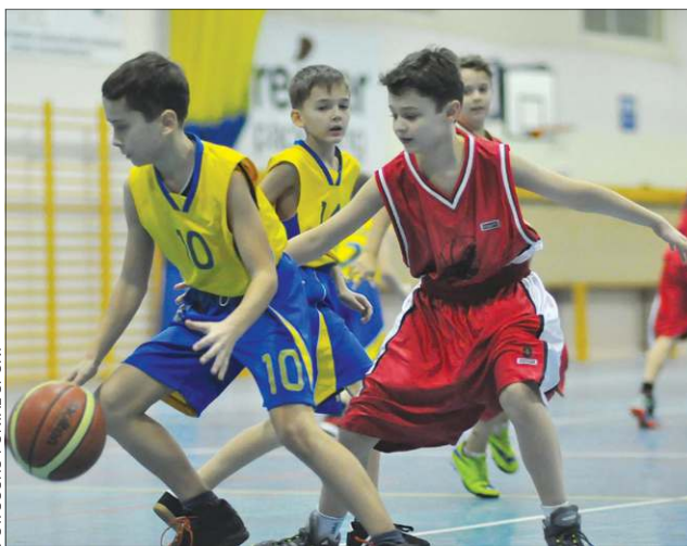
Zagrały również dwa roczniki młodzieżowe