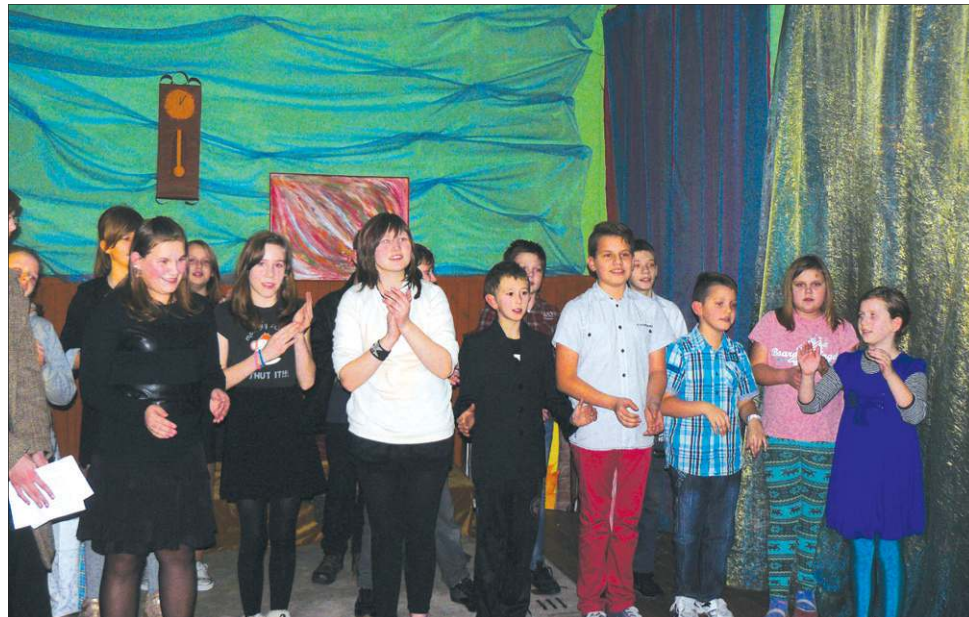
Każda ze świetlic przygotowała świąteczny program. W „Kleksie” była to „Opowieść Wigilijna”...