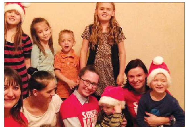
Radość darczyńców i obdarowanych jest olbrzymia

Jeżeli chodzi o darczyńców to w równym stopniu są to ich osoby prywatne i instytucje. Wśród tych ostatnich wymienić można np. Urząd Miasta, Liceum Ogólnokształcące im. Fryderyka Chopina, Gimnazjum nr 2 czy Stowarzyszenie Uniwersytet Trzeciego Wieku.