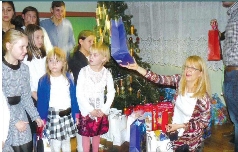
O świetlicach TPD pamięta nie tylko redakcja, ale także ich przyjaciele

Pierwsza myśl była taka: przygotować dla dzieci choć słodycze. Nieoceniona okazała się tu firma MARS Polska, która od lat wspiera nasze działania. W ten sposób w redakcji stanęły pierwsze pudła. Później pojawili się kolejni darczyńcy. Pracownicy apteki „Dor Zdrowia” przekazali nam gry,