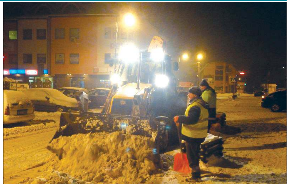
Takie obrazki sprzed kilku lat odeszły już w niepamięć, ale nigdy nie wiadomo, jakiego figla spleta pogoda

W najwyższym, drugim, standardzie na terenie Sochaczewa mieści się 19 ulic o łącznej długości 12 km. Są to m.in.: ul. Warszawska, Traugutta, Olimpijska, 15 Sierpnia i 1 Maja. Służ-