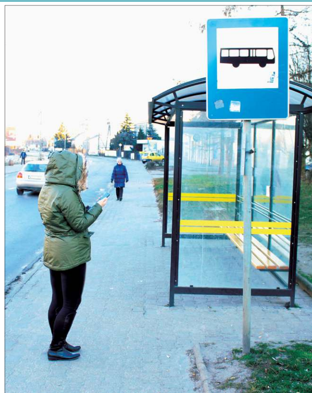
Przybywa pasażerów, którzy sprawdzają rozkład jazdy w komórce

– Mimo, że można nazwać mnie człowiekiem starszej daty, to rozumiem, jak szerokie możliwości otwiera przed pasażerem śledzenie na bieżąco rozkładu jazdy – mówi dyrektor sochaczewskiego ZKM, Krzysz-