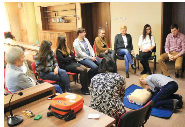
10 pracowników urzędu odbyło szkolenie przedmedyczne

Hasło tegorocznego finału to „Mierzmy wysoko!”. Pieniądze ze zbiórki zostaną przeznaczone na zakup urządzeń medycznych dla oddziałów pediatrycznych oraz na zapewnienie godnej opieki medycznej seniorów. Przez 23 lata działalności Fundacja WOŚP zakupiła sprzęt medyczny, wydając blisko 650 mln zł, zebranych w corocznych finałach. (mf)