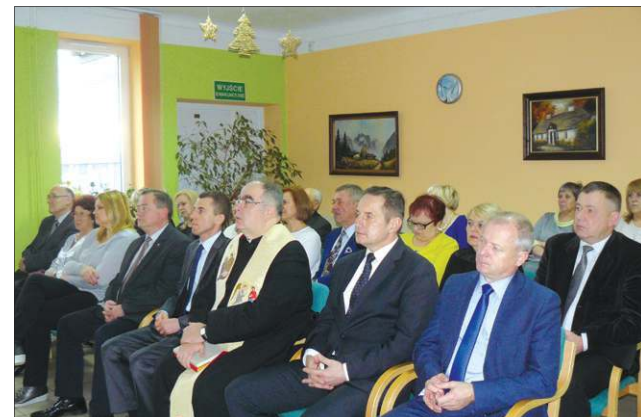
... i zasłuchani goście spotkania