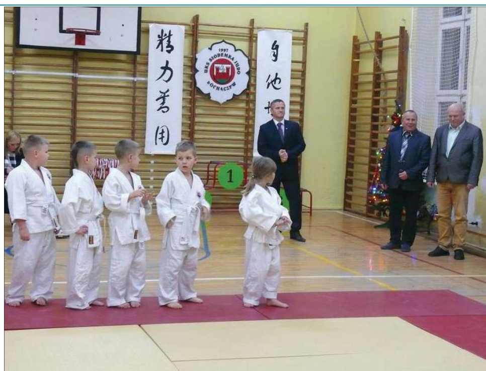
Wszyscy młodzi adepci judo UKS „Siódemka” zdali egzamin na biały pas