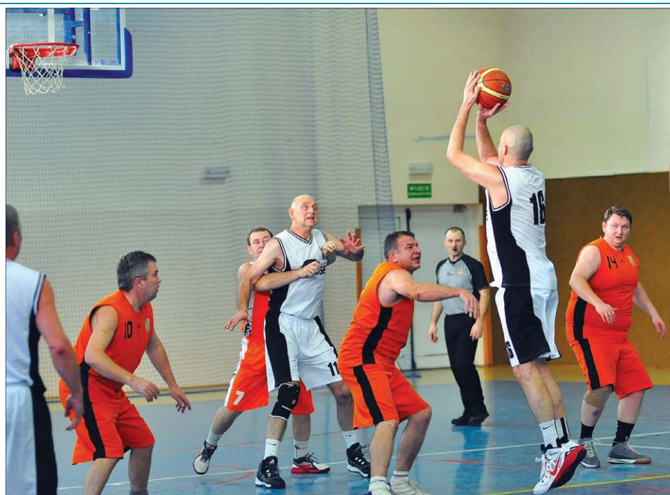
Na parkiecie pojawiło się wielu doskonałych przed laty zawodników