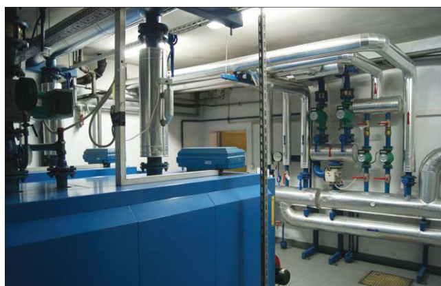
Szkolna kotłownia przejdzie modernizację