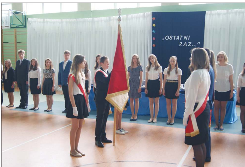
Starsi uczniowie Gimnazjum nr 1 przekazują sztandar swoim młodszym kolegom

Do sprawdzianu przystąpiło w sumie 334 szóstoklasistów z czterech sochaczew-