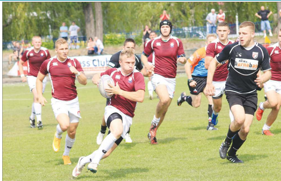
W drugiej części spotkania rugbiści Orkana wyszli na prowadzenie i do końca nie dali sobie odebrać zwycięstwa

Do przerwy Orkan przegrywał jednym punktem i w drugiej połowie musiał gonić wynik. Po zmianie stron przebieg gry na boisku nie uległ zmianie. Jednak to sochaczewscy rugbiści zachowali zimną krew i ostatecznie po wykorzystaniu trzech karnych wygrali wojnę nerwów. Najlepszym obrazowaniem boiskowej nerwowki było ukaranie w 75 minucie, za nieodpowiednie zachowanie, jednego z rugbiistów Posnani żółtą kartką. Orkan do końca meczu grał w przewadze i był bliski zdobycia kolejnego przyłożenia.