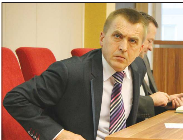
- Komuś się nie podoba mój krawat?