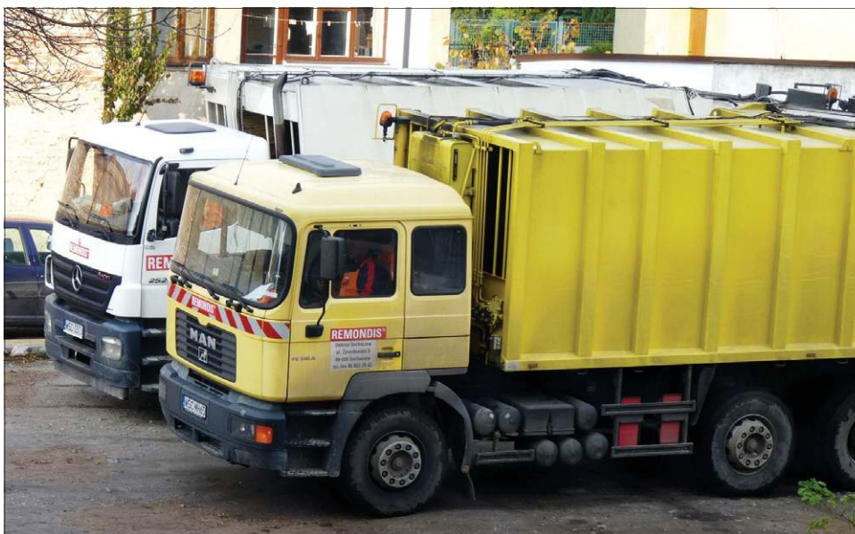
Romondis, przynajmniej na razie, nie ma na naszym terenie konkurencji...

- Okazało się jednak, że konsorcjum chce 25.880.300 zł, a to znacznie powyżej naszych wyliczeń, dlatego przetarg unieważniliśmy. Rozumiemy, że opłaty za wywóz rosną, bo