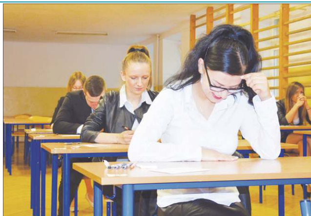
Pisemna sesja egzaminacyjna rozpoczęła się 4 maja

Najlepiej w miesiącu poszła matura abiturientom Zespołu Szkół Ogólnokształcących im. F. Chopina . Do matury przystąpiło 177 uczniów „Chopina”. Tylko dwie muszą się przygoto-