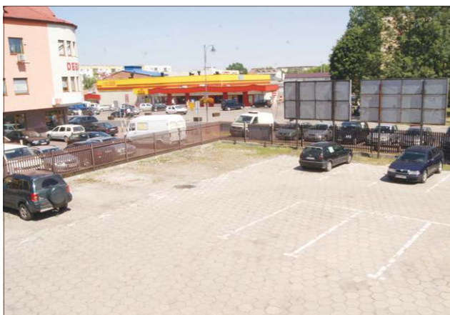
Od września będzie tu plac manewrowy

Pomieszczenia do egzaminów teoretycznych wynajął WORD-owi Zakład Gospodarki Komunalnej, a stosowną umowę podpisano w ratuszu 2 lipca. Do przeprowadzania tzw. testów teoretycznych potrzebny będzie system informacyjny podłączony do kilku