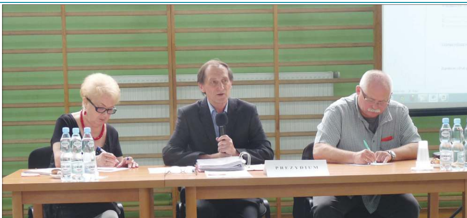
Prezydium walnego, które 20 czerwca zostało zerwane

Na ostatnim, z punktu widzenia prawa niebyłym walnym, doszło do zerwania obrad jeszcze na etapie uchwalaniu ich porządku. Doszło do kuriozalnej sytuacji, w której członkowie walnego próbowali odebrać zgromadzeniu głos przy procedowaniu niektórych uchwał. Pojawiło się mnóstwo wniosków, a to o zdjęcie jakiegoś punktu ob-