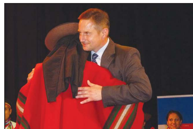
- Czy wiesz, z kim tańczysz, Peruwianczyku?