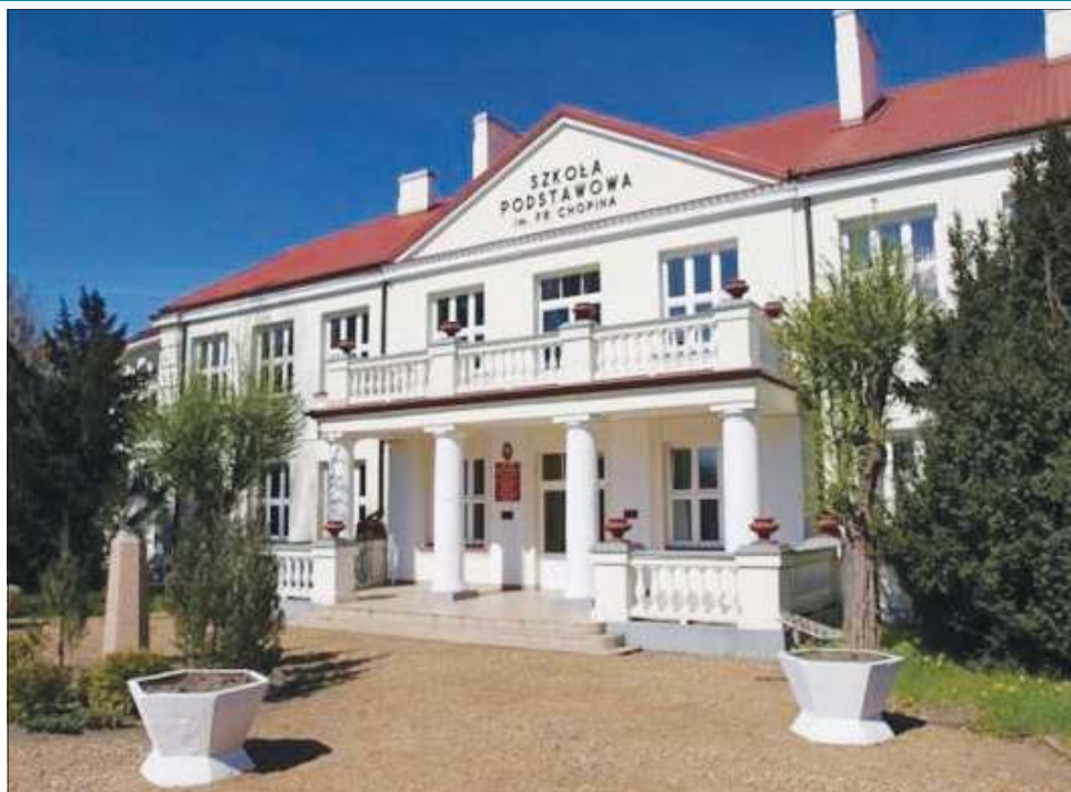
Remont chodakowskiej „siódemki” pochłonie 1.100.000 zł, czyli całość kwoty przeznaczonej na tę edycję SBO

W Szkole Podstawowej nr 7 wymieniona zostanie instalacja elektryczna wraz z osprzętem i rozdzielnią (trzy etapy realizacji), a na