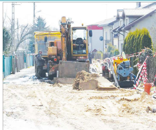
Dziś z sieci sanitarnej korzystają już 7173 osoby

Od wielu miesięcy, by ułatwić mieszkańcom budowę przyłącza kanalizacyjnych, ZWiK proponuje cały system ulg i zniżek pozwalający przeciętnej rodzinie zaoszczędzić nawet 850 zł. Spółka nie pobiera opłat za wydanie warunków technicznych przyłącza, za uzgodnienie jego przebiegu i za odbiór techniczny gotowej sieci (odbioru dokonuje inspektor ZWiK). Spółka nie wymaga opracowania projektu technicznego przyłącza i godzi się na jego wybudowanie we własnym zakresie, systemem gospodarskim - pod nadzorem inspektora ZWiK. Można też sko-