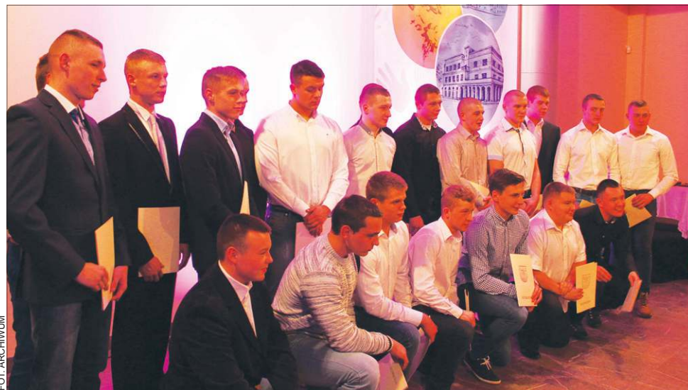
Sportowcy nominowani w zeszłym roku