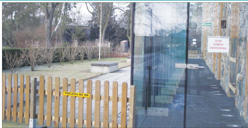
Ogromne tafle szkła zostały zamontowane tak niefortunnie, że teraz bezpieczniej się do nich nie zbliżać