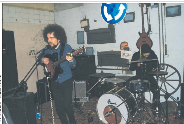
Wild Books byli zdecydowanie najmocniejszym punktem imprezy

„Twórcie wspólnoty, wspierajcie komitety” - krzyczał wokalista MassMilicji. Mocno politycznie zaangażowani punkrockowcy w dobitny sposób dali wyraz tego, co im się nie podoba w naszym kraju. Z występu można wnioskować, że szczególnie doskwierają im patologie