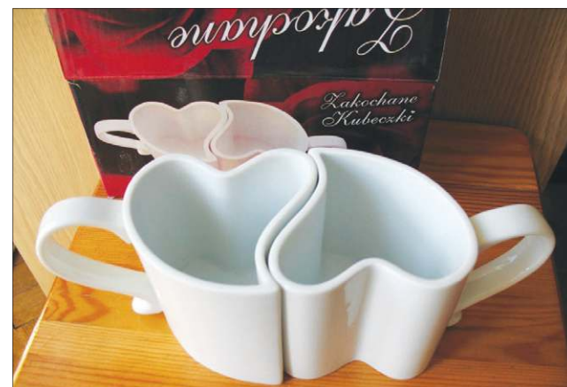
Miłosne kubeczki nie cieszą się szczególnym zainteresowaniem

Popularnym zwyczajem jest wyjście na romantyczną kolację. Tego dnia w sochaczewskich restauracjach dla gości zostanie przygotowane specjalne menu. W restauracji „Przepis na Kompot” w Żelazowej Woli w walentynkowy wieczór odbędzie się taneczne Love Story na żywo w wykonaniu Wojciech Świętoński Band, zaś w hotelu Chopin 14 lutego będziemy mogli wyszaleć się na balu karnawałowym pt. „Bo do tanga trzeba dwojga”. Jak zapewniają organizatorzy, na zakochanych czekać będzie pobudzająca zmysły kolacja, smakowe wariacje przy słodkim bufecie oraz dobra muzyka. Walentynkową zabawę w