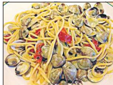
Spaghetti alle vongole

do wody, dopłynąć do skał i po kryjomu odcinać z nich ostrygi i chować je do torebki. Albowiem w tym miejscu zbieranie ostryg było surowo wzbronione. I stąd właśnie ta nieludzka godzina.