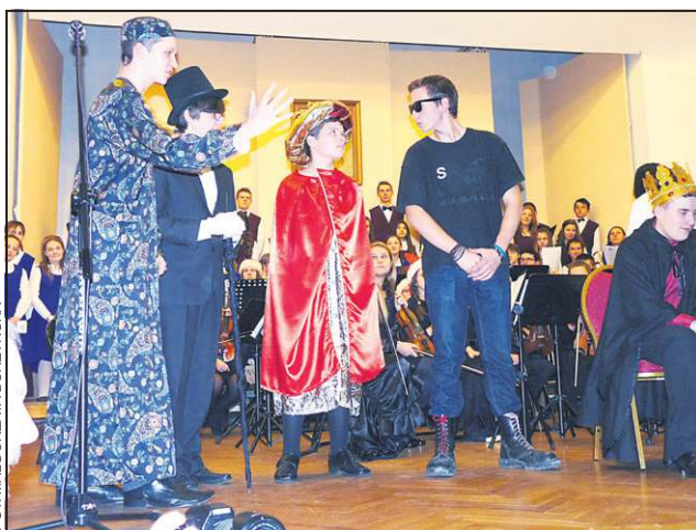
Bożonarodzeniowe koncerty i jasełka w szkole muzycznej to świąteczny nastrój i przednia zabawa

wypowiedzi pani starosty powiem: i ja tys. I tak też się stało, ku radości zebranych.