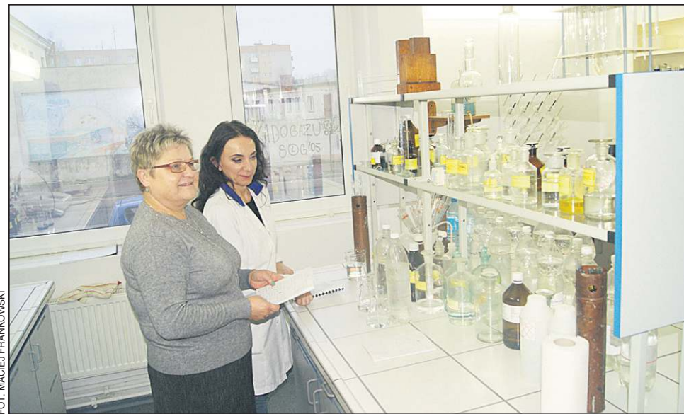
To już ostatnie dni funkcjonowania laboratorium w Sochaczewie