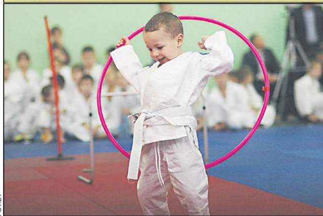
Judo dziecięce łączy sport z zabawą