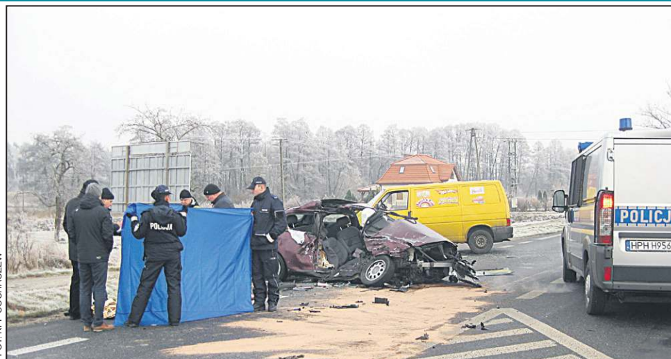
W wypadku w Wójtówce zginęły dwie młode kobiety

Około godziny 14.00 w miejscowości Kamion (gmina Młodzieszyn) doszło do zderzenia trzech pojazdów. Jego sprawca, kierujący busem renault, uderzył w bok ciągnika siodłowego z na-