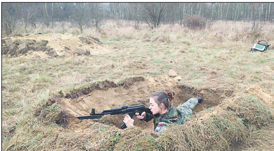
Szkoły mundurowe są nie tylko dla chłopców

Także w związku z tym dla klas drugiej i trzeciej raz w miesiącu odbywają się zajęcia