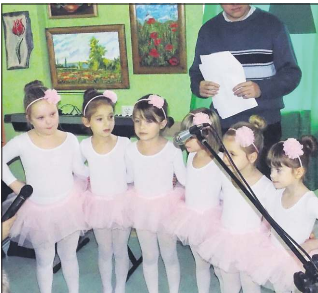
Przedшкоlaki zachwyciły zabranych