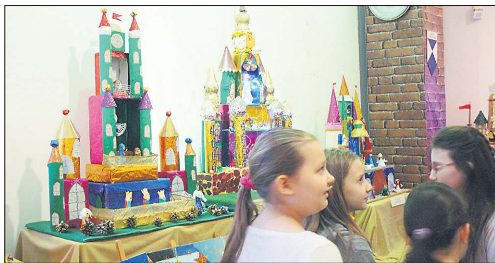
Dzieci z wielką radością oglądały wykonane przez siebie i w dodatku nagrodzone prace

Pomysłowość wykonawców szopek rzeczywiście robiła wrażenie. Zarówno jeśli chodzi o konstrukcję, jak i użyty materiał. Na wystawie można oglądać pra-