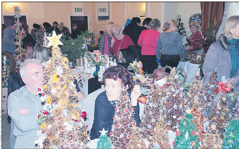
Na każdym kroku czuje się już atmosferę świąt

- Bardzo mało osób korzysta z naszej pomocy. Jeśli już, to są to zakłady pracy. Indywidualne osoby zamawiają jedynie pranie dywanów - mówi właścicielka jednej z firm sprzątających na terenie naszego miasta. W profesjonalnej firmie za mycie okien zapłacimy od 5 do 7 zł za metr kw. Koszt całkowitej usługi w standardowym trzy-