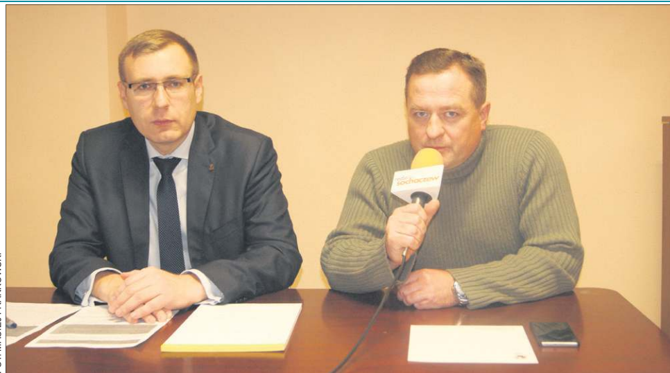
Sochaczewskie PiS złożyło do sądu dwa protesty wyborcze

- Prawo i Sprawiedliwość w powiecie sochaczewskim złożyło do sądu dwa protesty wyborcze. Pierwszy odnosi się do działania komisji wyborczej w Kątach, gdzie w dniu wyborów, 16 listopada, jeden z jej członków, o 7.00 rano przed lokalem do głosowania, zrywał materiały wyborcze. Druga sprawa jest znacznie poważniejsza, bowiem dotyczy poświadczenia nieprawdy przez gminne komisje