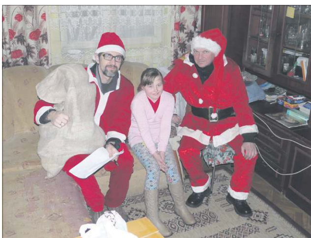
...i w domach obdarowanych dzieci