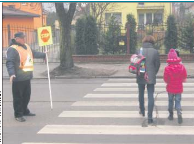
Pan Jan dba o bezpieczeństwo uczniów „dwójki”

Aby móc wykonywać „zawód przewodniczący” trzeba wcześniej przejść specjalistyczny kurs z przepisów ruchu drogowego. Taka osoba musi umieć prawidłowo oceniać natężenie ruchu, czy oszacować drogę hamowania samochodów zbliżających się