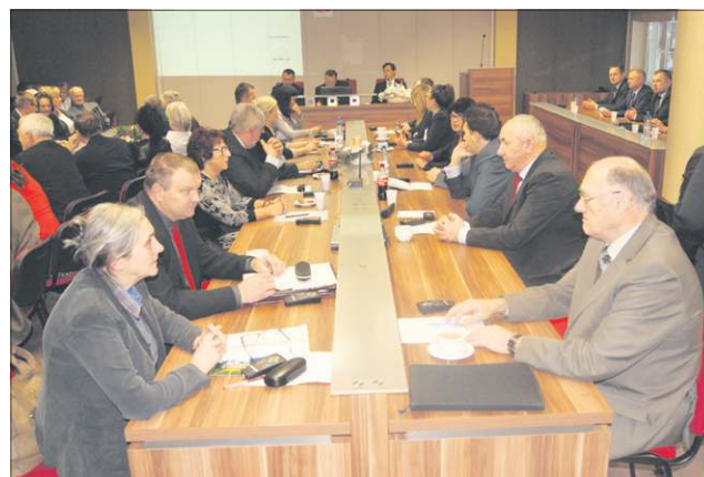
Sala obrad była wypełniona do ostatniego miejsca