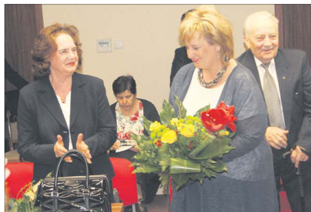
Najbliżsi burmistrza wzięli udział w sesji