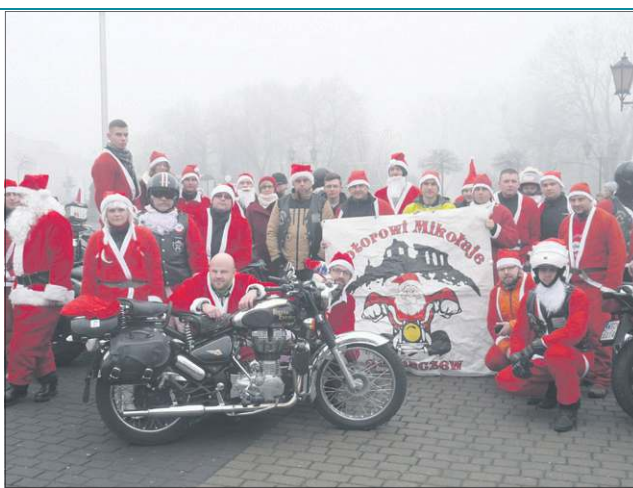
Motorowi Mikołaje w pełnej gotowości...

Dziękujemy również gorąco sponsorom i darczyńcom: firmie Mars Polska za przekazanie słodyczy, firmie Procter & Gamble za artykuły chemicz-