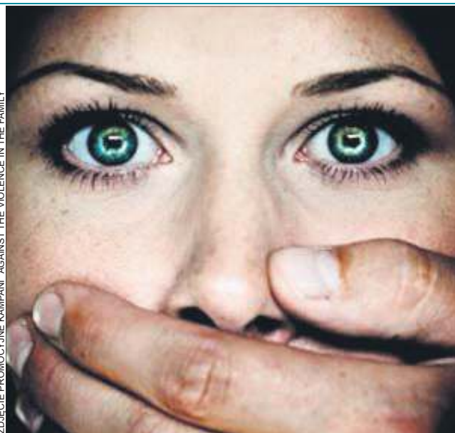
ZDJEŃIE PROMOCYJNE KAMPANII "AGAINST THE VIOLENCE IN THE FAMILY"

- Sama utrzymywała córkę. Tymczasem Kamilowi na nic nie brakowało, ale nie dokładał się w żaden sposób do wydatków. To ona musiała zapewnić jedzenie, opłaty, byt dziecku. On nie był zainteresowany – powiedziała nam osoba znająca sytuację w rodzinie państwa P.