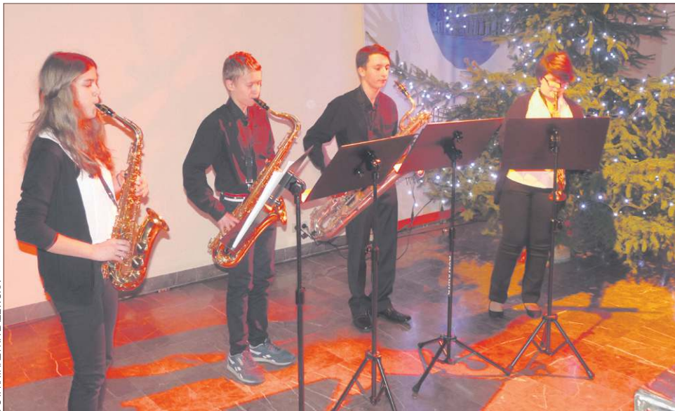
Przed publicznością wystąpił kwartet saksofonowy PSM