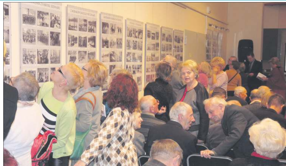
Wystawa starych fotografii cieszyła się ogromnym zainteresowaniem

Sobotniemu wydarzeniu towarzyszyła promocja książ-