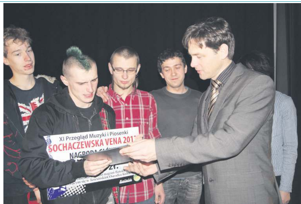
Zwycięzca Veny 2013, sochaczewska punkrockowa grupa "Pacierz"

W ramach konkursu przyznane zostaną trzy główne nagrody. Dla najlepszego wokalisty, najlepszego instrumentalisty i ta najcenniejsza - Grand Prix Veny w kategorii najlepszy zespół.