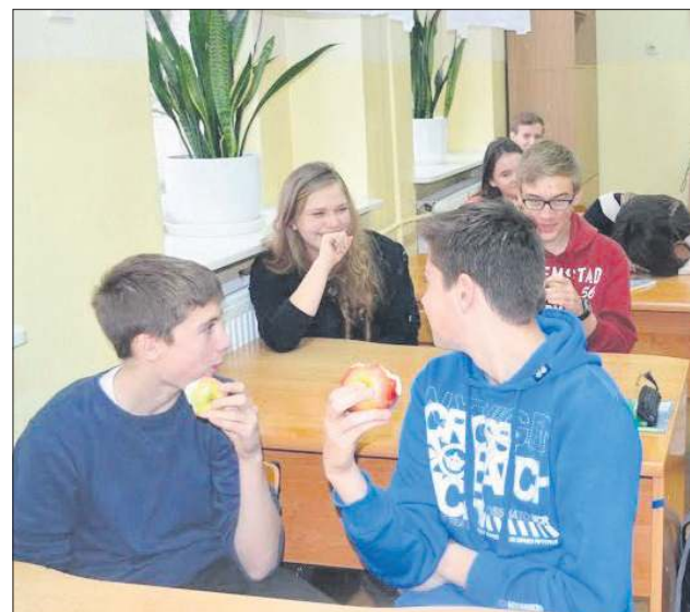
Owoce smakowały uczniom bardziej niż słodycze

Ku radości uczniów i pracowników - można by rzec. Na zdrowie - można