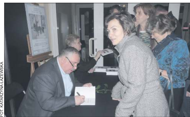
Można było również uzyskać dedykację w najnowszej książce Waldemara Bronicza

- Istotne jest to, aby w każdym domu pielęgnować pa-