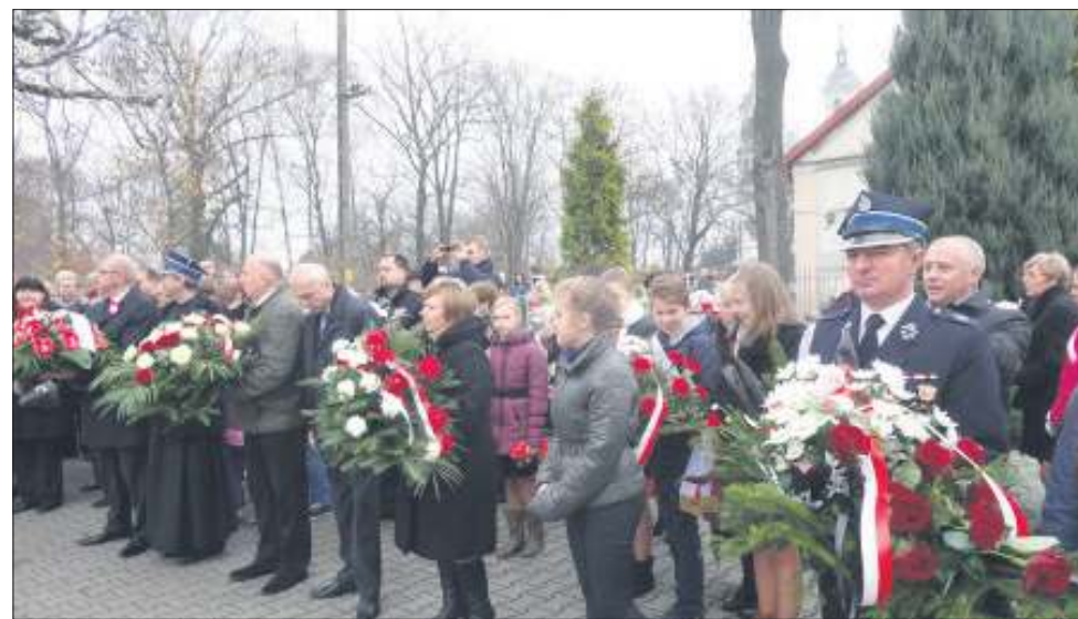
Ten dzień ucztyły wszystkie środowiska gminy Teresin

Szymanów jest szczególnym miejscem do czczenia Święta Niepodległości. Uroczystości rozpoczęły się na stacji kolejowej w Teresinie, gdzie, po odegraniu pieśni patriotycznych przez orkiestrę dętą, marszałek Józef Piłsudski złożył kwiaty w towarzystwie dzieci na stacji kolejowej, a następnie drugą wiązkę pod