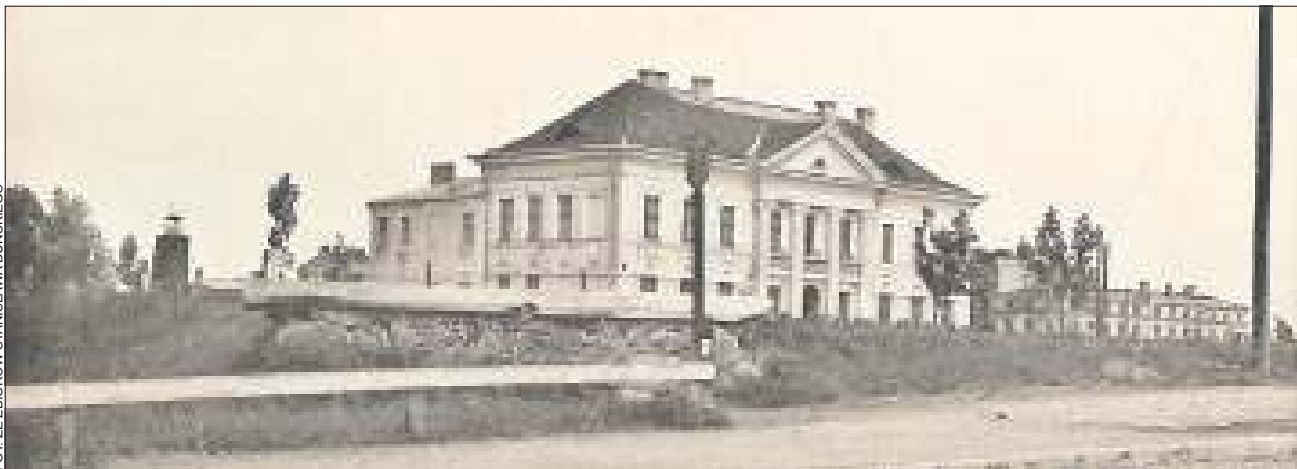
Ratusz. Miejsce obrad przedwojennej Rady Miejskiej

Dopiero wprowadzenie gromadzkiej reformy finansowej spowodowało ostrą walkę wyborczą i dyscyplinowało radnych do przychodzenia na posiedzenia. Radny nie tylko otrzymywał wy-