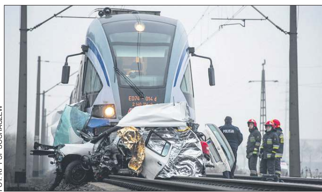
Bufory pociągu pchały całkowicie zniszczony samochód ponad 200 metrów

Pracownicy kolei twierdzą, że na miejscu tragedii sprawne były rogatki ostrzegawcze i sygnalizacja świetlna. Są to szlabany opuszczające się tylko nad jeden pas ruchu. Ze wstępnych ustaleń wynika, że kierowca śpieszył się i próbował ominąć je slalomem.