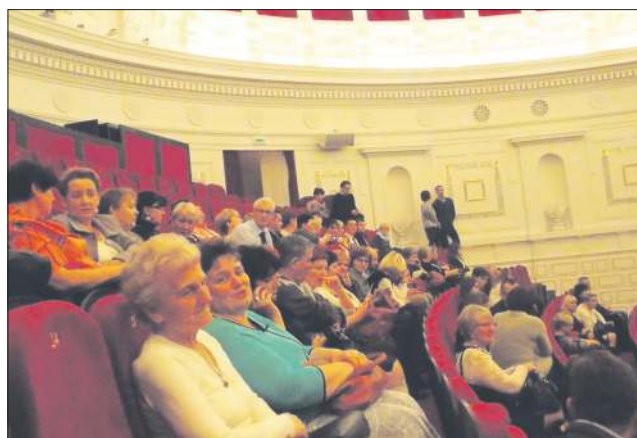
Członkowie Klubu nieczęsto mają okazję gościć w teatrze

Następne spotkanie Klubu Wsparcia Społecznego to zabawa andrzejkowa, którą planujemy 27 listopada.