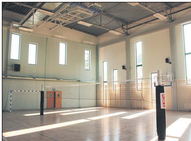
Wymiary wielofunkcyjnego boiska to 38 x 18 metrów

rzy zaprezentują się w programie artystycznym.