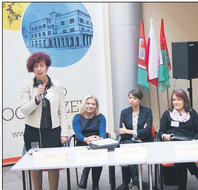
Podczas konferencji odbyła się seria prelekcji na temat przemocy

Ofiarami, które najdotkliwiej odczuwają skutki przemocy, są dzieci. Przybiera ona najczęściej formę zaniedbania przez rodziców i stosowania przez nich kar