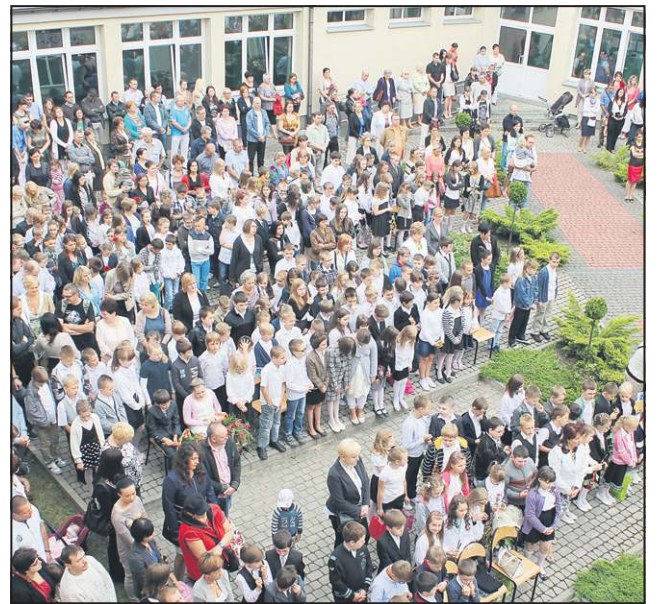
Uczniowie „czwórki” w śróde otrzymują nową halę sportową