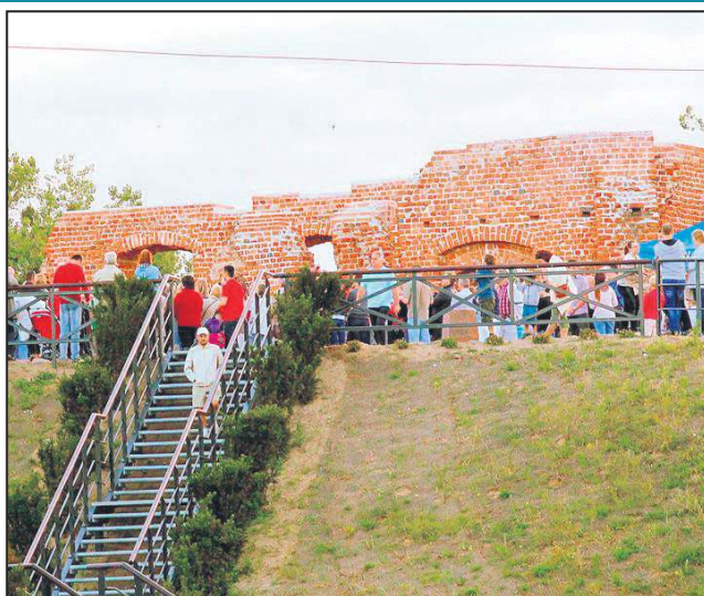
Rewitalizacja ruin zamku to jeden ze zrealizowanych projektów

- Dopiero teraz widać, jak bardzo brakowało jednego miejsca, gdzie mogłyby się spotykać organizacje pozarządowe. W kramnicach swoje biura ma m.in. Powiatowa Izba Gospodarcza, reaktywowany Klub Honorowych Dawców Krwi, Centrum Praw Kobiet, dwie organizacje kombatanckie, Uniwersytet III Wieku. Doceniając, jak ważną rolę pełnią, użyjemy im biura za darmo. Pozostałe stowarzyszenia mogą bezpłatnie korzystać z patio, z sali konferencyjnej, wsparcia Centrum Kultury,