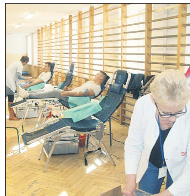
16 litrów krwi to wynik uczniów „osiemdziesiątki”