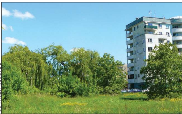
Działka przeznaczona pod budowę komendy od kilku lat czeka na zagospodarowanie

Tymczasem jeszcze pod koniec 2013 r. sprawa wydawała się przesądzona. Na inwestycję złożony miały się wszystkie samorządy powiatu sochaczewskiego. Największy wkład zadeklarowało miasto - w sumie miało być to aż 3,5 mln zł. Jeszcze Rada Miejska poprzedniej kadencji przekazała pod budowę komendy wartą 2,5 mln zł działkę usytuowaną przy ul. 1 Maja (po dawnym przedszkolu). Atmosferę podsycały wydarzenia towarzyszące zbliżającej się budowie. Burmistrz Osiecki wraz z przewodniczącą Rady Miejskiej Jolantą Gontą spotkał się