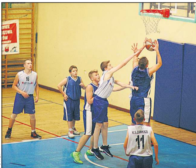
Kadeci w meczu z Mławą byli skuteczni pod koszem