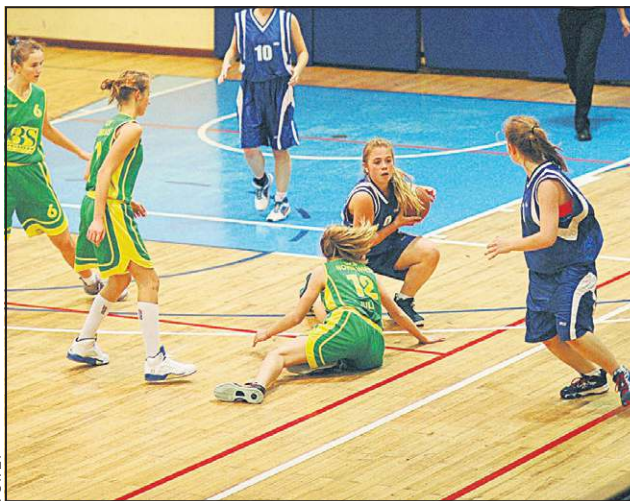
Kadetki często walczyły w parterze