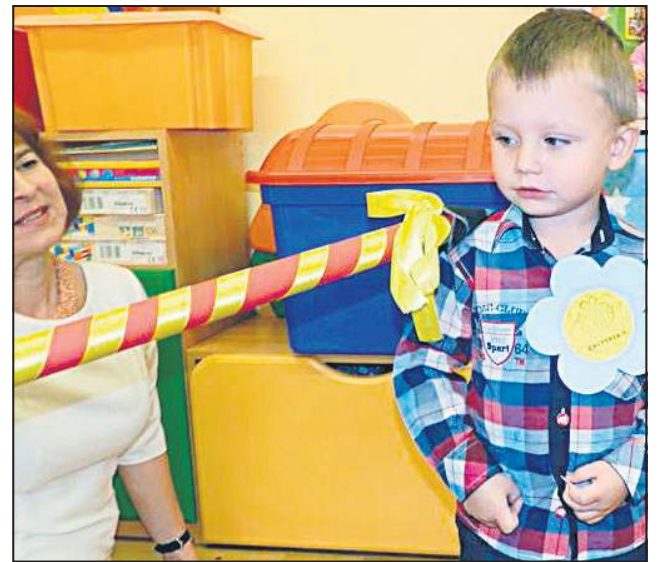
Najmłodszy mieszkańcy miasta mają do dyspozycji nowoczesny żłobek

W latach 2010-2014 na inwestycje i remonty w oświacie, czyli poprawę bazy sportowej, warunków nauki, stanu technicznego obiektów edukacyjnych wydano 9.367.000 zł. W tej kwocie jest ponad 2,5 mln dofinansowania zewnętrznego pozyskanego m.in. z Ministerstwa Edukacji Narodowej, Narodowego Funduszu Ochrony Środowiska, czy jak w przypadku budowy sali gimnastycznej przy „czwórce” z Ministerstwa Sportu (650 tys. dotacji).