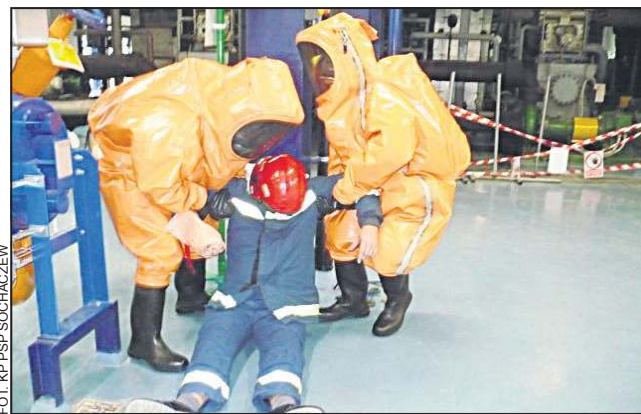
Jednym z zagrożeń był wyciek amoniaku

Organizatorem ćwiczeń była Komenda Powiatowa Państwowej Straży Pożarnej w Sochaczewie. W działania włączyli się także pracownicy firmy Mars, stanowiący ekipę ratowniczą na terenie zakładu, co było szczególnie cennym doświadczeniem, ze względu na możliwość doskonalenia współpracy w warunkach pro-