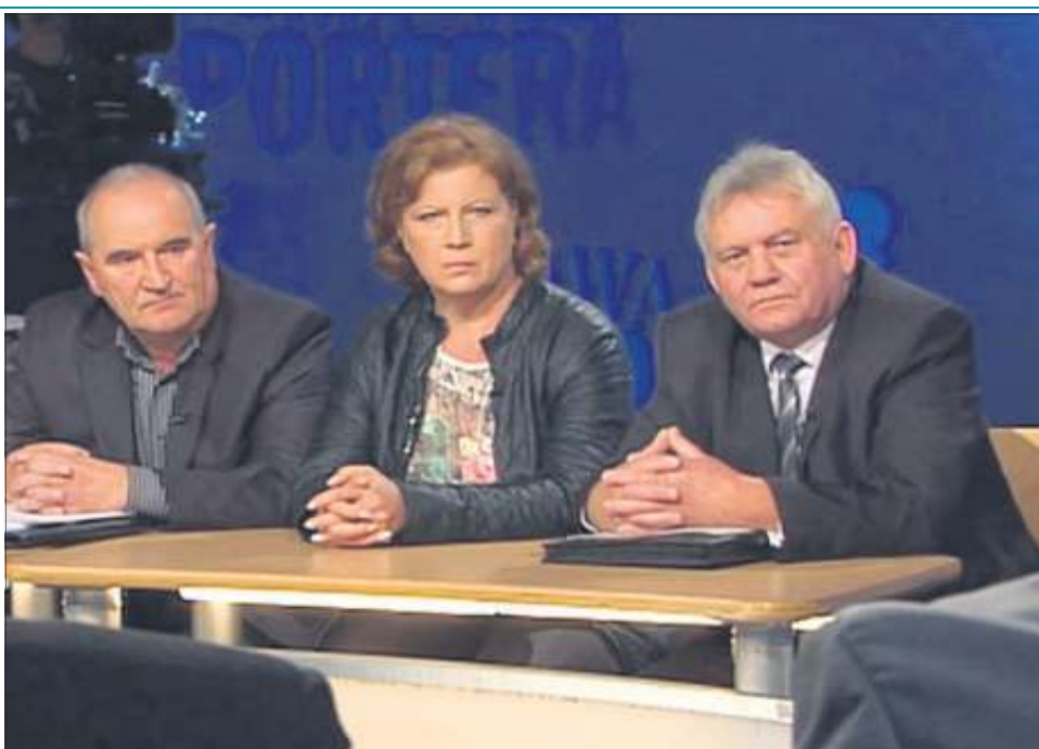
To dzięki tym ludziom bulwersujące fakty z życia DPS w Młodzieszynie wyszły na jaw

M.S.: Teraz już wiemy, skąd ta nadgorliwość głównej księ-