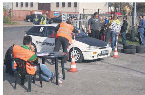
Nad prawidłowym przebiegiem zawodów czuwali profesjonalni sędziowie rajdowi