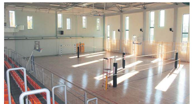
Maraton Zumbi będzie pierwszą wielką imprezą w nowej hali

Szukaj nas pod adresem www.ziemia-sochaczewska.pl