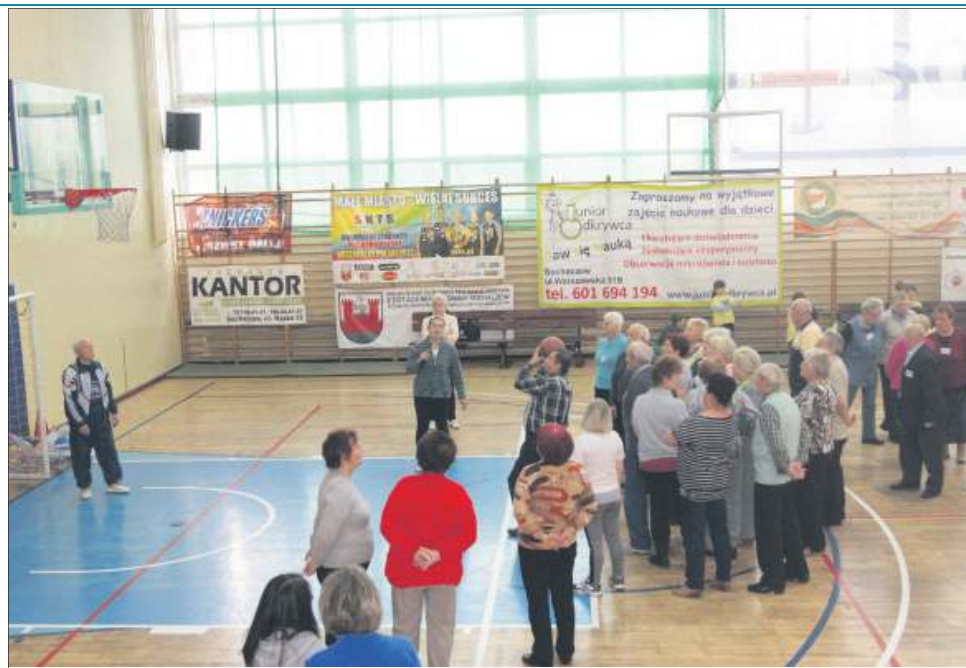
Seniorzy udowodnili, że nie obce są im sporty ruchowe jak koszykówka

Brali oni udział w konkurencjach sprawnościowych, takich jak: strzały na bramkę, rzut piłką do kosza, bieg slalomem czy rzuty woreczkami do celu. Z pewnością najbardziej osobliwą i zarazem emocjonującą konkurencją było wieszanie prania na czas! Mniej wysportowani mogli pograć w warcaby czy wziąć udział