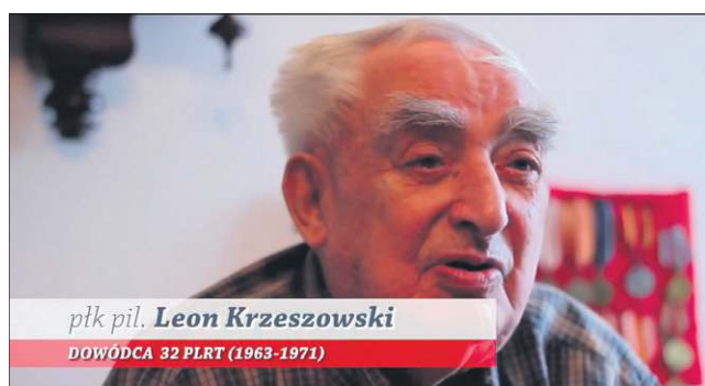
Kadr z filmu o pułku dowodzonym przez płk Krzeszowskiego

- Był wymagającym, surowym, ale jednocześnie sprawiedliwym szefem. Na sercu leżały mu osobiste sprawy pod-