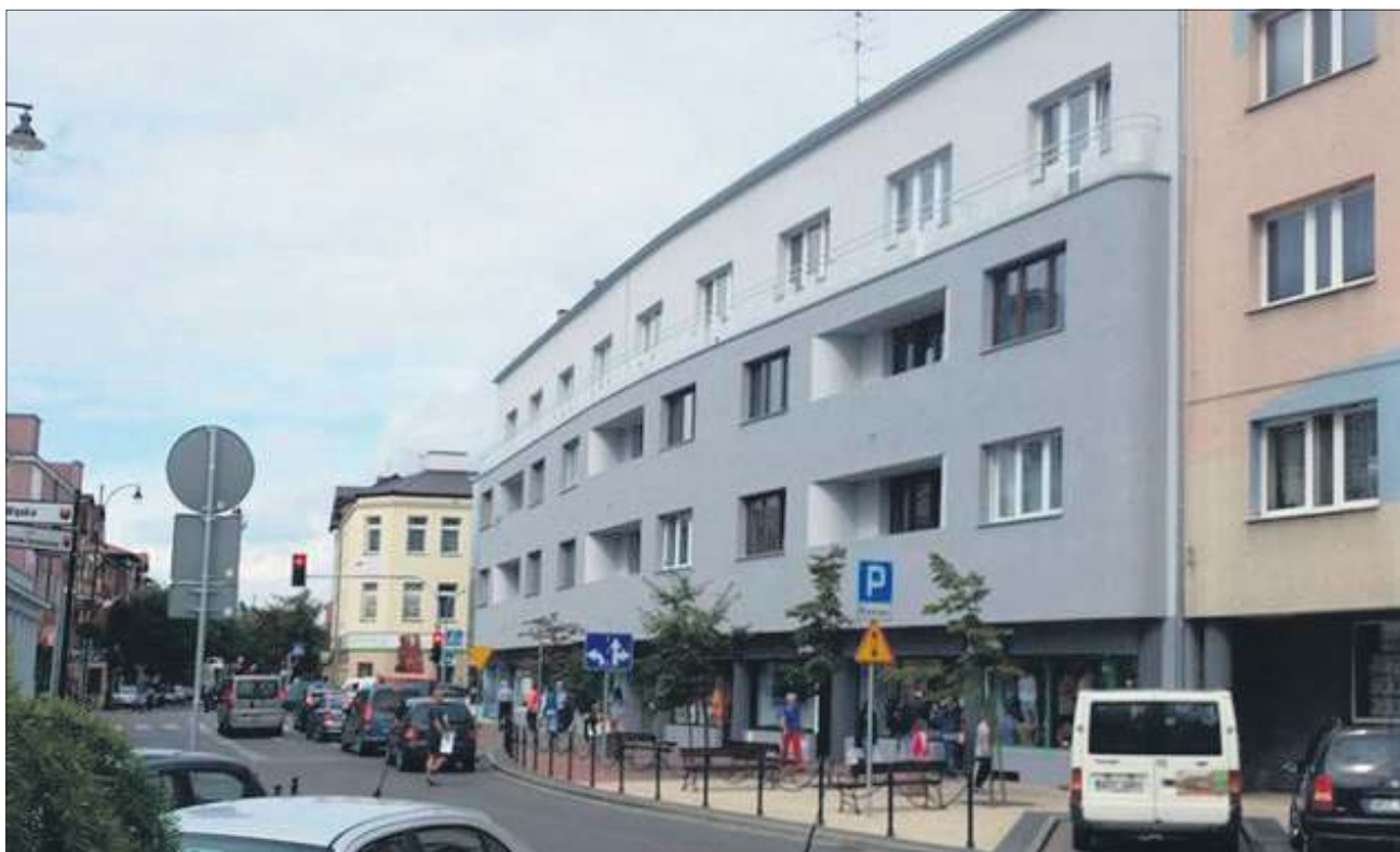
Mieszkańcy bloków, kamienic i domów prywatnych kolejny rok z rządu nie muszą się martwić o wzrost podatku od nieruchomości