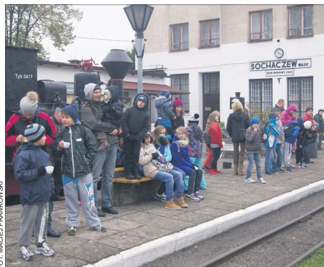
Zwiedzający z zainteresowaniem oglądali zbiory muzeum

Przed ostatnim wyjazdem w tym roku odbyła się parada taboru wąskotorowego użytkowanego przez muzeum. Na torach zwiedzający mogli zobaczyć pojazdy, poczynszy od