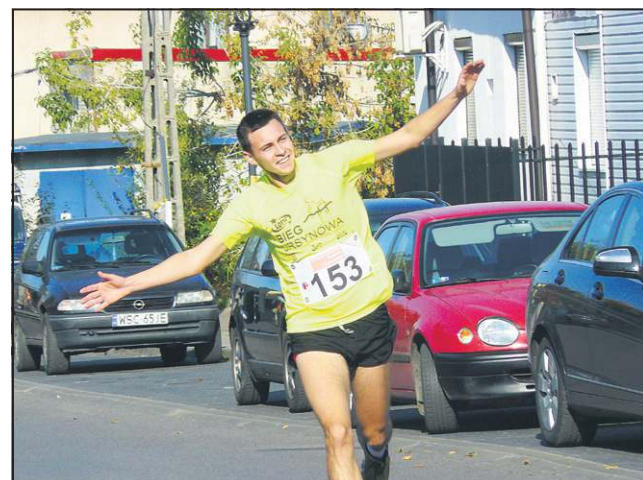
Tak się okazuje radość z biegania

Tego samego dnia na placu Kościuszki z ponad godzinnym opóźnieniem odbył się koncert warszawskiej grupy „Powołani”, która w naszym mieście gościła po raz drugi. Jak mówią członkowie zespołu - to właśnie poprzez muzykę chwałą Boga i oddają mu cześć. Ich muzyka łączy różne style, jednak najbardziej charakterystyczne dla grupy są rytmy rockowe połączone z gospolem. Koncert zorganizowała Fundacja z „Myśl o Tobie”, niosąca pomoc osobom potrzebującym i wykluczonym społecznie.