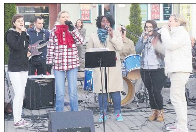
Tego samego dnia wystąpił zespół „Powołani”