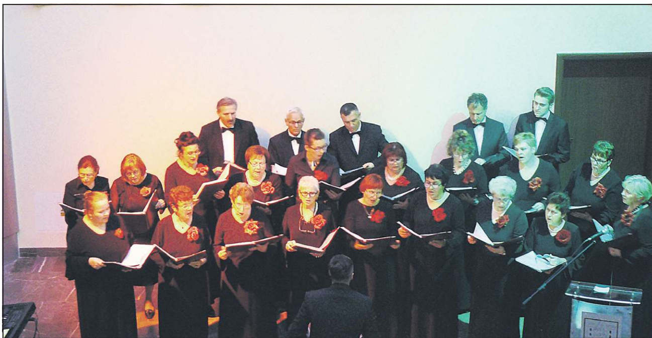
Uroczystość uświetnił występ Chóru Nauczycielskiego „Vivace”