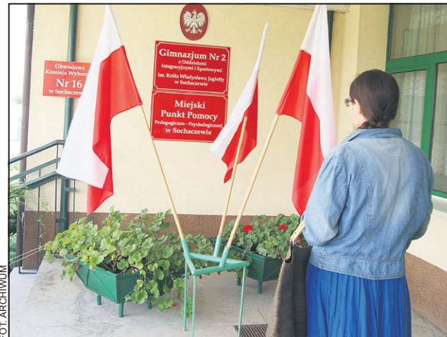
Uprawnionych do głosowania jest blisko 30 tys. sochaczewian

Chciałbyś zostać właścicielem mieszkania, płacąc zaledwie niewielką kwotę? Burmistrz Miasta zachęca lokatorów, by jak naj-