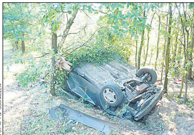
W tym roku na terenie naszego powiatu doszło do wielu tragicznych wypadków

Niestety, mimo apeli, wciąż możemy mówić o pladze pijanych na drogach. W ciągu dziewięciu miesięcy tego roku sochaczewscy funkcjonariusze zatrzymali 136 nietrzeź-