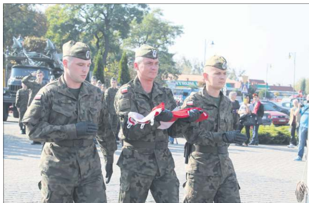
Tuż przed wciągnięciem flagi na maszt

jonie Mińska Mazowieckiego i Mrozów. Przez lata strzegła nieba nad Warszawą.