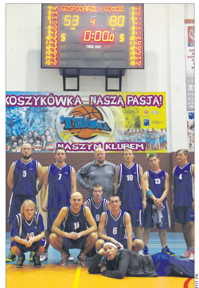
W debiucie sochaczewscy koszykarze rozgromili Żyrardowiankę

Żyrardowianka Żyrardów - UKS MOSiR Basket So-