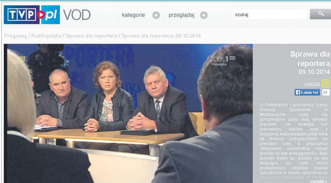
Do udziału w programie zaproszono m.in. osoby, które ujawniły mechanizmy funkcjonowania DPS w Młodzieszynie

Pracownicy i pensjonariusze opowiadali o drogich zakupach robionych na koszt DPS - pralkach, lodówkach, butach i kurtkach po 1000 zł każda, o ogromnych za-