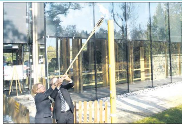
Moment zapalenia symbolicznego znicza gazowego

Sime Polska jest częścią włoskiej grupy kapitałowej SIME specjalizującej się w