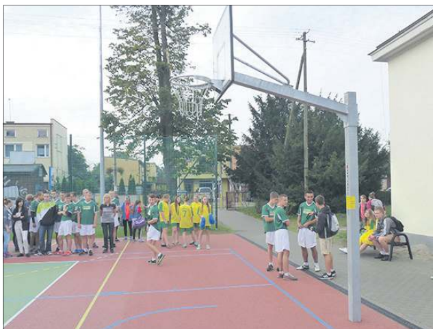
Boiska przy ZS w Chodakowie