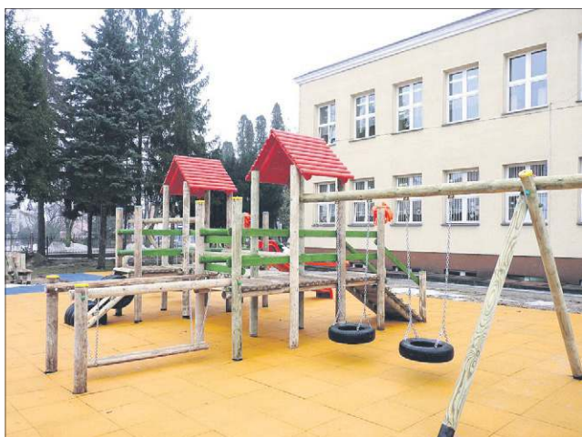
Plac zabaw przy SP nr 2

na taką kwotę sfinansowane zostały rozmaite zajęcia dodatkowe, które wspiera samorząd miejski.