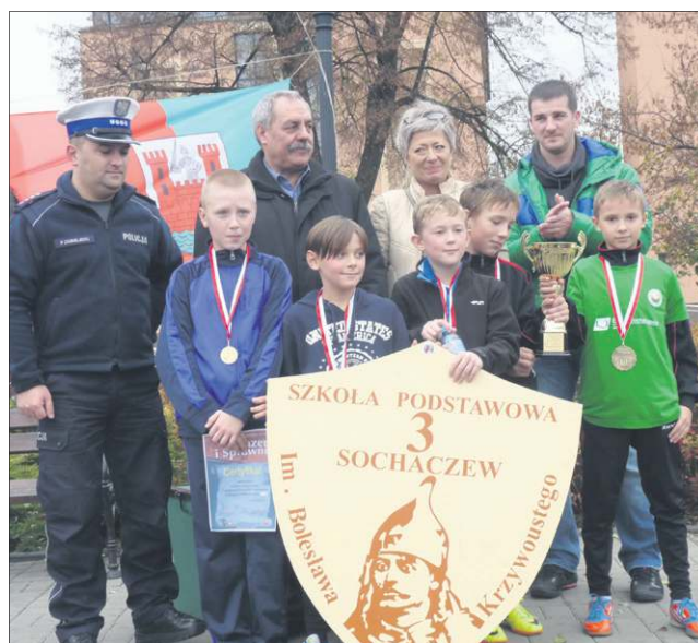
Szkoła Podstawowa nr 3 jest jednym z organizatorów Biegu Papieskiego