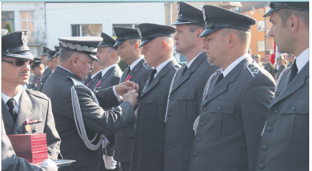
Tradycyjnie podczas uroczystości wręczone zostały wyróżnienia i odznaczenia