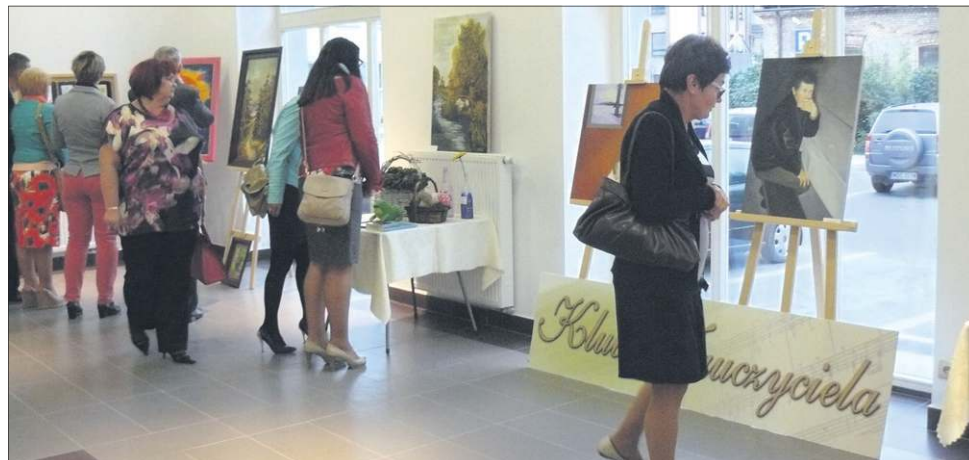
Nauczyciele zaprezentowali bardzo różnorodne prace

Tym razem w Galerii Kramnice mogliśmy podzi-