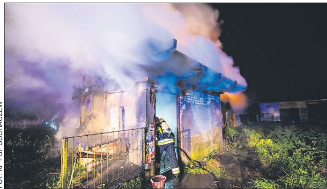
W gaszeniu pożaru w Jeźówce uczestniczyło 17 strażaków

Natomiast 4 października po godz. 11.30 w niemal godzinnej akcji uczestniczyło siedmiu strażaków KP PSP z Sochaczewa. W bloku przy ul. 1 Maja pożar wybuchł w pomieszczeniu kuchennym w jednym z mieszkań na parterze. Dwa zastępy gaśnicze przybyły na miejsce zdarzenia, gdzie odłączyły najpierw w lokalu napięcie elektryczne, a następnie skierowały strumień wody na palące się wyposażenie kuchni.