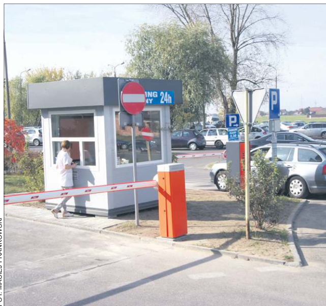
Wjazdu na szpitalny parking strzeże szlaban

Od 6 października przed Szpitalem Powiatowym w Sochaczewie utworzono płatny parking. Wzbudziło to niemałe zaskoczenie wśród korzystających z usług placówki mieszkańców miasta.