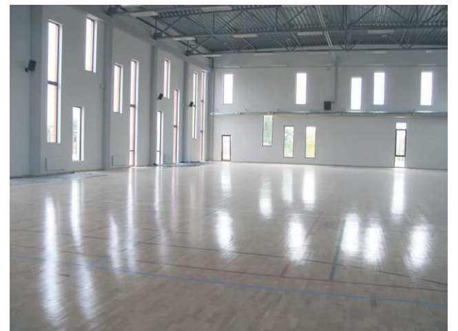
Nowa hala sportowa „czwórki”