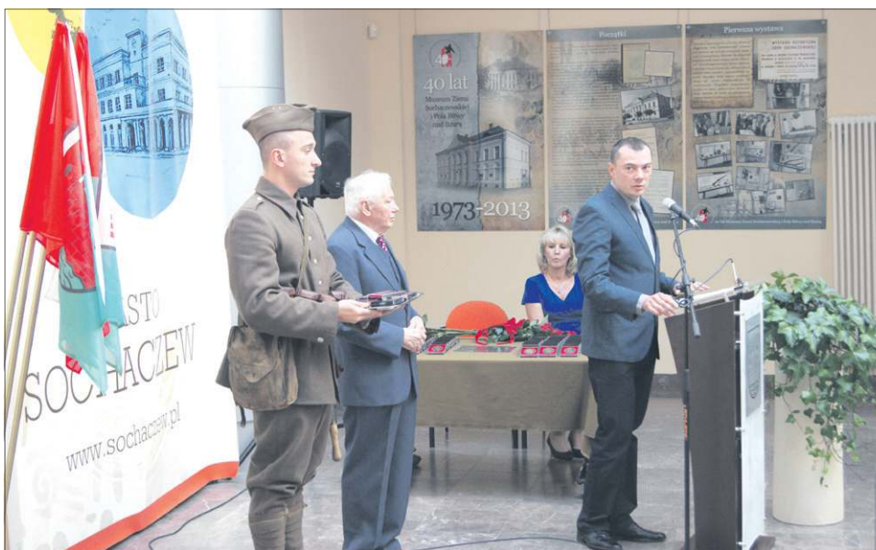
Najbardziej zasłużeni dla rozwoju muzeum otrzymali pamiątkowe medale

Wręczaniu listów gratulacyjnych i kwiatów nie było końca. Wszyscy z uznaniem wypowiadali się o działalności prowadzonej przez