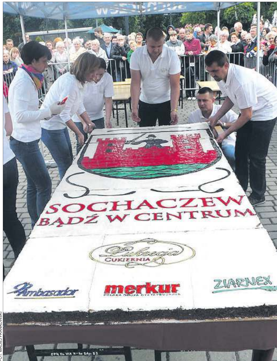
Mazurek Chopina to jedna z wielu nowości na kulturalno-imprezowej mapie miasta

- W Płocku jest jeden dom kultury. W Sochaczewie