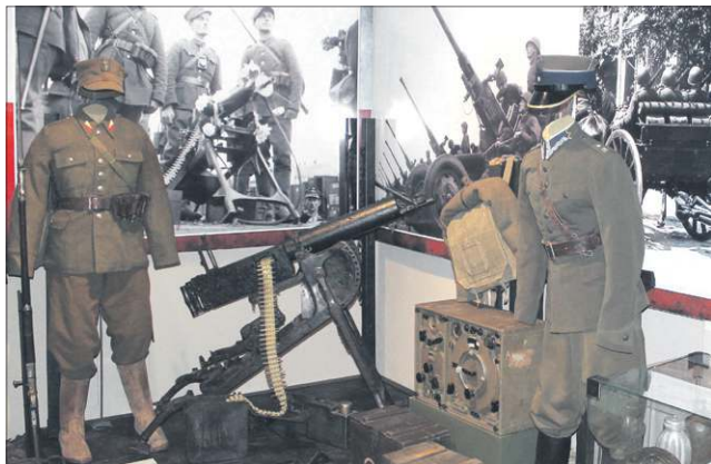
Odnowiona ekspozycja w muzeum stoi na światowym poziomie