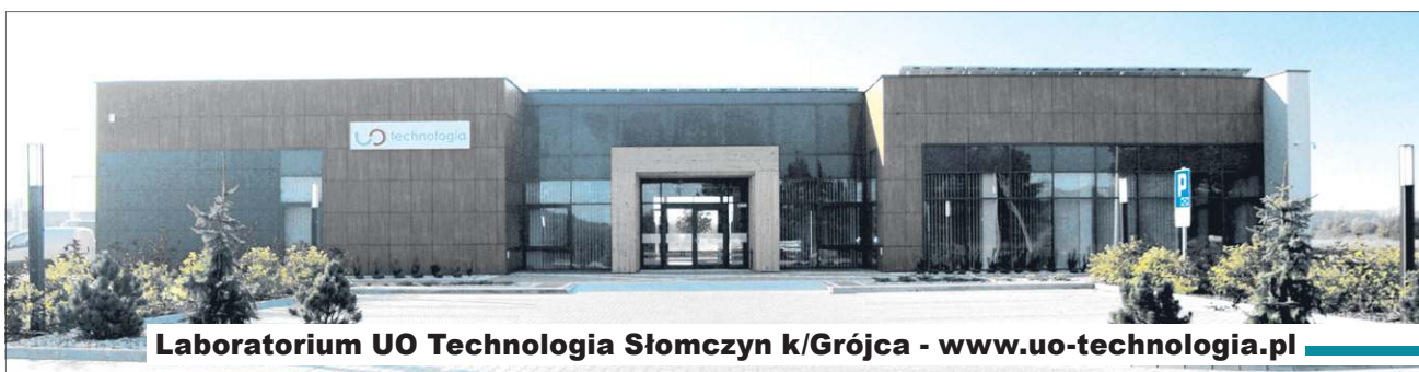
Laboratorium UO Technologia Słomczyn k/Grójca - www.uo-technologie.pl

Należy podkreślić, że przed certyfikacją i potwierdzeniem jakości swojej produkcji nie ma ucieczki. Dziś klient czy konsument wymaga, by produkt mu oferowany spełniał najwyższe standardy jakościowe. Dlatego warto skorzystać z usług naszego laboratorium, potwierdzić jakość produktu, by móc skutecznie sprzedać go na rynku.