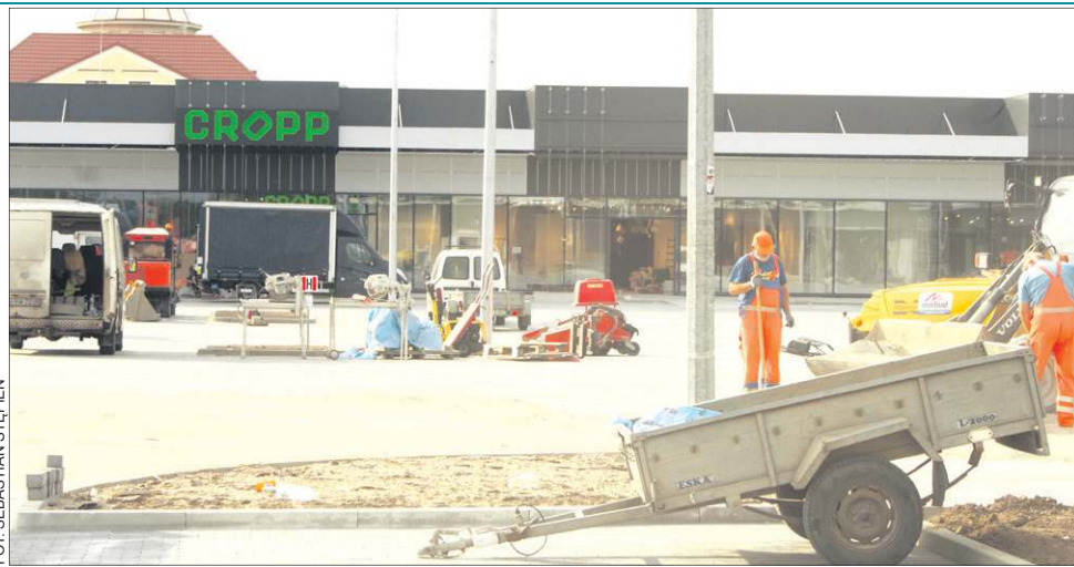
W Sonata Park trwają ostatnie prace wykończeniowe

W czerwcu tego roku, do grona najemców Sonata Park dołączyły Smyk (542 mkw.), Empik (351 mkw.) oraz Drogerie Natura (184 mkw.). Ze szczególnie cie-