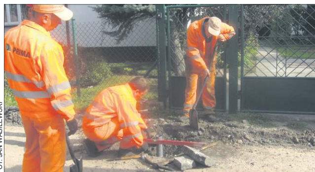
Światłowody położono już w ul. 15 Sierpnia i Traugutta

Główny cel budowy światłowodów zakłada, by wszystkie instytucje publiczne i firmy na Mazowszu oraz 95 proc.