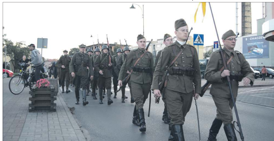
Kolumna rekonstruktorów przemaszzerowała ulicami Sochaczewa