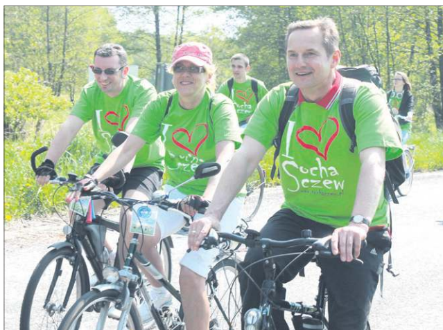
Rajdy rowerowe stały się jedną z atrakcji naszego miasta