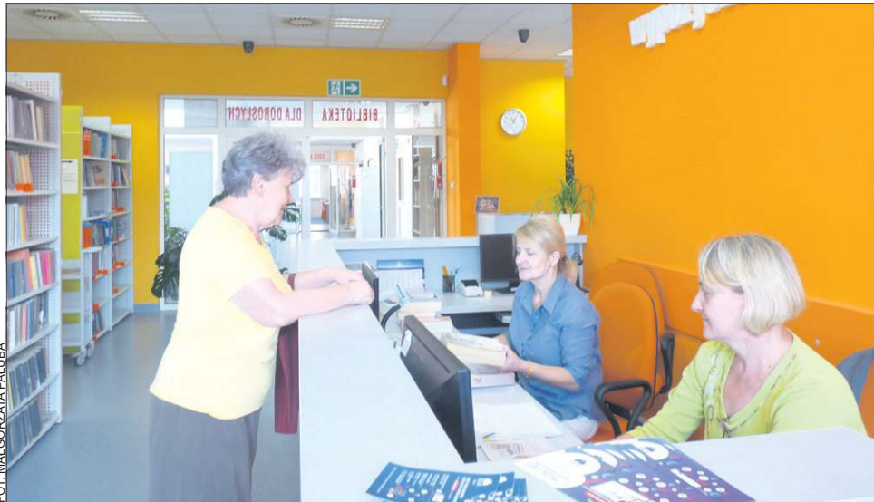
Zaspokajanie czytelniczych gustów to wielka radość dla bibliotekarzy