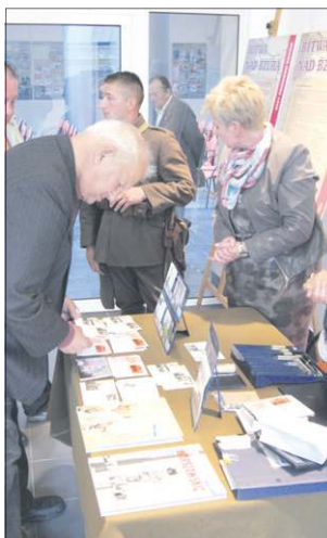
Stoisko Poczty Polskiej