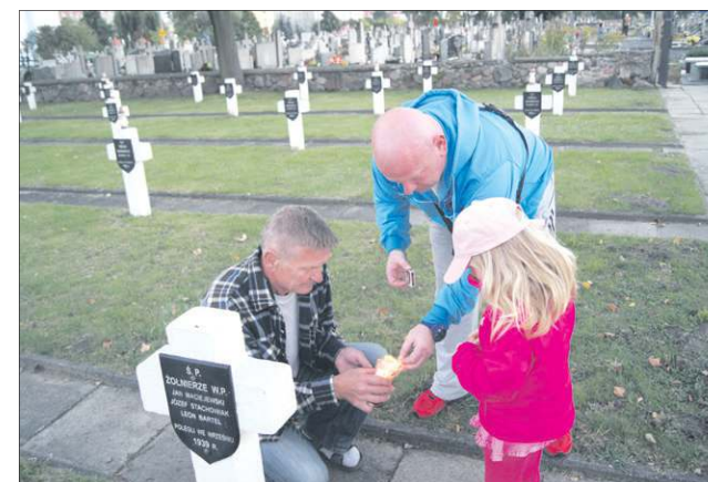
Mieszkańcy miasta przyłączyli się do akcji zapalania zniczy

Jubileuszowi towarzyszyła wystawa zdjęć Waldemara Zakrzewskiego, prezentująca krajobrazy brzegów Bzury, a także fotografie dokumentu-