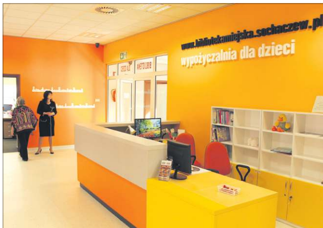
Sochaczew ma teraz jedną z najładniejszych bibliotek w Polsce

tu i Rekreacji, który w ostatnich latach znacznie rozszerzył swą działalność. Oprócz basenu, lodowiska, kilku boisk, hal sportowych i kortów sprawuje też nadzór nad placami zabaw. W utrzymaniu infrastruktury wszystkich obiektów sportowych pomaga... targowisko miejskie. Od niemal czterech lat to MOSiR zarządza rynkiem i uzyskane w ten sposób dochody może inwestować w remonty, zakupy sprzętu, utrzymanie boisk w należyłym stanie. Na obiektach praktycznie co roku wzrasta liczba trenujących. Regularnie korzysta z nich 1500 zawodników zrzeszonych w sochaczewskich klubach sportowych. Rugby, piłka nożna, tenis stołowy, pływanie, judo, siatkówka halowa i plażowa, koszykówka, tenis ziemny, MMA, piłka nożna halowa, lekkoatletyka, w tym półmaraton, rajdy rowerowe, maratony ZUMBY - niewiele jest w Polsce ośrodków, które oferują tak ogromny wachlarz dyscyplin.