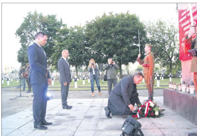
Władze oddały hołd poległym żołnierzom i cywilom

pracowników muzeum i życzyli im kolejnych sukcesów.