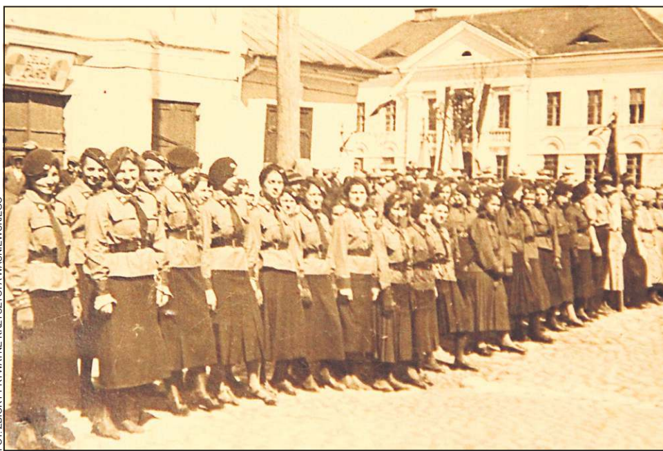
1939 rok. Przed defiladą 3 maja

Jeżeli lokal składał się wyłącznie z izb, z których każda miała powierzchnię podłogi mniejszą niż 10 m 2 , wówczas dla pomieszczeń tych przyjmowało się normy mniejsze o połowę. Przy wymierzaniu opłat nie brano pod uwagę piwnic, szop i innych pomieszczeń, w których nie używa się wody, natomiast liczyło się do opłat stajnie, obory, garaże, tudzież sutereny, w których mieściły się sklepy, warsztaty i przetwórnice. Od przedsiębiorstw przemysłowych pobierano roczne opłaty ryczałtowe - od sklepów z artykułami spożywczymi IV kat. 6 zł rocznie, III i II kat. 12 zł rocznie, od piekarni 100 zł i 70 zł