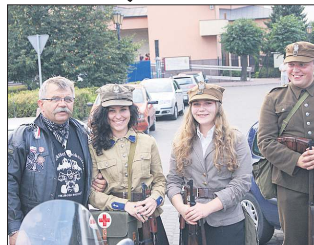
Rajd miał wiele patriotycznych odniesień

Rozwiązanie rajdu nastąpiło na terenie przystani nad Bzurą w Sochaczewie. Podliczono osiągnięcia punktowe zespołów w poszczególnych konkurencjach i wyłoniono zwycięzców. Następnie motocykliści rozpalili ognisko i spędzili wieczór przy akompaniamencie gitary. (mf)