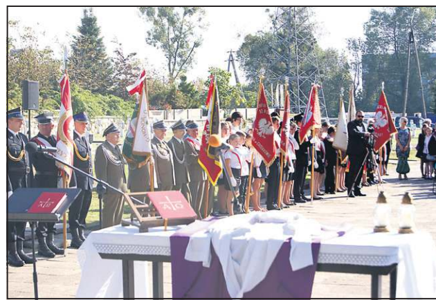
17 września na cmentarzu w Trojanowie odbyła się msza polowa

Również w poniedziałek 22 września przy Pomniku Poległych w Boryszewie zebrali się tłumy mieszkańców, aby uczcić pamięć zamordowanych tam żołnierzy Bydgoskiego Batalionu Obrony Narodowej. Żołnierze batalionu, jako