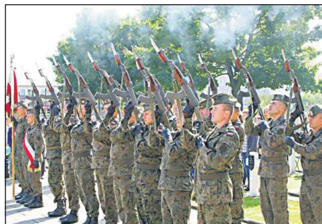
Salwą honorową uczczono pamięć poległych