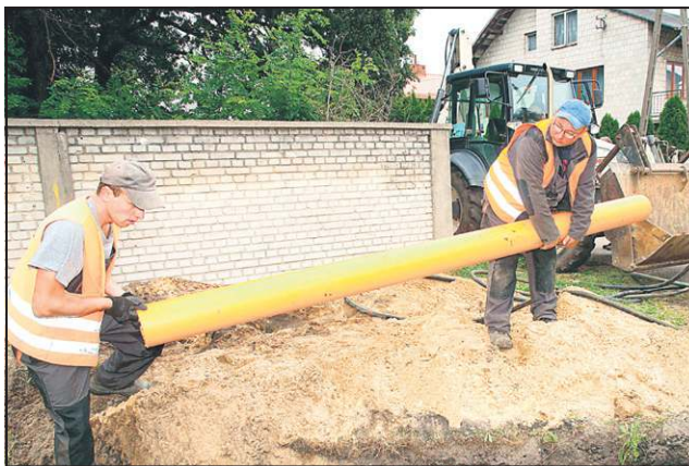
W tym roku powstało 20 km nowych sieci

W 2009 roku gazociąg zawitał do firm Mars Polska, Bakoma i do Teresina, który jest najbardziej zgazyfikowaną gminą w powiecie - na większości ulic ponad 70 proc. posesji korzysta z tego źródła energii. Pierwszym odbiorcą w mieście był sochaczewski PEC, który dostarcza ciepło m.in. do urzędu miasta.