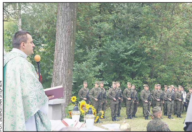
22 września. Msza św. przy Pomniku Poległych w Boryszewie

jeńcy wojenni, przebywali w dniach 20-21 września 1939 roku na terenie stadionu w Żyrardowie. 21 września wszystkim żołnierzom batalionu bydgoskiego kazano wystąpić z tłumy 30 tys. zatrzymanych, obiecując im powrót do domu. Wystąpiło około 180 żołnierzy, których skierowano do Sochaczewa, a następnie Boryszewa. Tu, spośród wziętych do niewoli żołnierzy batalionu, wytypowano 50, w tym całą kadre oficerską, po czym pod fałszywymi zarzutami złamania konwencji genewskiej poprzez „udział w masakrze ludności niemieckiej w Bydgoszczy” postawiono ich przed sądem polowym. 22 września 1939 wszyscy zostali skazani na śmierć i tego samego dnia o godz. 19.00 rozstrzelani w pobliskiej cegielni.