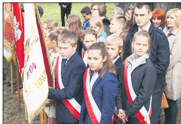
Uczestnikami uroczystości byli uczniowie szkół