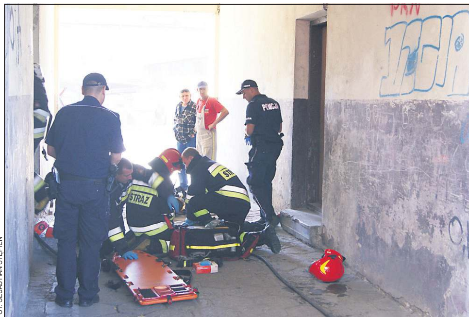
Reanimacja poszkodowanego w pożarze mężczyzny nie dała efektów

W mieszkaniu spaleni uległa wersalka i część wykładziny. Dzięki szybkiej akcji strażaków ogień nie rozprzestrzenił się do sąsiednich lokali. Przybyły na miejsce zdarzenia prokurator ustalił, że przed wejściem strażaków drzwi mieszkania zamknięte były od środka. Wstępne oględziny denata nie ujawniły