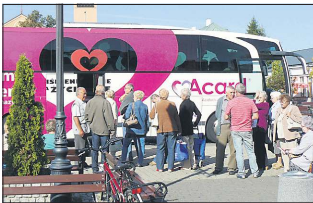
Wystarczyło przyjść na plac Kościuszki i poczekać na swoją kolej

Bezpłatny pakiet obejmował pomiar ciśnienia tętniczego krwi (to powinno mieścić się w przedziale pomiędzy 120/80 - 139/89 milimetrów słupa rtęci) oraz zbadanie wieku serca za pomocą innowacyjnej aplikacji. Przygotowali ją eksperci Uniwersytetu Medycznego w Gdańsku we współpracy z naukowcami z Boston University. Okazało się, że wiek serca co dziesiątego mieszkańca Sochaczewa przekracza wiek metrykalny o 8 lat. Tymczasem wynik pomiaru, który przewyższa normę, może być pierwszym