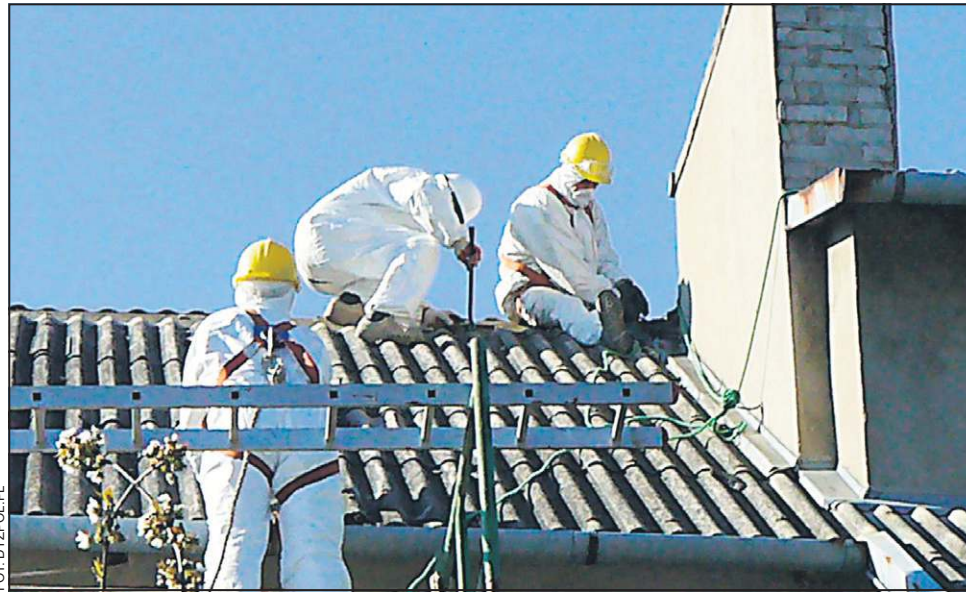
Usuwanie azbestu wymaga zachowania szczególnej ostrożności

- W poprzednich latach nie udało się uzyskać pomocy finansowej z Wojewódzkiego Funduszu Ochrony Środowiska, w tym roku nasz wniosek został rozpatrzony pozytywnie. Co istotne, dostaliśmy tyle pie-