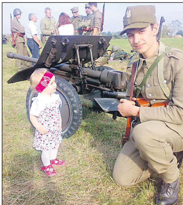
Dzięki takim imprezom młodzi i starsi poznają naszą historię...