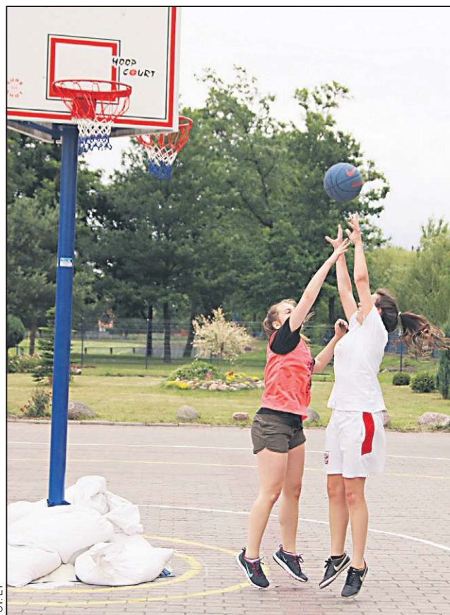
W piterbasket grają chłopcy i dziewczęta

Gra odbywa się na okrągłym boisku o średnicy 18 metrów. Są w nim trzy koncentryczne okręgi - strefa 3 sekund, strefa rzutów za 2 punkty i strefa rzutów za 3 punkty. W centrum boiska jest stojak, na którym zamocowane są 3 tablice do koszykówki złączone w trójkąt równoboczny. Grać mogą zespoły od jednego do pięciu zawodników (lub zawodniczek). Każdy z zespołów może rzucać piłkę do dowolnie wybranego kosza.