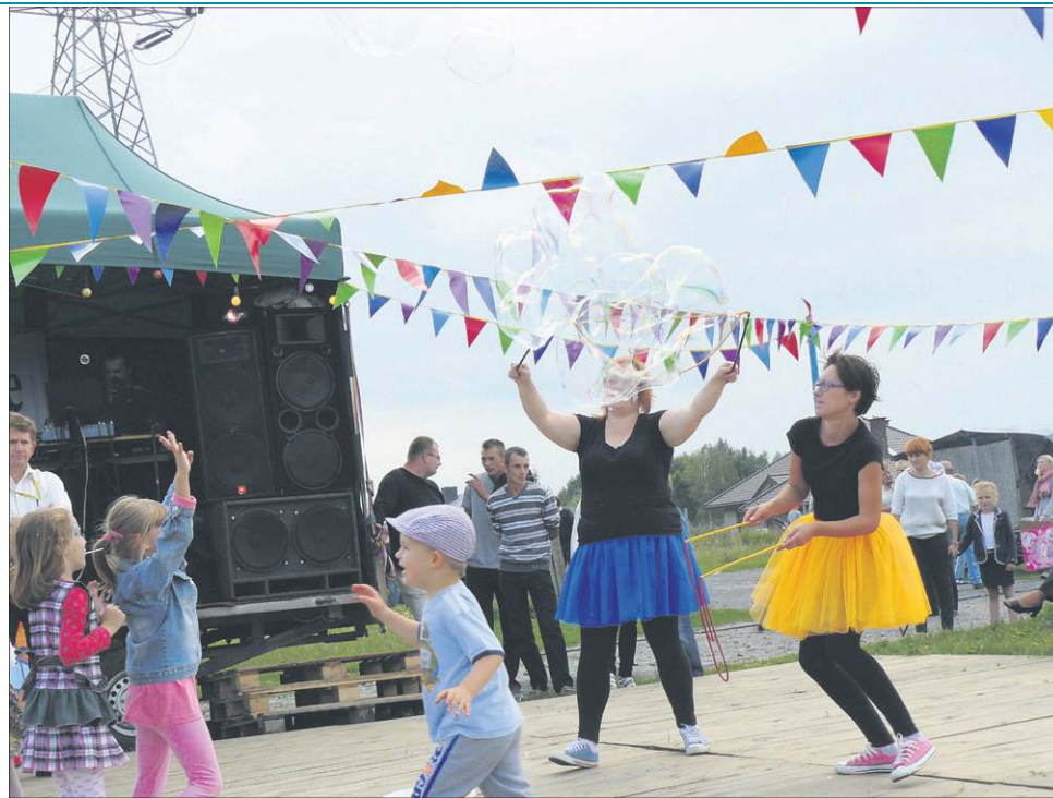
Animatorzy zadbali, by najmłodszy uczestnicy imprezy dobrze się bawili