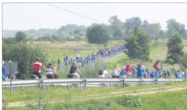
Trasa rajdu biegnie malowniczymi terenami gminy Brochów

Jednym z najmilszych elementów rajdu był piknik, który odbył się na terenie strażnicy OSP w Przęsławicach. Tradycyjnie był to czas na upieczenie kiełbasek, odpoczynek oraz wzięcie udziału w najróżniejszych konkurencjach, zabawach i konkursach przygotowanych specjalnie z okazji rajdu. Po jego zakończeniu rowerzyści wyjechali na trasę w kierunku Sianno-Żelazowa Wola-Sochaczew. Około godz. 16.00 rajd rozwiązano na pl. Kościuszki.