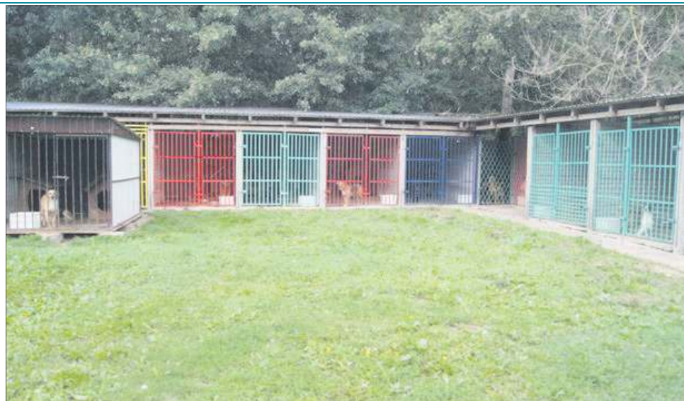
Zwierzęta żyją w „Azorku” w bardzo dobrych warunkach

- Zgodnie z zawartą z miastem umową do nas tak naprawdę należy tylko opie-