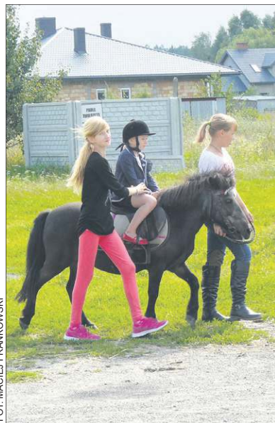
Stajnia Daisy i park rozrywki to kolejne atrakcje festynu