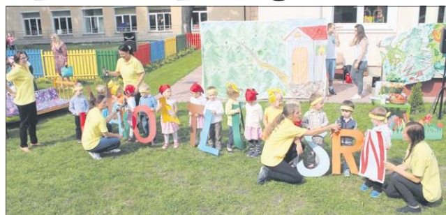
Dzieci przygotowały choreografię do wiersza „Abecadło”

Dla licznie zebranych rodziców i gości dzieciaczki przygotowały występy artystyczne. Po zaangażowaniu w mówienie wierszyków i tańce widać było rys przyszłego profesjonalizmu malutkich wykonawców. Nie zabrakło również pokazowej lekcji języka angielskiego. Po występach artystycz-