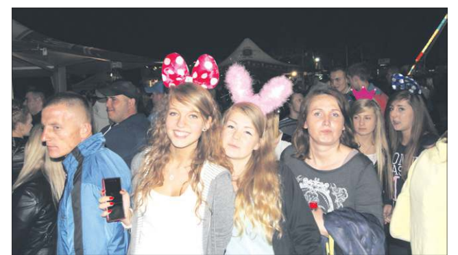
Stadion w Iłowie zapełnił się wielbicelami disco

W międzyczasie na terenie imprezy przygotowano mnóstwo innych atrakcji. Gry, zabawy i konkursy oferowane w rozstawionym parku rozrywki cieszyły się ogromnym zainteresowaniem uczestników festiwalu. Zabawa trwała do późnych godzin nocnych. Jej zwieńczeniem był utwór „Ona tańczy dla mnie” w wykonaniu zespołu Weekend. (mf)