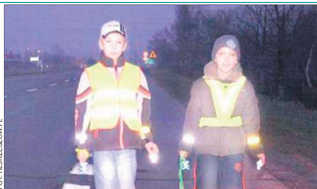
Odblaski zwiększają widoczność z 40 do nawet 150 metrów

- Jak będę chciał się przejść do Chodakowa wieczorem, to przecież nie będę sobie wieszal świecącej choinki i robił z siebie wariata - argumentuje inny.