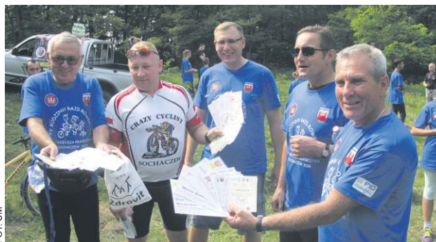
Niektórzy kolekcjonują certyfikaty uczestnictwa z lat ubiegłych