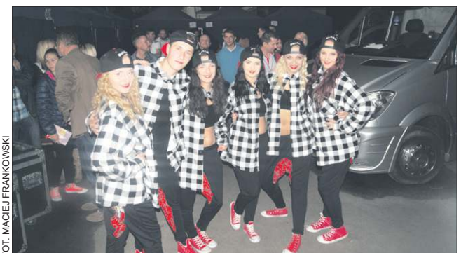
Jedna z grup tanecznych towarzyszących gwiazdom na scenie