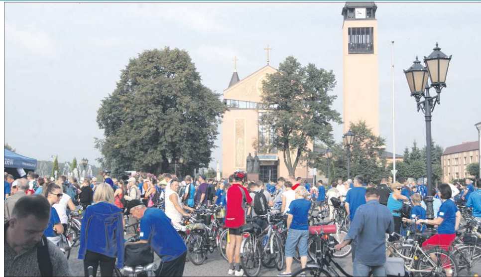
Jak co roku uczestnicy zbrali się w sobotni poranek na placu Kościuszki

Skąd wzięła się tak duża popularność rajdu? Z pewnością decydującą rolę odgrywa jego atmosfera. Uczestnicy pokonują trasę rekreacyjnie, jadąc często całymi rodzinami czy w grupach przyjaciół. Nie jest ważne tempo czy kolejność, w jakiej przejechało się rajd. Poza tym impreza jest otwarta dla wszystkich i bezpłatna. Jedyne o czym muszą pamiętać uczestnicy, to zabranie kiełbaski i pieczywa (przydadzą się na ognisko) oraz butelek z