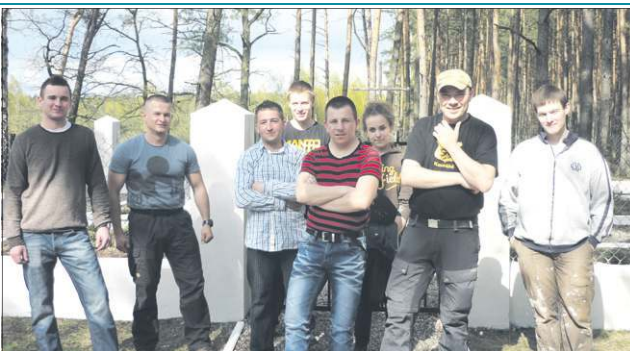
Członkowie MGH po pracach w Rokicinie

Doszliśmy do wniosku, że za te pieniądze zrealizujemy cele związane z pielęgnacją miejsc pamięci na-