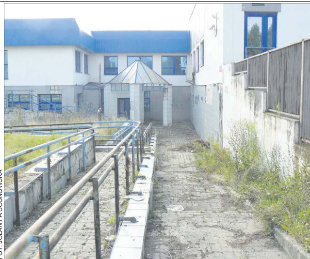
To jeden z 29 podobnych budynków w ofercie Orange

Błękitny gmach zbudowano w latach 90. Był to wtedy jeden z najnowocześniejszych budynków w Sochaczewie. Z biegiem czasu utracił on swoją użyteczność. Wszystko to za sprawą nowych technologii, które są tańsze, szybsze i bardziej funkcjonalne. Telefony stacjonarne, wyparte przez komórki, powoli odchodzą do lamusa. Na terenie miasta jak grzyby po deszczu powstały salony sieci komórkowych. Zapotrzebowanie na usługi TP diametralnie zmalało. Obecnie do obsługi klientów, na terenie miasta wielkości Sochaczewa, wystarczą tylko 1-2 niewielkie telepunkty.