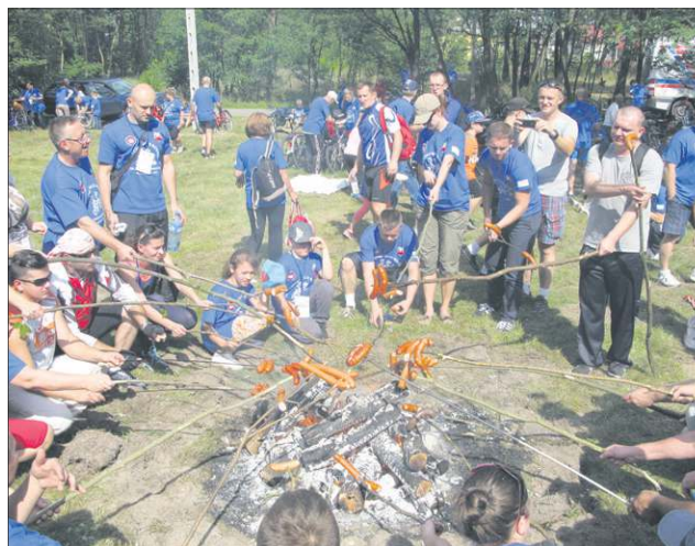
Na każdego, kto zdecyduje się wziąć udział w imprezie, czeka wiele atrakcji

wodą. Organizatorzy dużą wagę przykładają do bezpieczeństwa. Zapewniają opiekę medyczną na całej trasie, techniczne zabezpieczenie, serwis na wypadek awarii roweru.