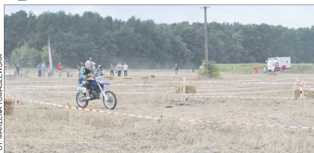
Konkurencje rozegrane na motorach były bardzo widowiskowe

Zawody przed jedenastu laty wymyśliło dwóch ludzi: