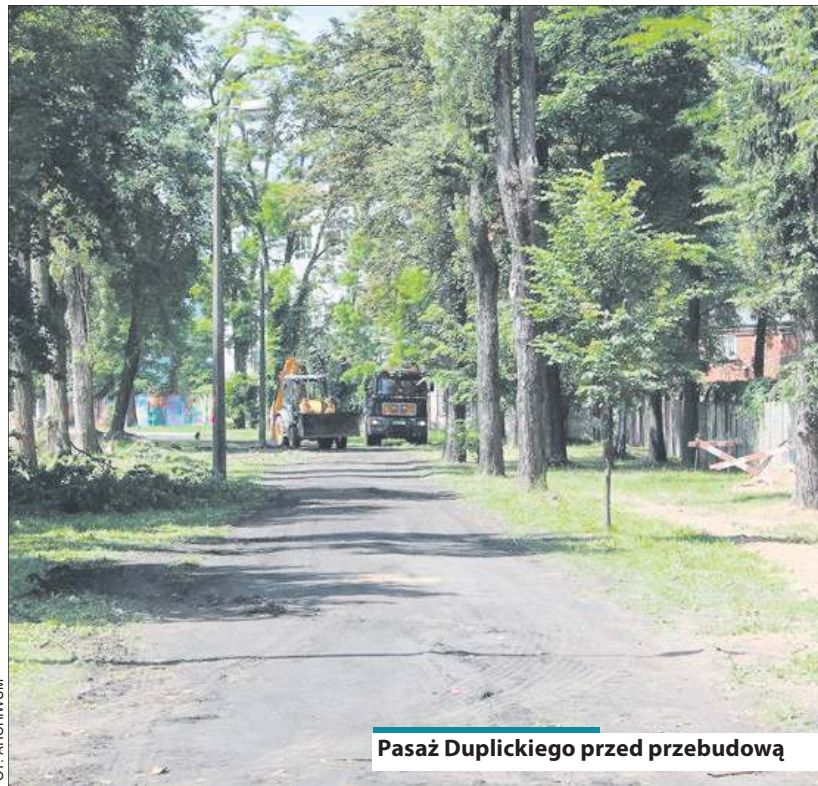
Pasaż Duplickiego przed przebudową

MOSiR 46 862-77-59 PEC 46 862-92-00, telefony alarmowe 24h 604-206-108, 602-789-111 Pogotowie energetyczne 46 862-26-20 Pogotowie gazowe (Sime Polska) 602-343-343, 792-008-866 Pogotowie 999 Policja 997, 46 863-72-00 PKP 19-757 Koleje Mazowieckie 22 364-44-44 PKS Grodzisk Mazowiecki, baza w Sochaczewie 46 862-55-12 Sąd Rejonowy 46 862-32-64 Schronisko „Azorek” 791-604-108 791-606-109 (adopcje) Fundacja „Nero” 502-156-186 Starostwo Powiatowe 46 864-18-40, 46 864-18-73 Straż pożarna 998, 46 862-23-70 Szpital 46 864-95-00, 46 864-96-00 MPT Taxi 191-91 Taxi 46 862-28-42 USC 46 862-23-02 Urząd Miejski 46 862-27-30, 46 862-22-35 Urząd Skarbowy 46 862-26-04 Zakład Wodociągów i Kanalizacji 46 862-82-30 Zgłaszanie awarii sieci wodociągowej i kanalizacji sanitarnej 604-195-867, 696-056-281, 664-157-699 ZGM 46 862-81-06, 46 862-93-14 awarie elektryczne (tylko ZGM) 660-477-130 awarie wodno-kanalizacyjne (tylko ZGM) 660-477-129 ZKM 46 862-99-27 ZUS 46 862-64-33