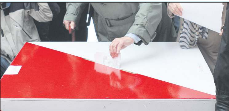
Podczas ostatnich wyborów samorządowych w 2010 r. frekwencja wśród sochaczewian wyniosła ponad 40 proc.

W mieście prowadzony jest stały rejestr wyborców. Jest on aktualizowany dla każdego obwodu głosowania. Wszyscy, któ-