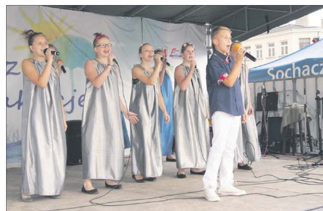
Rozśpiewani wokaliści z sochaczewskiego MOK

Podsumowując, niedzielna impreza była bardzo udana, a licznie zebrani mieszkańcy Sochaczewa z pewnością się nie nudzili, gdyż każdy lub prawie każdy mógł znaleźć coś dla siebie. Nie zawiodła także pogoda. Chwilami słońce nawet bardzo mocno przygrzewało. Brawo nasze domy kultury! Pokazałyście, że dzieje się w was wiele ciekawych rzeczy. Oby tak dalej.(et)