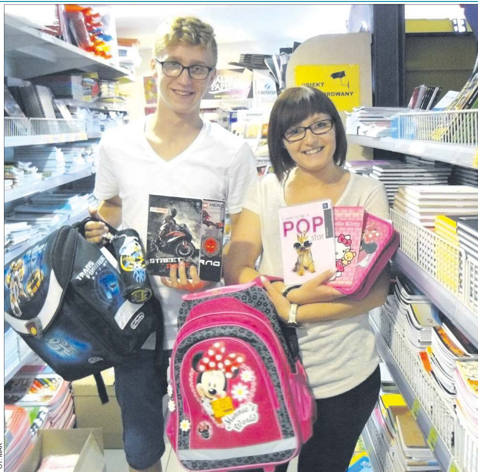
Pracownicy sklepu „Kubuś” z ul. Żeromskiego zauważyli już wzmożone zainteresowanie artykułami szkolnymi

W księgarniach i punktach z używanymi podręcznikami od połowy sierpnia trwa prawdziwe obłędzenie. - Książki zdrożały średnio o 20-30 zł na boksie. Powodem jest to, że zostały wprowadzone bezpłatne podręczniki do klasy pierwszej i odbiło się to na następnych klasach. Największą bzdurą jest wygórowana cena podręczników do takich przedmiotów jak muzyka czy plastyka - twierdzi właścicielka jednej z sochaczewskich księgarni. Nasza rozmówczyni nie ukrywa faktu, że szkoły wiejskie często wybierają droższe podręczniki. Różnica w stosunku do miejskich placówek wynosi nawet ponad 100 zł. Jej zdaniem dużym nieporozumieniem jest też to, iż zmiany w książkach są dosłownie kosmetyczne, polegające np. na przeniesieniu zad-