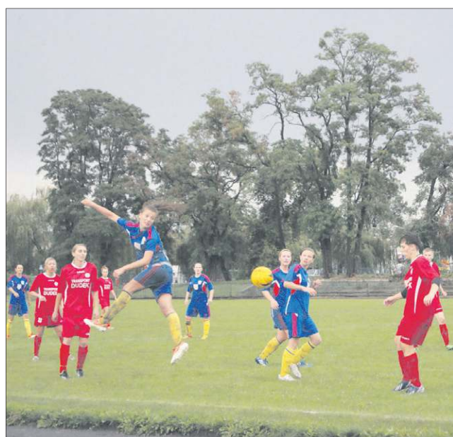
Pomimo deszczu futbolistki walczyły dzielnie

Rywalki ograniczały się do pojedynczych akcji, które z reguły kończyły się na linii pola karnego. Mecz toczył się w rześkim deszczu, który z pewnością nie był elementem pomagającym zawodniczkom w grze. W drugiej kolejce teresinianki zagrają na wyjeździe z KS Raszyn. W poprzednim sezonie rywalki dwukrot-