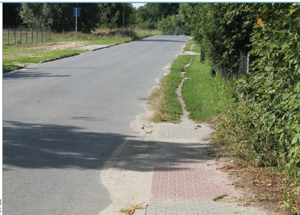
Chodnik przy ul. Młynarskiej kończy się w połowie drogi. Kolejny odcinek piesi muszą pokonywać poboczem lub asfaltem

Młynarska i Łąkowa odchodzą od Trojanowskiej w stronę mostu na Utracie w Chodakowie. Jeszcze w poprzedniej kadencji, na około połowie długości tego odcinka wybudowano chodnik. Dodajmy, bardzo po-