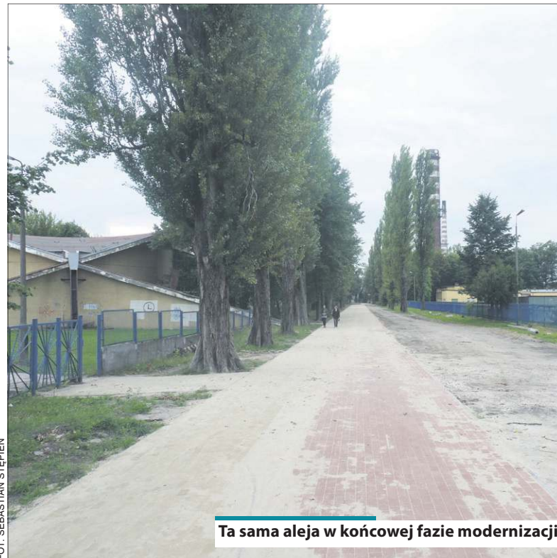
Ta sama aleja w końcowej fazie modernizacji