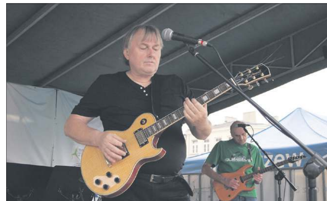
Zespół Blues MOK spotkał się po 30 latach