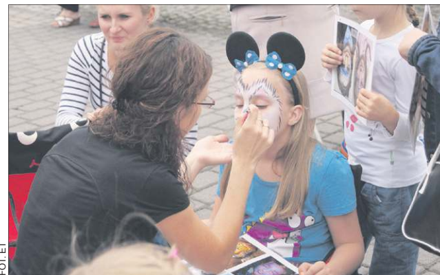
Atrakcje czekały na mieszkańców w każdym wieku