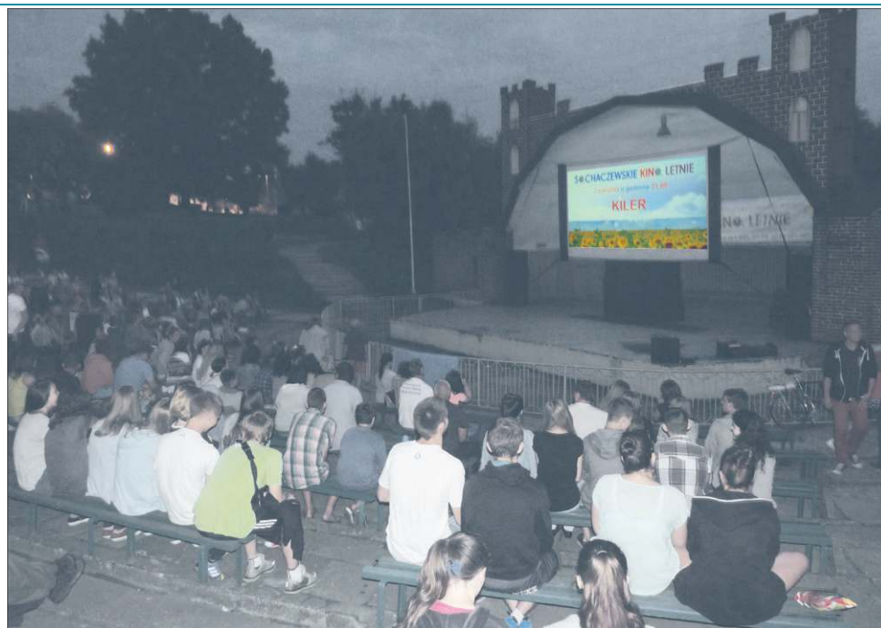
Jest szansa, że w przyszłym roku sochaczewianie również będą mogli spotkać się w kinie letnim. Odpowiedni wniosek został złożony do tegorocznej edycji SBO

Głosowało ponad 700 osób, nic więc dziwnego, że podczas każdego z czterech seansów chętnych na taką formę spędzenia czasu nie brakowało. Muszla koncertowa wypełniona była do ostatniego miejsca. Widzowie zajmowali również