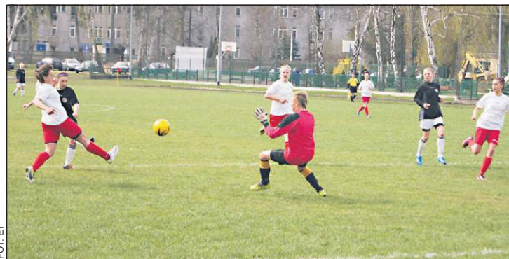
Wysoka forma bramkarek może być podstawą sukcesu

Teresinianki w ramach przygotowań rozegrały sparingi z I-ligowymi MUKS Praga Warszawa oraz LUKS Sportowa Czwórka Radom. Rozgrywki II Ligi Mazowieckiej KS Teresin zainauguruje meczem z Wisią Szczuczyn (16.08, godz. 17.00) na sochaczewskiej Maracanie.