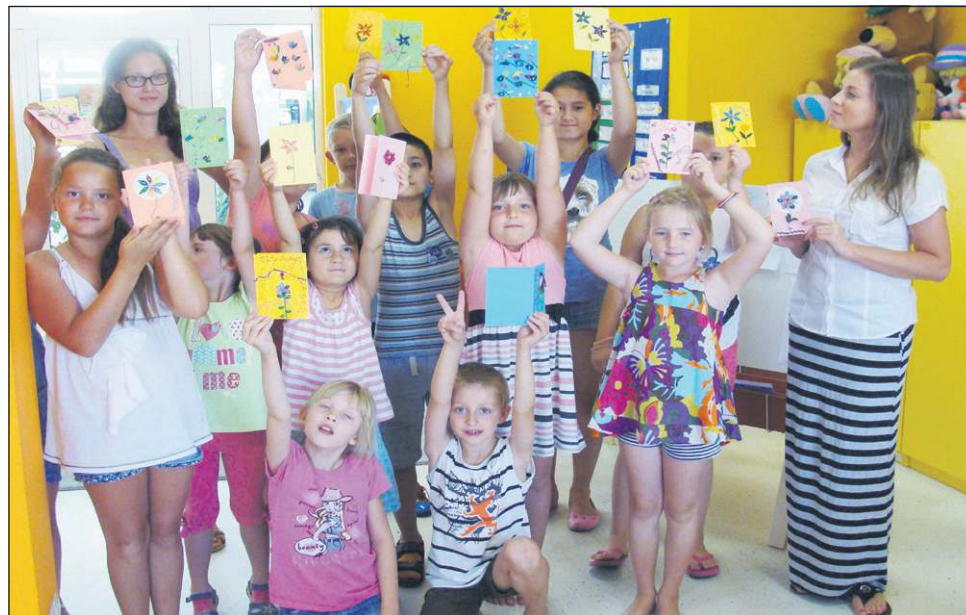
Jak co roku dzieci uczestniczyły w letnich zajęciach bibliotecznych

Przypomnijmy, że główna siedziba biblioteki w centrum miasta posiada doskonałe warunki lokalowe, dużą przestrzeń, nowe wyposażenie, dostęp do bezprzewodowego