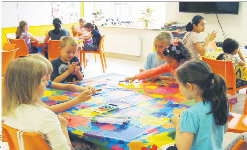
Biblioteka to dla najmłodszych doskonale miejsce do spędzania wolnego czasu