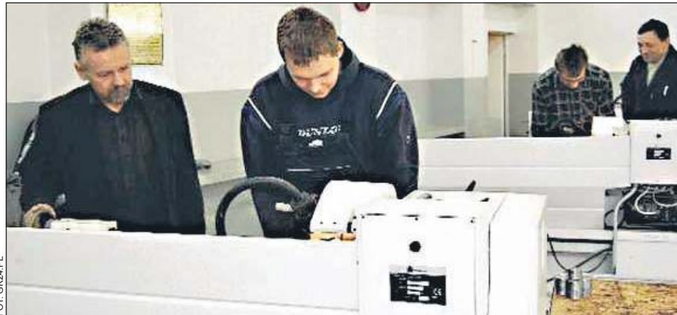
Absolwentom coraz trudniej znaleźć zawód poszukiwany na rynku pracy

Bezrobotni poniżej 25. roku życia stanowią w Polsce około 28 proc., podczas gdy w Niemczech 7,5 proc. - wynika z danych Eurostatu. Daleko nam jeszcze do rekordzistów (Hiszpania, Grecja, Chorwacja - 50 proc.), ale różowo też nie jest. Jak powiedział nam pragnący zachować anonimowość przedsiębiorca z rejonu Sochaczewa, wysokie koszty zatrudnienia pracownika to nie jedyny problem.