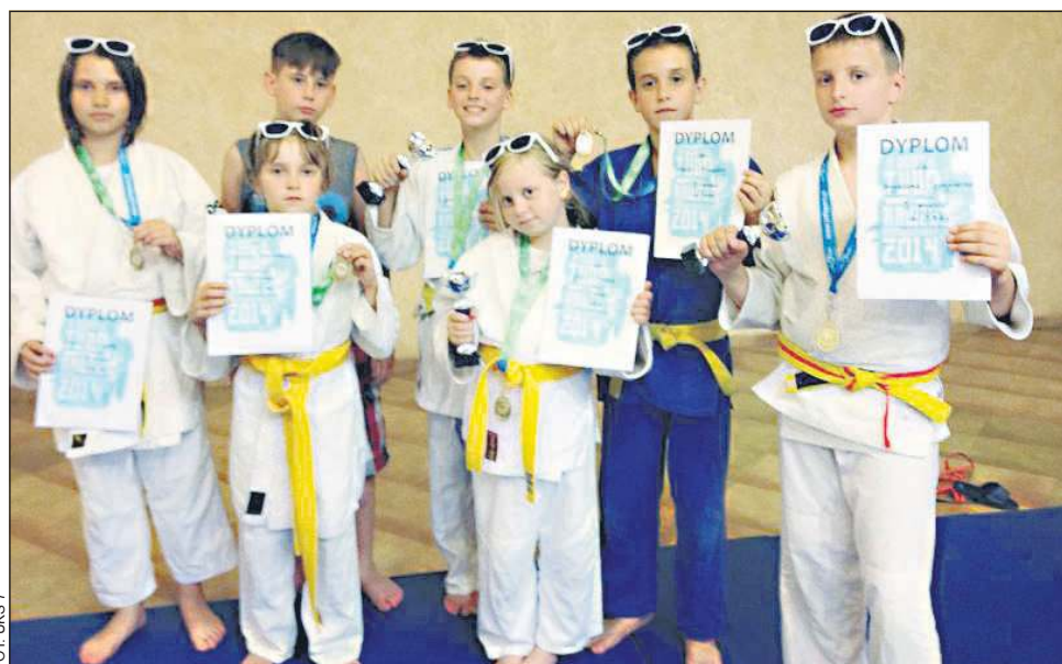
Młodzi adepti judo ze swoimi trofeami

UKS Siódemka był na obozie treningowym w Rawie Mazowieckiej. Zawodnicy trenowali na terenie Miejskiego Ośrodka Sportu i Rekreacji. Mieli do dyspozycji obiekty sportowe, basen, plażę oraz jezioro. Zajęcia odbywały się trzy razy dziennie, a w czasie wolnym młodzi sportowcy korzystali z kąpieliska, z basenu, uczestniczyli w konkursie „Mam talent”. Nie zabrakło również ogniska z pieczeniem kiełbasek a także odbyła się Olimpiada Obozowa w siedmiu konkurencjach: przeciąganie liny, skok w dal, rzut piłką lekarską, strzał do bramki,