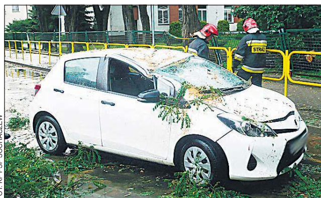
Właścicielka tego pojazdu miała dużo szczęścia

Silny wiatr powalił w sumie sześć drzew. Kilka kolejnych doszczętnie zniszczył, tak że będą nadawać się wyłącznie do wycinki. Najgroźniejsza sytuacja miała miejsce na ulicy Hanka Sawickiej, gdzie drzewo