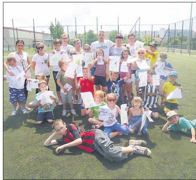
Dzieciaki z wielkim entuzjazmem uczestniczyły w zajęciach sportowych