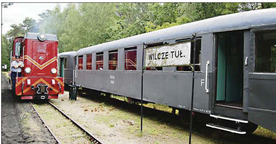
Ciuchcia znowu dojeżdża do Puszczy Kampinoskiej

Przed laty Kampinoski Park Narodowy udostępnił swoje miejsca kolejce wąskotorowej, teraz zaś jej muzealny skansen w Sochaczewie „zaprosił” Puszczę Kampinoską w swoje progi. Od sierpnia 2014 roku realizowane jest tu zadanie Infrastruktura terenowa służąca edukacji ekologicznej w Muzeum Kolei Wąskotorowej w Sochaczewie, pn. „Wąskotorówka do Puszczy”, dofinansowane z Wojewódz-