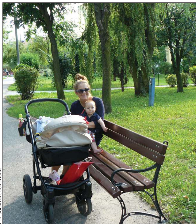
Już pierwszego dnia ławki znalazły amatorów odpoczynku

Już w ubiegłym roku interweniowaliśmy w sprawie braku ławek przy pasażu na osiedlu Żeromskiego. Dostawaliśmy wiele sygnałów od naszych czytelników o niedogodnościach wynikających z braku miejsc do odpoczynku w ciągu długiego pasażu. Jest to co prawda osiedlowa, ale niezwykle uczęszczana droga pomiędzy miejskim targowiskiem a dwiema przychodniami lekarskimi i aptekami. Starsze osoby, wracając do domów, często z zakupami, nie miały miejsca do chwili odpoczynku. Podobnie jak osoby chore idące do poradni zdrowia. Strudzeni przechodnie, aby chwilę odpocząć, zmuszeni byli do przysiadania na koszach na śmieci.