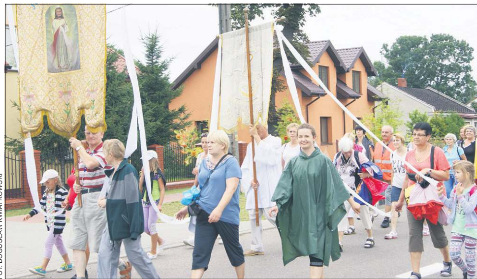
Pielgrzymowanie to trud, ale także ukojenie duszy

Sierpień to nie tylko miesiąc pielgrzymek, ale także okres naznaczony cezurą historii. 70 lat temu wybuchło powstanie warszawskie, które zebrało krwawe żniwa wśród mieszkańców stolicy. Przed 94 laty Polacy z księdzem Skorupką dzielnie stawiali opór bolszewickiej armii. Strajki na Wybrzeżu w 1980 roku przy-