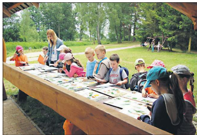
Dzieci mogą liczyć na wiele atrakcji

Projekt ten ma służyć przeprowadzaniu lekcji muzealnych lub innych zajęć w terenie oraz poruszać zagadnienia związane z wieloma tematami dotyczącymi ekologii i ochrony środowiska naturalnego na obszarze województwa mazowieckiego.