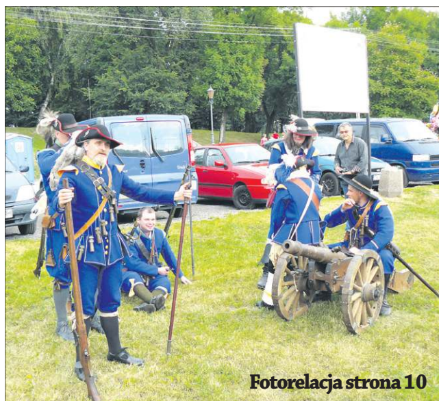
Fotorelacja strona 10