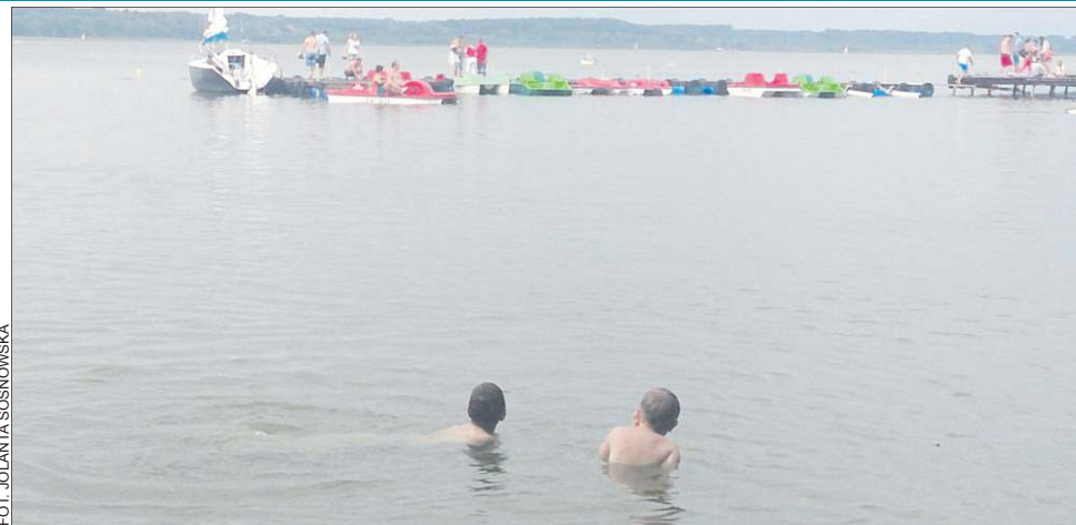
Dzieci nad wodą powinny być pod stałą opieką rodziców

Policja informuje, że w celu zapewnienia bezpieczeństwa w okresie wakacyjnym, na akwenach pełnią służbę policjanci z komórek patrolowo-interwencyjnych komend powiatowych i miejskich. Z kolei nad czystością kąpielisk nadzór sprawuje Wojewódzka Stacja Sanitarno-Epidemiologiczna w Warszawie. W 2013 roku służby sanitarne skontrolowały ponad