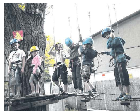
Wizyta w parku linowym