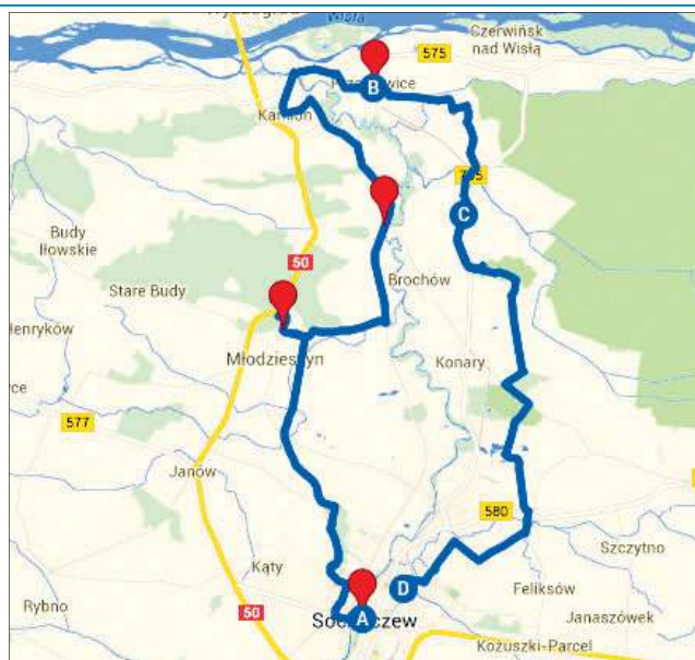
Trasa rajdu wiedzie przez malownicze tereny gminy Brochów

Tradycyjnie w połowie trasy uczestnicy zrobią dwugodzinną przerwę, rozpalą ognisko, upieką kiełbaski, będzie czas na grę w piłkę, wspólne rozmowy, sprawdzenie swej kondycji fizycznej na urządze-