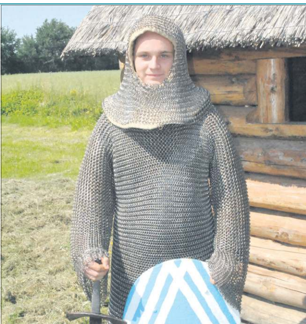
Replika średniowiecznego grodu czeka na gości w Nowym Białyninie