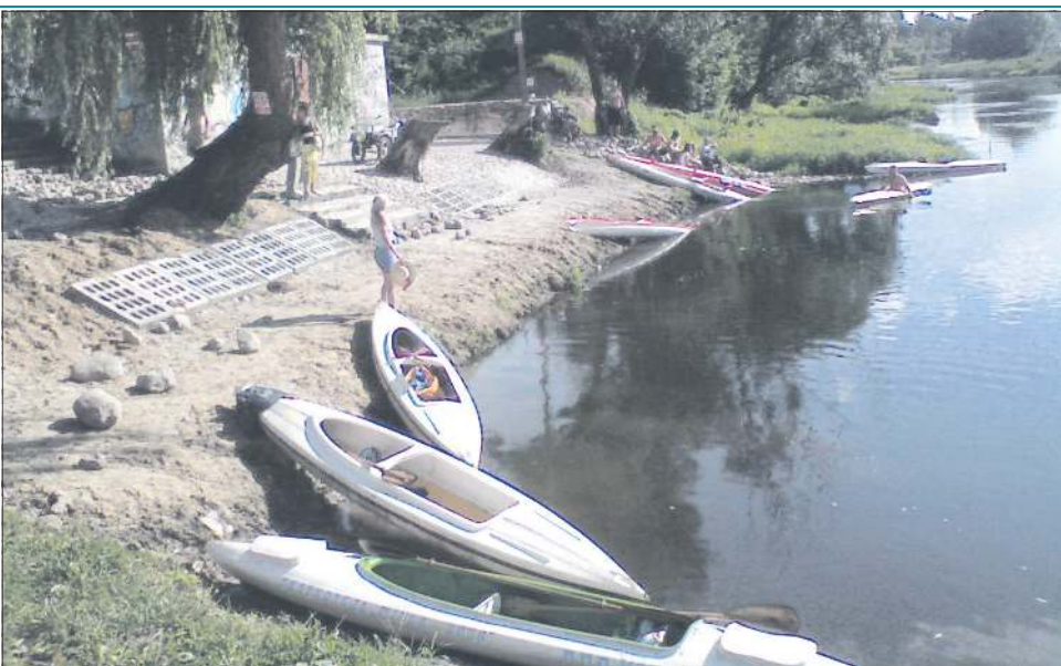
Kilka wniosków dotyczy zagospodarowania terenów nad Bzurą