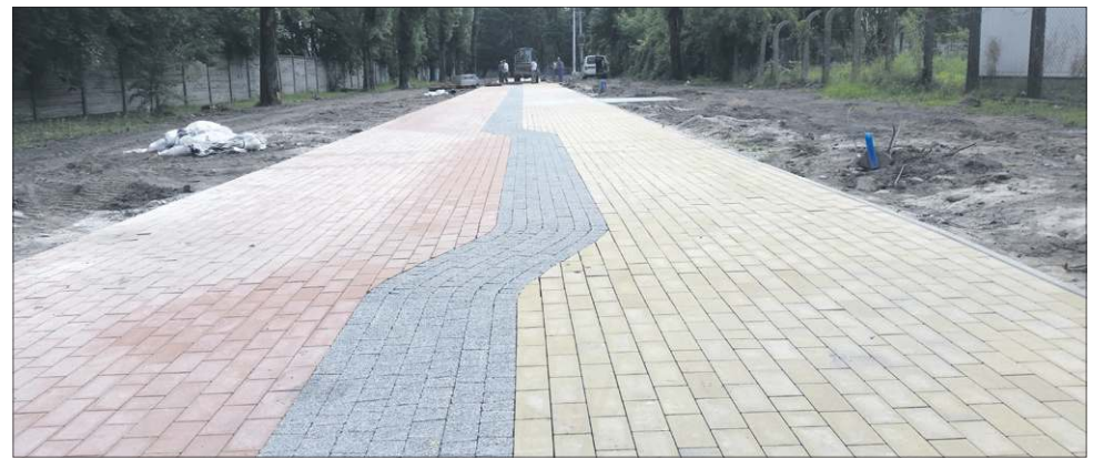
Kostka brukowa została ułożona już na połowie długości Pasażu Duplickiego

- Chodzi o rozbiórkę 300 metrów istniejącego płotu, montaż 650 metrów nowego, w tym trzech furtek i bramy wjaz-