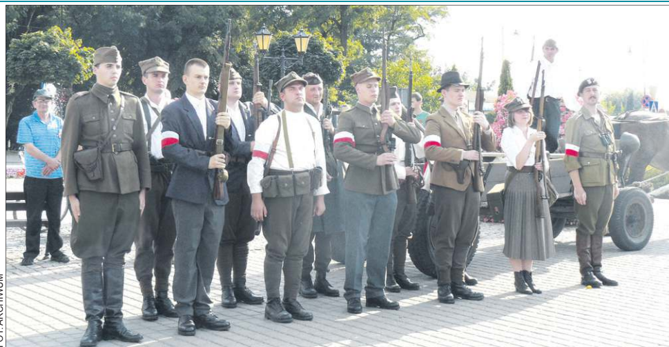
Rekonstruktorzy zaprezentują wymarsz sochaczewian do walczącej stolicy