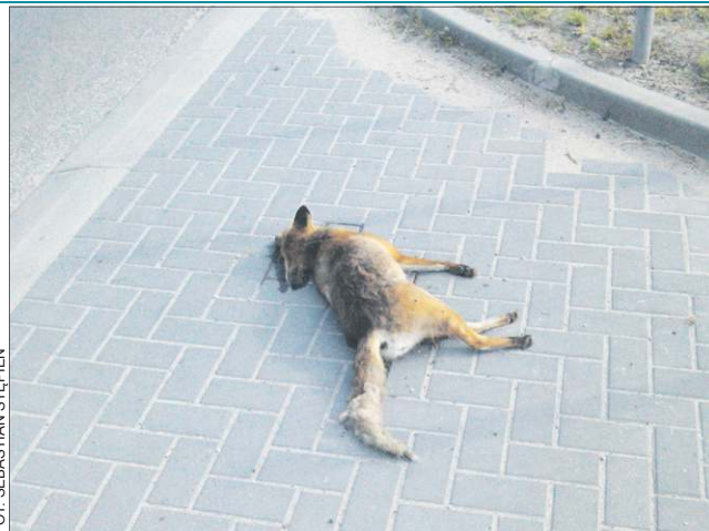
Ten lis przemykając ul. Kochanowskiego nie miał szczęścia

- W Polsce chronimy lisy starając się ochronić przed nimi