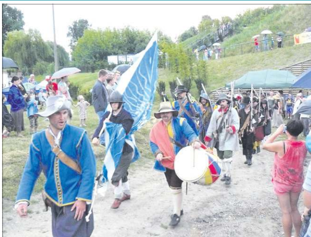
Scenka „Zaciąg do chorągwi” przeniosła zebranych w XVIII w.

Impreza została zorganizowana w ramach obchodów Sochaczewskiego Lata. Jej organizatorami byli: burmistrz, Muzeum Ziemi Sochaczewskiej i Pola Bitwy nad Bzurą oraz Muzealna Grupa Rekonstrukcji Historycznej im. II/18. pp.