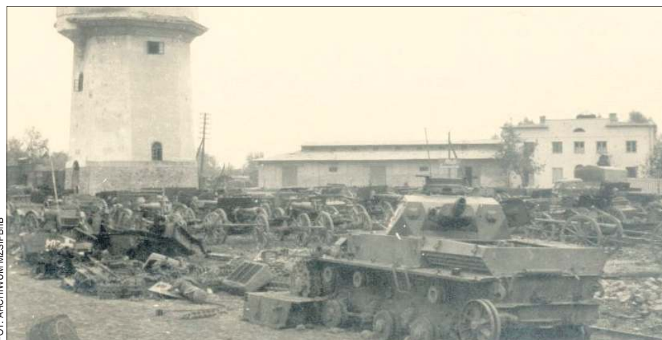
1939 r. Skład broni i sprzętu wojskowego przy wieży ciśnień

Wiceburmistrz zaznacza również, że rejon inwestycji jest dobrze strzeżony i stale nadzorowany przez wykonawcę.