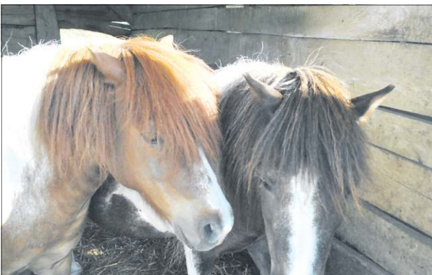
- Wystarczy kochać konie - mówią właściciele „Rancha Rumak”

1947 roku. „Kochaliśmy tę ziemię, dlatego zapragnęliśmy pokazać ją i udostępnić innym” - tak motywację narodzin gospodarstwa agroturystycznego tłumaczą gospodarze. Goście z całą pewnością nie nudzą się, mając do dyspozycji teren rekreacyjny o powierzchni 12 hektarów wraz z zabytkowym parkiem i trzema stawami. Można oddać się łowiectwu ryb bądź wy-