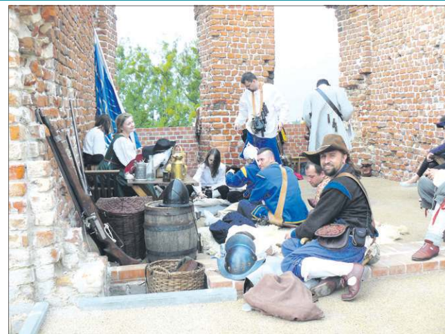
Rekonstruktorzy podczas przygotowań do pokazu