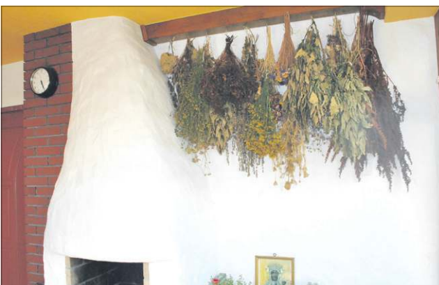
Własnoręcznie zbierane i suszone zioła są znakiem rozpoznawczym gospodarstwa państwa Fidrychów