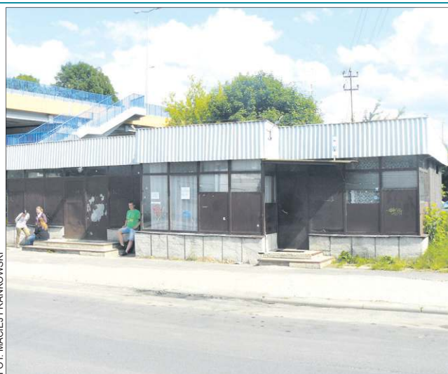
Pseudo dworzec nie spełnia podstawowych standardów

Osobowy transport samochodowy podlega starostwu powiatowemu. Po likwidacji sochaczewskiego PKS, został on wchłonięty przez prywatną spółkę PKS Grodzisk Mazowiecki, która obecnie realizuje ok. 80 proc. połączeń z terenu miasta. Oprócz niego, tylko trzej inni przewoźnicy (w tym jeden zatrzymujący się wyłącznie na