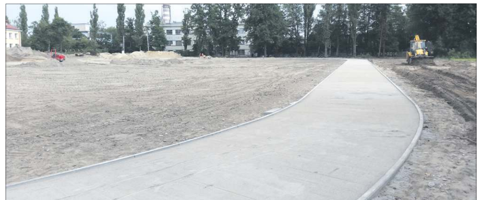
Bieżnia wokół boiska Zespołu Szkół w Chodakowie jest już prawie gotowa