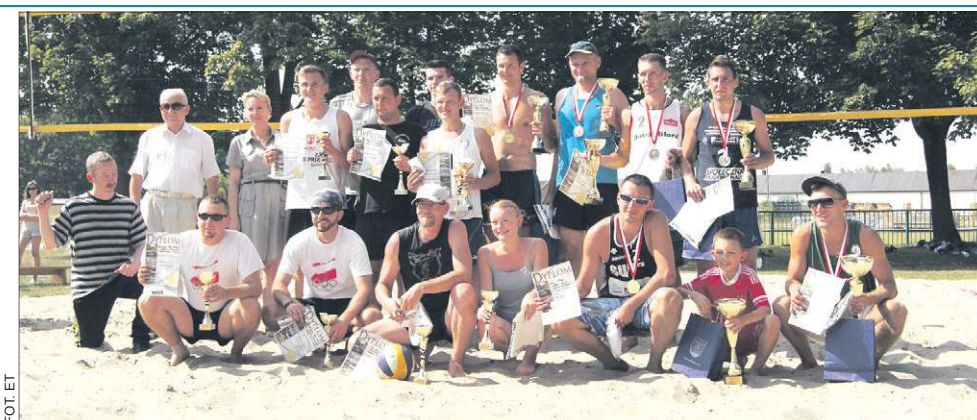
Wspólne zdjęcie uczestników turnieju finałowego