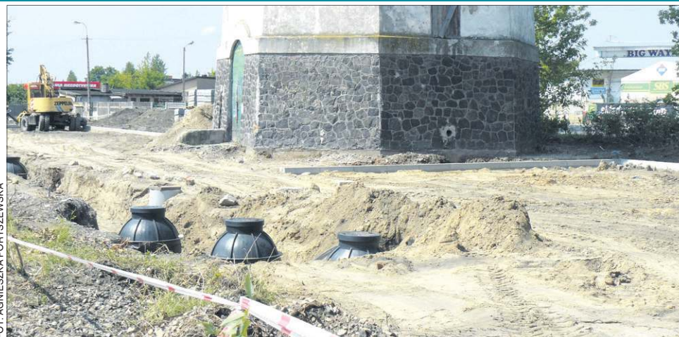
Do czasu zakończenia prac saperskich ZWK ma zakaz wykonywania jakichkolwiek wykopów

- Pomimo to nie spodziewamy się opóźnienia w oddaniu inwestycji do użytku. Termin jej realizacji wpływa pod koniec września i nie bierzemy pod uwagę jego przesunięcia - mówi Stanisław Wachowski. - Sprawa niewybuchów w żaden sposób nie zablokowała robót. Prace cały czas trwają. Mają one po prostu inny charakter. Obecnie dotyczą np. równania terenu.