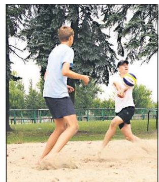
Młoda ekipa Trojanowa walczyła bardzo dzielnie