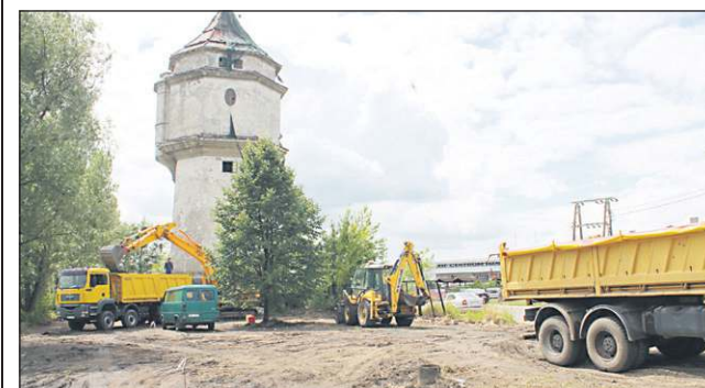
Parking ma powstać do końca września

Zgodnie z deklaracjami burmistrza, przy stacji PKP ruszyła właśnie budowa parkingu na 95 miejsc. Powstaje on w 100 proc. za pieniądze miasta i dla jego mieszkańców będzie bezpłatny. Na wszystkie prace wykonawca ma czas do końca września.