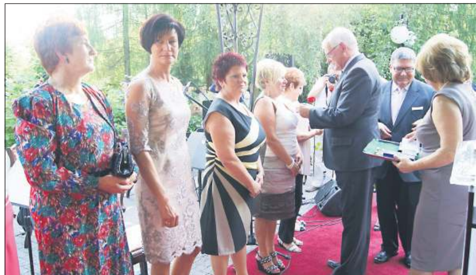
35 pracowników otrzymało resortowe odznaczenia

Te poważne refleksje szybko przyćmiła jednak atmosfera święta. Wyróżniającym się pracownikom wręczono odznaczenia Zasłużony Działacz Ruchu Spółdzielczego oraz Zasłużony dla „Społem”. Wręcza-