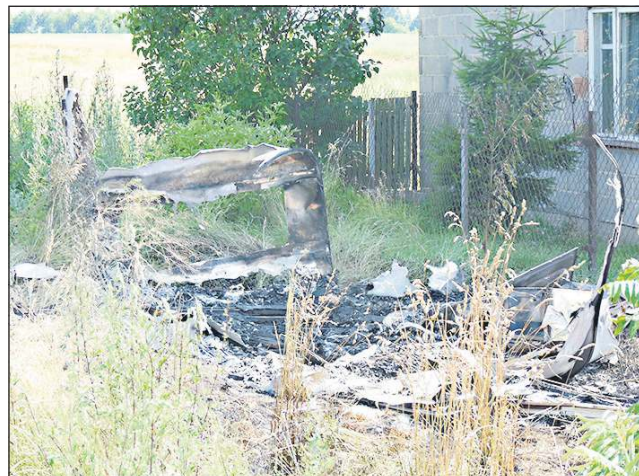
Z przyczepy kempingowej została jedna ściana

Podczas akcji gaśniczej strażacy odkryli zwłoki dziewczynki. Przybyły