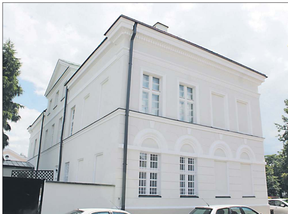
W ostatnich dniach zakończył się całkowity remont elewacji budynku muzeum

W 2012 roku kwotę 268 tys. zł wydano na drenaż