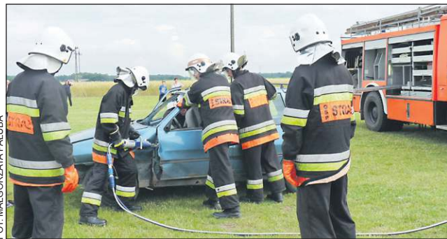
Ratownicza akcja strażaków była bacznie obserwowana

dzionej publiczności. W specjalną letnią atmosferę wprowadził wszystkich, jak zwykle, wspaniale prowadzący impre-