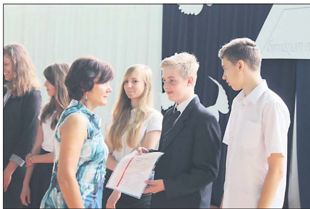
W Gimnazjum nr 1 test wypadł lepiej niż w zeszłym roku

Podczas trzydniowych zmagani uczniowie mieli do rozwiązania pięć (sześć w przypadku języka obcego rozszerzonego) arkuszy egzaminacyjnych. Pierwszego dnia odbyła się część humanistyczna, składająca się z języka polskiego oraz historii i wiedzy o społeczeństwie. Następnego dnia czekały ich kolejne dwa zestawy zadań, z matematyki i przedmiotów przyrodniczych (biologia,