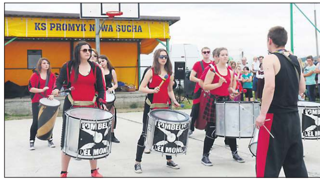
Występy L'ombelico del Mondo przyciągnęły tłumy

Nieco starsza grupa taneczna z Gminnego Ośrodka Kultury w Nowej Suchej zaprezentowała swoje umiejętności w breakdance, zbierając gromkie oklaski od zgroma-