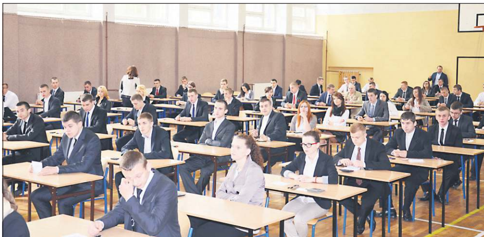
Co czwarty tegoroczny maturzysta nie zaliczył matematyki