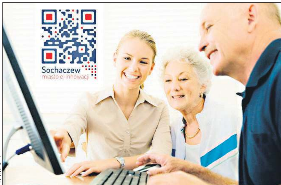
Większość seniorów chętnie uczy się korzystania z Internetu

Młode pokolenie uczy się obsługi komputera w szkole, w domu, w bibliotece. Bez lęku korzysta z serwisów społecznościowych czy bankowości elektronicznej. A co mają zrobić seniorzy, niepełnosprawni czy osoby niezamożne dokonujące wyboru między chlebem a rachunkiem za internet? Właśnie z myślą o grupach zagrożonych wykluczeniem cyfrowym powstał projekt „Sochaczew Miasto e-Innowacji”. Na budowę sieci dostarczającej sygnał internetowy do domów, zakup anten odbiorczych, 50 komputerów, wsparcie informatyka, sochaczewski ratusz pozyskał unijne dofinansowanie.