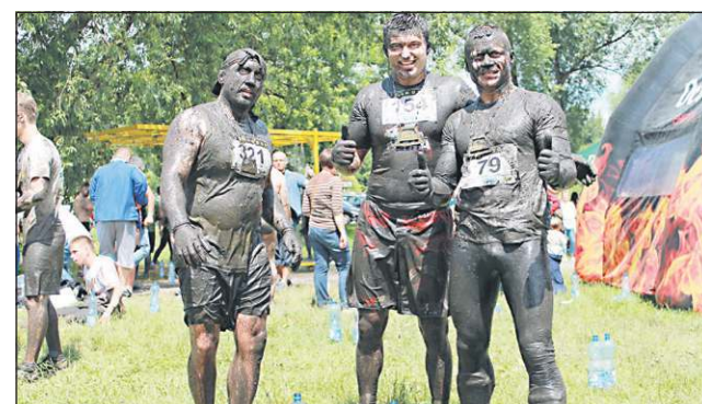
Tak wyglądali Dragoni po biegu