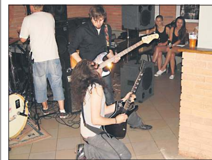
Dynamiczny występ grupy aCTAGGA

Sobotni wieczór w Pubie Piwnica stał pod znakiem ostrego grania.