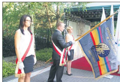
Sztandar PSS towarzyszył oficjalnej części uroczystości