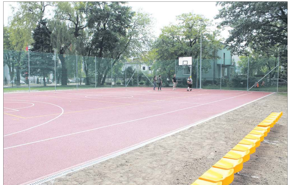
W tym tygodniu planowane jest oficjalne otwarcie boisk przy SP 2 w Boryszewie

Gardenia Sport buduje boiska od 15 lat. To jeden z liderów tej branży na polskim rynku. Spod jej rąk wyszło już ponad 700 tysięcy metrów kwadratowych nawierzchni syntetycznej. Rocznie buduje ok. 40-50 boisk. Kilka lat temu Gardenia projektowała - dla Sochaczewa - jedno z pierwszych w