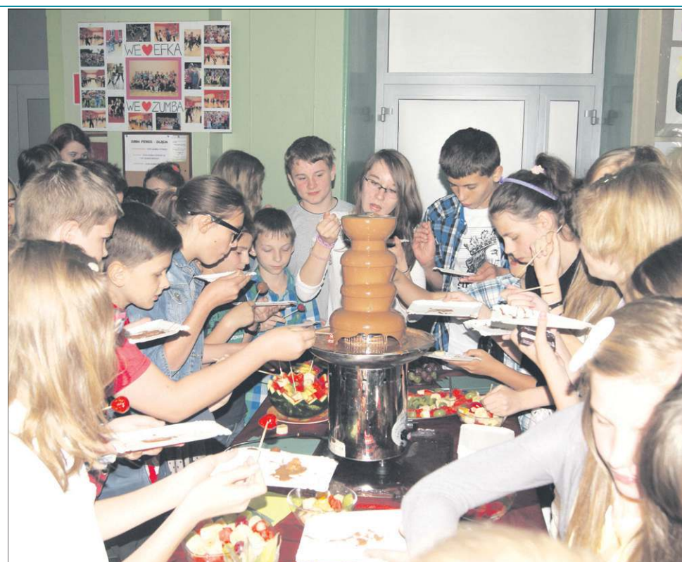
Prawdziwym hitem finału była czekoladowa fontanna