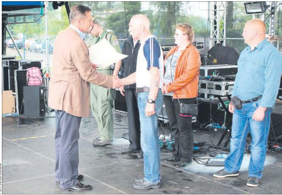
Burmistrz Osiecki składa podziękowania delegacji sochaczewskich krwiodawców

- Żeby zostać członkiem naszego klubu trze-