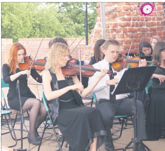
Muzycy Cameraty zaprezentowali się w bardzo różnorodnym repertuarze