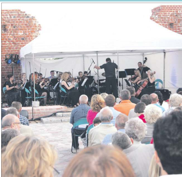
Nastrojowy klimat wzgórza zamkowego przyciągnął tłumy sochaczewian