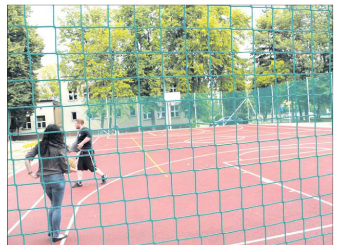
Już teraz korzystają z nich mieszkańcy dzielnicy

Przy „dwójce” powstało boisko wielofunkcyjne do koszykówki i piłki siatkowej o wymiarach 19,1m x 32,1m (pole do gry 15,1x28,1m). Obiekt jest oświetlony lampami umieszczonymi na 9-metrowych słupach (oświetlają też boisko do piłki nożnej i bieżnię, które będą budowa-