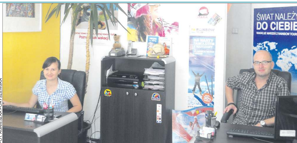
Klienci sochaczewskich biur najchętniej wyjeżdżają do Grecji, Turcji i Egiptu