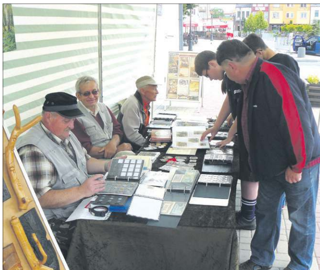
Już po raz jedenasty prezentował się Klub Kolekcjonerów