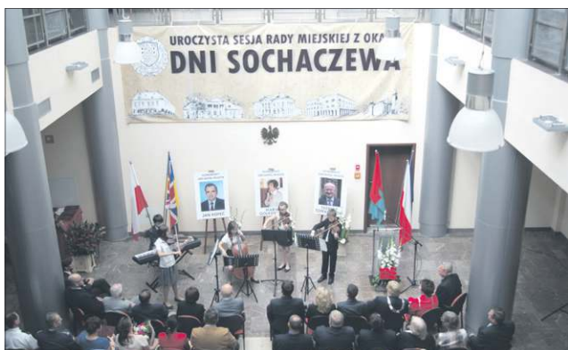
Sesję uświetnił występ uczniów szkoły muzycznej