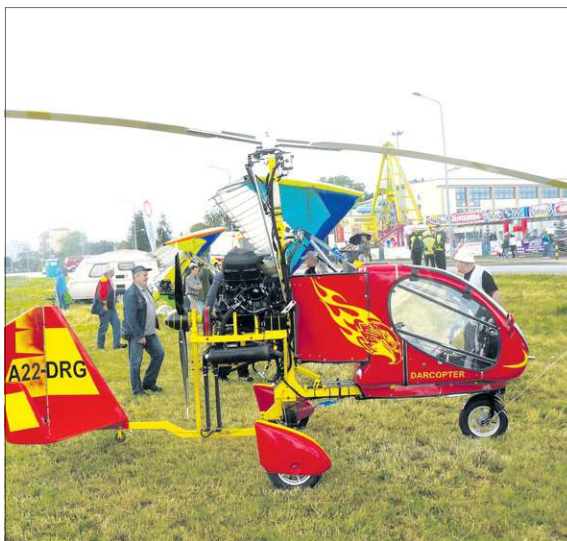
Po przerwie na pola czerwonkowskie wróciły mikrołoty