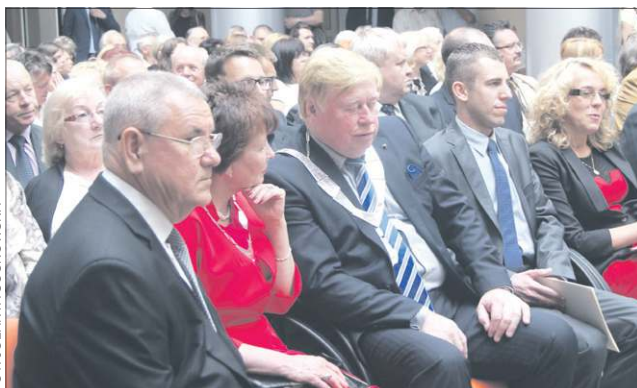
Goście z Gródka i Melton kolejny raz odwiedzili nasze miasto