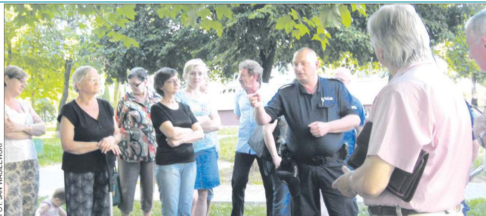
Mieszkańcy osiedla chcą jak najszybszego rozwiązania ich problemu

- Na osiedle przyjeżdżają wieczorami patrole policyjne, ale na widok migających świateł radiowozu pijacy rozchodzą się bądź uciekają, aby po odjeździe policji z powrotem się na ławce i dalej pić - dodała inna kobieta. - Chcemy, aby na osiedle za-