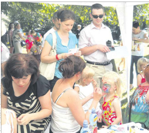
Rodzice wiernie kibicowali swoim pociechom

lii mieszczącej się w Gimnazjum nr 2. Wydarzeniu towarzyszyła aukcja prac wykonanych przez maluchy, loterie fantowe, wspólne grillowanie, gry, zabawy oraz hit ostatniego pikniku – malowanie twarzy. Każda z grup zaprezentowała się w programie artystycznym. Dobra zabawa to oczywiście główny cel imprezy. Przy okazji, zebrane podczas niej pieniądze, pozawalają przedszkolu na przeprowadzenie bieżących inwestycji. W latach poprzednich był to np. zakup kserokopiarki. (ap)