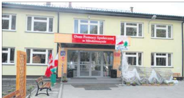
W murach ośrodka mogło dochodzić do licznych nadużyć