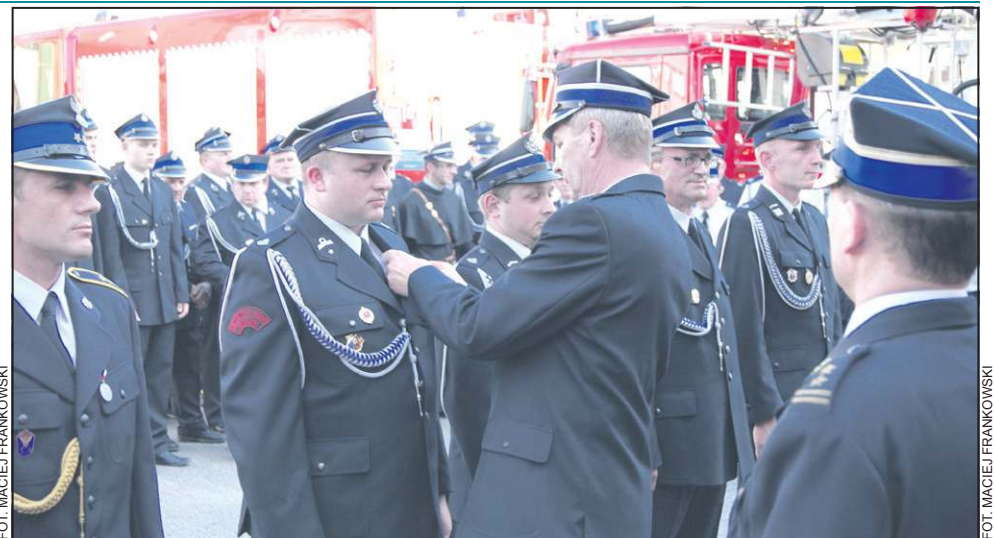
Dzień Strażaka to okazja do odznaczeń i awansów

- To właśnie wy stoicie na straży bezpieczeństwa mieszkańców. Udowodniliście to wyjeżdżając w ubiegłym roku do akcji 1283 razy. Dzie-