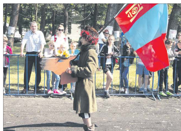
Szkoła reprezentująca Mongolię wygrała konkurs na najoryginalniejszy wygląd