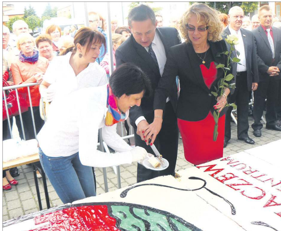
Mazurkiem częstowały władze Sochaczewa i goście z miast partnerskich