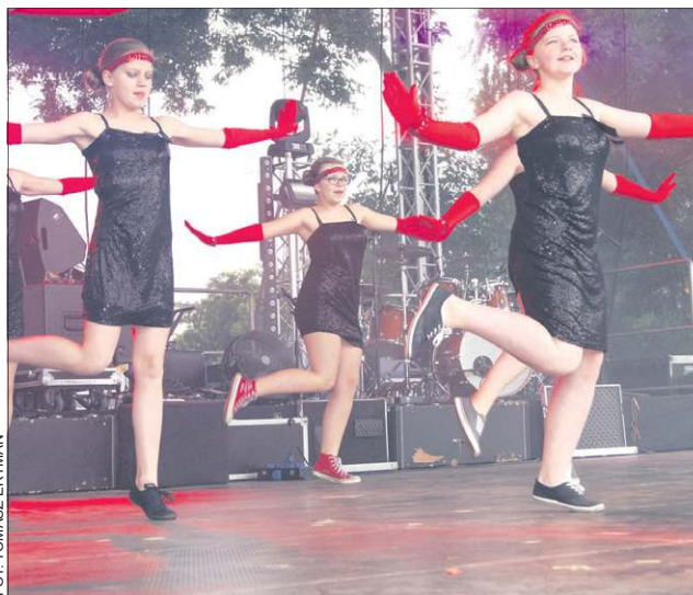
Występy dziewczyn z Abstraktu były bardzo atrakcyjne