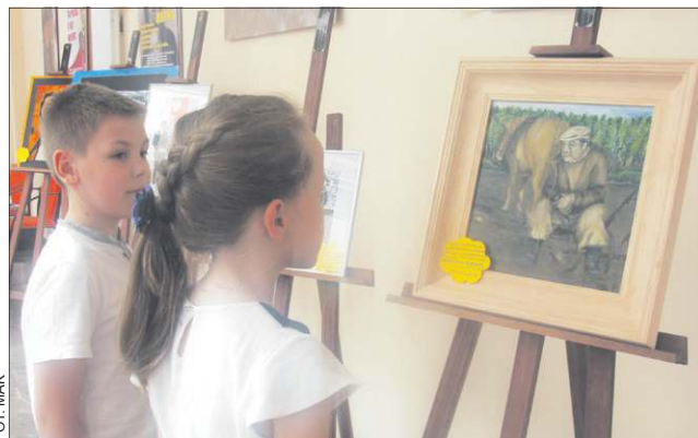
Prace konkursowe można oglądać w kramnicach

czak. Nie zabrakło również prac, w których artyści postanowili przedstawić własnego ojca czy polskiego rolnika. Na konkurs wpłynęło ponad trzysta prac wykonanych różnymi technikami a cały projekt powiązany był z IV Wydarzeniem Artystycznym „Kocham Polskę...” Władysław Ślewiński.