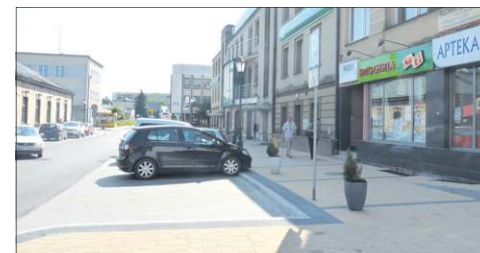
Nowy wygląd ul. Reymonta