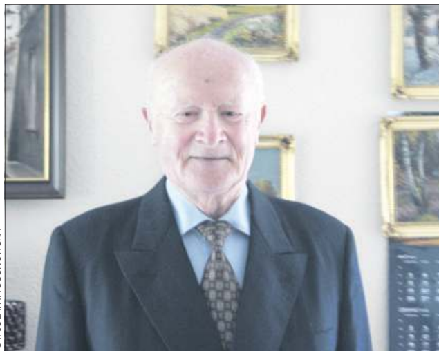
Czerwiec 2014. We własnym domu