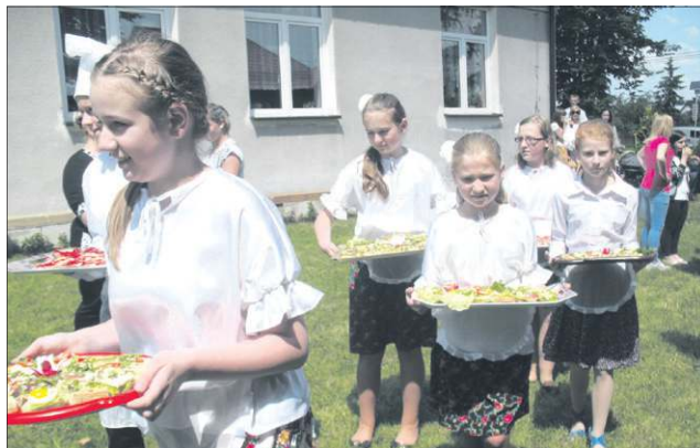
Zespół SP Giżyce w roli kelnerów

tetykiem, kosmologiem, kucharzem. Zainteresowani mogli zmierzyć ciśnienie krwi, dokonać pomiaru cukru, poznać wagę ciała, dowiedzieć się, jak prawidłowo dbać o zęby. Otrzymali „Receptę na zdrowie”, którą zespół uczniów specjalnie przygotował na tę okazję.