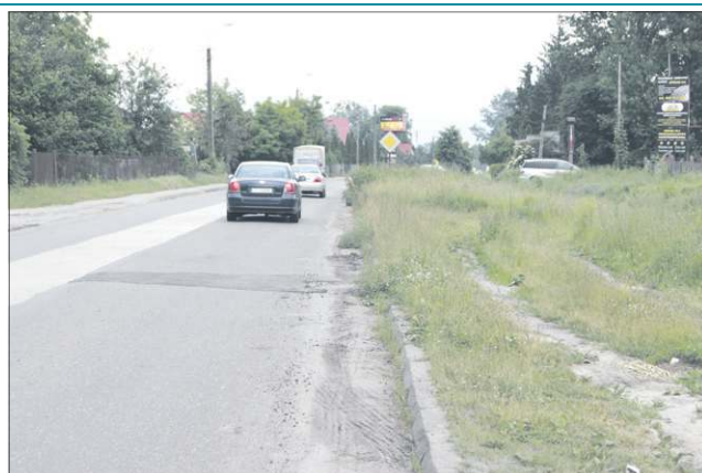
Ul. Wyszogrodzka w Chodakowie

Najgorzej sytuacja przedstawia się na ulicy Wyszogrodzkiej, gdzie piach na chodniku i jezdni pamięta jeszcze ubiegłoroczne jesienne ulewy, a przydrożna roślinność coraz bardziej ogranicza widoczność kierowcom. Niewiele lepiej jest na ulicach: Chodakowskiej, Chopina i al. 600-lecia, gdzie na niektórych odcinkach hałdy piachu sięgają wysokości krawężników.