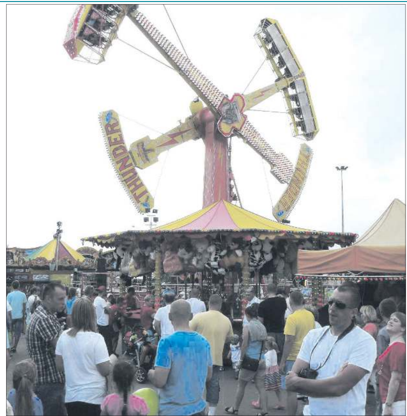
Co roku święto miasta gromadzi tłumy mieszkańców