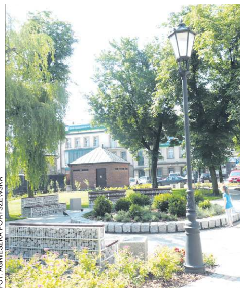
Ustawiono już ławki gabionowe