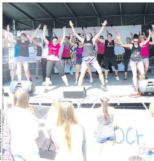
Na imprezie nie mogło zabraknąć Zumbi

W ciągu dnia na scenie można było podziwiać występy dziecięcych zespołów tanecznych i pokazy zumbi. Po godz. 18.00 scena należała do wykonawców disco-polo. Wystąpiły grupy: Sheyker, Freestyle, Atomic, Crazy Team i Progress. Konsolę obsługiwali DJe Żabson i Kubloss.