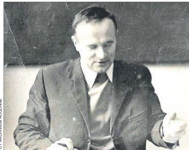
Przełom lat 60. i 70. W sali lekcyjnej „Chopina”

ne pamiętają, że nagrodą za dobre zachowanie było móc ponosić jego teczkę podczas przerwy”.