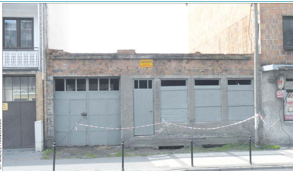
Kilka dni temu usunięto górną kondygnację, najbardziej zagrażającą przechodniom

Po latach bezskutecznych poszukiwań, w sierpniu 2013