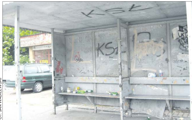
To, co znajduje się przy ul. Sienkiewicza trudno nazwać dworcem

Przystanki od paru lat odrapane, wokół nich pełno śmieci. Na ławkach wieczorami młodzież i smakosze tanich alkoholi urządzają sobie bufety. Pozostawiają po sobie nieposprzątane opakowania po napojach, słoiki po zakąskach i puste butelki.