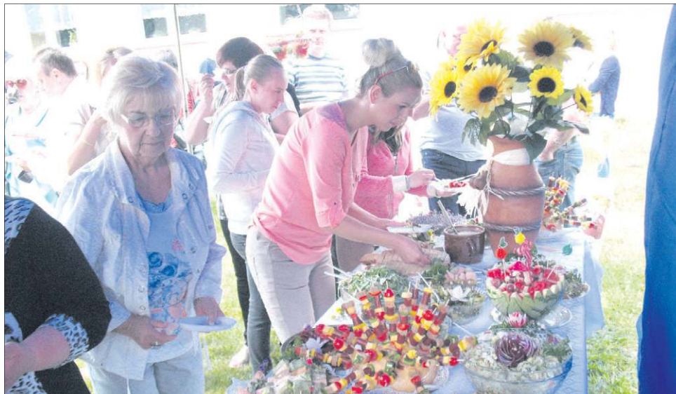
Jest w czym wybierać i pewnie nie uda się spróbować wszystkiego

Ważnym punktem festynu był zdrowy poczęstunek przygotowany z produktów ekologicznych i regionalnych oraz konkurs na „Zdrową potrawę”. Trzy najbardziej wartościowe dania nagrodzono książkami Grzegorza Łapanowskiego pt. „Smakuję”. W trakcie poczęstunku odbywały się konsultacje z lekarzem, pielęgniarką, die-