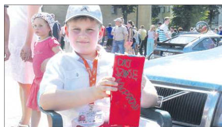
Festyn wsparło wielu uczniów