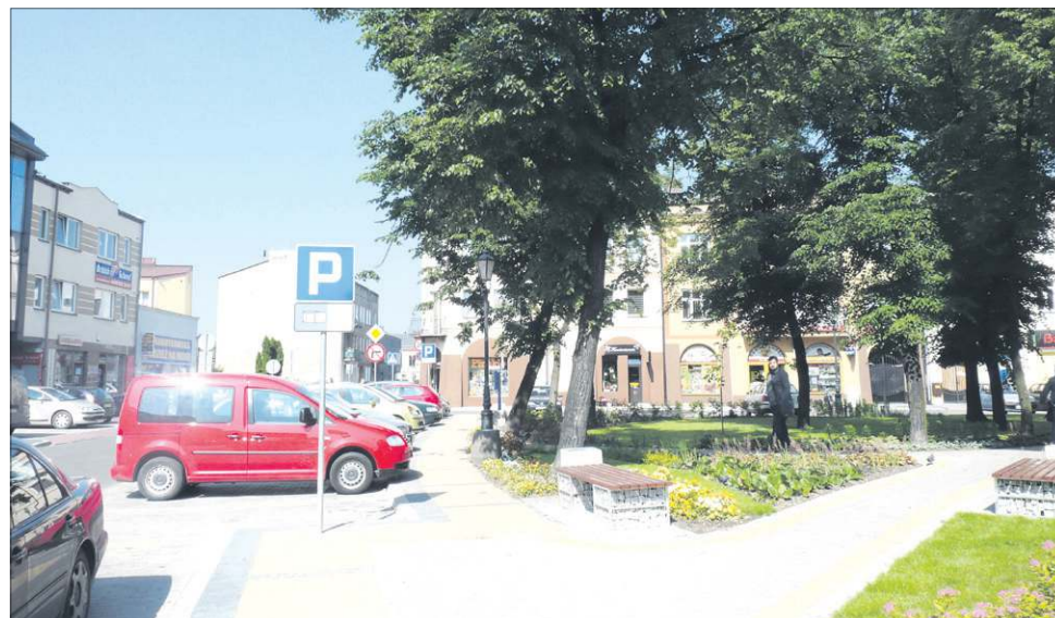
Ruch samochodowy w obrębie placu przebiega płynnie

- W najbliższym czasie nie przewidujemy uruchomienia strefy płatnego parkowania. Dopiero oddaliśmy nowe miejsca parkingowe i chcemy przede wszystkim przyjrzeć się, jak wygląda ruch samochodów w tym rejonie - powiedział nam. - Jesteśmy nadal zobowiązani uchwałą Rady Miasta poprzedniej kadencji, która mówi o wprowadzeniu Strefy Płatnego Parkowania w centrum Sochaczewa. Nie ma w niej jednak żadnej konkretnej daty, kiedy ma się to stać. Mogę więc zapewnić, że nie ma możliwości, by strefa ruszyła w tym roku.