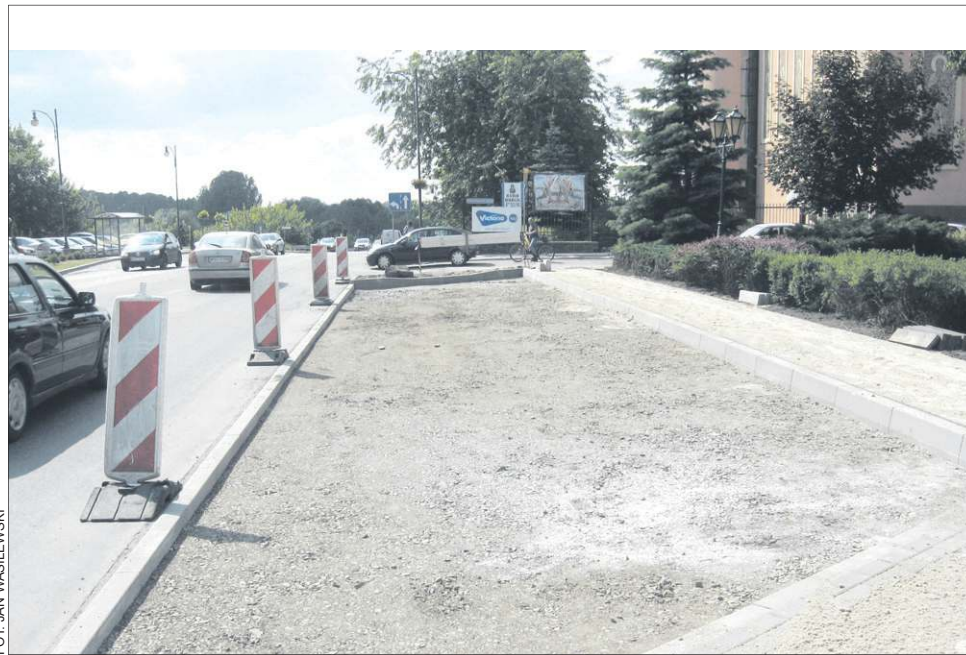
Osiem nowych miejsc parkingowych przybędzie w okolicy kościoła

Jak powiedział nam archeolog Tomasz Karolak, asystent muzealny Muzeum Ziemi Sochaczewskiej i Pola Bitwy nad Bzurą sprawujący nadzór archeologiczny nad inwestycją, prace badawcze miały niewielki zakres, toteż trwały tylko jeden dzień. Był to poniedziałek 2 czerwca. Okazało się, że są to