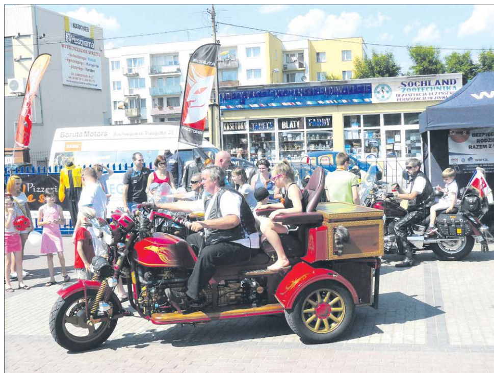
Największym powodzeniem cieszyły się pokazy motoryzacyjne