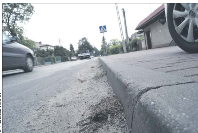
Ul. Chopina, Chodaków

- Wysyłanie pism do MZDW z prośbami o interwencje niczym nie skutkowało. Ostatnio jesteśmy z nimi w stałym kontakcie telefonicznym i staramy się współpracować jak tylko możemy. Wskazujemy konkretne miejsca wymagające prac porządkowych - zapchane studzienki kanalizacyjne, czy dziko rosnące pasy zieleni wymagające koszenia. Niestety, wiele rzeczy nie może czekać i, ze względu na estetykę i bezpieczeństwo mieszkańców, zmuszeni jesteśmy wykonywać je we własnym zakresie. Przykładowo, zainstalowaliśmy ostat-