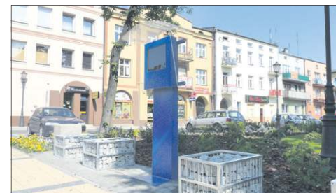
Infokiosk mylnie brany jest za parkomat