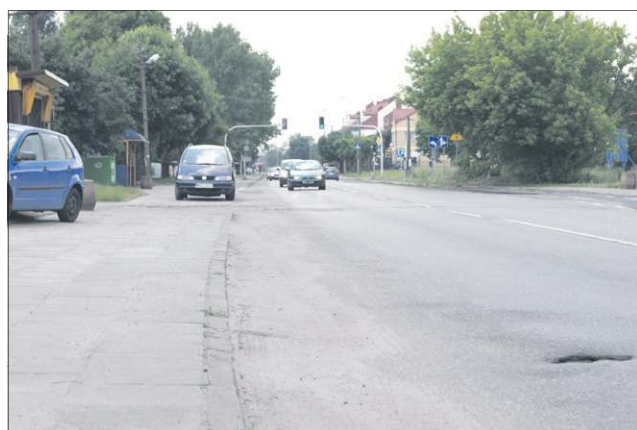
Ul. 600-lecia w centrum