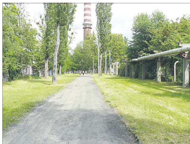
Miejsce żużlu w tzw „alejkach” zastąpi deptak z prawdziwego zdarzenia

Prace na parkingu przy dworcu pochłoną 890.000 zł. Reszta zabezpieczonej kwoty zostanie przeznaczona na wykupienie od PKP terenu, na którym realizowana jest inwestycja. Zgodnie z założeniami