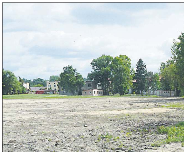
Teren przy Zespole Szkół w Chodakowie został przygotowany pod inwestycję

parking będzie bezpłatny. Przepomnijmy, że w założeniach inwestycja miała być realizowana wspólnie z samorządem województwa mazowieckiego. Wo-