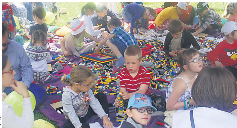
Super klocki Lego w parku w Żelazowej Woli

preza z okazji 200. rocznicy urodzin Oskara Kolberga, ojca polskiej etnografii i chopinologa. Był to już piąty piknik Narodowego Instytutu Fryderyka Chopina, który odbywał się tam z okazji Dnia Dziecka. Tym razem jego motywem przewodnim była kultura i sztuka ludowa.