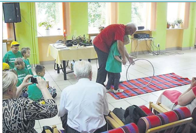
Podczas Majówki Seniora najmłodsi mieli okazję zobaczyć, jak bawili się ich dziadkowie

Dzieciaki otrzymały także zabawki wykonane metodą sprzed dziesięć lat - lalki i piłki. Były nawet gotowe przyznać, że szmaciane lalki są lepsze od Barbie. Odbyła się także prezentacja biega-