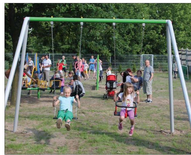
Nowy plac zabaw przy ulicy Fabrycznej

- Na koniec tej rozmowy obiecaliśmy sobie jedno, że miasto znajdzie odpowiedni teren i zbuduje plac, ale w zamian mamy na otwarcie upieką ciasto. My słowa dotrzyaliśmy i, jak widać, mamy także. Chciałbym wyraźnie zaznaczyć, co ten plac zabaw ma pokazać, że nie ma mieszkańców Sochaczewa bardziej i mniej ważnych. Przede wszystkim nie ma dzieci mniej ważnych. Wszystkie maluchy są mieszkańcami Sochaczewa i będą trak-