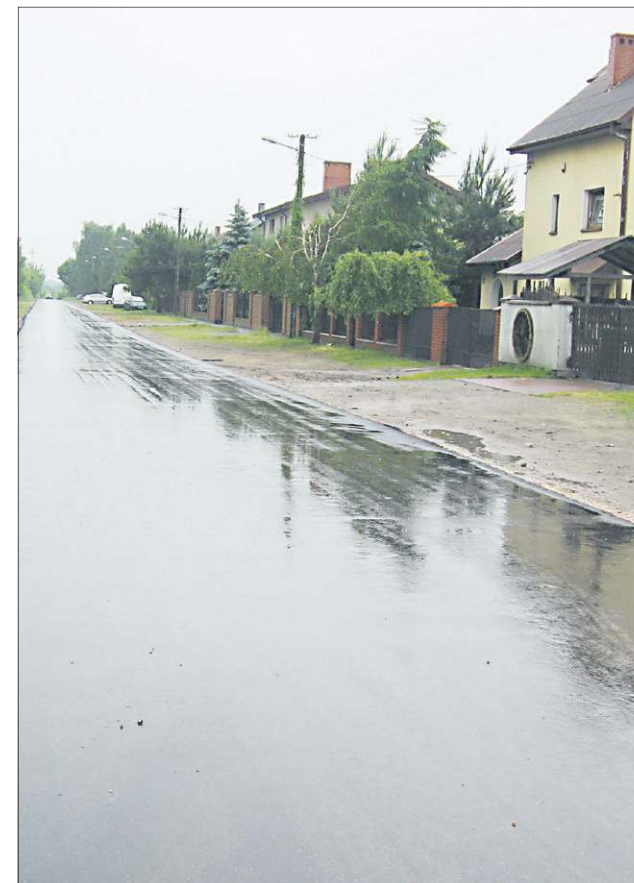
Kilka dni temu poprawił się komfort jazdy mieszkańcom ulicy Karwowskiej

Nową nawierzchnię o grubości 5 cm i szerokości 5 metrów na 406 metrach wykonała firma Prima. Być może wykonanie nakładki asfaltowej na Karwowskiej i połączenie jej z ulicami Lazurową i Rumiankową, będzie dla ZKM impulsem do uruchomienia linii autobusowej na osiedle Karwowo. (jw)