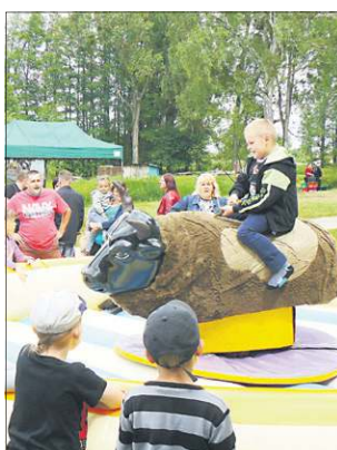
Jedną z najbardziej obleganych atrakcji było rodeo

dwóch lat festyn jest inicjatywą całej rady gminy Brochów. Być może dlatego cieszy się coraz większym zainteresowaniem mieszkańców, którzy przybyli jeszcze liczniej niż w latach ubiegłych. Dla nikogo jednak nie zabrakło atrakcji. Poza modną ostatnio dmuchaną zjeżdźalnią i bykiem rodeo, odbyły się pokazy strażackie i liczne konkursy z nagrodami. Na chętnych czekały grillowane kiełbaski, napoje