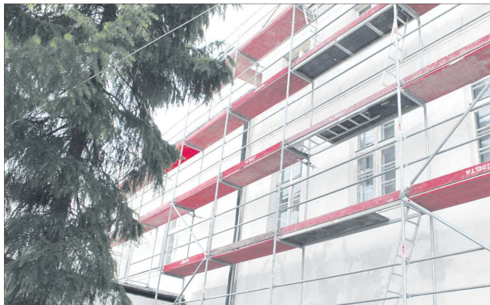
To już ostatni etap remontu zewnętrznej części budynku muzeum

Od kilku tygodni przeprowadzany jest przez firmę Hamilton z Warszawy trzeci i zarazem ostatni etap remontu Muzeum Ziemi Sochaczewskiej i Pola Bitwy nad Bzurą, który obejmuje termomodernizację zachodniej i północnej części budynku.