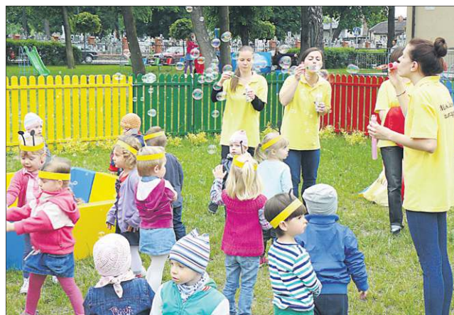
Pogoń za mydlanymi bańkami to tylko jedna z wielu przygotowanych atrakcji

nia za ramą od koła roweru i konstrukcji procy. Z kolei młodzież z Gimnazjum nr 2 zaprezentowała program z piosenkami. Wspólna zabawa, tańce i śpiewy trwały długo, a na koniec na zebranych czekał pyszny posiłek.