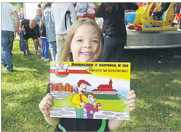
Ratusz przygotował dla dzieci specjalną kolorowanekę edukacyjną