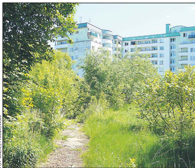
Na razie teren, na którym ma stanąć komenda porastają wysokie chaszczy

- Jako Urząd Wojewódzki nie prowadzimy tej inwestycji. Leży ona w gestii Komendy Głównej Policji, więc nie możemy mieć zabezpieczonych