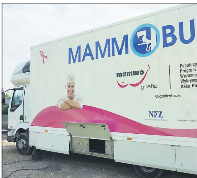
Urząd przyjmuje zgłoszenia do 23 maja

- Nic nie wskazuje na to, by w kolejnych latach „czwórka” traciła uczniów. Przeciwnie, będzie ich przybywało choćby z powodu skierowania do klas pierwszych dzieci sześciolatków. Szkoła potrzebuje dużej sali na lekcje wf-u, przedstawienia i apele, z widownią na 150 miejsc i z dużym par-