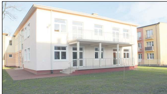
Oddany na początku roku budynek żłobka