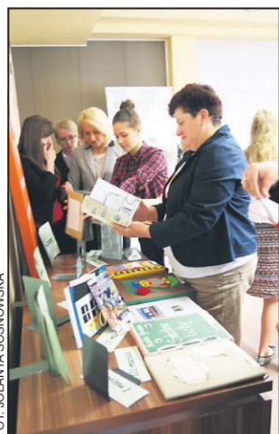
Na konkurs wpłynęły 54 prace