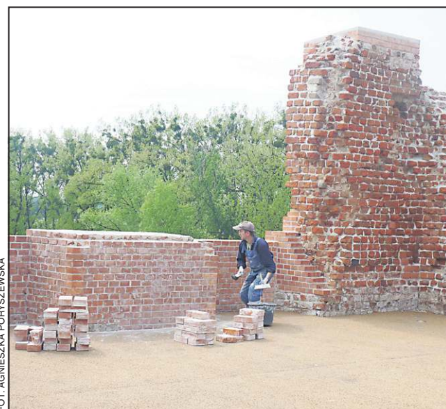
Ekipa remontowa musi zdjąć każdą odspojoną cegłę i oczyścić mur

Program emitowany jest co tydzień w Polsat News. (s)