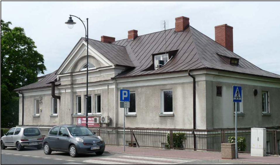
Restrukturyzacja laboratoriów na Mazowszu nastąpić ma w 2015 roku

Fakty są jednak takie, że na budżet każdej stacji pracują głównie laboratoria, które, oprócz działalności statutowej, wykonują usługi dla klientów zewnętrznych. Przepływ pieniędzy między budżetem a sanepidem jest co najmniej ku-