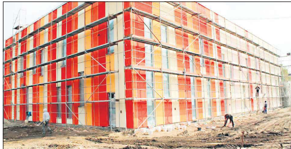
Sala gimnastyczna przy SP 4 w budowie

Odwodnienie terenu Szkoły Podstawowej nr 2 to tylko jeden z wielu projektów inwestycyjnych realizowanych w tym i poprzednich latach w obiektach oświaty. W tej chwili za 90 tys. zł remontowany jest dach sali gimnastycznej przy Gimnazjum nr 2. Prace mają się zakończyć do 30 czerwca. Co istotne, od 2011 roku na budowę sali sportowej, żłobka, placów zabaw, remonty centralnego ogrzewania, dachów i ocieplenia gmachów oświaty ratusz wydał ponad 9 mln złotych, a do końca tego roku kwota ta wzrośnie do około 11 milionów złotych!