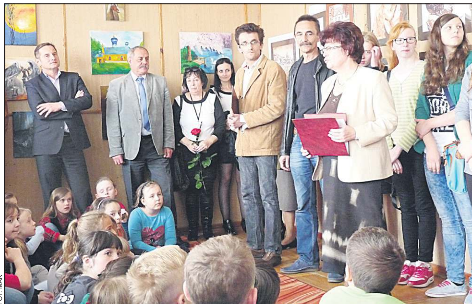
Wernisaż wystawy zgromadził tłumy gości

– Na wystawie zaprezentowany został dorobek ostatnich trzech lat pracy koła plastycznego działającego w Gimnazjum nr 2. Warto podkreślić, iż uczniowie w tych latach zdobyli wiele nagród i wyróżnień w różnorodnych konkursach plastycznych oraz fotograficznych na szczeblu nie tylko powiatowym czy ogólnopolskim, ale także międzynarodowym. Prace zostały wykonane przez