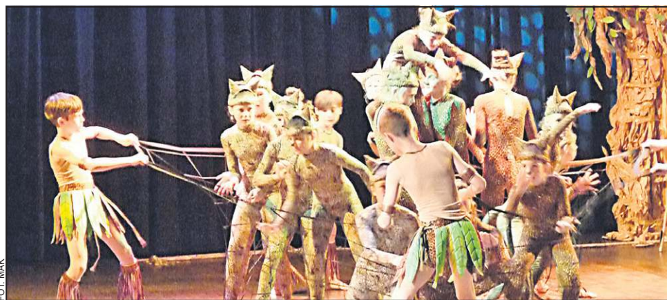
Na scenie MOK zaprezentowało się blisko 200 tancerzy

Do mrocznego świata, pełnego magii i sekretów, okraszonego lekką nutką ironii oraz humoru, zabrali nas w sobotni wieczór tancerze zespołu Abstrakt z Miejskiego Ośrodka Kultury w Chodakowie. Taneczne show, jak mógłby sugerować tytuł ponadczasowego dzieła C.S. Lewisa, nie było jego wiernym odtworzeniem, a