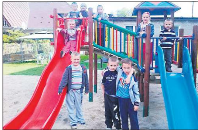
Plac zabaw przy „czwórce”

- Na jego budowę zdobyliśmy już trzy dotacje z programu MALUCH, prowadzonego przez Ministerstwo Pracy i Polityki Społecznej - dwukrotnie na budowę (łącznie 2 mln zł), a w ostatnich dniach dodatkowe 752 tys. zł na bieżące