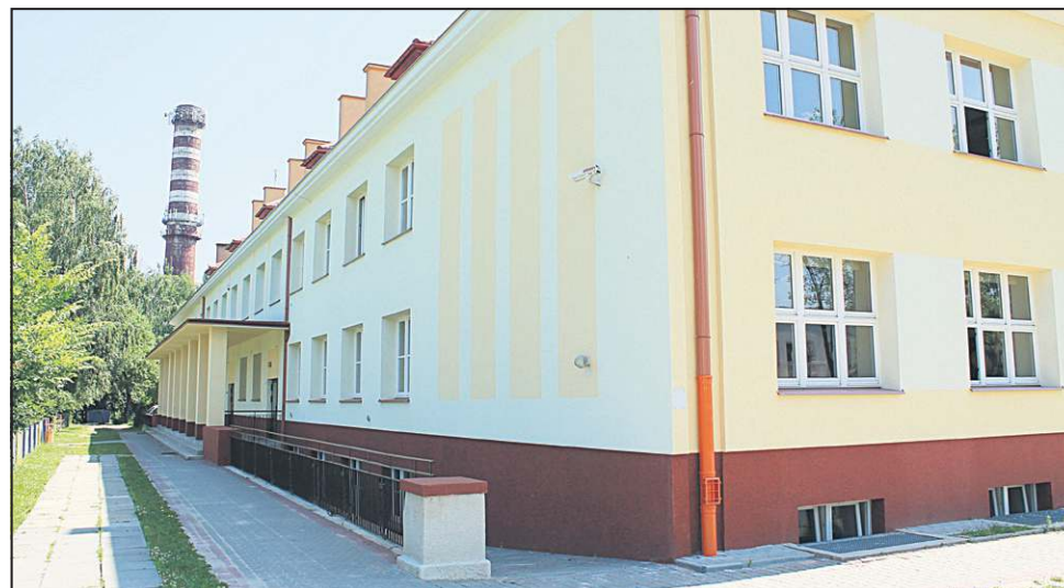
Przedszkole nr 6 po termomodernizacji