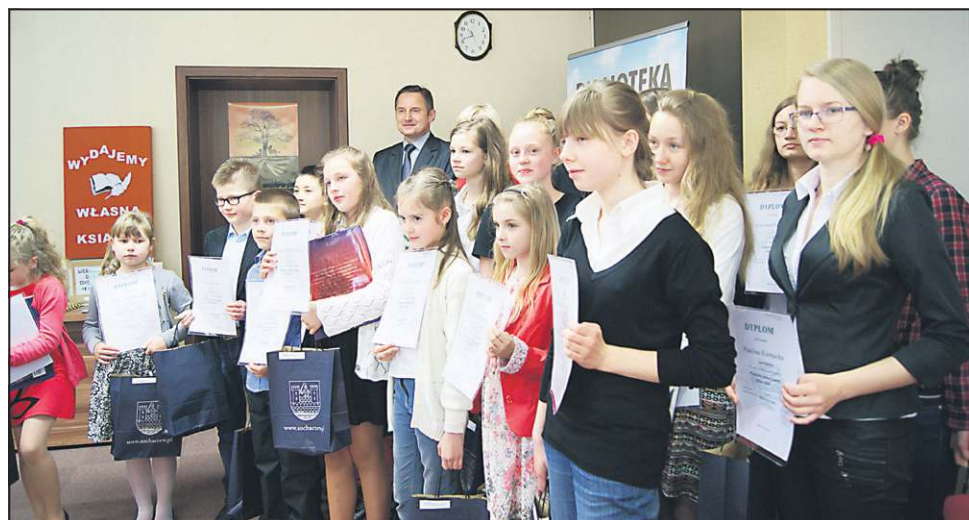
Laureaci konkursu na wspólnym zdjęciu z burmistrzem

Konkurs „Wydajemy własną książkę” w tym roku odbywał się pod hasłem „Moja szkoła”. Nic więc dziwnego, że do organizatorów wpłynęły 54 prace z całego powiatu sochaczewskiego. Uczestnicy konkursu przedstawiali swoje placówki w różnym ujęciu (hi-