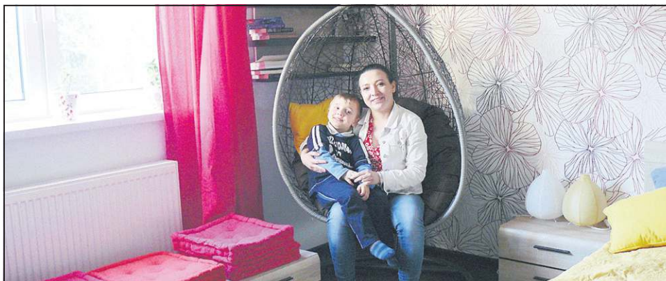
Gdyby nie pomoc Polsatu remont ciągnąłby się latami