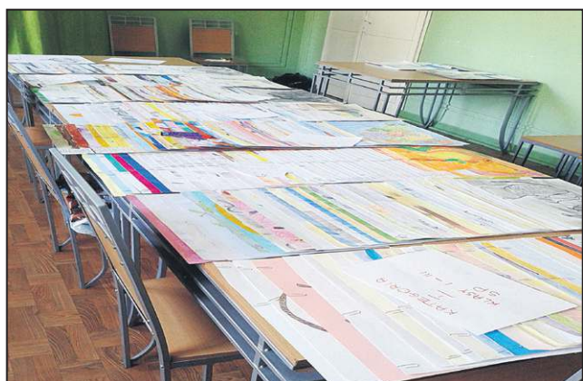
Na konkurs wpłynęły prace z całej Polski

Na uroczyste otwarcie wystawy połączone z warsztatami rysunku oraz wręczeniem nagród zapraszamy 24 kwietnia o godzinie 10:00 do Miejskiego Ośrodka Kultury w Sochaczewie filia Boryszew przy ul. 15 Sierpnia 83.