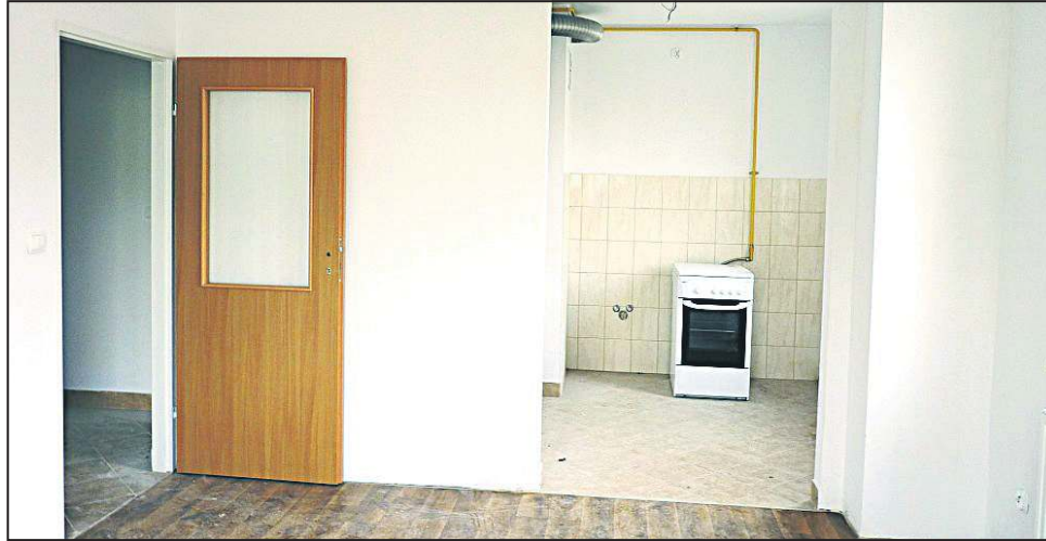
Wnętrze jednego z lokali przy ulicy Fabrycznej

Na sesji usłyszeliśmy, że w przypadku 28 budynków stanowiących w 100 proc. własność gminy, nie można mówić o tym, że znajdują się one w stanie, który może zagrażać zamieszkującym w nim rodzinom. Co więcej, pięć z nich znajduje się w stanie dobrym.