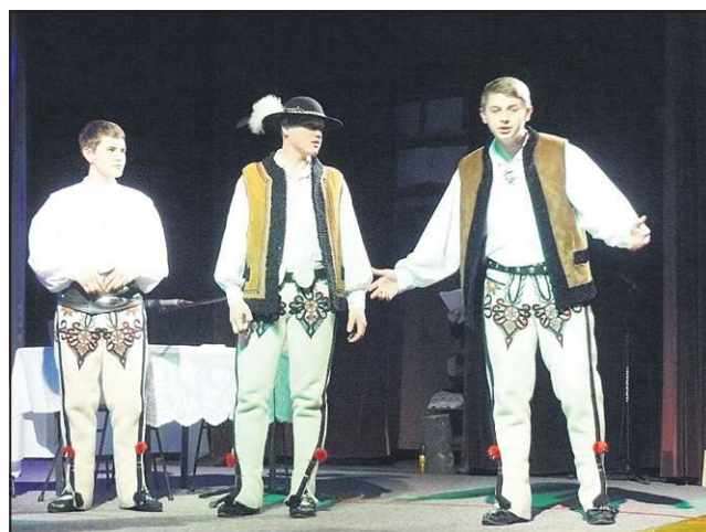
Młodzi aktorzy pokazali nasze kardynalne grzechy m. in. pychę i chciwość

Wiele było w tym programie odniesień do Boga, ale takich ludzkich, sztych na miarę naszych potrzeb i możliwości, jak choćby ta ważna kwestia, że „Każdy sobie robi Boga na swo-