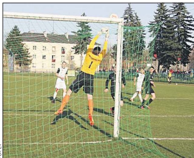
Piłkarze Bzury nie wykorzystali kilku dobrych sytuacji

Po przerwie z naszych piłkarzy zeszło powietrze i goście przejęli inicjatywę. Ukoronowali ją w końcówce meczu doprowadzając do remis. Po raz kolejny okazało się, że Bzura jest słabo przygotowana do sezonu i dopóki piłkarze tej drużyny będą rozmieniać się w ligach halowych, nie ma co liczyć na ich dobrą grę na boiskach tra-