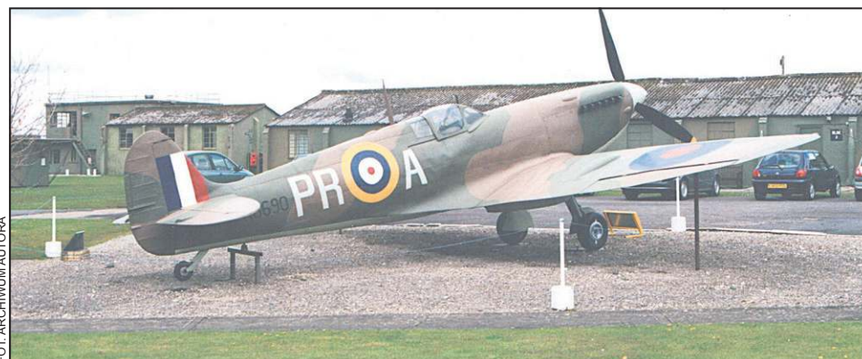
Angielskie i amerykańskie samoloty wysyłane nad III Rzeszę paraliżują niemiecką gospodarkę, przemysł i duże miasta