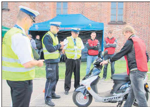
W turnieju trzeba wykazać się w różnych dziedzinach

20 lutego 2014 roku odbyło się posiedzenie Wojewódzkiego Komitetu Organizacyjnego Turniejów BRD i MTM, na którym zostały ustalone termi-