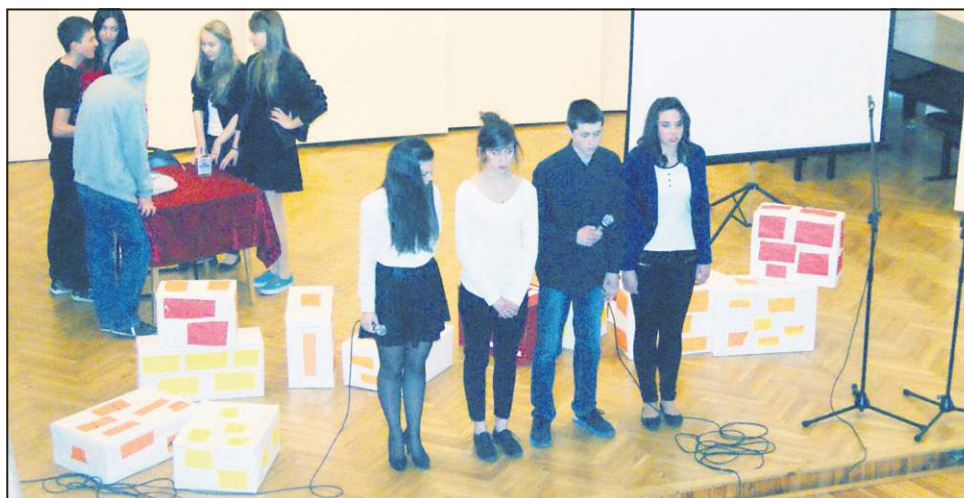
Prezentowanie z uczniami Gimnazjum nr 2 w rolach głównych