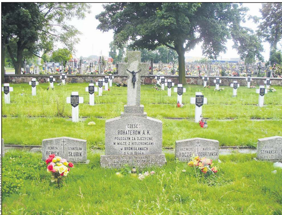
Mogiły poległych w Bronisławach na cmentarzu w Trojanowie

Usiłowania bandytów wykorzystania ostatniej nie pokrytej ogniem drogi ucieczki zostały natychmiast przez Pönischa rozpoznane i poprzez odpowiednie przegrupowanie, zamknięto tę drogę ogniem. Kiedy dojrzał w bezpośredniej bliskości domu, z którego grzmiała strzelanina, leżącego rannego i bezradnego żandarma, na którym zaczął palić się mundur - dotarł pod nieprzyjacielskim ogniem z jednym tylko towarzyszem do tego miejsca, chroniąc rannego kolegę. W końcu udało mu się zbliżyć do domu broniącego jeszcze przez ostatnich przy-