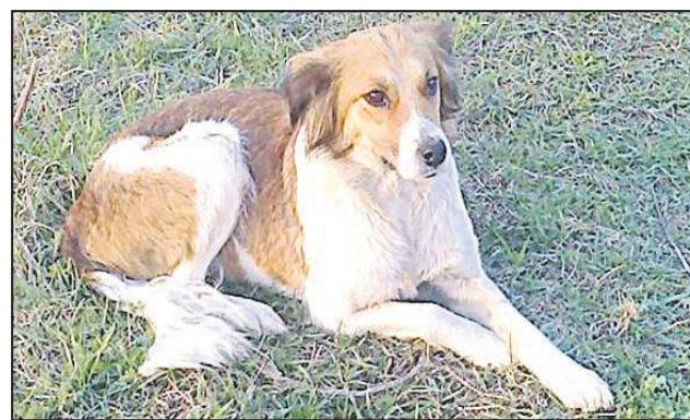
Psy są do siebie bardzo podobne