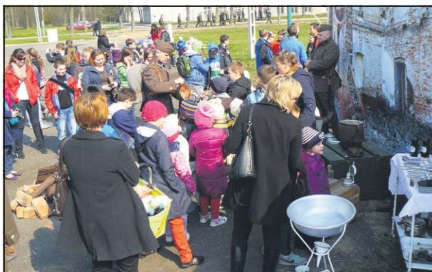
Wojskowa grochówka znalazła wielu amatorów

Po złożeniu meldunku przez dowódcę dywizjonu, przeglądzie pododdziałów i pokazie musztry, dowodzenie nad uroczystością przejął szef