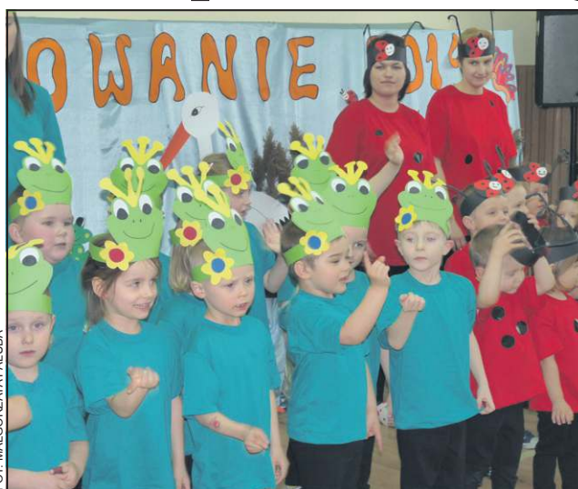
Przedszkolaki w swoim pierwszym publicznym występie

- Drodzy rodzice, życzę wam, abyście z pełnym zaufaniem przyprowadzali tu-