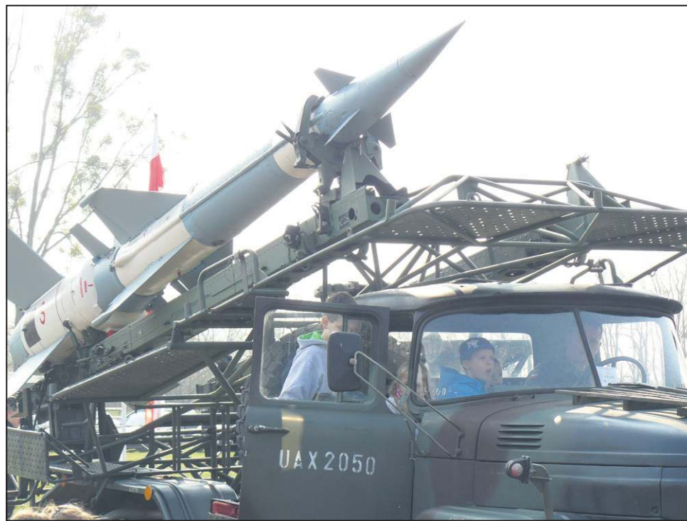
Usiąść za kierownicą takiego wozu to niezapomniane przeżycie