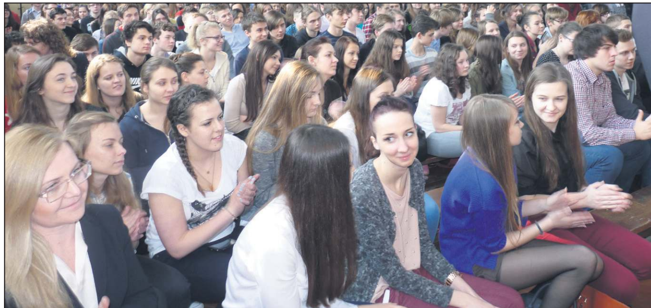
Młodzież „Chopina” z wielką uwagą słuchała opowieści reżysera i chętnie zadawała pytania

Spotkanie w „Chopinie” toczyło się w bardzo nieskrę-