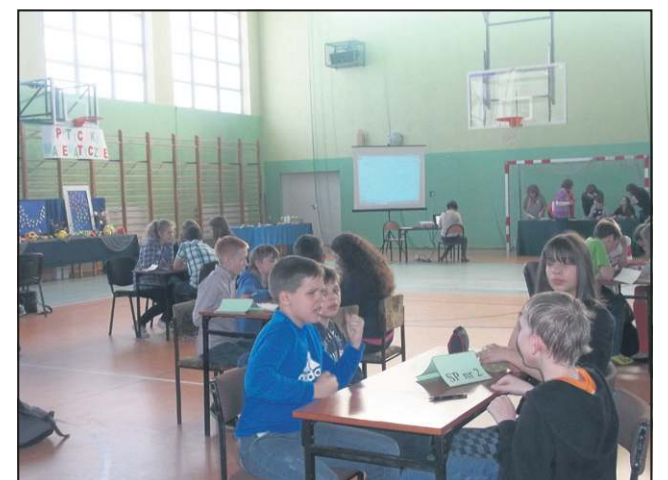
Najlepszymi matematykami okazali się uczniowie SP 2

Zawodników dopingowali koledzy ze szkoły. Na trybunach dało się zauważyć plakaty zagrzewające do walki.