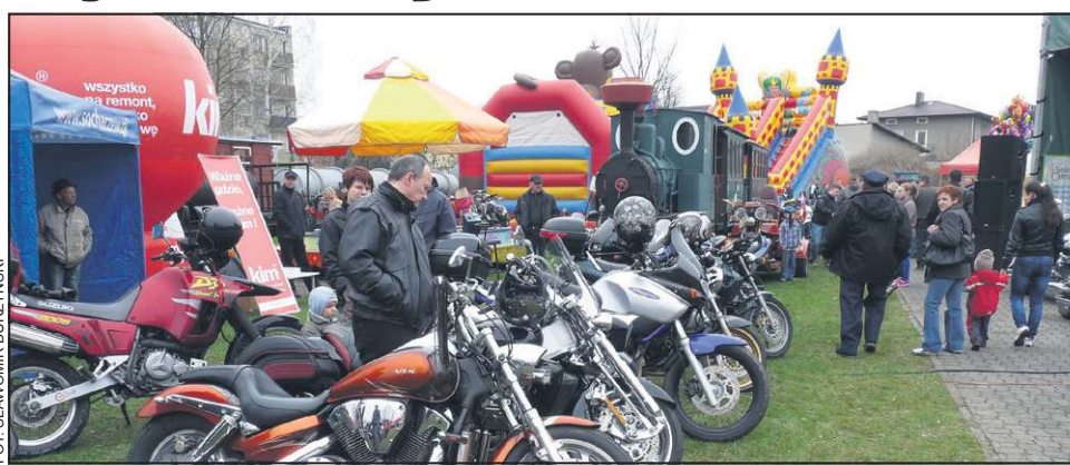
W tym roku Motoserce będzie jeszcze większe niż rok temu

W medycznym miasteczku znajdzie się mammograf oraz możliwość bezpłatnego badania słuchu i wzroku a