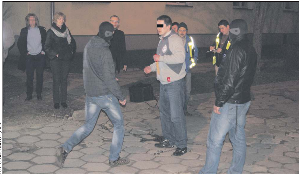
Rekonstrukcja tragicznego momentu ugodzenia nożem