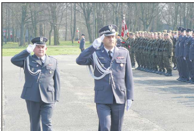
Oficjalna część uroczystości - przegląd pododdziałów

sztabu, a żołnierze w defiladowej kolumnie opuścili plac apelowy... Ale na tym nie koniec.