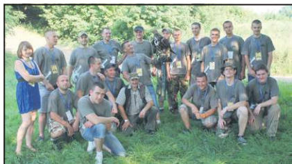
Muzealna Grupa Rekonstrukcji Historycznej im. II batalionu 18 pułku piechoty