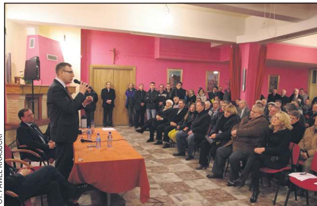
Przyjazd Mariusza Kamińskiego wzbudził duże zainteresowanie mieszkańców Sochaczewa

Na początku spotkania wiceprezes Kamiński przedstawił różnice w podejściu do rządzenia krajem między będącą u władzy PO, a aspirującym PiS. Wymienił też największe bolączki, z jakimi boryka się nasz kraj. Zapewnił, że PiS jako formacja polityczna poradzi sobie z tymi problemami znacznie lepiej. Nie zabrakło odniesień do małych prawicowych partii pokroju Solidarnej Polski i szkód jakie wyrządzają, powodując rozproszenie głosów.