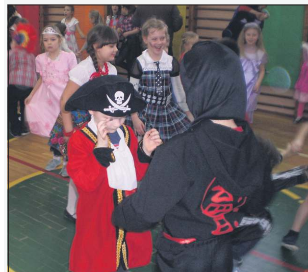
Bal karnawałowy zawsze jest wielkim przeżyciem dla najmłodszych

Promienne uśmiechy i dźwięki muzyki karnawałowej z pewnością umiłą przedszkolakom oczekiwanie na kolejne wiosenne spotkanie w „dwójce”.