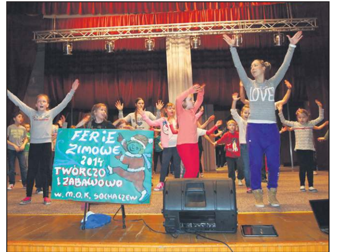
...i w MOK przy ul. Żeromskiego

W boryszewskim MOK dzieci wraz z opiekunami pracowały nad inscenizacją