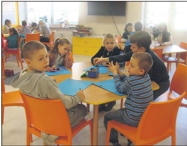
Zajęcia w Miejskiej Bibliotece Publicznej

■ Połowa zimowego wypoczynku już za nami. Codziennie od 17 lutego miejskie placówki, które przygotowały dla dzieciaków moc atrakcji pękały w szwach. Były m.in. gry i zabawy towarzyskie, zajęcia teatralne, plastyczne oraz lodowisko.