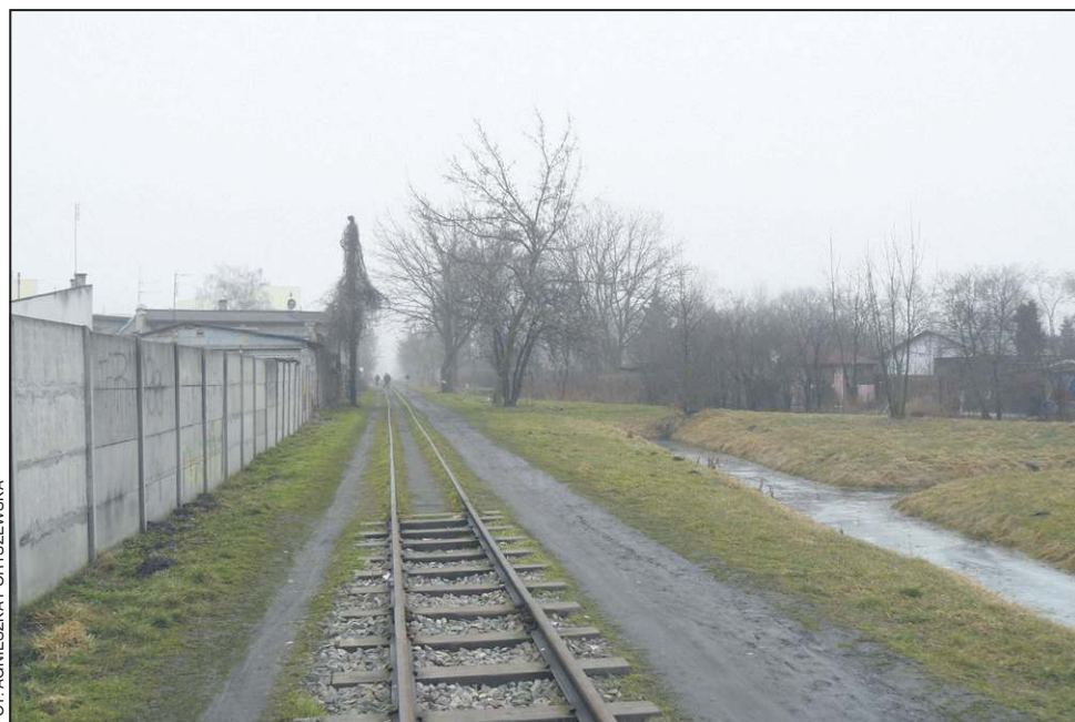
Tędy może przebiegać trasa jednej z planowanych ścieżek rowerowych

Przypomnijmy, że projekt ścieżki pojawił się już m. in. w ramach pierwszej edycji Sochaczewskiego Budżetu