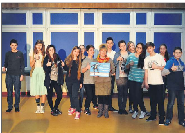
To pierwsza szkoła w Teresinie z takim tytułem

Tytuł stanowi wyróżnienie dla szkół, które w istotny sposób przyczyniają się do odkrywania, wspierania zainteresowań oraz uzdolnień dzieci i młodzieży. Może być przyznany szkołom, w których systematyczną pracę z uczniami uzdolnionymi prowadzi co najmniej trzech nauczycieli i mają konkretne osiągnięcia w tym obszarze działalności pedagogicznej.