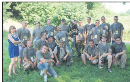
Muzealna Grupa Rekonstrukcji Historycznej im. II batalionu 18 pułku piechoty