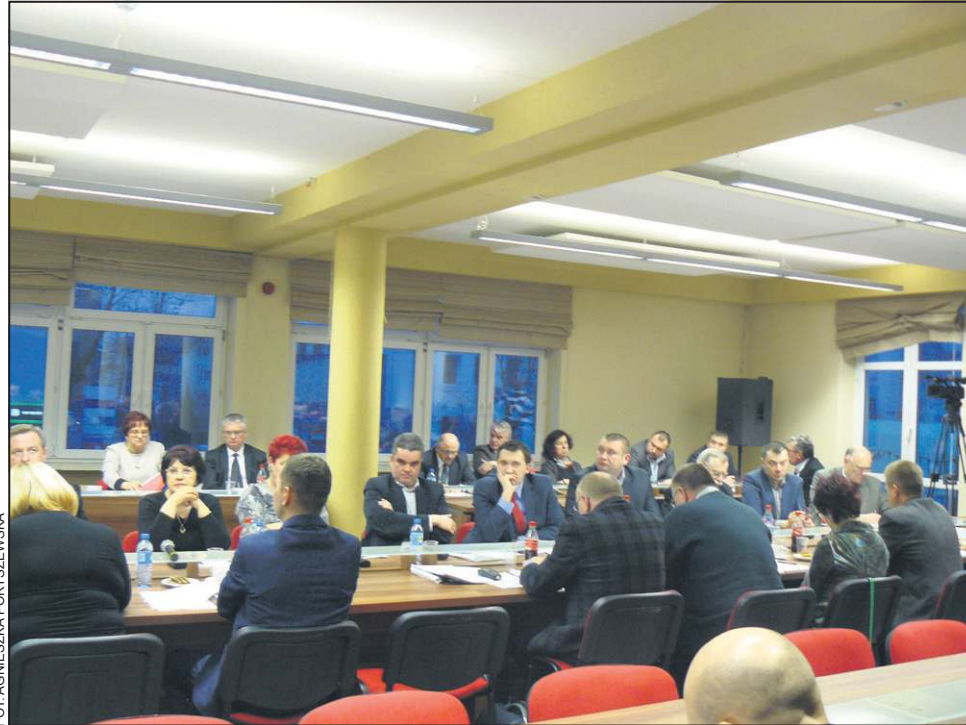
Stawki za wodę i ścieki podzieliły radnych

- Zakład Wodociągów i Kanalizacji zrealizował inwestycję za kilkadziesiąt milionów. Ta inwestycja