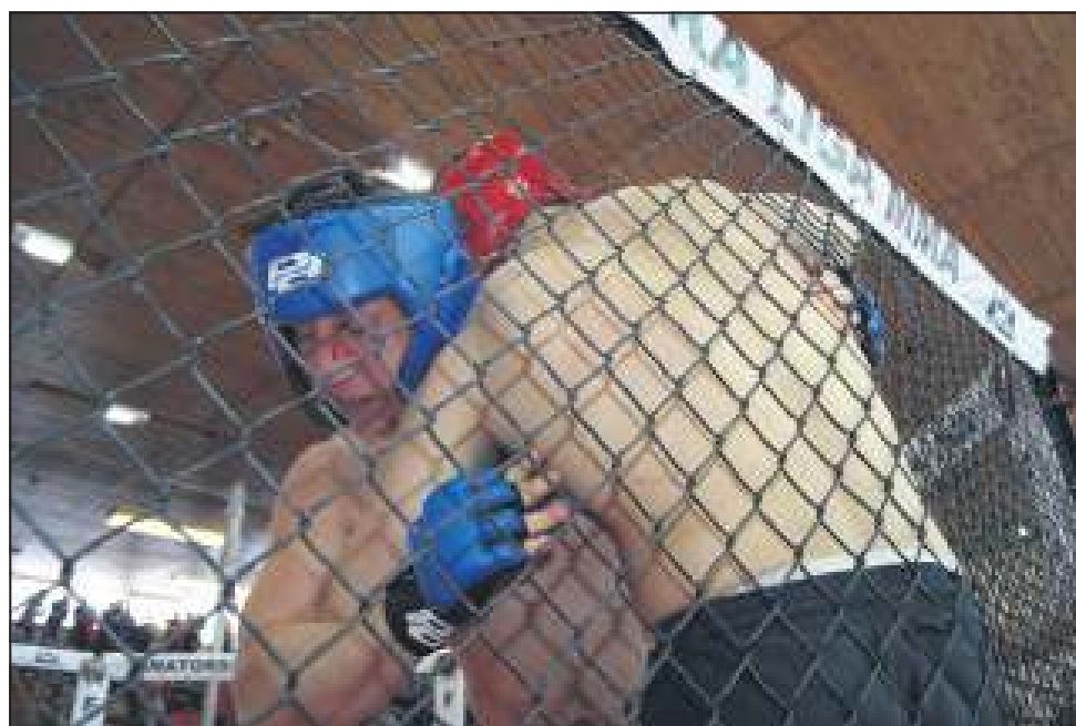
Podczas potyczek MMA nie brakuje pasji i walki

Już w najbliższy weekend sochaczewską halę MO-SiR wypełnią uczestnicy 55 ALMMA, która poświęcona będzie pamięci Żołnierzy Wyklętych. W sobotę (1.03) turniej brazylijskiego Jiu-jitsu, a w niedzielę (2.03) zawody Mixed Martial Art. Walki odbędą się