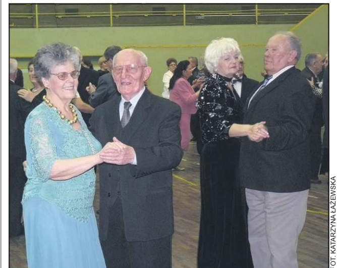
Taniec to jedno z ulubionych zajęć seniorów z „Włókienka”

Stowarzyszenie „Włókienka” obecnie liczy 160 członków, którzy raz w miesiącu spotykają się przy muzyce. Seniorzy podkreślają, iż jest to ulubiona forma ich działalności rozrywkowej. Podczas sobotniej imprezy o oprawę muzyczną zadbał zespół Brevis. (Ka)