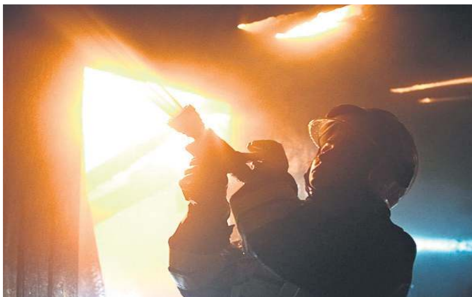
Podczas akcji bywa gorąco

bowiem w sprawy sercowe. Narzeczony, również strażak, mieszka dość daleko. Sochaczew wypadł im w połowie drogi, być może za jakiś czas będą tu razem.