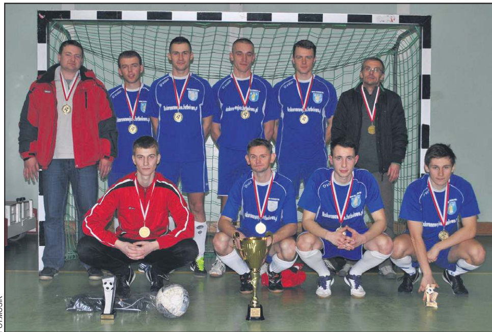
Korona Wejsce po raz trzeci wyjechała z Sochaczewa z Pucharem Wójta

*w nawiasach nazwiska najlepszych piłkarzy poszczególnych drużyn