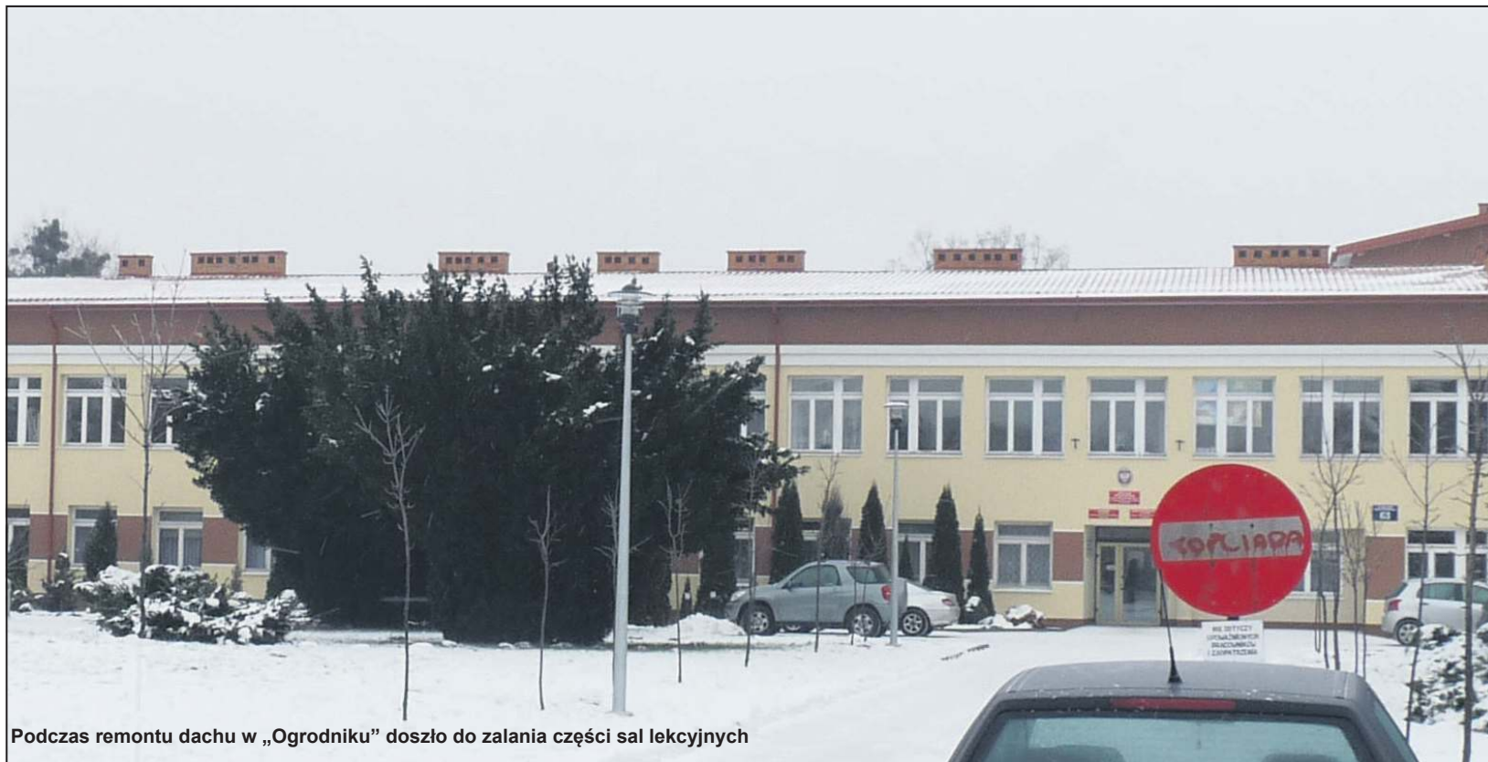
Podczas remontu dachu w „Ogrodniku” doszło do zalania części sal lekcyjnych