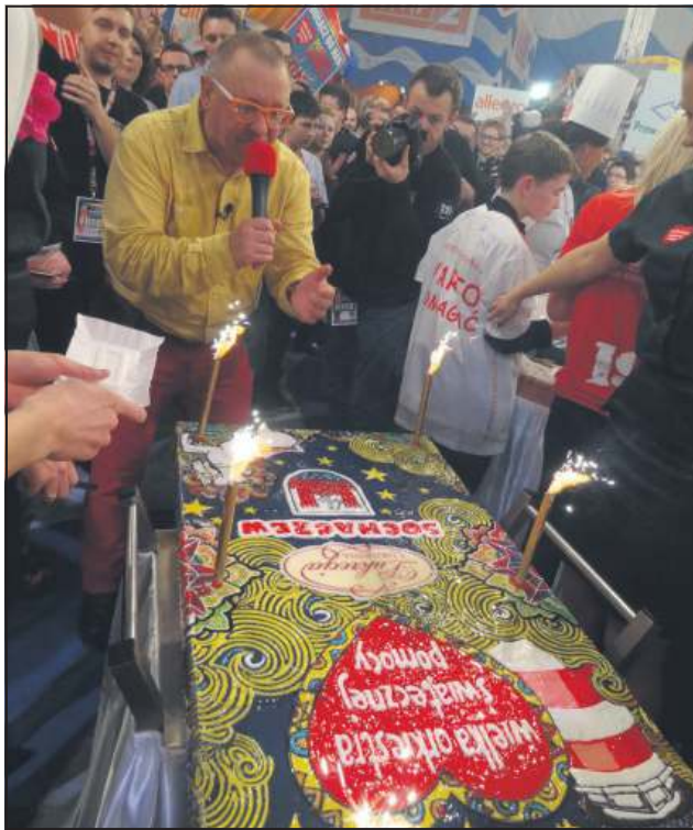
Przygotowany przez cukiernię „Lukrecja” tort robił niesamowite wrażenie

Ten rok to także współpraca z wojskiem, czyli z Garnizonem Sochaczew. W przeddzień finału wolontariusze naszego sztabu pojechali do Bielicy, by wspólnie z żołnierzami kwestować w jednostce i licytować gadżety. Żołnierze z Garnizonu Sochaczew zebrali w sumie podczas całej akcji 2535,98