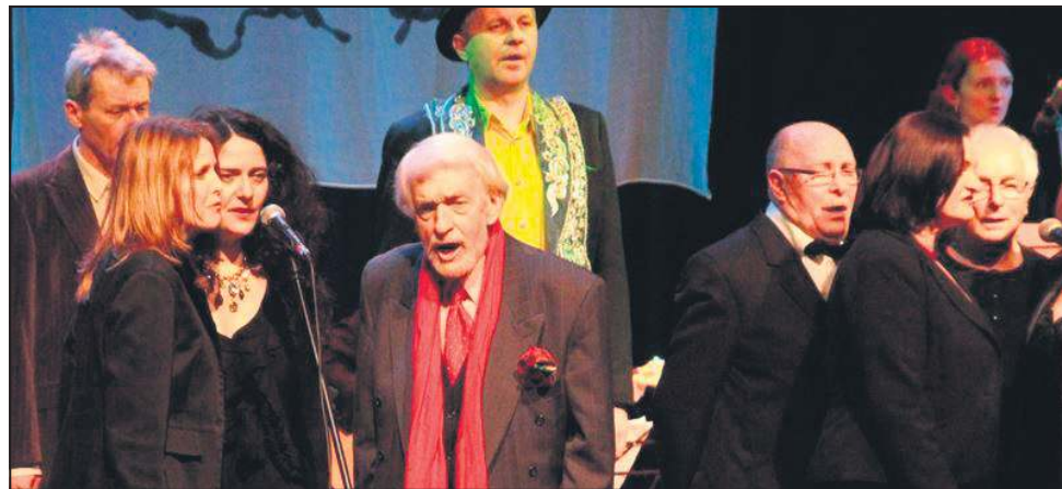
Na scenie MOK wystąpiło kilka pokoleń artystów „Piwnicy pod baranami”