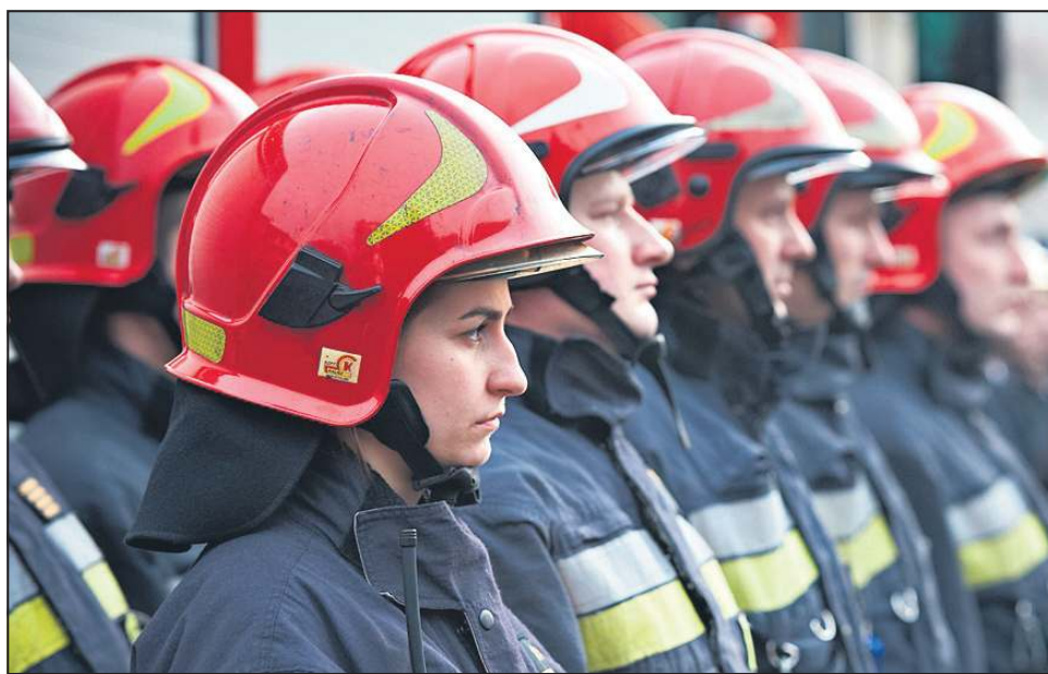
Drużyna strażacka stanowi monolit