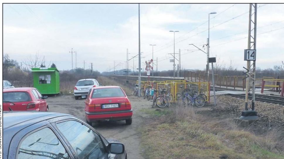
Obok obecnej stacji jest plac, na którym można zaparkować i kasa biletowa

- Jeżeli wydane mają zostać tak duże kwoty i to z wykorzystaniem środków unijnych - mówi wójt Maciej Mońka - to chyba po to, aby warunki poprawić, a nie pogorszyć. Poprawi się na pew-