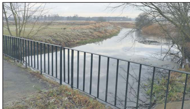
Na tym odcinku rzeki Łasica w przyszłości powstanie zalew

wody ma podnieść się o około metr. Po zakończeniu inwestycji dysponentem gruntów zostanie gmina Brochów. W przyszłości zalew będzie ważną częścią turystycznego charakteru Tułowic. Połączony za pośrednictwem rzeki Łasica, znajdujący się w tej miejscowości ośrodek PTTK planuje bazę sprzętów umożliwiających wodne wycieczki. Nie bez znaczenia dla tempa ukończenia zalewu jest fakt, że Wojewódzki Zarząd Melioracji i Urządzeń Wodnych jest uprawniony do pozyskiwania dotacji unijnych w wysokości 100 proc. kosztu inwestycji. (sss)