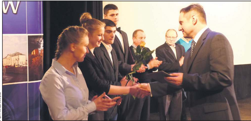
Ubiegłoroczna gala Sportowca Roku

- Nagrody, w zależności od stopnia, to od 200 do 1000 zł, są przyzna-