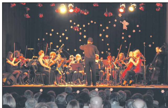
W Nowym Roku Camerata powitała nas rytmemi karnawałowymi

Publiczność, która licznie przybyła tego wieczoru do MOK miała okazję do posłuchania muzyki z najwyższej półki. Kilkunastu muzyków pod dyktando